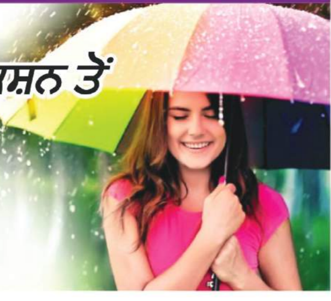
ਬਰਸਾਤ ਨਾਲ ਵਾਤਾਵਰਨ ਦੇ ਤਾਪਮਾਨ 'ਚ ਤਬਦੀਲੀ ਆਉਂਦੀ ਹੈ। ਹਵਾ ਵਿਚ ਨਮੀ ਦੀ ਮਾਤਰਾ ਵਧ ਜਾਂਦੀ ਹੈ। ਨਮੀ ਕਾਰਨ ਚਮੜੀ 'ਤੇ ਇਸ ਦਾ ਸਿੱਧਾ ਅਸਰ ਪੈਂਦਾ ਹੈ। ਇਸ ਸੋਸਮ ਵਿਚ ਚਮੜੀ ਸਬੰਧੀ ਰੋਗ, ਇਨਫੈਕਸ਼ਨ ਅਤੇ ਜਲਣ ਆਦਿ ਦਾ ਖ਼ਤਰਾ 10 ਗੁਣਾ ਵਧ ਜਾਂਦਾ ਹੈ ਇਸ ਦੌਰਾਨ ਹਵਾ ਵਿਚ ਮੌਜੂਦ ਨਮੀ ਸਰੀਰ ਵਿਚ ਤੇਲ ਦੀ ਮਾਤਰਾ ਵਧਾਉਂਦੀ ਹੈ।

ਉਪਾਅ ਸਿਰ ਦੀ ਚਮੜੀ ਵਿਚ ਇਨਫੈਕਸ਼ਨ ਤੋਂ ਬਚਾਅ ਅਤੇ ਇਲਾਜ ਬਾਰੇ ਡਾਕਟਰਾਂ ਦਾ ਕਹਿਣਾ ਹੈ ਕਿ ਸਿਰ ਨੂੰ ਲੰਕਾ ਰੱਖਣਾ ਚਾਹੀਦਾ ਹੈ। ਬਰਸਾਤ ਵਿਚ ਡਿੱਗਣ ਤੋਂ ਬਾਅਦ ਜੇਕਰ ਵਾਲਾਂ ਨੂੰ ਜਲਦੀ ਨਾ ਸੁਕਾਇਆ ਜਾਵੇ ਤਾਂ ਵਾਲਾਂ ਵਿਚ ਨਮੀ ਰਹਿਣ ਕਾਰਨ ਫੰਗਲ ਇਨਫੈਕਸ਼ਨ ਦਾ ਖ਼ਤਰਾ ਬਣ ਸਕਦਾ ਹੈ। ਮਨੁੱਖ ਵਿਚ ਫੰਗਲ ਇਨਫੈਕਸ਼ਨ ਤੋਂ ਬਚਾਅ ਦਾ ਸਭ ਤੋਂ ਵਧੀਆ ਤਰੀਕਾ ਸਫ਼ਾਈ ਹੈ। ਲੋੜ ਪੈਣ 'ਤੇ ਫੰਗਲ ਰੋਕਧ ਵੀ ਐਂਟੀ ਬੈਕਟੀਰੀਅਲ ਪਾਊਡਰ ਦੀ ਵਰਤੋਂ ਵੀ ਫਾਇਦੇਮੰਦ ਰਹਿੰਦੀ ਹੈ।