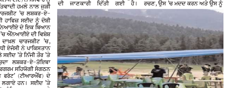
ਐੱਨਆਈਏ ਨੇ 15 ਦਸੰਬਰ 2025 ਨੂੰ ਦਾਖਲ ਆਪਣੀ ਚਾਰਜਸ਼ੀਟ 'ਚ ਪਾਕਿਸਤਾਨੀ ਹੈੱਡਲਰ ਸਾਜਿਸ਼ ਜੱਟ ਨੂੰ ਦੋਸ਼ੀ ਬਣਾਇਆ ਸੀ, ਨਾਲ ਹੀ ਜੁਲਾਈ 2025 'ਚ 'ਆਪਰੇਸ਼ਨ ਮਹਾਦੱਦ' ਦੌਰਾਨ ਸੁਰੱਖਿਆ ਫੋਰਸਾਂ ਵੱਲੋਂ ਮਾਰੇ ਗਏ ਦੋਸ਼ ਅੱਤਵਾਦੀਆਂ ਅਤੇ ਗ੍ਰਿਫਤਾਰ ਕੀਤੇ ਗਏ ਦੋਸ਼ੀਆਂ ਨੂੰ ਵੀ ਇਸ 'ਚ ਸ਼ਾਮਲ ਕੀਤਾ

ਸੀ। ਉਸ ਨੇ ਪਾਬੰਦੀਬੰਦ ਅੱਤਵਾਦੀ ਸੰਗਠਨ ਲਸਕਰ/ਟੀਆਰਐੱਫ 'ਤੇ ਵੀ ਪਹਿਲਗਾਮ ਅੱਤਵਾਦੀ ਹਮਲੇ ਦੀ ਸਾਜਿਸ਼ ਰਚਣ, ਉਸ 'ਚ ਮਦਦ ਕਰਨ ਅਤੇ ਉਸ ਨੂੰ