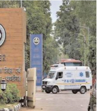
ਪੇਂਟ ਮੈਨੇਜਮੈਂਟ ਵਰਗੀਆਂ ਸੇਵਾਵਾਂ ਦਾ ਵੀ ਵਿਸਥਾਰ ਕਰ ਰਿਹਾ ਹੈ। ਸੋਸ਼ਲ 'ਹਥ ਐਂਡ ਸਪੋਕ' ਮਾਡਲ 'ਤੇ ਕੰਮ ਕਰ ਰਹੀ ਹੈ। ਇਸ ਤਹਿਤ ਪ੍ਰਾਇਮਰੀ ਹੈਲਥ ਸੈਂਟਰ ਤੇ ਕਮਿਊਨਿਟੀ ਹੈਲਥ ਸੈਂਟਰ ਮਰੀਜ਼ਾਂ ਲਈ ਪਹਿਲਾ ਸੰਪਰਕ ਕੇਂਦਰ

ਨਿਊਰੋਲੋਜੀ, ਟੈਲੀ ਆਈ. ਸੀ. ਯੂ. ਅਤੇ ਹੋਰ ਈ-ਹੈਲਥ ਸੇਵਾਵਾਂ ਦੀ ਵਿਸਥਾਰ ਕੀਤਾ ਜਾਵੇਗਾ। ਇਸ ਨਾਲ ਦੂਰ-ਦੁਰਾਸ਼ 'ਚ ਮਰੀਜ਼ਾਂ ਨੂੰ ਆਪਣੇ ਇਲਾਕੇ 'ਚ ਹੀ ਮਾਰਗ ਦੀ ਸਲਾਹ ਮਿਲ ਸਕੇਗੀ।