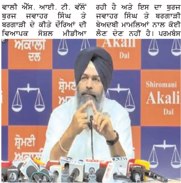
ਕਵਰੇਜ ਕਰਵਾ ਕੇ ਮਿੱਥੇ ਕੇ ਪੁਚਾਰ ਮੁਹਿੰਮ ਚਲਾਈ ਹੈ। ਉਨ੍ਹਾਂ ਕਿਹਾ ਕਿ ਅਜਿਹਾ ਉਦੋਂ ਕੀਤਾ ਜਾ ਰਿਹਾ ਹੈ ਜਦੋਂ ਇਹ ਸੱਚਾਈ ਹੈ ਕਿ ਇਹ ਐੱਸ. ਆਈ. ਟੀ. ਬਹਿਬਲ ਕਲਾਂ ਕੇਸ ਦੀ ਜਾਂਚ ਕਰ