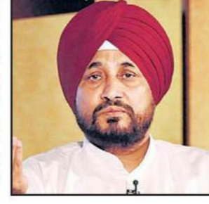
ਚੰਨੀ ਦੇ ਸ਼ਕਤੀ ਪ੍