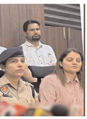
ਆਰ. ਪੁਕਿਰਿਆ ਦੌਰਾਨ ਕੋਈ ਸ਼ਿਕਾਇਤ ਦਰਜ ਕਰਵਾਉਣੀ ਹੋਵੇ ਤਾਂ ਉਹ ਜ਼ਿਲ੍ਹਾ ਪੱਧਰ 'ਤੇ ਸਥਾਪਤ ਸ਼ਿਕਾਇਤ ਨਿਵਾਰਨ ਸੈੱਲ ਵਿੱਚ ਆਪਣੀ ਸ਼ਿਕਾਇਤ ਭੇਜ ਸਕਦਾ ਹੈ। ਇਸ ਤੋਂ ਇਲਾਵਾ ਹਰੇਕ ਵਿਧਾਨ ਸਭਾ ਹਲਕੇ ਲਈ ਵੀ ਵੱਖ-ਵੱਖ

ਲੋੜ ਹੋਵੇ ਤਾਂ ਉਹ ਹੈਲਪਲਾਈਨ ਨੰਬਰ 1950 'ਤੇ ਸੰਪਰਕ ਕਰ ਸਕਦਾ ਹੈ। ਉਨ੍ਹਾਂ ਦੱਸਿਆ ਕਿ ਜੇਕਰ ਕਿਸੇ ਨਾਗਰਿਕ ਨੂੰ ਐੱਸ. ਆਈ. ਸ਼ਿਕਾਇਤ ਨਿਵਾਰਨ ਸੈੱਲ ਬਣਾਏ ਗਏ ਹਨ, ਜਿੱਥੇ ਸਬੋਤ ਹਲਕੇ ਦੇ ਵੇਟਰ ਆਪਣੀ ਸ਼ਿਕਾਇਤ ਦਰਜ ਕਰਵਾ ਸਕਦੇ ਹਨ। ਵਰਜੀਤ