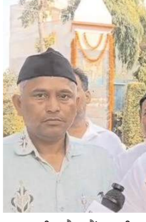
ਵਨ ਟਾਈਮ ਸੈਟਲਮੈਂਟ ਸਕੀਮ (ਓਟੀਐਸ) ਲਿਆਉਣ ਦੀ ਤਿਆਰੀ ਕੀਤੀ ਜਾ ਰਹੀ ਹੈ। ਪਾਵਰਕਾਮ ਨੇ ਪੰਜਾਬ ਸਟੇਟ ਬਿਜਲੀ ਰੇਗੂਲੇਟਰੀ ਕਮਿਸ਼ਨ ਸਾਹਮਣੇ ਪਟੀਸ਼ਨ ਦਰਜ

ਹਾਲਾਂਕਿ ਇਸਦਾ ਸਮਾਂ 2 ਗੁਣਾ ਕਰਨ ਦਾ ਵੀ ਬਦਲ ਰੱਖਿਆ ਗਿਆ ਹੈ। ਇਸ ਸਕੀਮ ਦੇ ਘੇਰੇ 'ਚ ਉਹ ਸਾਰੇ ਖਪਤਕਾਰ ਸ਼ਾਮਲ ਹਨ ਜਿਨ੍ਹਾਂ ਦਾ 31 ਮਾਰਚ 2025 ਤੱਕ ਬਿਜਲੀ ਦਾ ਬਿਲ ਬਕਾਇਆ ਸੀ ਅਤੇ ਉਹ ਹੁਣ ਵੀ ਡਿਫਾਲਟਰ ਚੱਲ ਰਹੇ ਹਨ। ਇਸ ਦੇ ਤਹਿਤ 18 ਦੀ ਬਜਾਏ 6 ਵੀਸਦੀ ਵਿਆਜ ਸੰਭਵ ਹੈ। ਇਸ 'ਚ 6 ਮਹੀਨੇ ਦਾ ਸਰਕਾਰੀ ਮੁਆਫ਼ ਕੀਤਾ ਜਾ ਸਕਦਾ ਹੈ। ਇਥੇ ਇਹ ਖਾਸ ਤੌਰ 'ਤੇ ਦੱਸਣਯੋਗ ਹੈ ਕਿ ਬਿਜਲੀ ਵਿਭਾਗ ਡਿਫਾਲਟਰਾਂ ਤੋਂ 4155 ਕਰੋੜ ਰੁਪਏ ਦਾ ਲੈਣਦਾਰ ਹੈ ਪ੍ਰਸਤਾਵਿਤ ਓਟੀਐਸ ਸਕੀਮ ਉਨ੍ਹਾਂ ਸਾਰੇ ਡਿਫਾਲਟਰਾਂ ਲਈ ਹੈ, ਜਿਨ੍ਹਾਂ ਦਾ ਬਿਜਲੀ ਬਿੱਲ ਜਾਂ ਬਕਾਇਆ ਪੁਰਾਣੇ ਪਿਛਲੇ ਲੰਮੇ ਤੋਂ ਪੱਛਿੰਨ ਹੈ। ਇਸ 'ਚ ਘਰੇਲੂ, ਵਪਾਰਕ, ਛੋਟੇ, ਮੱਧਵਰਗੀ ਅਤੇ ਵੱਡੇ ਉਦਯੋਗਾਂ ਦੇ ਨਾਲ-ਨਾਲ ਸਰਕਾਰੀ ਵਿਭਾਗ ਵੀ ਸ਼ਾਮਲ ਹਨ। ਹਾਲਾਂਕਿ ਖੇਤੀਬਾੜੀ ਖਪਤਕਾਰਾਂ ਨੂੰ ਇਸ ਸਕੀਮ 'ਚੋਂ ਬਾਹਰ ਰੱਖਿਆ ਗਿਆ ਹੈ। ਇਹ ਵੀ ਪਤਾ ਲੱਗਾ ਹੈ ਕਿ ਪ੍ਰਸਤਾਵ ਅਨੁਸਾਰ ਚਾਲੂ ਅਤੇ ਡਿਫਾਲਟਰ ਦੋਵਾਂ ਤਰ੍ਹਾਂ ਦੇ ਬਿਜਲੀ ਕਨੈਕਸ਼ਨ ਸਕੀਮ ਦੇ ਘੇਰੇ 'ਚ ਹੋਣਗੇ। ਪਾਵਰਕਾਮ ਦੇ ਨਾਲ ਅਦਾਲਤੀ ਜਾਂ ਕਾਨੂੰਨੀ ਵਿਵਾਦ 'ਚ ਫਸੇ ਖਪਤਕਾਰ ਵੀ ਇਸ ਦਾ ਲਾਭ ਨਹੀਂ ਸਕਣਗੇ।