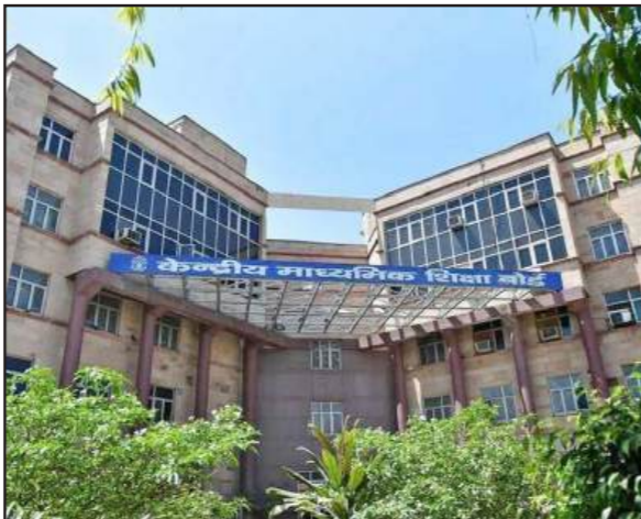
ਵਿਦਿਆਰਥੀ ਵੀ ਤਿੰਨ ਭਾਸ਼ਾਵਾਂ ਦੀ ਪੜ੍ਹਾਈ ਜਾਰੀ ਰੱਖਣਗੇ, ਜਿਨ੍ਹਾਂ ਵਿੱਚੋਂ ਦੋ ਭਾਸ਼ਾਵਾਂ ਹੋਣੀਆਂ ਲਾਜ਼ਮੀ ਹਨ। ਜੇਕਰ ਦੋ ਭਾਸ਼ਾਵਾਂ ਵਜੋਂ ਅੰਗਰੇਜ਼ੀ ਜਾਂ ਫਰੇਂਚ ਵਰਗੀ ਗੈਰ-ਭਾਰਤੀ ਭਾਸ਼ਾ ਵੀ ਚੁਣੀ ਜਾ ਸਕਦੀ ਹੈ।

ਚੰਡੀਗੜ੍ਹ, 2 ਜੁਲਾਈ - ਕੌਮੀ ਪੱਤ੍ਰਿਕਾ ਬਿਊਰੋ- ਸੈਂਟਰਲ ਬੋਰਡ ਆਫ ਸੈਕੰਡਰੀ ਐਜੂਕੇਸ਼ਨ (ਸੀ ਬੀ ਐੱਸ ਈ) ਨੇ ਅੱਜ ਭਾਸ਼ਾ ਨੀਤੀ ਨੂੰ ਲੈ ਕੇ ਵਿਦਿਆਰਥੀਆਂ ਨੂੰ ਰਾਹਤ ਦਿੱਤੀ ਹੈ। ਬੋਰਡ ਨੇ ਸਪਸ਼ਟ ਕੀਤਾ ਹੈ ਕਿ ਸਾਲ 2026-27 ਦੌਰਾਨ ਦਸਵੀਂ ਜਮਾਤ ਵਿੱਚ ਪੜ੍ਹ ਰਹੇ ਵਿਦਿਆਰਥੀਆਂ 'ਤੇ ਨਵੀਂ ਤਿੰਨ-ਭਾਸ਼ਾ ਨੀਤੀ ਲਾਗੂ ਨਹੀਂ ਹੋਵੇਗੀ। ਇਹ ਵਿਦਿਆਰਥੀ ਪਹਿਲਾਂ ਵਾਂਗ ਸਿਰਫ ਦੋ ਭਾਸ਼ਾਵਾਂ ਨਾਲ ਹੀ ਆਪਣੀ ਬੋਰਡ ਪ੍ਰੀਖਿਆ ਦੇਣਗੇ ਅਤੇ ਉਨ੍ਹਾਂ ਲਈ ਤੀਜੀ ਭਾਸ਼ਾ ਲਾਜ਼ਮੀ ਨਹੀਂ ਹੋਵੇਗੀ। ਸੀਬੀਐੱਸਈ ਨੇ ਇਹ ਵੀ ਐਲਾਨ ਕੀਤਾ ਹੈ ਕਿ ਮੌਜੂਦਾ ਸਮੇਂ ਸੱਤਵੀਂ, ਅੱਠਵੀਂ ਅਤੇ ਨੌਵੀਂ ਜਮਾਤ ਵਿੱਚ ਪੜ੍ਹ ਰਹੇ ਵਿਦਿਆਰਥੀਆਂ ਨੂੰ ਵੀ ਇਹ ਵਾਰ ਦੀ ਵਿਸ਼ੇਸ਼ ਛੋਟ ਦਿੱਤੀ ਜਾ ਰਹੀ ਹੈ। ਜਦੋਂ ਇਹ ਵਿਦਿਆਰਥੀ ਦਸਵੀਂ ਵਿੱਚ ਪਹੁੰਚਣਗੇ ਤਾਂ ਤੀਜੀ ਭਾਸ਼ਾ ਦੀ