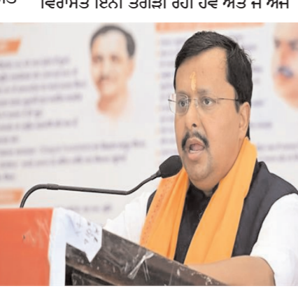
ਉਹ ਨਹੀਂ ਰਹੀ ਤਾਂ ਇਹ ਚਿੰਤਾ ਦਾ ਮੁੱਦਾ ਹੈ, ਇਸ ਦੀ ਜਵਾਬਦੇਹੀ ਕੇਂਦਰ ਸਰਕਾਰ ਅਤੇ ਭਾਜਪਾ ਕਰੇਗੀ। ਉਨ੍ਹਾਂ ਕਿਹਾ ਕਿ ਅਸੀਂ ਲਗਾਤਾਰ ਸੇਵਾਦਾਰ ਕਰ ਰਹੇ ਹਾਂ, ਇਸ ਨਾਲ ਹੀ ਚੀਜ਼ਾਂ ਅੱਗੇ ਵਧਦੀਆਂ ਹਨ, ਜੇਕਰ ਕੋਈ

ਲੁਧਿਆਣਾ 24 ਜੂਨ। ਪੰਜਾਬ ਦੇ ਸਨਅਤ ਅਤੇ ਕਾਰੋਬਾਰੀ ਗੌਰਵ ਨੂੰ ਮੁੜ ਬਹਾਲ ਕਰਨਾ ਭਾਜਪਾ ਦਾ ਸਕੱਲਪ ਹੈ ਅਤੇ ਇਹ ਹਰ ਹਿੱਲੇ ਕੀਤਾ ਜਾਵੇਗਾ। ਪੰਜਾਬ ਵਿੱਚ ਉਦਯੋਗਿਕ ਵਿਕਾਸ ਅਤੇ ਨਿਵੇਸ਼ ਲਈ ਸਾਜ਼ਗਾਰ ਮਾਹੌਲ ਬਣੇਗਾ ਅਤੇ ਕਿਸਾਨੀ ਵੀ ਇਸ ਦੇ ਨਾਲ-ਨਾਲ ਸਮਾਂਤਰ ਚੱਲੇਗੀ। ਇਨ੍ਹਾਂ ਸ਼ਬਦਾਂ ਦਾ ਪ੍ਰਗਟਾਵਾ ਭਾਰਤੀ ਜਨਤਾ ਪਾਰਟੀ ਦੇ ਕੌਮੀ ਪ੍ਰਧਾਨ ਨਿਤਿਨ ਨਬੀਨ ਨੇ ਕੀਤਾ। ਆਪਣੇ ਪੰਜਾਬ ਚੌਰੇ ਚੇਰਾਨ ਉਹ ਲੁਧਿਆਣਾ ਵਿੱਚ ਪੰਜਾਬ ਦੇ ਸਨਅਤਕਾਰਾਂ ਦੀਆਂ ਸਮੀਖਿਆਵਾਂ ਸੁਣ ਰਹੇ ਸਨ। ਉਨ੍ਹਾਂ ਕਿਹਾ ਕਿ ਉਦਯੋਗ ਦੇ ਹਰ ਵਰਗ ਦੀਆਂ ਸਮੀਖਿਆਵਾਂ ਵੱਖ-ਵੱਖ ਹੁੰਦੀਆਂ ਹਨ, ਪਰ ਇਨ੍ਹਾਂ ਦੇ ਹੱਲ ਲਈ ਸਰਕਾਰ ਦੀ ਨੀਤੀ, ਨੀਅਤ ਅਤੇ ਨਿਰਣਾਇਕ ਅਗਵਾਈ ਦਾ ਅਹਿਮ ਰੋਲ ਹੁੰਦਾ ਹੈ। ਭਾਜਪਾ ਇਸ ਬਾਰੇ ਸਪੱਸ਼ਟ ਹੈ। ਪੰਜਾਬ ਦੇ ਉਦਯੋਗਿਕ ਮਸਾਲਿਆਂ ਵਿੱਚ ਕੇਂਦਰ ਸਰਕਾਰ ਦਾ ਪੰਜਾਬ ਸਰਕਾਰ ਬਣਦਾ ਸਹਿਯੋਗ ਨਹੀਂ ਕਰ