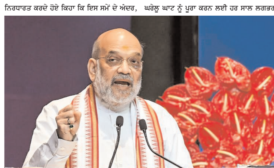
ਨਿਰਧਾਰਤ ਕਰਦੇ ਹੋਏ ਕਿਹਾ ਕਿ ਇਸ ਸਮੇਂ ਦੇ ਅੰਦਰ, ਘਰੇਲੂ ਘਾਟ ਨੂੰ ਪੂਰਾ ਕਰਨ ਲਈ ਹਰ ਸਾਲ ਲਗਭਗ 60-70 ਲੱਖ ਟਨ ਦਾਲਾਂ ਅਤੇ 15-16 ਮਿਲੀਅਨ ਟਨ ਖਾਣ ਵਾਲੇ ਤੇਲ ਦਾ ਆਯਾਤ ਕਰਦਾ ਹੈ। ਸ਼ਾਹ ਨੇ NAFED ਦੀ ਵਿੱਤੀ ਸਥਿਤੀ 'ਚ ਸੁਧਾਰ ਦੀ ਪ੍ਰਸ਼ੰਸਾ

ਨਵੀਂ ਦਿੱਲੀ 24 ਜੂਨ। ਕੇਂਦਰੀ ਸਹਿਕਾਰਤਾ ਮੰਤਰੀ ਅਮਿਤ ਸ਼ਾਹ ਨੇ ਮੰਗਲਵਾਰ ਨੂੰ ਰਾਸ਼ਟਰੀ ਖੇਤੀਬਾੜੀ ਸਹਿਕਾਰੀ ਮਾਰਕੀਟਿੰਗ ਫੈਡਰੇਸ਼ਨ ਅਤੇ ਰਾਸ਼ਟਰੀ ਸਹਿਕਾਰੀ ਖਪਤਕਾਰ ਫੈਡਰੇਸ਼ਨ ਨੂੰ ਕਿਸਾਨਾਂ ਤੋਂ ਸਿੱਧੇ ਦਾਲਾਂ ਅਤੇ ਤੇਲ ਬੀਜ ਖਰੀਦਣ ਦੇ ਨਿਰਦੇਸ਼ ਦਿੱਤੇ, ਤਾਂ ਕਿ ਵਿਚੋਲਿਆਂ ਦੀ ਭੂਮਿਕਾ ਖਤਮ ਹੋਵੇ ਅਤੇ ਦੇਸ਼ ਦੀ ਇਨ੍ਹਾਂ ਵਸਤੂਆਂ ਦੇ ਆਯਾਤ 'ਤੇ ਨਿਰਭਰਤਾ ਘਟਾਈ ਜਾ ਸਕੇ। ©1654 ਦੀ ਚਾਰ ਪਹਿਲ ਦੀ ਸ਼ੁਰੂਆਤ ਮੌਕੇ ਆਯੋਜਿਤ ਇਕ ਸਮਾਗਮ 'ਚ ਸ਼ਾਹ ਨੇ ਕਿਹਾ ਕਿ ਹਾਲ ਹੀ ਦੇ ਸਾਲਾਂ 'ਚ ਦਾਲਾਂ ਅਤੇ ਤੇਲ ਬੀਜਾਂ ਦੀ ਉਤਪਾਦਨ ਵਧਿਆ ਹੈ, ਪਰ ਘੱਟ-ਘੱਟ ਸਮਰਥਨ ਮੁੱਲ ਦੇ ਲਾਭਾਂ ਤੱਕ ਪੂਰੀ ਪਹੁੰਚ ਨਾ ਹੋਣ ਕਾਰਨ ਆਤਮਨਿਰਭਰਤਾ ਹਾਸਲ ਨਹੀਂ ਹੋ ਸਕੀ ਹੈ। ਉਨ੍ਹਾਂ ਕਿਹਾ, ਖਰੀਦ 'ਚ ਵਿਚੋਲਿਆਂ ਦੀ ਭੂਮਿਕਾ ਨੂੰ ਖਤਮ ਕਰਨ ਦੀ ਲੋੜ ਹੈ। ਹੁਣ ਸਮਾਂ ਆ ਗਿਆ ਹੈ ਕਿ ©1654 ਅਤੇ ©336 ਕਿਸਾਨਾਂ ਤੋਂ ਸਿੱਧੇ ਦਾਲਾਂ ਅਤੇ ਤੇਲ ਬੀਜ ਖਰੀਦਣ, ਤਾਂ ਜੋ ਲਾਭ ਸਿੱਧੇ ਕਿਸਾਨਾਂ ਤੱਕ ਪਹੁੰਚਾਏ ਜਾ ਸਕਣ। ਸ਼ਾਹ ਨੇ ਇਸ ਟੀਚੇ ਨੂੰ ਪ੍ਰਾਪਤ ਕਰਨ ਲਈ 2 ਸਾਲਾਂ ਦੀ ਸਮਾਂ ਸੀਮਾ