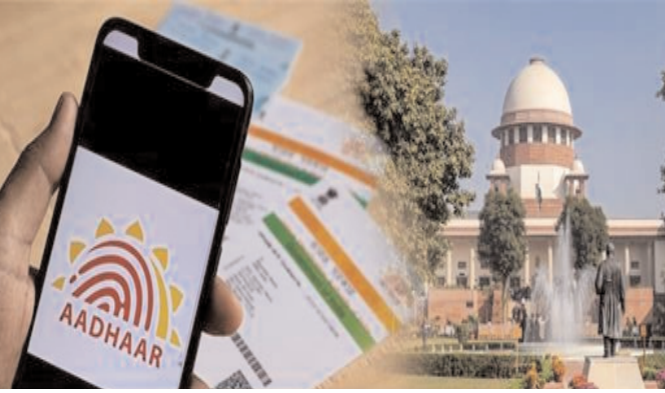
ਧਾਰਾ 14 ਦੀ ਉਲੰਘਣਾ ਮੰਨਿਆ ਜਾਵੇ। ਆਧਾਰ ਐਕਟ 2016 ਦੀ ਧਾਰਾ 9 ‘ਚ ਸਾਡਾ ਤੌਰ ‘ਤੇ ਕਿਹਾ ਗਿਆ ਹੈ ਕਿ ‘ਆਧਾਰ ਨਾਗਰਿਕਤਾ ਜਾਂ ਮੂਲ ਨਿਵਾਸ ਦਾ ਸਬੂਤ ਨਹੀਂ ਹੈ। ਯੂਆਈਡੀਏਆਈ ਦੇ 22 ਅਗਸਤ 2023 ਦੀ ਨੋਟੀਫਿਕੇਸ਼ਨ ‘ਚ ਸਾਡਾ ਕਿਹਾ ਗਿਆ ਹੈ ਕਿ ‘ਆਧਾਰ ਪਛਾਣ ਦਾ ਸਬੂਤ ਹੈ, ਨਾ ਕਿ ਨਾਗਰਿਕਤਾ, ਪਤੇ ਜਾਂ ਜਨਮ

‘ਚ ਜਨਮ ਤਰੀਕੇ ਅਤੇ ਨਿਵਾਸ ਦੇ ਸਬੂਤ ਵਜੋਂ ਆਧਾਰ ਦੇ ਇਸਤੇਮਾਲ ਨੂੰ ਆਧਾਰ ਐਕਟ, 2016 ਦੀ ਧਾਰਾ 9, ਆਰਪੀਏ, 1950 ਦੀ ਧਾਰਾ 23 (4) ਦੇ ਸੰਵਿਧਾਨ ਦੀ