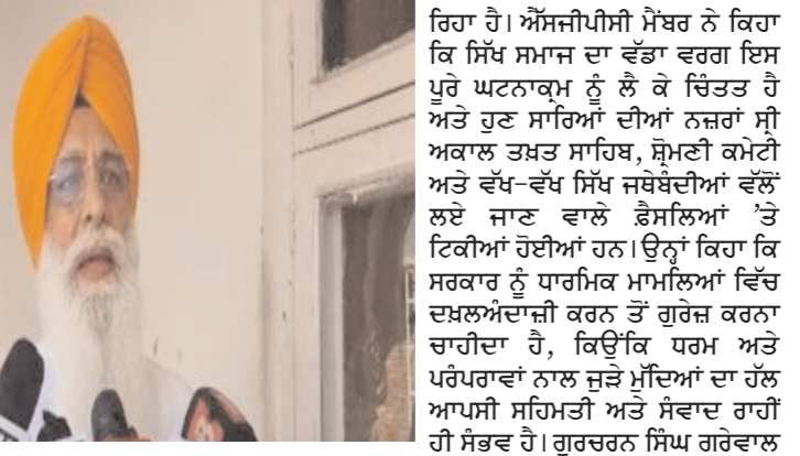
ਮਾਮਲਿਆਂ ਵਿੱਚ ਦੇਰੀ ਅਤੇ ਅਸਪਸ਼ਟਤਾ ਕਾਰਨ ਸਿੱਖ ਭਾਈਚਾਰੇ ਵਿੱਚ ਰੋਸ ਵਧ ਰਿਹਾ ਹੈ। ਉਨ੍ਹਾਂ ਕਿਹਾ ਕਿ ਬੇਅਦਬੀ ਸ਼ਬਦ ਦੀ ਵਰਤੋਂ ਵੀ ਬਹੁਤ ਸੌਚ-ਸਮਝ ਕੇ ਕੀਤੀ ਜਾਣੀ ਚਾਹੀਦੀ ਹੈ, ਕਿਉਂਕਿ ਹਰ ਘਟਨਾ ਨੂੰ ਬੇਅਦਬੀ ਨਹੀਂ ਕਿਹਾ ਜਾ ਸਕਦਾ। ਕਈ ਘਟਨਾਵਾਂ ਅਚਾਨਕ ਜਾਂ ਹਦਾਸੇ ਵਜੋਂ ਵੀ ਵਾਪਰ ਸਕਦੀਆਂ ਹਨ, ਇਸ ਲਈ ਤੱਥਾਂ ਦੀ ਜਾਂਚ ਤੋਂ ਬਾਅਦ ਹੀ ਕਿਸੇ ਨੇ ਬੰਦੀ ਸਿੱਖਾਂ ਦੀ ਗਿਰਾਫ਼ੀ ਦਾ ਮੁੱਦਾ ਵੀ ਉਠਾਇਆ ਅਤੇ ਕਿਹਾ ਕਿ ਉਨ੍ਹਾਂ ਦੀ ਗਿਰਾਫ਼ੀ ਲਈ ਹਰ ਮੌਕੇ ‘ਤੇ ਅਰਦਾਸ ਅਤੇ ਸੰਘਰਸ਼ ਜਾਰੀ ਹੈ। ਉਨ੍ਹਾਂ ਉਮੀਦ ਜਤਾਈ ਕਿ ਸਰਕਾਰ ਜਲਦ ਹੀ ਕੋਈ ਸਕਾਰਾਤਮਕ ਕਦਮ ਚੁੱਕੇਗੀ, ਜਿਸ ਨਾਲ ਸਿੱਖ ਭਾਈਚਾਰੇ ਦੀਆਂ ਸ਼ੱਕਾਂ ਦੂਰ ਹੋਣਗੀਆਂ ਅਤੇ ਸਮਾਜ ਵਿੱਚ ਸ਼ਾਂਤੀ ਅਤੇ ਭਰੋਸੇ ਦਾ ਮਾਰੋੜ ਬਣੇਗਾ।

ਜੁੜੀਆਂ ਹੋਈਆਂ ਹਨ ਅਤੇ ਅਜਿਹੇ ਮਾਮਲਿਆਂ ਵਿੱਚ ਜਲਦ ਅਤੇ ਨਿਰਪੱਖ ਕਾਰਵਾਈ ਹੋਣੀ ਚਾਹੀਦੀ ਹੈ। ਉਨ੍ਹਾਂ ਦੋਸ਼ ਲਗਾਇਆ ਕਿ ਕਈ ਨਤੀਜੇ ‘ਤੇ ਪਹੁੰਚਣਾ ਚਾਹੀਦਾ ਹੈ। ਉਨ੍ਹਾਂ ਕਿਹਾ ਕਿ ਸ਼੍ਰੋਮਣੀ ਗੁਰਦੁਆਰਾ ਪ੍ਰਬੰਧਕ ਕਮੇਟੀ ਨੂੰ ਸਰਕਾਰ ਦੇ ਹਰ ਵੇਰ ਨਾਲ ਸੰਗਤ ਦੇ ਮਨ ਵਿੱਚ ਕੰਬਲਭੂਸ਼ਾ ਪੈਦਾ ਕੀਤਾ ਜਾ ਰਿਹਾ ਹੈ, ਜਿਸ