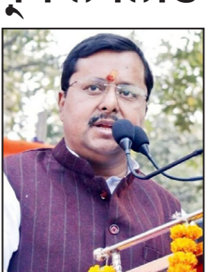
ਨਿਤਿਨ ਨਬੀਨ ਦੇ ਆਉਣ ਤੋਂ ਪਹਿਲਾਂ, ਕੇਂਦਰ ਸਰਕਾਰ ਦੇ ਦੋ ਸੀਨੀਅਰ ਮੰਤਰੀ ਪੰਜਾਬ ਆਉਣਗੇ।

ਨਵੀਂ ਦਿੱਲੀ, 9 ਜੂਨ - ਕੌਮੀ ਪੱਤ੍ਰਿਕਾ ਬਿਊਰੋ- ਭਾਰਤੀ ਜਨਤਾ ਪਾਰਟੀ ਇਸੇ ਮਹੀਨੇ ਤੋਂ ਪੰਜਾਬ ਵਿੱਚ ਆਪਣੀਆਂ ਚੋਣ ਸਰਗਰਮੀਆਂ ਸ਼ੁਰੂ ਕਰਨ ਜਾ ਰਹੀ ਹੈ, ਜਿਸ ਲਈ ਕਈ ਵੱਡੇ ਆਗੂਆਂ ਦੇ ਦੌਰਿਆਂ ਦੀ ਤਿਆਰੀ ਕਰ ਲਈ ਗਈ ਹੈ।