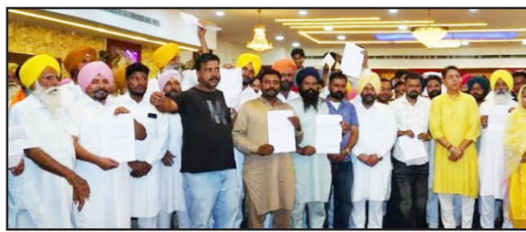
ਸੁਨਾਮ, 9 ਜੂਨ -ਕੌਮੀ ਪੱਤ੍ਰਿਕਾ ਬਿਊਰੋ- ਪੰਜਾਬ ਦੇ ਕੈਬਨਿਟ ਮੰਤਰੀ ਸੁੀ ਅਮਨ ਅਰੋੜਾ ਨੇ ਅਰਬ ਕਰੋੜ, ਸੁਨਾਮ ਵਿਖੇ ਕਰਵਾਏ ਇੱਕ ਵਿਸ਼ੇਸ਼ ਸਮਾਗਮ ਦੌਰਾਨ ਹਲਕਾ ਸੁਨਾਮ ਦੇ 43 ਪਿੰਡਾਂ ਨੂੰ 69 ਵਿਕਾਸ ਕਾਰਜਾਂ ਲਈ ਕਰੀਬ 2.50 ਕਰੋੜ ਰੁਪਏ ਦੇ ਮਨਜ਼ੂਰੀ ਪੱਤਰ ਵੰਡੇ। ਇਨ੍ਹਾਂ ਵਿਕਾਸ ਕਾਰਜਾਂ ਵਿੱਚ ਪਿੰਡਾਂ ਦੀਆਂ ਬੁਨਿਆਦੀ ਸਹੂਲਤਾਂ ਨੂੰ ਮਜ਼ਬੂਤ ਕਰਨ ਅਤੇ ਲੋਕਾਂ ਦੀਆਂ ਰੋਜ਼ਾਨਾ ਲੋੜਾਂ ਨਾਲ ਸਬੰਧਤ ਕੰਮਾਂ ਨੂੰ ਤਰਜੀਹ ਦਿੱਤੀ ਗਈ ਹੈ। ਇਸ ਮੌਕੇ ਸੰਬੰਧਤ ਕਰਦਿਆਂ ਕੈਬਨਿਟ ਮੰਤਰੀ ਅਮਨ ਅਰੋੜਾ ਨੇ ਕਿਹਾ ਕਿ ਪੰਜਾਬ ਸਰਕਾਰ ਮੁੱਖ ਮੰਤਰੀ ਭਗਵੰਤ ਸਿੰਘ ਮਾਨ ਦੀ ਅਗਵਾਈ

ਹੇਠ ਪਿੰਡਾਂ ਅਤੇ ਸ਼ਹਿਰਾਂ ਦੇ ਸਰਵਪੱਖੀ ਵਿਕਾਸ ਲਈ ਲਗਾਤਾਰ ਕੰਮ ਕਰ ਰਹੀ ਹੈ। ਉਨ੍ਹਾਂ ਕਿਹਾ ਕਿ ਪਿੰਡਾਂ ਵਿੱਚ ਬੁਨਿਆਦੀ ਢਾਂਚੇ ਨੂੰ ਮਜ਼ਬੂਤ ਕਰਨਾ ਸਰਕਾਰ ਦੀ ਪ੍ਰਮੁੱਖ ਤਰਜੀਹ ਹੈ ਅਤੇ ਇਸੇ ਉਦੇਸ਼ ਤਹਿਤ ਵੱਖ-ਵੱਖ ਵਿਕਾਸ ਪ੍ਰੋਜੈਕਟਾਂ ਨਾਲ ਫੰਡ ਜਾਰੀ ਕੀਤੇ ਜਾ ਰਹੇ ਹਨ। ਉਨ੍ਹਾਂ ਕਿਹਾ ਕਿ ਪੰਜਾਬ ਭਰੀ ਗਏ ਵਿਕਾਸ ਕਾਰਜਾਂ ਦੇ ਮੁਕੰਮਲ ਹੋਣ ਨਾਲ ਪਿੰਡਾਂ ਦੇ ਵਸਨੀਕਾਂ ਨੂੰ ਬਿਹਤਰ ਸਹੂਲਤਾਂ ਪ੍ਰਾਪਤ ਹੋਣਗੀਆਂ ਅਤੇ ਪਿੰਡਾਂ ਦੀ ਸੁੱਖੀ ਤਸਵੀਰ ਵਿੱਚ ਵੀ ਸੁਧਾਰ ਆਵੇਗਾ। ਉਨ੍ਹਾਂ ਸਬੰਧਤ ਅਧਿਕਾਰੀਆਂ ਨੂੰ ਹਦਾਇਤ ਕੀਤੀ ਕਿ ਸਾਰੇ ਕੰਮ ਨਿਰਧਾਰਿਤ ਸਮੇਂ ਅੰਦਰ ਅਤੇ ਉੱਚ ਗੁਣਵੱਤਾ ਨਾਲ ਮੁਕੰਮਲ ਕਰਵਾਏ ਜਾਣ ਤਾਂ ਜੋ ਲੋਕਾਂ ਨੂੰ ਇਨ੍ਹਾਂ ਦਾ ਵੱਧ ਤੋਂ ਵੱਧ ਲਾਭ ਮਿਲ ਸਕੇ। ਕੈਬਨਿਟ ਮੰਤਰੀ ਨੇ ਕਿਹਾ ਕਿ ਪੰਜਾਬ ਸਰਕਾਰ ਵੱਲੋਂ ਵਿਕਾਸ ਕਾਰਜਾਂ ਲਈ ਫੰਡਾਂ ਦੀ ਕੋਈ ਘਾਟ ਨਹੀਂ ਆਉਣ ਦਿੱਤੀ ਜਾਵੇਗੀ ਅਤੇ ਲੋਕਾਂ ਦੀਆਂ ਜ਼ਰੂਰਤਾਂ ਅਨੁਸਾਰ ਵਿਕਾਸ ਪ੍ਰੋਜੈਕਟਾਂ ਨੂੰ ਤਰਜੀਹ ਦਿੱਤੀ ਜਾ ਰਹੀ ਹੈ। ਉਨ੍ਹਾਂ ਪਿੰਡਾਂ ਦੇ ਨੁਮਾਇੰਦਿਆਂ ਨੂੰ ਅਪੀਲ ਕੀਤੀ ਕਿ ਉਹ ਵਿਕਾਸ ਕਾਰਜਾਂ ਦੀ ਨਿਗਰਾਨੀ ਕਰਕੇ ਪਾਰਦਰਸ਼ਤਾ ਅਤੇ ਗੁਣਵੱਤਾ ਨੂੰ ਯਕੀਨੀ ਬਣਾਉਣ ਅਤੇ ਸਮੇਂ ਸਿਰ ਵਿਕਾਸ ਕਾਰਜ ਪੂਰੇ ਕੀਤੇ ਜਾਣ। ਇਸ ਮੌਕੇ ਵੱਖ ਵੱਖ ਅਧਿਕਾਰੀ, ਵੱਖ-ਵੱਖ ਪਿੰਡਾਂ ਦੇ ਸਰਪੰਚ, ਪੰਚ, ਪੰਚਾਇਤੀ ਨੁਮਾਇੰਦੇ, ਪਾਰਟੀ ਆਗੂ ਅਤੇ ਵੱਡੀ ਗਿਣਤੀ ਵਿੱਚ ਇਲਾਕਾ ਨਿਵਾਸੀ ਹਾਜ਼ਰ ਸਨ।