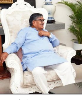
ਚੰਡੀਗੜ੍ਹ, 7 ਜੂਨ -ਕੌਮੀ ਪੱਤ੍ਰਿਕਾ ਵਿਊਰੋ- ਦਿੱਲੀ ਦੇ ਉਪ ਰਾਜਪਾਲ ਸਰਦਾਰ ਤਰਨਜੀਤ ਸਿੰਘ ਸੰਧੂ ਨੇ ਅੱਜ ਪੰਜਾਬ ਲੋਕ ਭਵਨ, ਚੰਡੀਗੜ੍ਹ ਵਿਖੇ

ਚੰਡੀਗੜ੍ਹ, ਦਿੱਲੀ ਅਤੇ ਰਾਸ਼ਟਰੀ ਮਹੱਤਵ ਦੇ ਵਿਕਿੰਨ ਮੁੱਦਿਆਂ 'ਤੇ ਵਿਆਪਕ ਅਤੇ ਸਾਹਬਕ ਚਰਚਾ ਹੋਈ। ਵਿਸ਼ੇਸ਼ ਤੌਰ 'ਤੇ ਸੀਮਾਵਰਤੀ ਖੇਤਰਾਂ ਦੇ ਨੌਜਵਾਨਾਂ ਨੂੰ ਸ਼ਾਂਤੀ ਪ੍ਰਦਾਨ ਕਰਨ ਲਈ ਪੰਜਾਬ ਸਰਕਾਰ ਦੇ ਉੱਚੇਗੇ ਸਿੱਖਿਆ ਨੂੰ ਰੋਸ਼ਨੀ-ਅਧਾਰਤ ਅਤੇ ਵਿਸ਼ਵ ਪੱਧਰ 'ਤੇ ਮੁਕਾਬਲੇ ਯੋਗ ਬਣਾਉਣ ਦੇ ਵਿਆਪਕ ਦ੍ਰਿਸ਼ਟੀਕੋਣ ਦਾ ਹਿੱਸਾ ਹੈ। ਉਨ੍ਹਾਂ ਅੱਗੇ ਕਿਹਾ ਕਿ ਸਿੱਖਿਆ, ਪ੍ਰੋਫਿਸ਼ਨਲਿਜ਼ਮ ਅਤੇ ਆਰਥਿਕ ਮਾਮਲੇ ਵੱਲ ਵੱਧ ਚੁੱਕੇ ਹੋ, ਜਿਸ ਕਰਕੇ ਅਸੀਂ ਇਸਨੂੰ ਵਿਆਪਕ ਸਿਖਲਾਈ, ਪ੍ਰੋਫਿਸ਼ਨਲਿਜ਼ਮ-ਅਧਾਰਤ ਅਤੇ ਅਸਲ-ਜ਼ਿੰਦਗੀ ਦੀਆਂ ਸਮੱਸਿਆਵਾਂ ਦੇ ਹੱਲ ਅਨੁਸਾਰ ਵਾਲ ਹੋ ਰਾ। ਸਰਦਾਰ ਬੇਅੰਤ ਸਿੰਘ ਯੂਨੀਵਰਸਿਟੀ ਹੁਣ ਸਿਰਫ ਡਿਗਰੀ ਪਾਰਕਾਂ ਲਈ ਹੀ ਨਹੀਂ, ਸਗੋਂ ਨਵੀਨ ਵਿਚਾਰਾਂ ਵਾਲੇ ਨੌਜਵਾਨਾਂ ਲਈ ਲਾਂਚਪੈਂਟ ਬਣੇਗੇ। ਸਿੱਖਿਆ ਮੰਤਰੀ ਨੇ ਕਿਹਾ ਕਿ ਹਰ ਵਿਦਿਆਰਥੀ ਨੂੰ ਇੱਕ ਸੈਮਿਨਰ ਦੀ ਮਿਲਾਵਟ ਨਿੱਕੀ ਲਾਜ਼ਮੀ ਇੰਟਰਨੈਸ਼ਿਅਲ ਅਤੇ ਲਾਈਵ ਪ੍ਰੋਜੈਕਟਾਂ ਵਿੱਚ ਗੁਜ਼ਰਨਾ ਹੋਵੇਗਾ।