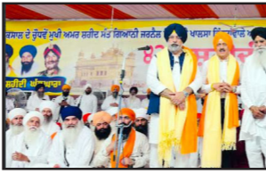
ਨਵੀਂ ਦਿੱਲੀ, 7 ਜੂਨ -ਕੌਮੀ ਪੱਤ੍ਰਿਕਾ ਵਿਊਰੋ- ਜੰਤਰ-ਮੰਤਰ ਵਿੱਚ 'ਕਾਰਕਰਮ ਜਨਤਾ ਪਾਰਟੀ' (ਸੀਜੇਪੀ) ਦੇ ਪ੍ਰਦਰਸ਼ਨ ਦੌਰਾਨ ਦੇ ਸਮੂਹਾਂ ਵਿਚਕਾਰ ਸੰਭਾਵਿਤ ਟਕਰਾਅ ਨੂੰ ਰੋਕਣ ਲਈ ਛੇ ਵਿਅਕਤੀਆਂ ਨੂੰ ਹਿਰਾਸਤ ਵਿੱਚ ਲਿਆ ਗਿਆ।