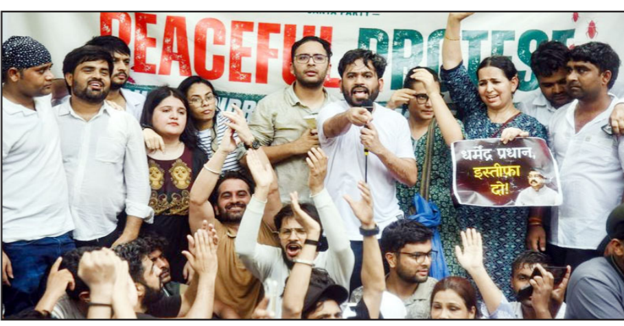
ਨਵੀਂ ਦਿੱਲੀ, 7 ਜੂਨ -ਕੌਮੀ ਪੱਤ੍ਰਿਕਾ ਵਿਊਰੋ- ਜੰਤਰ-ਮੰਤਰ ਵਿੱਚ 'ਕਾਰਕਰਮ ਜਨਤਾ ਪਾਰਟੀ' (ਸੀਜੇਪੀ) ਦੇ ਪ੍ਰਦਰਸ਼ਨ ਦੌਰਾਨ ਦੇ ਸਮੂਹਾਂ ਵਿਚਕਾਰ ਸੰਭਾਵਿਤ ਟਕਰਾਅ ਨੂੰ ਰੋਕਣ ਲਈ ਛੇ ਵਿਅਕਤੀਆਂ ਨੂੰ ਹਿਰਾਸਤ ਵਿੱਚ ਲਿਆ ਗਿਆ।

ਨਵੀਂ ਦਿੱਲੀ, 7 ਜੂਨ -ਕੌਮੀ ਪੱਤ੍ਰਿਕਾ ਵਿਊਰੋ- ਜੰਤਰ-ਮੰਤਰ ਵਿੱਚ 'ਕਾਰਕਰਮ ਜਨਤਾ ਪਾਰਟੀ' (ਸੀਜੇਪੀ) ਦੇ ਪ੍ਰਦਰਸ਼ਨ ਦੌਰਾਨ ਦੇ ਸਮੂਹਾਂ ਵਿਚਕਾਰ ਸੰਭਾਵਿਤ ਟਕਰਾਅ ਨੂੰ ਰੋਕਣ ਲਈ ਛੇ ਵਿਅਕਤੀਆਂ ਨੂੰ ਹਿਰਾਸਤ ਵਿੱਚ ਲਿਆ ਗਿਆ। ਅਧਿਕਾਰੀਆਂ ਨੇ ਦੱਸਿਆ ਕਿ ਇਹ ਹਿਰਾਸਤ ਕਾਨੂੰਨ ਅਤੇ ਵਿਵਸਥਾ ਬਣਾਈ ਰੱਖਣ ਲਈ ਇੱਕ ਸਾਫ਼ਾਨੀ ਉਪਾਅ ਵਜੋਂ ਕੀਤੀ ਗਈ ਸੀ, ਕਿਉਂਕਿ ਪੁਲੀਸ ਨੂੰ ਆਨਲਾਈਨ ਅੰਦੋਲਨ ਦੇ ਸਮਰਥਕਾਂ ਅਤੇ ਵਿਰੋਧੀਆਂ ਵਿਚਕਾਰ ਤਣਾਅ ਦੀ ਸੰਭਾਵਨਾ ਬਾਰੇ ਜਾਣਕਾਰੀ ਮਿਲੀ ਸੀ।