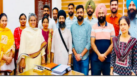
ਪਟਿਆਲਾ, 7 ਜੂਨ - ਕੌਮੀ ਪੱਤ੍ਰਿਕਾ ਬਿਊਰੋ -