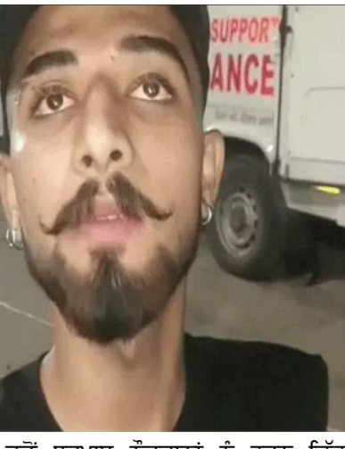
ਜਦੋਂ ਬਚਾਅ ਨੌਜਵਾਨਾਂ ਨੂੰ ਫੜਨ ਵਿੱਚ ਨਾਕਾਮ ਹੋਣ ਤਾਂ ਉਹ ਵਾਪਸ ਸੜਕ 'ਤੇ ਆਏ ਅਤੇ ਪੀੜਤਾਂ ਦਾ ਮੋਟਰਸਾਈਕਲ ਲੈ ਕੇ ਫਰਾਰ ਹੋ ਗਏ। ਭੱਜਦੇ ਸਮੇਂ ਮੁਲਜ਼ਮਾਂ ਨੇ ਉਨ੍ਹਾਂ 'ਤੇ ਇੱਟਾਂ ਵੀ ਸੁੱਟੀਆਂ, ਜਿਸ ਕਾਰਨ ਇੱਕ ਨੌਜਵਾਨ ਦੇ ਪੈਰ 'ਤੇ ਗੰਭੀਰ ਸੱਟ ਲੱਗੀ ਹੈ ਅਤੇ ਕਾਫ਼ੀ ਸੋਜ ਆ ਗਈ ਹੈ। ਪੀੜਤਾਂ ਵੱਲੋਂ ਇਸ ਮਾਮਲੇ ਦੀ ਸੂਚਨਾ ਪੁਲਸ ਨੂੰ ਦੇ ਦਿੱਤੀ ਗਈ ਹੈ।

ਛੱਡ ਕੇ ਨੇੜਲੇ ਖੇਤਾਂ ਵੱਲ ਦੌੜ ਲਗਾ ਦਿੱਤੀ। ਹਮਲਾਵਰਾਂ ਨੇ ਖੇਤਾਂ ਤੱਕ ਉਨ੍ਹਾਂ ਦਾ ਪਿੱਛਾ ਕੀਤਾ ਪਰ ਹਨੇਰੇ ਅਤੇ ਖੇਤਾਂ ਦੀ ਓਟ ਖਿੰਡਾ ਪੀੜਤ ਨੌਜਵਾਨ ਬਚਾਅ 'ਤੇ ਹੱਥ ਨਹੀਂ ਆਏ।