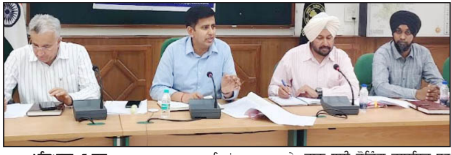
ਪਟਿਆਲਾ, 7 ਜੂਨ - ਕੌਮੀ ਪੱਤ੍ਰਿਕਾ ਬਿਊਰੋ -