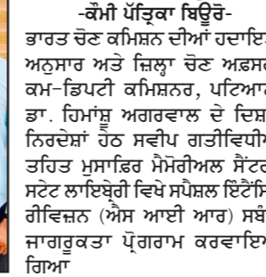
ਪਟਿਆਲਾ, 7 ਜੂਨ - ਕੌਮੀ ਪੱਤ੍ਰਿਕਾ ਬਿਊਰੋ -