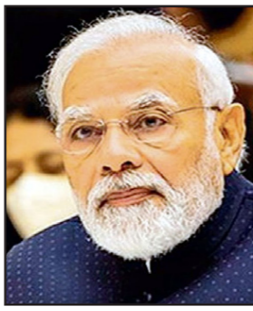
ਨਵੀਂ ਦਿੱਲੀ, 7 ਜੂਨ -ਕੌਮੀ ਪੱਤ੍ਰਿਕਾ ਵਿਊਰੋ- ਪ੍ਰਧਾਨ ਮੰਤਰੀ ਨਰਿੰਦਰ ਮੋਦੀ ਨੇ ਅੱਜ ਆਪਣੀ ਆਰਥਿਕ ਸਲਾਹਕਾਰ ਕੌਂਸਲ ਦੀ ਇੱਕ ਮੀਟਿੰਗ ਦੀ ਪ੍ਰਧਾਨਗੀ ਕੀਤੀ, ਜਿਸ ਵਿੱਚ ਜੀਵਨ ਅਤੇ ਕੰਮ ਨੂੰ ਸੌਖਾ ਬਣਾਉਣ ਲਈ ਹੋਰ ਸੁਧਾਰਾਂ ਬਾਰੇ ਚਰਚਾ ਕੀਤੀ ਗਈ।

ਨਵੀਂ ਦਿੱਲੀ, 7 ਜੂਨ -ਕੌਮੀ ਪੱਤ੍ਰਿਕਾ ਵਿਊਰੋ- ਪ੍ਰਧਾਨ ਮੰਤਰੀ ਨਰਿੰਦਰ ਮੋਦੀ ਨੇ ਅੱਜ ਆਪਣੀ ਆਰਥਿਕ ਸਲਾਹਕਾਰ ਕੌਂਸਲ ਦੀ ਇੱਕ ਮੀਟਿੰਗ ਦੀ ਪ੍ਰਧਾਨਗੀ ਕੀਤੀ, ਜਿਸ ਵਿੱਚ ਜੀਵਨ ਅਤੇ ਕੰਮ ਨੂੰ ਸੌਖਾ ਬਣਾਉਣ ਲਈ ਹੋਰ ਸੁਧਾਰਾਂ ਬਾਰੇ ਚਰਚਾ ਕੀਤੀ ਗਈ। ਸੂਤਰਾਂ ਨੂੰ ਦੱਸਿਆ, ਪ੍ਰਧਾਨ ਮੰਤਰੀ ਅਤੇ ਆਰਥਿਕ ਸਲਾਹਕਾਰ ਕੌਂਸਲ (EAC) ਨੇ ਵਿਸ਼ਵਵਿਆਪੀ ਉਦਯੋਗ-ਪ੍ਰਦਾਨ ਦੇ ਸਮੇਂ ਵਿੱਚ ਭਾਰਤ ਦੇ ਆਰਥਿਕ ਵਿਕਾਸ ਨੂੰ ਹੋਰ ਵਧਾਉਣ ਲਈ ਵੱਖ-ਵੱਖ ਵਿਚਾਰਾਂ ਅਤੇ ਉਪਾਵਾਂ 'ਤੇ ਚਰਚਾ ਕੀਤੀ।