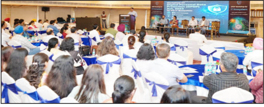
ਚੰਡੀਗੜ੍ਹ, 7 ਜੂਨ - ਕੌਮੀ ਪੱਤ੍ਰਿਕਾ ਬਿਊਰੋ -

ਚੰਡੀਗੜ੍ਹ ਪ੍ਰਸ਼ਾਸਨ ਦੇ ਸੂਚਨਾ ਟੈਕਨੋਲੋਜੀ ਵਿਭਾਗ ਨੇ, ਇਲੈਕਟ੍ਰੋਨਿਕਸ ਅਤੇ ਸੂਚਨਾ ਟੈਕਨੋਲੋਜੀ ਮੰਤਰਾਲੇ (MeitY), ਨੈਸ਼ਨਲ ਈ-ਗਵਰਨੈਂਸ ਡਿਵੀਜ਼ਨ (NeGD), ਭਾਰਤ ਸਰਕਾਰ ਅਤੇ ਸੀ-ਡੀਏਸੀ (3-413) ਮੋਹਾਲੀ ਦੇ ਸਹਿਯੋਗ ਨਾਲ, 3 ਜੂਨ 2026 ਨੂੰ ਹੋਟਲ ਆਉਟਵਿਊ, ਸੈਕਟਰ 10, ਚੰਡੀਗੜ੍ਹ ਵਿਖੇ ਡਿਜੀਟਲ ਪਰਸਨਲ ਡੇਟਾ ਪ੍ਰੋਟੈਕਸ਼ਨ ਡੀਪੀਡੀਪੀ/ਡਪੀਡੀਪੀ ਐਕਟ, 2023 'ਤੇ ਇੱਕ ਜਾਗਰੂਕਤਾ ਅਤੇ ਲਾਗੂਕਰਨ ਵਰਕਸ਼ਾਪ ਦਾ ਆਯੋਜਨ ਕੀਤਾ।