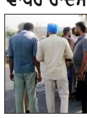
ਫਿਰੋਜ਼ਪੁਰ/ਮੁਕਤਸਰ, 7 ਜੂਨ -ਕੌਮੀ ਪੱਤ੍ਰਿਕਾ ਵਿਊਰੋ- ਫਿਰੋਜ਼ਪੁਰ-ਫਾਜ਼ਿਲਕਾ ਰੋਡ 'ਤੇ ਜੰਗਾ ਵਾਲਾ ਸੜ ਨੇੜੇ ਅੱਜ ਸਵੇਰੇ ਪਿਕਾਪ ਗੱਡੀ ਦੀ ਟੱਕਰ ਨਾਲ ਟੱਕਰ ਦੇ ਕਾਰਨ ਅੱਠ ਲੋਕਾਂ ਦੀ ਮੌਤ ਹੋ ਗਈ ਅਤੇ ਕਈ ਹੋਰ ਜ਼ਖਮੀ ਹੋ ਗਏ।