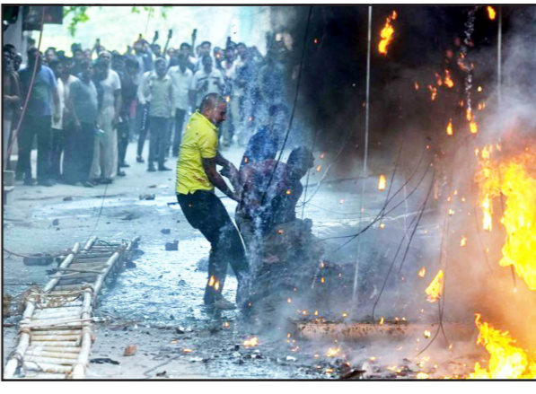
ਲੱਗਾ ਕਿ ਇਮਾਰਤ ਦੀ ਜ਼ਮੀਨੀ ਮੰਜ਼ਿਲ 'ਤੇ ਇੱਕ ਰੈਸਟੋਰੈਂਟ ਚੱਲ ਰਿਹਾ ਸੀ। ਅੱਗ ਲੱਗਣ ਦਾ ਸਹੀ ਕਾਰਨ ਅਜੇ ਪਤਾ ਨਹੀਂ ਹੈ, ਪਰ ਇਹ ਸੰਭਾਵਨਾ ਹੈ ਕਿ ਅੱਗ ਰੈਸਟੋਰੈਂਟ 'ਤੇ ਲੱਗੀ ਹੈ। ਅੱਗ ਲੱਗਣ ਦਾ ਸਹੀ ਕਾਰਨ ਪਤਾ ਕਰਨ ਲਈ ਵੱਖ ਵੱਖ ਕੋਸ਼ਾਂ 'ਤੇ ਜਾਂਚ ਕੀਤੀ ਜਾ ਰਹੀ ਸੀ। ਅਧਿਕਾਰੀਆਂ ਦੇ ਅਨੁਸਾਰ ਵਿਦੇਸ਼ੀ ਨਾਗਰਿਕ ਮੁੱਖ ਤੌਰ 'ਤੇ ਮੱਧ ਏਸ਼ੀਆਈ ਅਤੇ ਅਫਰੀਕੀ ਦੇਸ਼ਾਂ ਦੇ ਸਨ, ਜੋ ਉਦਯੋਗ ਖੇਤਰ ਵਿੱਚ ਸਹੂਲਤ ਵਿੱਚ ਰਹਿ ਰਹੇ ਸਨ। ਇਨ੍ਹਾਂ ਵਿੱਚੋਂ ਬਹੁਤ ਸਾਰੇ ਸੈਲਾਨੀ ਸੁੱਤੇ ਹੋਏ ਸਨ ਜਦੋਂ ਅੱਗ ਇਮਾਰਤ ਨੂੰ ਆਪਣੀ ਲਪੇਟ ਵਿੱਚ ਲੈ ਲਈ। ਇੱਕ ਇੱਕ ਰਾਹ ਪੁੱਛਿਆ ਹੋਣ ਕਰਕੇ ਵਿੱਚ ਲੋਕ ਫਸ ਗਏ। ਅੱਗ ਬੁਝਾਊ ਅਮਲ ਨੇ ਘਟਨਾ ਦੌਰਾਨ ਇਮਾਰਤ ਦੇ ਬੇਸਮੇਂਟ ਵਿੱਚ ਫਸੇ 40 ਤੋਂ ਵੱਧ ਲੋਕਾਂ ਨੂੰ ਬਚਾਇਆ, ਜਿਨ੍ਹਾਂ ਨੂੰ ਬਾਅਦ ਵਿੱਚ ਹਸਪਤਾਲ ਭੇਜ ਦਿੱਤਾ ਗਿਆ। ਮੈਕਸ ਹਸਪਤਾਲ ਵਿੱਚ