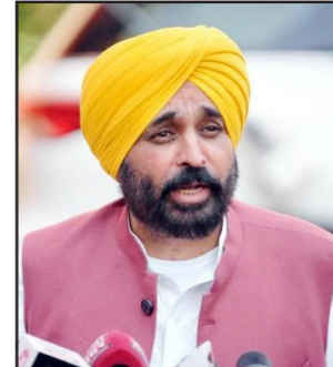
ਚੰਡੀਗੜ੍ਹ, 4 ਜੂਨ -ਕੌਮੀ ਪੱਤ੍ਰਿਕਾ ਬਿਊਰੋ- ਪੰਜਾਬ ਦੇ ਮੁੱਖ ਮੰਤਰੀ ਭਗਵੰਤ ਸਿੰਘ ਮਾਨ ਨੇ ਅੰਮ੍ਰਿਤਸਰ ਦੀ ਵਿਦਿਆਰਥਣ ਵੱਲੋਂ ਖੁਦਕੁਸ਼ੀ ਕੀਤੇ ਜਾਣ ਦੀ ਘਟਨਾ 'ਤੇ ਦੁਖ ਦਾ ਪ੍ਰਗਟਾਵਾ ਕੀਤਾ ਹੈ। ਇਸ ਦੇ ਨਾਲ ਹੀ ਮੁੱਖ ਮੰਤਰੀ ਭਗਵੰਤ ਸਿੰਘ ਮਾਨ ਨੇ ਐਲਾਨ ਕੀਤਾ ਕਿ ਪੰਜਾਬ ਦਾ ਕੋਈ ਵੀ ਸਕੂਲ ਸਾਲ ਵਿੱਚ ਪੰਜ ਫੀਸਦ ਤੋਂ ਵੱਧ ਫੀਸਾਂ ਨਹੀਂ ਵਧਾ ਸਕੇਗਾ। ਇਸ ਗੱਲ ਦਾ ਪ੍ਰਗਟਾਵਾ ਮੁੱਖ ਮੰਤਰੀ ਭਗਵੰਤ ਸਿੰਘ ਮਾਨ ਨੇ ਚੰਡੀਗੜ੍ਹ ਵਿਖੇ ਪੱਤਰਕਾਰਾਂ ਨਾਲ ਗੱਲਬਾਤ ਕਰਦਿਆਂ ਕੀਤਾ ਹੈ। ਮੁੱਖ ਮੰਤਰੀ ਭਗਵੰਤ ਸਿੰਘ ਮਾਨ ਨੇ ਕਿਹਾ ਕਿ ਪੰਜਾਬ ਸਰਕਾਰ ਵੱਲੋਂ ਅਜਿਹਾ ਕਾਨੂੰਨ ਤਿਆਰ ਕੀਤਾ ਜਾਵੇਗਾ। ਜਿਸ ਵਿੱਚ ਪਿਛਲੇ ਤਿੰਨ ਸਾਲਾਂ ਦੌਰਾਨ 15 ਫੀਸਦ ਤੋਂ ਵੱਧ ਫੀਸ ਵਸੂਲਣ ਵਾਲੇ ਸਕੂਲ ਪ੍ਰਬੰਧਕਾਂ ਤੋਂ ਵਿਦਿਆਰਥੀਆਂ ਦੀ ਫੀਸ ਵੀ ਵਾਪਸ ਕਰਵਾਈ ਜਾਵੇਗੀ। ਇਸ ਦੇ ਨਾਲ ਹੀ ਉਹਨਾਂ ਕਿਹਾ ਕਿ ਸੂਬੇ ਵਿੱਚ ਇੱਕ ਸਾਲ ਦੌਰਾਨ 5 ਫੀਸਦ ਤੋਂ ਵੱਧ ਫੀਸ ਵਸੂਲਣ ਵਾਲੇ ਸਕੂਲ ਪ੍ਰਬੰਧਕਾਂ ਖਿਲਾਫ਼ ਸਖ਼ਤ ਕਾਰਵਾਈ ਕੀਤੀ ਜਾਵੇਗੀ। ਮੁੱਖ ਮੰਤਰੀ ਭਗਵੰਤ ਸਿੰਘ ਮਾਨ ਨੇ ਕਿਹਾ ਕਿ ਅੰਮ੍ਰਿਤਸਰ ਦੀ ਵਿਦਿਆਰਥਣ ਨੂੰ ਖੁਦਕੁਸ਼ੀ ਲਈ ਮਜ਼ਬੂਰ ਕਰਨ ਵਾਲੇ ਸਕੂਲ ਪ੍ਰਬੰਧਕਾਂ ਖਿਲਾਫ਼ ਵੀ ਕੇਸ ਦਰਜ ਕਰਕੇ ਬਣਦੀ ਕਾਨੂੰਨੀ ਕਾਰਵਾਈ ਕੀਤੀ ਜਾਵੇਗੀ।

ਚੰਡੀਗੜ੍ਹ, 4 ਜੂਨ -ਕੌਮੀ ਪੱਤ੍ਰਿਕਾ ਬਿਊਰੋ- ਅਧਿਕਾਰੀਆਂ ਨੇ ਸ਼ੁੱਧਵਾਰ ਨੂੰ ਦੱਸਿਆ ਕਿ ਕੁਝ ਵੱਡੇ ਕੌਮਾਂਤਰੀ ਹਵਾਈ ਅੱਡੇ ਨੂੰ ਨਿਸ਼ਾਨਾ ਬਣਾ ਕੇ ਕੀਤੇ ਗਏ ਇੱਕ ਹਮਲੇ ਵਿੱਚ ਇੱਕ ਭਾਰਤੀ ਨਾਗਰਿਕ ਦੀ ਮੌਤ ਹੋ ਗਈ ਹੈ। ਕੁਝ ਵੱਡੇ ਵਿੱਚ ਮੌਜੂਦ ਭਾਰਤੀ ਦੂਤਾਵਾਸ ਨੇ ਸ਼ੇਲ ਮੀਡੀਆ ਪਲੇਟਫਾਰਮ 'ਐਕਸ' (/) 'ਤੇ ਇੱਕ ਪੋਸਟ ਪਾਈ ਹੈ। ਇਸ ਪੋਸਟ ਰਾਹੀਂ ਉਨ੍ਹਾਂ ਨੇ ਅੱਜ ਕੁਝ ਵੀ ਲੋਕ ਜਾਨੀ-ਮਾਲੀ ਤੌਰ 'ਤੇ ਹਮਲੇ ਵਿੱਚ ਇੱਕ ਭਾਰਤੀ ਨਾਗਰਿਕ ਦੀ ਹੋਈ ਦੁਖਦਾਈ ਮੌਤ 'ਤੇ ਡੁੱਬੇ ਦੁੱਖ ਅਤੇ ਅਫ਼ਸੋਸ ਦਾ ਪ੍ਰਗਟਾਵਾ ਕੀਤਾ ਹੈ। ਭਾਰਤੀ ਦੂਤਾਵਾਸ ਨੇ ਇਹ ਵੀ ਦੱਸਿਆ ਕਿ ਉਹ ਪਿੱਤਰ ਪਰਿਵਾਰ ਦੇ ਨਾਲ-ਨਾਲ ਇਸ ਹਮਲੇ ਵਿੱਚ