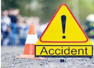
ਕਿਨਾਰੇ ਲੱਗੇ ਹੋਏ ਦਰੱਖਤ, ਜਿਨ੍ਹਾਂ ਵਿਚੋਂ ਕਈ ਪੂਰੀ ਤਰ੍ਹਾਂ ਸੁੱਕੇ ਚੁੱਕੇ ਹਨ, ਜੋ ਕਿ ਆਪਣੇ ਆਪ ਹੀ ਟੁੱਟ ਕੇ ਸੜਕਾਂ ਉੱਪਰ ਡਿੱਗ ਰਹੇ ਹਨ, ਜਿਸ ਨਾਲ ਕਿਸੇ ਸਮੇਂ ਵੀ ਕੋਈ ਵੱਡਾ ਹਾਦਸਾ ਹੋ ਸਕਦਾ ਹੈ, ਪੰਜੂ ਜੰਗਲਾਤ ਵਿਭਾਗ ਇਸ ਪ੍ਰਤੀ ਬੌਧਿਕ ਨਜ਼ਰ ਆ ਰਿਹਾ ਹੈ। ਦੱਸਣਯੋਗ ਹੈ ਕਿ ਮੌਸਮ ਵਿਭਾਗ ਵੱਲੋਂ ਮਿਲੀ ਚਿਤਾਵਨੀ ਦੇ ਚੱਲਦਿਆਂ ਆਉਣ ਵਾਲੇ ਕੁਝ ਦਿਨਾਂ ਵਿਚ ਭਾਰੀ ਝੌਂਕੜ ਤੋਂ ਇਲਾਵਾ ਤੇਜ਼ ਹਨੇਰੀ ਆਉਣ ਦੀ ਸੰਭਾਵਨਾ ਹੈ, ਜਿਸ ਨਾਲ ਸੜਕਾਂ ਕਿਨਾਰੇ ਲੱਗੇ ਹੋਏ ਸੁੱਕੇ ਦਰੱਖਤ ਟੁੱਟ ਕੇ ਸੜਕਾਂ ਅਤੇ ਸਮਾਜਿਕ ਵਿਚ ਡਿੱਗਣ ਦੇ ਪੂਰੇ-ਪੂਰੇ ਆਸਾਰ ਹਨ, ਜਿਨ੍ਹਾਂ ਦੇ ਡਿੱਗਣ ਨਾਲ ਕੋਈ ਵੀ ਜਾਨੀ ਨੁਕਸਾਨ ਹੋ ਸਕਦਾ ਹੈ। ਇਸ ਤੋਂ ਪਹਿਲਾਂ ਵੀ ਇਨ੍ਹਾਂ ਸੜਕਾਂ ਕਿਨਾਰੇ ਸੁੱਕੇ ਹੋਏ ਦਰੱਖਤਾਂ ਦੇ ਟੁੱਟਣ ਕਾਰਨ ਕਈ ਰਾਹਗੀਰ ਮੌਤ ਦੇ ਮੂੰਹ ਵਿਚ ਜਾ ਚੁੱਕੇ ਹਨ। ਸੜਕਾਂ

ਤਰਨਤਾਰਨ 3 ਜੂਨ। ਸੜਕਾਂ ਕਿਨਾਰੇ ਲੱਗੇ ਹੋਏ ਦਰੱਖਤ, ਜਿਨ੍ਹਾਂ ਵਿਚੋਂ ਕਈ ਪੂਰੀ ਤਰ੍ਹਾਂ ਸੁੱਕੇ ਚੁੱਕੇ ਹਨ, ਜੋ ਕਿ ਆਪਣੇ ਆਪ ਹੀ ਟੁੱਟ ਕੇ ਸੜਕਾਂ ਉੱਪਰ ਡਿੱਗ ਰਹੇ ਹਨ, ਜਿਸ ਨਾਲ ਕਿਸੇ ਸਮੇਂ ਵੀ ਕੋਈ ਵੱਡਾ ਹਾਦਸਾ ਹੋ ਸਕਦਾ ਹੈ, ਪੰਜੂ ਜੰਗਲਾਤ ਵਿਭਾਗ ਇਸ ਪ੍ਰਤੀ ਬੌਧਿਕ ਨਜ਼ਰ ਆ ਰਿਹਾ ਹੈ। ਦੱਸਣਯੋਗ ਹੈ ਕਿ ਮੌਸਮ ਵਿਭਾਗ ਵੱਲੋਂ ਮਿਲੀ ਚਿਤਾਵਨੀ ਦੇ ਚੱਲਦਿਆਂ ਆਉਣ ਵਾਲੇ ਕੁਝ ਦਿਨਾਂ ਵਿਚ ਭਾਰੀ ਝੌਂਕੜ ਤੋਂ ਇਲਾਵਾ ਤੇਜ਼ ਹਨੇਰੀ ਆਉਣ ਦੀ ਸੰਭਾਵਨਾ ਹੈ, ਜਿਸ ਨਾਲ ਸੜਕਾਂ ਕਿਨਾਰੇ ਲੱਗੇ ਹੋਏ ਸੁੱਕੇ ਦਰੱਖਤ ਟੁੱਟ ਕੇ ਸੜਕਾਂ ਅਤੇ ਸਮਾਜਿਕ ਵਿਚ ਡਿੱਗਣ ਦੇ ਪੂਰੇ-ਪੂਰੇ ਆਸਾਰ ਹਨ, ਜਿਨ੍ਹਾਂ ਦੇ ਡਿੱਗਣ ਨਾਲ ਕੋਈ ਵੀ ਜਾਨੀ ਨੁਕਸਾਨ ਹੋ ਸਕਦਾ ਹੈ। ਇਸ ਤੋਂ ਪਹਿਲਾਂ ਵੀ ਇਨ੍ਹਾਂ ਸੜਕਾਂ ਕਿਨਾਰੇ ਸੁੱਕੇ ਹੋਏ ਦਰੱਖਤਾਂ ਦੇ ਟੁੱਟਣ ਕਾਰਨ ਕਈ ਰਾਹਗੀਰ ਮੌਤ ਦੇ ਮੂੰਹ ਵਿਚ ਜਾ ਚੁੱਕੇ ਹਨ। ਸੜਕਾਂ