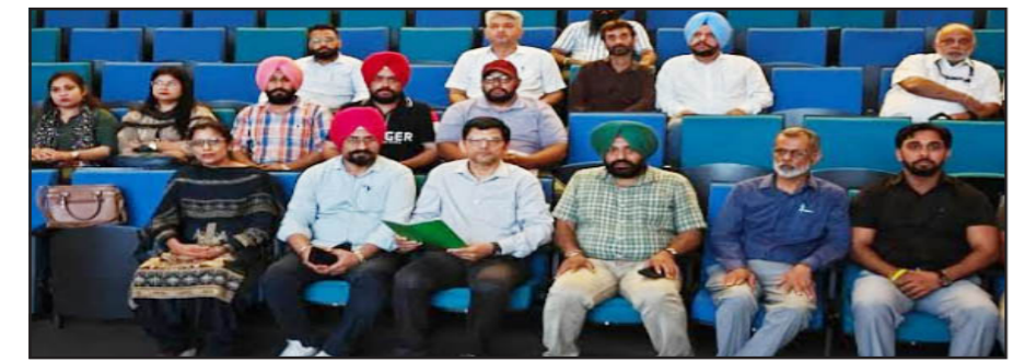
ਸ੍ਰੀ ਆਨੰਦਪੁਰ ਸਾਹਿਬ, 3 ਜੂਨ -ਕੌਮੀ ਪਤ੍ਰਿਕਾ ਵਿਖੇ-