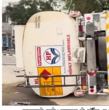
ਟੈਂਕਰ ਨੂੰ ਭਾਰੀ ਨੁਕਸਾਨ ਪਹੁੰਚਿਆ, ਜਦਕਿ ਡਰਾਈਵਰ ਦੀ ਜਾਨ ਵਾਲ-ਵਾਲ ਬਚ ਗਈ। ਟੈਂਕਰ ਚਾਲਕ ਨੇ ਦੱਸਿਆ ਕਿ ਉਹ ਜਲੰਧਰ ਤੋਂ ਤੇਲ ਲੋਡ ਕਰਕੇ ਦੀਨਾਨਗਰ ਗਿਆ ਸੀ। ਉੱਥੇ ਟੈਂਕਰ ਖਾਲੀ ਕਰਨ ਤੋਂ ਬਾਅਦ ਜਦੋਂ ਉਹ ਵਾਪਸ ਜਲੰਧਰ ਜਾ ਰਿਹਾ ਸੀ ਤਾਂ ਪੁਰਾਣਾ ਸ਼ਾਲਾ ਵਿਖੇ ਸਾਹਮਣੇ ਤੋਂ ਆ ਰਹੇ ਵਾਹਨ ਦੀਆਂ ਤਿੱਖੀਆਂ ਲਾਈਟਾਂ ਕਾਰਨ ਉਸ ਨੂੰ ਸੜਕ ਵਿਚਕਾਰ ਬਣਿਆ ਡਿਵਾਈਡਰ ਨਜ਼ਰ ਨਾ

ਆਇਆ। ਇਸ ਕਾਰਨ ਟੈਂਕਰ ਸਿੱਧਾ ਡਿਵਾਈਡਰ ਨਾਲ ਟਕਰਾ ਗਿਆ। ਟੈਂਕਰ ਇੰਨੀ ਭਿਆਨਕ ਸੀ ਕਿ ਟੈਂਕਰ ਦੇ ਕਈ ਹਿੱਸੇ ਟੋਕ ਜਿਲ੍ਹੇ ਨੂੰ ਜਲੰਧਰ ਅਤੇ ਹੁਸ਼ਿਆਰਪੁਰ ਨਾਲ ਜੋੜਨ ਵਾਲਾ ਅਹਿਮ ਮਾਰਗ ਹੈ, ਜਿਸ ਕਾਰਨ ਇੱਥੇ ਦਿਨ ਭਰ ਭਾਰੀ ਆਵਾਜਾਈ ਰਹਿੰਦੀ ਹੈ। ਲੋਕਾਂ ਨੇ ਕਿਹਾ ਕਿ ਉਹ ਕਈ ਵਾਰ ਇਸ ਸੜਕ ਨੂੰ ਚੌੜਾ ਕਰਨ ਅਤੇ ਪੁਰਾਣਾ ਸ਼ਾਲਾ ਵਿੱਚ ਬਣੇ ਡਿਵਾਈਡਰਾਂ ਨੂੰ ਹਟਾ ਕੇ ਸੁਚੱਜੀ ਯੋਜਨਾਬੰਦੀ ਕਰਨ ਦੀ ਮੰਗ ਕਰ ਚੁੱਕੇ ਹਨ, ਪਰ ਸੰਬੰਧਿਤ ਵਿਭਾਗ ਵੱਲੋਂ ਕੋਈ ਧਿਆਨ ਨਹੀਂ ਦਿੱਤਾ ਗਿਆ। ਉਨ੍ਹਾਂ ਦੱਸਿਆ ਕਿ ਖਾਸ ਕਰਕੇ ਹੁੰਦ ਵਾਲੇ ਦਿਨਾਂ ਵਿੱਚ ਇਹ ਡਿਵਾਈਡਰ ਹਾਦਸਿਆਂ ਦਾ ਕਾਰਨ ਬਣਦੇ ਹਨ ਅਤੇ ਇੱਥੇ ਅਕਸਰ ਭਿਆਨਕ ਹਾਦਸੇ ਵਾਪਰਦੇ ਰਹਿੰਦੇ ਹਨ। ਲੋਕਾਂ ਨੇ ਪੁਸ਼ਾਸਨ ਤੋਂ ਮੰਗ ਕੀਤੀ ਕਿ ਜਲਦੀ ਤੋਂ ਜਲਦੀ ਇਹਨਾਂ ਡਿਵਾਈਡਰਾਂ ਨੂੰ ਹਟਾ ਕੇ ਇੱਥੇ ਚੁੱਕੀਆਂ ਸਟਰੀਟ ਲਾਈਟਾਂ ਲਗਾਈਆਂ ਜਾਣ ਅਤੇ ਗੁਰਦਾਸਪੁਰ-ਮੁਕੱਦਮੇ ਮਾਰਗ ਦੀ ਚੌੜਾਈ ਵਧਾਈ ਜਾਵੇ।