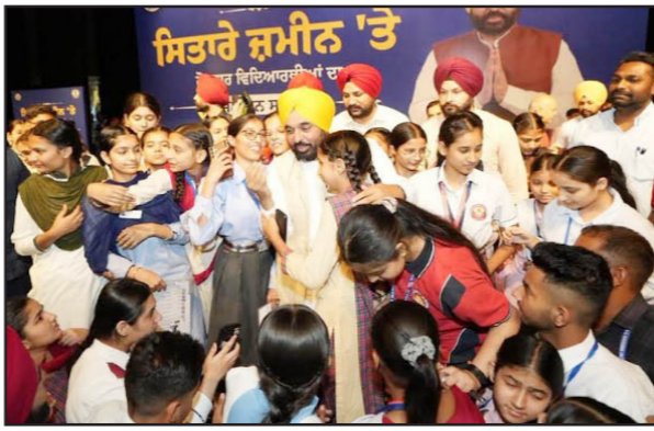
ਸਿਤਾਰੇ ਜ਼ਮੀਨ 'ਤੇ ਪ੍ਰੋਗਰਾਮ ਦੌਰਾਨ ਵਿਦਿਆਰਥੀਆਂ ਨੂੰ ਸਨਮਾਨਿਤ ਕੀਤਾ ਗਿਆ।

ਅੱਜ ਇੱਕ ਟੈਗੋਰ ਬੀਰੋਟ ਵਿਖੇ 'ਸਿਤਾਰੇ ਜ਼ਮੀਨ 'ਤੇ ਪ੍ਰੋਗਰਾਮ ਦੌਰਾਨ 8ਵੀਂ, 10ਵੀਂ ਅਤੇ 12ਵੀਂ ਜਮਾਤ ਵਿੱਚ ਸਾਰੇ ਜ਼ਿਲ੍ਹਿਆਂ ਵਿੱਚੋਂ ਪਹਿਲੇ ਤਿੰਨ ਸਥਾਨ ਹਾਸਲ ਕਰਨ ਵਾਲੇ ਵਿਦਿਆਰਥੀਆਂ ਨੂੰ ਸਨਮਾਨਿਤ ਸਾਹਮਣੇ ਆਉਣੇ ਸ਼ੁਰੂ ਹੋ ਗਏ ਹਨ।