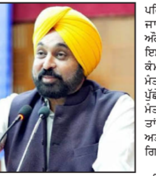
ਬੈਂਕਾਂ ਦਾ ਹੈ। ਮੁੱਖ ਮੰਤਰੀ ਨੇ ਬੈਂਕਾਂ ਵੱਲੋਂ ਸਕਿਊਰਿਟੀ ਵਜੋਂ ਕਿਸਾਨਾਂ ਦੇ ਖ਼ਾਲੀ ਚੈੱਕ ਲੈਣ ਦੇ ਰੁਝਾਨ ਦੇ ਖ਼ਾਤਮੇ ਦਾ ਵੀ ਐਲਾਨ ਕੀਤਾ। ਮੁੱਖ ਮੰਤਰੀ ਨੇ ਦੱਸਿਆ ਕਿ 'ਮਾਝਾਂ ਧੀਆਂ' ਸਹਿਕਾਰੀ ਯੋਜਨਾ ' ਤਹਿਤ ਅੰਗੇਜ਼ਾਂ ਨੂੰ ਇੱਕ ਇੱਕ ਹਜ਼ਾਰ ਰੁਪਏ ਦਾ ਮਾਣ ਭੱਤਾ

ਉਨ੍ਹਾਂ ਦੱਸਿਆ ਕਿ ਪੇਂਡੂ ਸਹਿਕਾਰੀ ਸਭਾਵਾਂ ਦੇ ਮੈਂਬਰਾਂ ਲਈ ਕਣਕ ਲਈ ਫ਼ਸਲੀ ਕਰਜ਼ੇ ਸੀਮਾ (380 ਤੋਂ ਖਾਦ ਆਦਿ ਲਈ) 24,300 ਰੁਪਏ ਤੋਂ ਵਧਾ ਕੇ 30 ਹਜ਼ਾਰ ਰੁਪਏ ਪ੍ਰਤੀ ਏਕੜ ਕੀਤੀ ਗਈ ਹੈ। ਚੋਣਾਂ ਦੀ ਪਹਿਲੀ ਦੀ ਸਾਂਝ ਸੰਭਾਲ ਲਈ ਦੇ ਹਜ਼ਾਰ ਰੁਪਏ ਪ੍ਰਤੀ ਏਕੜ ਲਈ ਫ਼ਸਲੀ ਕਰਜ਼ੇ ਸੀਮਾ 44 ਹਜ਼ਾਰ ਤੋਂ ਵਧਾ ਕੇ ਇੱਕ ਲੱਖ ਰੁਪਏ ਪ੍ਰਤੀ ਏਕੜ ਕੀਤੀ ਗਈ ਹੈ। ਨੌ ਨਵੀਆਂ ਫ਼ਸਲਾਂ ਨੂੰ ਵੀ ਫ਼ਸਲੀ ਕਰਜ਼ੇ ਦੇ ਦਾਇਰੇ 'ਚ ਸ਼ਾਮਲ ਕੀਤਾ ਗਿਆ ਹੈ ਜਿਨ੍ਹਾਂ 'ਚ ਫਲ ਤੇ ਸਬਜ਼ੀਆਂ ਵੀ ਹਨ। ਮੁੱਖ ਮੰਤਰੀ ਨੇ ਐਲਾਨ ਕੀਤਾ ਕਿ ਪੇਂਡੂ ਸਹਿਕਾਰੀ ਸਭਾਵਾਂ ਦੇ ਡਿਫ਼ਾਲਟਰ ਕਿਸਾਨਾਂ ਨੂੰ ਫ਼ਸਲੀ ਕਰਜ਼ੇ ਨੂੰ ਲੈ ਕੇ ਕੋਈ ਫ਼ੋਟਾ ਦਿੱਤੀਆਂ ਜਾਣਗੀਆਂ। ਉਨ੍ਹਾਂ ਦੱਸਿਆ ਕਿ ਇਸ ਨਾਲ ਸਹਿਕਾਰੀ ਬੈਂਕਾਂ 'ਤੇ ਕੋਈ ਵਿੱਤੀ ਬੋਝ ਵੀ ਨਹੀਂ ਪਵੇਗਾ। ਭਗਵੰਤ ਮਾਨ ਨੇ ਕਿਸਾਨਾਂ ਨੂੰ ਅਪੀਲ ਕੀਤੀ ਕਿ ਉਹ ਆਪਣੇ ਖਾਤੇ ਸਹਿਕਾਰੀ ਬੈਂਕਾਂ 'ਚ ਖੁਲ੍ਹਵਾਉਣ ਕਿਉਂਕਿ ਸਭ ਤੋਂ ਘੱਟ ਵਿਆਜ 7 ਫ਼ੀਸਦੀ ਸਹਿਕਾਰੀ