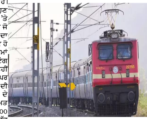
ਉਲਘਣਾ ਕਰਦਾ ਹੈ, ਤਾਂ ਟੀਟੀਓ ("5) ਵੱਲੋਂ ਉਸ ਨੂੰ ਭਾਰੀ ਜੁਰਮਾਨਾ ਕੀਤਾ ਜਾ ਸਕਦਾ ਹੈ। ਰੇਲਵੇ ਮਾਹਿਰਾਂ ਦਾ ਮੰਨਣਾ ਹੈ ਕਿ ਇਸ ਨਾਲ ਟਿਕਟ ਦਲਾਲਾਂ ਦੀਆਂ ਮਨਮਾਨੀਆਂ 'ਤੇ ਵੀ ਰੋਕ ਲੱਗੇਗੀ। ਗਰਮੀਆਂ ਦੀਆਂ ਛੁੱਟੀਆਂ ਦੌਰਾਨ ਯਾਤਰੀਆਂ ਦੀ ਵਾਧੂ ਭੀੜ ਨੂੰ ਸੰਭਾਲਣ ਲਈ ਰੇਲਵੇ ਨੇ ਇਸ ਵਾਰ ਰਿਕਾਰਡ 908 ਸਮਰ ਸਪੈਲ ਟਰੇਨਾਂ ਚਲਾਈਆਂ ਹਨ।

ਕੌਮੀ ਪਤ੍ਰਿਕਾ ਬਿਜਨੈਸ ਡੈਸਕ 3 ਜੂਨ। ਟਰੇਨ ਵਿੱਚ ਸਫ਼ਰ ਕਰਨ ਵਾਲੇ ਲੱਖਾਂ ਯਾਤਰੀਆਂ ਲਈ ਵੱਡੀ ਰਾਹਤ ਦੀ ਖ਼ਬਰ ਹੈ। ਭਾਰਤੀ ਰੇਲਵੇ ਏਜੰਸੀ ਅਤੇ ਸਲੀਪਰ ਕੱਚਾ ਵਿੱਚ ਵਧਦੀ ਭੀੜ ਨੂੰ ਨੱਥ ਪਾਉਣ ਲਈ 1 ਜੂਨ, 2026 ਤੋਂ ਇੱਕ ਨਵਾਂ ਸਿਸਟਮ ਲਾਗੂ ਕਰਨ ਜਾ ਰਿਹਾ ਹੈ। ਰੇਲਵੇ ਬੋਰਡ ਦੇ ਇਸ ਫੈਸਲੇ ਨਾਲ ਹੁਣ ਵੇਟਿੰਗ ਟਿਕਟਾਂ ਦੀ ਗਿਣਤੀ 'ਤੇ ਸਖ਼ਤ ਸੀਮਾ ਲਗਾਈ ਜਾਵੇਗੀ, ਤਾਂ ਜੋ ਜ਼ਿਰਫ਼ ਸੀਟਾਂ ਵਾਲੇ ਯਾਤਰੀਆਂ ਦਾ ਸਫ਼ਰ ਸੁਖਾਲਾ ਅਤੇ ਆਰਾਮਦਾਇਕ ਹੋ ਸਕੇ। ਰੇਲਵੇ ਦੇ ਨਵੇਂ ਨਿਯਮਾਂ ਅਨੁਸਾਰ, ਹੁਣ ਟਰੇਨਾਂ ਵਿੱਚ ਵੇਟਿੰਗ ਟਿਕਟਾਂ ਅਨੁਵਾਹ ਜਾਰੀ ਨਹੀਂ ਕੀਤੀਆਂ ਜਾਣਗੀਆਂ। ਸਲੀਪਰ ਕਲਾਸ ਵਿੱਚ ਵੇਟਿੰਗ ਟਿਕਟਾਂ ਦੀ ਗਿਣਤੀ ਹੁਣ ਕੁੱਲ ਸੀਟ ਸਮਰੱਥਾ ਦੇ ਸਿਰਫ਼ 30 ਫੀਸਦੀ ਤੱਕ ਹੀ ਸੀਮਤ ਹੋਵੇਗੀ। ਪਹਿਲਾਂ ਇਹ ਗਿਣਤੀ 400 ਤੱਕ ਪਹੁੰਚ ਜਾਂਦੀ ਸੀ, ਪਰ ਹੁਣ ਇੱਕ ਟਰੇਨ ਵਿੱਚ ਅੰਤਤਮ 150 ਤੋਂ 200 ਤੋਂ ਵੱਧ ਵੇਟਿੰਗ ਟਿਕਟਾਂ ਜਾਰੀ ਨਹੀਂ ਹੋਣਗੀਆਂ। ਇਸੇ ਤਰ੍ਹਾਂ ਏਜੰਸੀ ਕੱਚਾ ਵਿੱਚ ਵੀ ਬਦਲਾਅ ਕਰਦਿਆਂ ਵੇਟਿੰਗ ਟਿਕਟਾਂ ਦੀ ਸੀਮਾ ਕੁੱਲ ਸੀਟਾਂ ਦਾ 60 ਫੀਸਦੀ ਤੈਅ ਕੀਤੀ ਗਈ ਹੈ। ਰੇਲਵੇ ਨੇ ਇਹ ਫੈਸਲਾ ਯਾਤਰੀਆਂ ਦੀਆਂ ਲਗਾਤਾਰ ਮਿਲ ਰਹੀਆਂ ਸ਼ਿਕਾਇਤਾਂ ਅਤੇ ਸੋਸ਼ਲ ਮੀਡੀਆ 'ਤੇ ਉਲਘਣਾ ਕਰਦਾ ਹੈ, ਤਾਂ ਟੀਟੀਓ ("5) ਵੱਲੋਂ ਉਸ ਨੂੰ ਭਾਰੀ ਜੁਰਮਾਨਾ ਕੀਤਾ ਜਾ ਸਕਦਾ ਹੈ। ਰੇਲਵੇ ਮਾਹਿਰਾਂ ਦਾ ਮੰਨਣਾ ਹੈ ਕਿ ਇਸ ਨਾਲ ਟਿਕਟ ਦਲਾਲਾਂ ਦੀਆਂ ਮਨਮਾਨੀਆਂ 'ਤੇ ਵੀ ਰੋਕ ਲੱਗੇਗੀ। ਗਰਮੀਆਂ ਦੀਆਂ ਛੁੱਟੀਆਂ ਦੌਰਾਨ ਯਾਤਰੀਆਂ ਦੀ ਵਾਧੂ ਭੀੜ ਨੂੰ ਸੰਭਾਲਣ ਲਈ ਰੇਲਵੇ ਨੇ ਇਸ ਵਾਰ ਰਿਕਾਰਡ 908 ਸਮਰ ਸਪੈਲ ਟਰੇਨਾਂ ਚਲਾਈਆਂ ਹਨ।