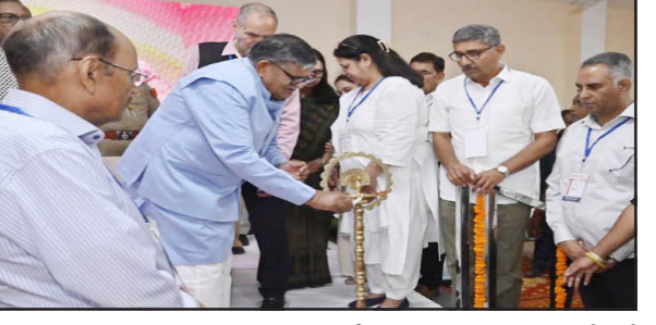
ਚੰਡੀਗੜ੍ਹ, 3 ਜੂਨ -ਕੌਮੀ ਪਤ੍ਰਿਕਾ ਵਿਖੇ-

ਪੰਜਾਬ ਦੇ ਰਾਜਪਾਲ ਅਤੇ ਚੰਡੀਗੜ੍ਹ ਦੇ ਪੁਸ਼ਾਕ ਸ਼੍ਰੀ ਗੁਲਾਬ ਚੰਦ ਕਟਾਰੀਆ ਨੇ ਸਮਾਜ ਦੇ ਸਾਰੇ ਵਰਗਾਂ ਨੂੰ ਸੱਦਾ ਦਿੱਤਾ ਕਿ ਉਹ ਆਪਣੇ-ਆਪਣੇ ਵਰਗ ਦੇ ਨੌਜਵਾਨਾਂ ਨੂੰ ਨਸ਼ਿਆਂ ਤੋਂ ਦੂਰ ਕਰ ਲੈਣ ਤਾਂ ਪੂਰਾ ਸਮਾਜ ਨਸ਼ਾ ਮੁਕਤ ਹੋ ਜਾਵੇਗਾ। ਅਗਰ ਸਮੇਂ ਰਹਿੰਦੇ ਨਹੀਂ ਸੰਭਵ ਤਾਂ ਨਸ਼ਾ ਭਾਵੀ ਪੀੜ੍ਹੀ ਨੂੰ ਮਾਨਸਿਕ ਅਤੇ ਸਰੀਰਕ ਤੌਰ 'ਤੇ ਖੋਖਲਾ ਕਰ ਦੇਵੇਗਾ।