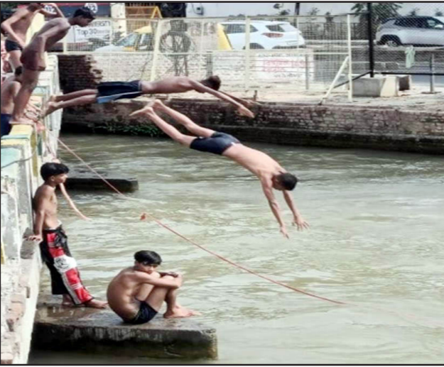
ਵੱਧ ਜਾਂਦਾ ਹੈ। ਜ਼ਿਕਰਯੋਗ ਹੈ ਕਿ ਬੀਤੇ ਕਈ ਸਾਲਾਂ ਤੋਂ ਲਗਾਤਾਰ ਹਰ ਸਾਲ ਮਹਾਨਗਰ ਵਿੱਚੋਂ ਲੰਘਣ ਵਾਲੀਆਂ ਨਹਿਰਾਂ, ਸਤਲੁਜ ਦਰਿਆ ਅਤੇ ਨਾਲਿਆਂ ਵਿੱਚ ਡੁੱਬਣ ਕਾਰਨ ਅਣਗਿਣਤ ਕੌਮੀਤੀ ਜਾਨਾਂ ਜਾਇਆ ਹੋ ਚੁੱਕੀਆਂ ਹਨ। ਜਦੋਂ ਵੀ ਕੋਈ ਅਜਿਹੀ ਮੌਦਭਾਗੀ ਘਟਨਾ ਸਾਹਮਣੇ ਆਉਂਦੀ ਹੈ ਤਾਂ ਕੁਝ ਦਿਨ ਦੀ ਸਖਤੀ ਮਗਰੋਂ ਫਿਰ ਹਾਲਾਤ ਉਸੇ ਤਰ੍ਹਾਂ ਦੇ ਬਣ ਜਾਂਦੇ ਹਨ। ਜ਼ਿਕਰਯੋਗ ਹੈ ਕਿ ਪਿਛਲੇ ਸਾਲ ਗਰਮੀ

ਲੁਧਿਆਣਾ, 2 ਜੂਨ - ਐਸ. ਕੇ. ਵਰਮਾ- ਕੌਮੀ ਪੱਤ੍ਰਿਕਾ ਬਿਊਰੋ- ਆਲਮੀ ਪੱਧਰ ਅਤੇ ਖਾਸ ਕਰ ਕੇ ਉੱਤਰੀ ਭਾਰਤ ਵਿੱਚ ਲਗਾਤਾਰ ਵੱਧ ਰਹੇ ਤਾਪਮਾਨ ਦੇ ਕਾਰਨ ਹਾਲਤ ਇਸ ਸੀਜ਼ਨ ਵਿੱਚ ਇੱਕ ਵਾਰ ਫਿਰ ਤੋਂ ਨਹਿਰਾਂ ਦੇ ਡੂੰਘੇ ਪਾਣੀ ਵਿੱਚ ਡੁੱਬਣ ਦੇ ਖਤਰੇ ਤੋਂ ਬੇਖਬਰ ਬੱਚੇ ਪੀ ਨਹੀਂ ਨੌਜਵਾਨ ਅਤੇ ਅੱਧਬੁੱਝ ਵਿਅਕਤੀਆਂ ਨੂੰ ਨਹਿਰ ਵਿੱਚ ਤਾਰੀਆਂ ਲਗਾਉਣ ਦੇ ਆਮ ਵੇਖਿਆ ਜਾ ਰਿਹਾ ਹੈ। ਹਲਾਕੀ ਪ੍ਰਸ਼ਾਸਨ ਵੱਲੋਂ ਹਰ ਵਾਰ ਦੀ ਤਰ੍ਹਾਂ ਇਸ ਸਾਲ ਵੀ ਪੈਸ ਨੇਟ ਜਾਰੀ ਕਰਕੇ ਦਰਿਆਵਾਂ, ਨਹਿਰਾਂ ਤੇ ਸੁਇਆਂ ਵਿੱਚ ਨਹਾਉਣ ਉੱਪਰ ਪਾਬੰਦੀ ਦੇ ਹੁਕਮ ਜਾਰੀ ਕਰਨ ਦੀ ਕਸਰਤ ਕਰਕੇ ਹੱਥ ਝਾੜ ਲਏ ਜਾਣਗੇ। ਬਰਸਾਤੀ ਸੀਜ਼ਨ ਸਿਰ ਤੋਂ ਹੋ ਅਤੇ ਬਰਸਾਤੀ ਵਿੱਚ ਸਾਹੀ ਨਦੀਆਂ ਨਾਲ ਉਠਾਣ ਤੇ ਚੜ੍ਹ ਆਉਂਦੇ ਹਨ, ਅਜਿਹੇ ਹਾਲਾਤ ਵਿੱਚ ਡੁੱਬਣ ਦੀਆਂ ਦੁਰਘਟਨਾਵਾਂ ਵਿੱਚ ਵਾਧਾ ਹੋਣ ਦਾ ਖਤਰਾ ਕਈ ਗੁਣਾ