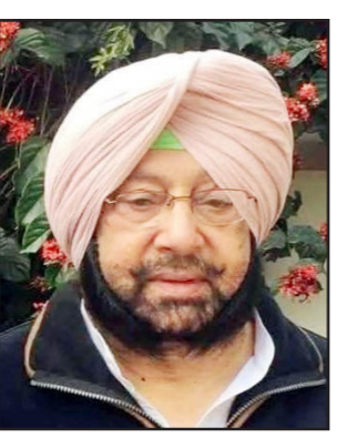
ਵਟਾਂਦਰਾ ਕੀਤਾ ਜਾਂਦਾ ਸੀ ਪਰ ਭਾਜਪਾ 'ਚ ਜੋ ਮੈਂ ਪਿਛਲੇ ਛੇ ਸਾਲਾਂ ਵਿੱਚ ਦੇਖਿਆ ਹੈ, ਉਹ ਖੁਦ ਦੀ ਤੋਅ ਕਰਦੇ ਹਨ ਕਿ ਉਨ੍ਹਾਂ ਨੇ ਕੀ ਕਰਨਾ ਹੈ ਅਤੇ ਬੱਝ ਉਹ ਕਰ ਦਿੰਦੇ ਹਨ।" ਉਨ੍ਹਾਂ ਮੌਜੂਦਾ ਪ੍ਰਧਾਨ ਸ਼ਨੀਲ ਜਾਖੜ ਅਤੇ ਕਾਂਗਰਸਕਾਰੀ ਪ੍ਰਧਾਨ

ਚਾਹੀਦੀ ਸੀ। ਸਾਬਕਾ ਮੁੱਖ ਮੰਤਰੀ ਨੇ ਕਿਹਾ, "ਕੇਵਲ ਸਿੱਖ ਫਿਲੌ ਭਾਵੇਂ ਮੋਰਾ ਦੋਸਤ ਹੈ ਪਰ ਮੈਂ ਨਹੀਂ ਸਮਝਦਾ ਕਿ ਉਹ ਭਾਜਪਾ ਦੀਆਂ ਖਾਹਿਸ਼ਾਂ ਪੂਰੀਆਂ ਕਰਨ ਦੀ ਸਥਿਤੀ 'ਚ ਹੈ। ਉਸ ਦੀ ਬੀਤੇ 'ਚ ਸਿਆਸੀ ਕਾਰਗੁਜ਼ਾਰੀ ਵੀ ਕੋਈ ਖਾਸ ਨਹੀਂ ਰਹੀ ਹੈ। ਪੰਜਾਬ ਦੀ ਸਿਆਸਤ 'ਚ ਛੇ ਦਹਾਕਿਆਂ ਤੋਂ ਵੱਧ ਸਮੇਂ ਤੱਕ ਸਰਗਰਮ ਰਹਿਣ ਦੇ ਬਾਵਜੂਦ ਮੇਰੇ ਨਾਲ ਪ੍ਰਧਾਨ ਦੀ ਨਿਯੁਕਤੀ ਬਾਰੇ ਕੋਈ ਸਲਾਹ-ਮਸ਼ਵਰਾ ਨਹੀਂ ਕੀਤਾ ਗਿਆ।" ਕਾਂਗਰਸ ਵਿੱਚ ਬਿਤਾਏ ਸਮੇਂ ਨੂੰ ਚੋਣੇ ਕਰਦਿਆਂ ਅਮਰਿੰਦਰ ਸਿੰਘ ਨੇ ਕਿਹਾ ਕਿ ਪਾਰਟੀ 'ਚ ਸੂਬਾਈ ਆਗੂਆਂ ਨੂੰ ਵਧੇਰੇ ਖੁਦਮੁਖਤਾਰੀ ਮਿਲਣੀ ਸੀ। ਭਾਜਪਾ ਦੀ ਕੌਮ ਕਰਨ ਦੀ ਸ਼ੈਲੀ ਬਹੁਤ ਜ਼ਿਆਦਾ ਕੇਂਦਰੀਕ੍ਰਿਤ ਹੋਣ ਦਾ ਦਾਅਵਾ ਕਰਦਿਆਂ ਉਨ੍ਹਾਂ ਕਿਹਾ, "ਕਾਂਗਰਸ 'ਚ ਮੇਰੇ ਨਾਲ ਹਮੇਸ਼ਾ ਵਿਚਾਰ