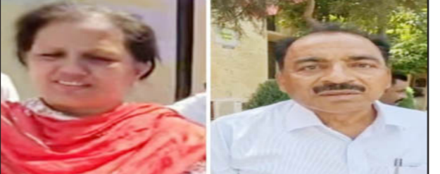
ਪਾਰਟੀ ਤੇ ਕਾਂਗਰਸ ਨੂੰ ਸਪੱਸ਼ਟ ਬਹੁਮਤ ਨਹੀਂ ਮਿਲਿਆ ਹੈ। ਪਿਛਲੀਆਂ ਨਗਰ ਕੌਸਲ ਚੋਣਾਂ 'ਚ ਕਾਂਗਰਸ ਨੇ ਕੌਸਲ 'ਤੇ ਕਬਜ਼ਾ ਕੀਤਾ ਸੀ। ਅਜਿਹੇ 'ਚ ਹੁਣ

ਲੁਧਿਆਣਾ, 2 ਜੂਨ - ਕੌਮੀ ਪੱਤ੍ਰਿਕਾ ਬਿਊਰੋ- ਜਗਰਾਓ ਨਗਰ ਕੌਸਲ ਦੀਆਂ 23 ਸੀਟਾਂ ਲਈ ਹੋਈਆਂ ਚੋਣਾਂ ਦੇ ਨਤੀਜੇ ਸਾਹਮਣੇ ਆ ਗਏ ਹਨ। ਚੋਣ ਨਤੀਜਿਆਂ 'ਚ ਕਿਸੇ ਨੂੰ ਵੀ ਸਪੱਸ਼ਟ ਬਹੁਮਤ ਨਹੀਂ ਮਿਲਿਆ। ਚੋਣਾਂ 'ਚ ਕਾਂਗਰਸ ਦੇ 9, ਆਮ ਆਦਮੀ ਪਾਰਟੀ ਦੇ 9, ਭਾਜਪਾ ਦੇ 4 ਤੇ ਇਕ ਆਜ਼ਾਦ ਉਮੀਦਵਾਰ ਚੋਣ ਜਿੱਤਣ ਵਿੱਚ ਕਾਮਯਾਬ ਰਿਹਾ। ਦੂਜੇ ਪਾਸੇ, ਦਿਲਾਂ ਚੋਣਾਂ ਵਿੱਚ ਸ਼ੇਮਟੀ ਅਕਾਲੀ ਦਲ ਬਾਦਲ ਆਪਣਾ ਖਾਤਾ ਵੀ ਨਹੀਂ ਖੋਲ੍ਹ ਸਕਿਆ। ਵਿਲਹਾਲ ਨਗਰ ਕੌਸਲ ਦੀਆਂ ਇਨ੍ਹਾਂ ਚੋਣਾਂ 'ਚ ਆਮ ਆਦਮੀ