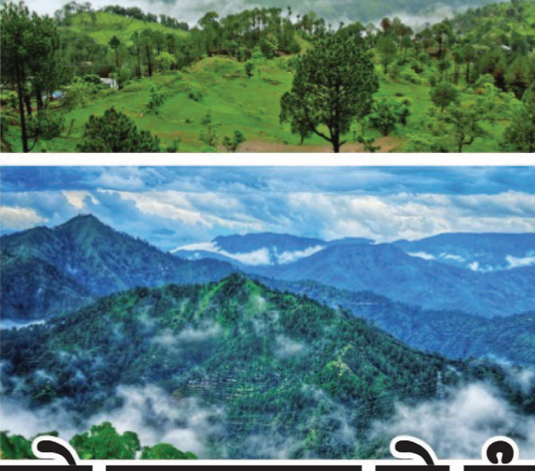
ਲੈਂਸਡਾਊਨ ਵਿਖੇ ਸੁੰਦਰ ਖੇਤਰ ਦਾ ਨਜ਼ਾਰਾ।

ਜਿਦੋਂ ਕਿ ਸਾਨੂੰ ਉਮੀਦ ਸੀ ਅਤੇ ਜੋ ਦੱਸਿਆ ਗਿਆ ਸੀ ਲੈਂਸਡਾਊਨ ਇਕ ਬਹੁਤ ਸ਼ਾਂਤ ਅਤੇ ਮਨਮੋਹਕ ਸਥਾਨ ਹੈ। ਐਕਟੀਵਿਟੀ ਨਾਲੋਂ ਵੱਧ