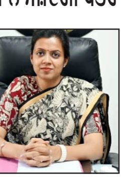
ਵਜੇ ਤੱਕ ਨਾਮਜ਼ਦਗੀ ਪੱਤਰ ਵਾਪਸ ਲਏ ਜਾ ਸਕਦੇ ਹਨ। ਉਨ੍ਹਾਂ ਦੱਸਿਆ ਕਿ ਵੋਟਾਂ 13 ਜੂਨ 2026 ਨੂੰ ਸਵੇਰੇ 8:00 ਵਜੇ ਤੋਂ ਸ਼ਾਮ 4:00 ਵਜੇ ਤੱਕ ਪੇਟਰੀਆਂ ਅਤੇ ਇਸੇ ਦਿਨ ਵੋਟ ਪੈਣ ਉਪਰੰਤ ਵੋਟਾਂ ਦੀ ਗਿਣਤੀ ਸ਼ੁਰੂ ਹੋਵੇਗੀ। ਜ਼ਿਕਰਯੋਗ ਹੈ ਕਿ ਸ਼ਾਮਚੁਰਾਸੀ ਨਗਰ ਕੌਸਲ ਦੇ 9 ਵਾਰਡਾਂ ਲਈ ਹੋਣ ਵਾਲੀਆਂ ਚੋਣਾਂ ਦੀਆਂ ਨਾਮਜ਼ਦਗੀਆਂ ਨਗਰ ਕੌਸਲ ਵਿੱਚ ਕਾਰਜ ਸਾਧਕ ਅਫ਼ਸਰ ਦੇ ਕਮਰਾ ਨੰਬਰ 3 ਵਿੱਚ ਪ੍ਰਾਪਤ ਕੀਤੀਆਂ ਜਾਣਗੀਆਂ।

ਰੁਸ਼ਿਆਰਪੁਰ, 2 ਜੂਨ - ਕੌਮੀ ਪੱਤ੍ਰਿਕਾ ਬਿਊਰੋ- ਰਾਜ ਚੋਣ ਕਮਿਸ਼ਨ ਵਲੋਂ ਨਗਰ ਕੌਸਲ, ਸ਼ਾਮਚੁਰਾਸੀ ਦੀਆਂ ਵੋਟਾਂ ਲਈ ਜਾਰੀ ਵੇਰਵਿਆਂ ਅਨੁਸਾਰ 2 ਜੂਨ (ਸ਼ਨੀਵਾਰ) ਤੋਂ ਨਾਮਜ਼ਦਗੀ ਪੱਤਰ ਪ੍ਰਾਪਤ ਕੀਤੇ ਜਾਣਗੇ। ਇਸ ਸਬੰਧੀ ਜਾਣਕਾਰੀ ਦਿੰਦਿਆਂ ਡਿਪਟੀ ਕਮਿਸ਼ਨਰ-ਕਮ- ਜ਼ਿਲ੍ਹਾ ਚੋਣ ਅਫ਼ਸਰ ਆਸ਼ਿਕਾ ਜੈਨ ਨੇ ਦੱਸਿਆ ਕਿ ਰਾਜ ਚੋਣ ਕਮਿਸ਼ਨ ਵਲੋਂ ਜਾਰੀ ਕੀਤੇ ਗਏ ਨੋਟੀਫਿਕੇਸ਼ਨ ਅਨੁਸਾਰ ਨਗਰ ਕੌਸਲ, ਸ਼ਾਮਚੁਰਾਸੀ ਦੀਆਂ ਵੋਟਾਂ 13 ਜੂਨ 2026 (ਸ਼ਨੀਵਾਰ) ਨੂੰ ਪੇਟਰੀਆਂ ਉਨ੍ਹਾਂ ਦੱਸਿਆ ਕਿ 2 ਜੂਨ 2026 ਤੋਂ ਸਵੇਰੇ 11 ਵਜੇ ਤੋਂ ਬਾਅਦ ਦੁਪਹਿਰ 3 ਵਜੇ ਤੱਕ ਨਾਮਜ਼ਦਗੀ ਪੱਤਰ ਦਾਖਲ ਕੀਤੇ ਜਾ ਸਕਦੇ ਹਨ। ਨਾਮਜ਼ਦਗੀ ਪੱਤਰ ਦਾਖਲ ਕਰਨ ਦੀ ਆਖਰੀ ਮਿਤੀ 3 ਜੂਨ 2026 ਬਾਅਦ ਦੁਪਹਿਰ 3:00 ਵਜੇ ਤੱਕ ਹੋਵੇਗੀ। ਉਨ੍ਹਾਂ ਦੱਸਿਆ ਕਿ 4 ਜੂਨ 2026 ਨੂੰ ਨਾਮਜ਼ਦਗੀ ਪੱਤਰਾਂ ਦੀ ਪੜਤਾਲ ਕੀਤੀ ਜਾਵੇਗੀ ਅਤੇ 5 ਜੂਨ 2026 ਨੂੰ ਬਾਅਦ ਦੁਪਹਿਰ 3:00