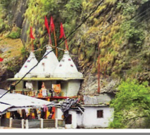
ਚਾਰਧਾਮ ਯਾਤਰਾ ਲਈ ਖੁੱਲ੍ਹੇ ਗਏ ਦੁਆਰ।