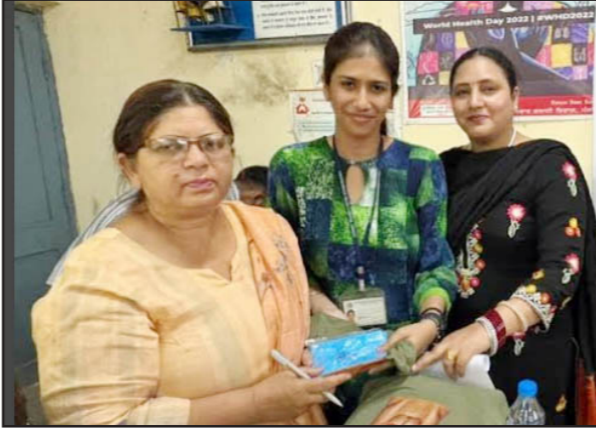
ਲੁਧਿਆਣਾ, 25 ਮਈ - ਕੌਮੀ ਪੱਤ੍ਰਿਕਾ ਬਿਊਰੋ- ਕੌਮਲ ਆਫ ਮੈਡੀਕਲ ਰਿਸਰਚ ਦੇ ਸਹਿਯੋਗ ਨਾਲ ਚੱਲ ਰਹੇ ਇੰਡੀਆ-ਏਐਮਐਸ ਪ੍ਰੋਜੈਕਟ ਤਹਿਤ ਕ੍ਰਿਸਚਨ ਰਾਜੀਵ ਗਾਂਧੀ ਦੀ 35ਵੀਂ ਬਰਸੀ ਮੌਕੇ ਸ਼ਰਧਾਂਜਲੀ ਸਮਾਗਮ, ਕੰਪਿਊਟਰ ਯੁੱਗ ਅਤੇ ਪੰਚਾਇਤੀ ਰਾਜ ਨੂੰ ਦੱਸਿਆ ਉਨ੍ਹਾਂ ਦੀ ਵੱਡੀ ਦੇਣ

ਲੁਧਿਆਣਾ, 25 ਮਈ - ਕੌਮੀ ਪੱਤ੍ਰਿਕਾ ਬਿਊਰੋ- ਹਲਕਾ ਦੱਖਣੀ ਵਿੱਚ ਮਹਰੂਮ ਪ੍ਰਧਾਨ ਮੰਤਰੀ ਅਤੇ ਭਾਰਤ ਰਤਨ ਰਾਜੀਵ ਗਾਂਧੀ ਜੀ ਦੀ 35ਵੀਂ ਬਰਸੀ ਮੌਕੇ ਸ਼ਰਧਾਂਜਲੀ ਸਮਾਗਮ ਕਰਵਾਇਆ ਗਿਆ। ਇਹ ਸਮਾਗਮ