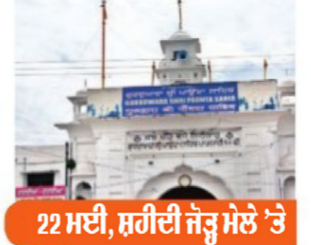
22 ਮਈ, ਸ਼ਹੀਦੀ ਜੋਰੂ ਮੇਲੇ 'ਤੇ