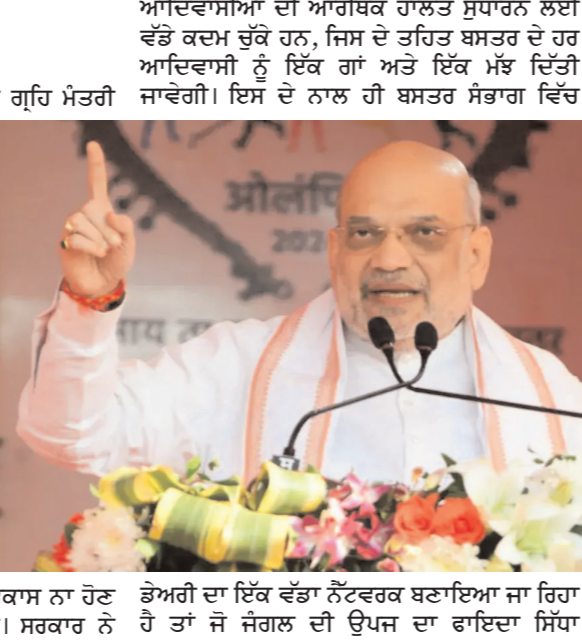
ਕੇਂਦਰੀ ਗ੍ਰਹਿ ਮੰਤਰੀ ਅਮਿਤ ਸ਼ਾਹ ਨੇ ਛੱਤੀਸਗੜ੍ਹ ਵਿੱਚ ਇੱਕ ਪ੍ਰੈਸ ਕਾਨਫਰੰਸ ਦੌਰਾਨ ਇੱਕ ਇਤਿਹਾਸਕ ਦਾਅਵਾ ਕਰਦਿਆਂ ਕਿਹਾ ਕਿ ਬਸਤਰ ਹੁਣ ਨਕਸਲਵਾਦ ਤੋਂ ਪੂਰੀ ਤਰ੍ਹਾਂ ਮੁਕਤ ਹੋ ਚੁੱਕਾ ਹੈ।

ਨੈਸ਼ਨਲ ਡੈਸਕ 20 ਮਈ। ਕੇਂਦਰੀ ਗ੍ਰਹਿ ਮੰਤਰੀ ਅਮਿਤ ਸ਼ਾਹ ਨੇ ਛੱਤੀਸਗੜ੍ਹ ਵਿੱਚ ਇੱਕ ਪ੍ਰੈਸ ਕਾਨਫਰੰਸ ਦੌਰਾਨ ਇੱਕ ਇਤਿਹਾਸਕ ਦਾਅਵਾ ਕਰਦਿਆਂ ਕਿਹਾ ਕਿ ਬਸਤਰ ਹੁਣ ਨਕਸਲਵਾਦ ਤੋਂ ਪੂਰੀ ਤਰ੍ਹਾਂ ਮੁਕਤ ਹੋ ਚੁੱਕਾ ਹੈ। ਉਨ੍ਹਾਂ ਕਿਹਾ ਕਿ ਸਿਰਫ਼ ਬਸਤਰ ਹੀ ਨਹੀਂ, ਸਗੋਂ ਪੂਰੇ ਦੇਸ਼ ਵਿੱਚ ਨਕਸਲਵਾਦ ਦਾ ਸਫ਼ਾਇਆ ਕੀਤਾ ਜਾ ਚੁੱਕਾ ਹੈ ਅਤੇ ਹੁਣ ਛੱਤੀਸਗੜ੍ਹ ਵਿੱਚ ਦਹਾਕਿਆਂ ਤੋਂ ਚੱਲ ਰਿਹਾ ਡਰ ਅਤੇ ਦਹਿਸ਼ਤ ਦਾ ਮਾਹੌਲ ਖ਼ਤਮ ਹੋ ਗਿਆ ਹੈ। ਅਮਿਤ ਸ਼ਾਹ ਨੇ 20 ਮਈ 2026 ਦੀ ਤਰੀਕ ਨੂੰ ਮਹੱਤਵਪੂਰਨ ਦੱਸਿਆ ਕਿਹਾ ਕਿ ਬਸਤਰ ਵਿੱਚ ਵਿਕਾਸ ਦੀ ਇੱਕ ਨਵੀਂ ਸਵੇਰ ਹੋਈ ਹੈ। ਉਨ੍ਹਾਂ ਸਮਝਾ ਦਿੱਤਾ ਕਿ ਇਸ ਖੇਤਰ ਵਿੱਚ ਵਿਕਾਸ ਨਾ ਹੋਣ ਦਾ ਮੁੱਖ ਕਾਰਨ ਨਕਸਲਵਾਦ ਹੀ ਸੀ। ਸਰਕਾਰ ਨੇ