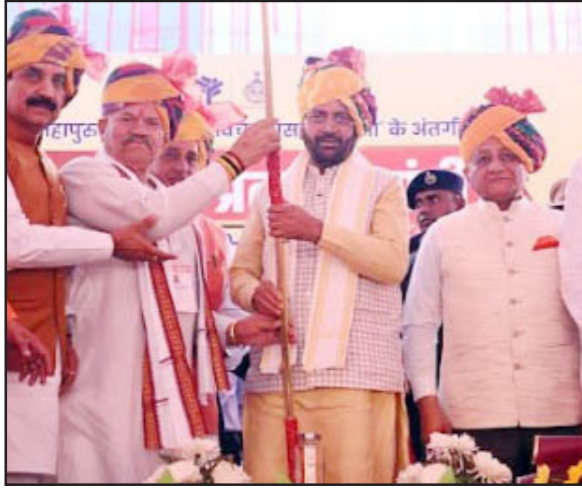
ਚੰਡੀਗੜ੍ਹ, 20 ਮਈ - ਕੌਮੀ ਪਤ੍ਰਿਕਾ ਵਿਭਾਗ