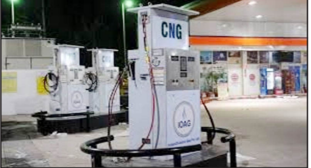
ਨਵੀਂ ਦਿੱਲੀ, 20 ਮਈ - ਕੌਮੀ ਪਤ੍ਰਿਕਾ ਵਿਭਾਗ

ਦਿੱਲੀ ਅਤੇ ਇਸ ਦੇ ਨਾਲ ਲੱਗਦੇ ਨੈਸ਼ਨਲ ਕੋਪੀਟਲ ਰੀਜਨ (ਐੱਨ ਸੀ ਐੱਨ) ਵਿੱਚ ਅੱਜ ਕੇਂਦਰੀ ਪੁਰਬ ਵਿੱਚ ਰੁਠਾ 80.09 ਰੁਪਏ ਪ੍ਰਤੀ ਕਿਲੋ ਹੋਵੇਗਾ। ਮੁੱਖ ਮੰਤਰੀ ਨੇ ਕਿਹਾ ਕਿ ਇਹ ਰੁਠਾ 80.09 ਰੁਪਏ ਪ੍ਰਤੀ ਕਿਲੋ ਹੋਵੇਗਾ। ਮੁੱਖ ਮੰਤਰੀ ਨੇ ਕਿਹਾ ਕਿ ਇਹ ਰੁਠਾ 80.09 ਰੁਪਏ ਪ੍ਰਤੀ ਕਿਲੋ ਹੋਵੇਗਾ। ਮੁੱਖ ਮੰਤਰੀ ਨੇ ਕਿਹਾ ਕਿ ਇਹ ਰੁਠਾ 80.09 ਰੁਪਏ ਪ੍ਰਤੀ ਕਿਲੋ ਹੋਵੇਗਾ।