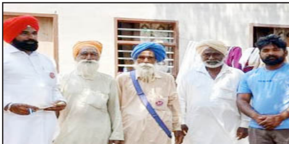
ਰਤੋਆ, 20 ਮਈ - ਕੌਮੀ ਪਤ੍ਰਿਕਾ ਵਿਭਾਗ

ਦਿਹਾਤੀ ਮਜ਼ਦੂਰ ਸਭਾ ਹਰਿਆਣਾ ਦੇ ਪਿੰਡ ਹੋਲੋਲੀ ਵਿੱਚ ਸੰਪਰਕ ਸੁਠਿਕ ਦੌਰਾਨ ਪਿੰਡ ਦੇ ਮਜ਼ਦੂਰਾਂ ਨਾਲ ਮੀਟਿੰਗ ਕਰ ਕੇ ਉਨ੍ਹਾਂ ਦੀਆਂ ਸਮੱਸਿਆਵਾਂ ਸੁਣੀਆਂ ਅਤੇ ਮਹਾਨਰੇਗਾ ਸਬੰਧਿਤ ਅਤੇ ਰਾਜ ਸਰਕਾਰ ਦੀਆਂ ਨੀਤੀਆਂ ਦਾ ਵਿਰੋਧ ਕੀਤਾ। ਆਗੂਆਂ ਨੇ ਦੇਸ਼ ਲਾਇਆ ਕਿ ਪਿੰਡ ਦੇ ਵੱਡੇ ਗਿਣਤੀ ਵਿੱਚ ਮਜ਼ਦੂਰਾਂ ਦੇ ਰਾਸ਼ਨ ਕਾਰਡ ਕੱਟ ਦਿੱਤੇ ਗਏ ਹਨ, ਜਿਸ ਨਾਲ ਗਰੀਬ ਪਰਿਵਾਰਾਂ ਦੇ ਸਾਹਮਣੇ ਰੋਟੀ-ਰੋਜ਼ੀ ਦਾ ਸੈਂਕੜਾ ਪੈ ਰਿਹਾ ਹੈ।