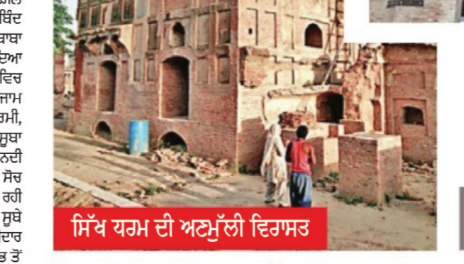
ਸਿੱਖ ਧਰਮ ਦੀ ਅਣਮੁੱਲੀ ਵਿਰਾਸਤ

ਦੀਵਾਨ ਟੋਡਰ ਮੱਲ ਜੀ ਦਾ ਜਨਮ ਸੁਧਮਾ ਪਿੰਡ ਵਿਖੇ 1704 ਈਸਵੀ ਨੂੰ ਵਰਤਿਆ। ਸੁਧਮਾ ਸਰਹਿੰਦ ਨੇ ਤਿਨ ਪਾਵਨ ਦੋਹਾਂ ਨੂੰ ਨਾਲ ਵਗਰੀ ਹੋਲਲਾ ਨਹੀਂ ਕੋਲ ਸੁਣਵਾ ਦਿੱਤਾ। ਮੁਗਲ ਹਕੂਮਤ ਦੀ ਬਾਲਮਾਨਾ ਸੈਰ ਦੀ ਦਰਿਸ਼ਤ ਕਾਰਨ ਸਮਕਾਲ ਲਈ ਥਾਂ ਨਹੀਂ ਸੀ ਮਿਲ ਰਹੀ ਪਰ ਦੀਵਾਨ ਟੋਡਰ ਮੱਲ ਜੀ ਨੇ ਆਪਣੀ ਪ੍ਰਬੰਧ ਨਾਲ ਸੁਧੇ ਤੇ ਆਗਿਆ ਲਈ। ਚੌਥਰੀ ਅੱਤਾ ਨਾ ਦੇ ਇਕ ਜ਼ਮੀਨਦਾਰ ਤੋਂ ਜ਼ਮੀਨ ਖ਼ਰੀਦੀ ਜੋ ਦੁਨੀਆ ਭਰ ਦੀ ਜ਼ਮੀਨ ਵਿੱਚੋਂ ਸਭ ਤੋਂ ਮਹਿੰਗੇ ਮੁੱਲ ਦੀ ਜ਼ਮੀਨ ਹੋ ਠਿੱਠੀ। ਸਮਕਾਲ ਕਰਨ ਲਈ ਲੋੜੀਂਦੀ ਜ਼ਮੀਨ ਉੱਤੇ ਦੀਵਾਨ ਨੇ ਖੜਵਾਂ ਦਾਅ ਸੋਨੇ ਦੀਆਂ ਅਸਥੀਆਂ (ਸੋਧਰਾਂ) ਚਿਟ-ਚਿਟ ਕੇ ਉਸ ਜ਼ਮੀਨ ਦੀ ਕੀਮਤ ਅਦਾ ਕੀਤੀ। ਦੀਵਾਨ ਟੋਡਰ ਮੱਲ ਨੇ ਉਹ ਜ਼ਮੀਨ ਕੀ ਖ਼ਰੀਦੀ ਸ਼ਹਿਰੀ ਸਿੱਖ ਕੌਮ ਨੂੰ ਬਿਨਾਂ ਮੁੱਲ ਖ਼ਰੀਦ ਲਿਆ। ਜਿੱਥੇ ਸਾਹਿਬਜ਼ਾਦਿਆਂ ਤੇ ਮਾਤਾ ਜੀ ਦਾ ਅੰਤਮ ਸਮਕਾਲ ਕੀਤਾ ਗਿਆ ਉਸ ਸਥਾਨ 'ਤੇ ਗੁਰਦੁਆਰਾ ਜੋਤੀ ਸੁਧਮ ਸਾਹਿਬ ਸੁਰਾਇਮਾਨ ਹੈ।