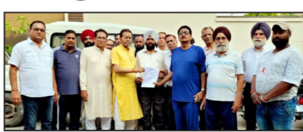
ਸ਼ਿਕਾਇਤ ਕੀਤੀ ਗਈ, ਨਗਰ ਨਿਗਮ ਨੂੰ ਬੇਨਤੀ ਕੀਤੀ ਗਈ, ਇੰਪ੍ਰੂਵਮੈਂਟ ਟਰਸਟ ਨੂੰ ਵੀ ਇਸ ਬਾਰੇ ਦੱਸਿਆ ਗਿਆ। ਪਰ ਸਬਿਤੀ ਜਿਊਰੀ ਦੀ ਤਿਉਂ ਬਣੀ ਹੋਈ ਹੈ। ਇਹ ਗੱਡੀਆਂ ਮੋੜ ਉੱਤੇ ਲੱਗੀਆਂ ਹਨ ਜਿਸ ਨਾਲ ਇਹ ਮੋੜ ਆਨਾ ਮੋੜ ਹੋ ਜਾਂਦਾ ਹੈ। ਤੇ ਆਏ ਦਿਨ ਇੱਥੇ ਆਕਸੀਡੈਂਟ ਹੁੰਦੇ ਹਨ। ਇਸ ਤੋਂ ਦਿਲਾਵਾ ਸਕੂਲ ਬੱਚਾਂ, ਅੱਠੀ ਸੰਸਕਾਰ ਵੈਨ ਅਤੇ ਆਣ ਜਾਣ ਵਾਲੇ ਰਾਹਗੀਰਾਂ ਨੂੰ ਵੀ ਖਾਸੀ ਚਿੰਤਕ ਦਾ ਸਾਹਮਣਾ ਕਰਨਾ ਪੈਂਦਾ ਹੈ। ਇਸ ਦੇ ਨਾਲ ਹੀ ਮਾਰਕੀਟ

ਪਟਿਆਲਾ, 9 ਮਈ - ਕੌਮੀ ਪੱਤ੍ਰਿਕਾ ਬਿਊਰੋ- ਪਟਿਆਲਾ ਸ਼ਹਿਰ ਦੇ ਪੱਥ ਦਿਲਾਕੇ 33 ਫੁੱਟੀ ਰੋਡ ਨਿਊ ਬਿਸ਼ਨ ਨਗਰ, ਐਸਐਸਟੀ ਨਗਰ ਵਿੱਚ ਅੱਜ ਕਲੋਨੀ ਨਿਵਾਸੀਆਂ ਅਤੇ ਦੁਕਾਨਦਾਰਾਂ ਵੱਲੋਂ ਸਾਝੇ ਤੌਰ 'ਤੇ ਇੱਕ ਹੱਗਮੀ ਮੀਟਿੰਗ ਕੀਤੀ ਗਈ ਇਸ ਮੀਟਿੰਗ ਵਿੱਚ ਪੱਤਰਕਾਰਾਂ ਨਾਲ ਗੱਲਬਾਤ ਕਰਦਿਆਂ ਕਲੋਨੀ ਦੇ ਪ੍ਰਧਾਨ ਨੇ ਦੱਸਿਆ ਇਸ ਦਿਲਾਕੇ ਵਿੱਚ ਇੱਕ ਵਿਅਕਤੀ ਜਿਸ ਦਾ ਕਬਾੜ ਦਾ ਕੰਮ ਹੈ। ਉਹ ਰਹਿ ਰਿਹਾ ਹੈ ਜਿਸ ਵੱਲੋਂ ਇਲਾਕੇ ਦੀ ਸੜਕ ਉੱਤੇ ਨਵੀਂ ਗੱਡੀਆਂ ਡਰ ਤੋਂ ਕਬਾੜ ਵਾਲੀਆਂ ਲਾਵਾਰਿਸ ਗੱਡੀਆਂ ਲਿਆ ਕੇ ਸੁੱਟ ਦਿੱਤੀਆਂ ਹਨ। ਵਾਰ ਵਾਰ ਪ੍ਰਧਾਨ, ਅੰਜੀ ਸੋਝੇ ਸਨ ਅਤੇ ਮਹੱਲਾ ਨਿਵਾਸੀਆਂ ਤੋਂ ਦੁਕਾਨਦਾਰਾਂ ਨੂੰ ਖੋਲ੍ਹਣ ਦੀ ਆਹਿਦ ਵਾਲੀ ਗੱਡੀਆਂ ਚੱਕਣ ਨੂੰ ਤਿਆਰ ਨਹੀਂ। ਇਸ ਸੰਦਰਭ 'ਤੇ ਵਿੱਚ ਪੁਲਿਸ ਕੋਲ