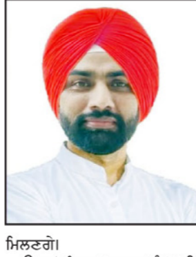
ਉਹਨਾਂ ਪੰਜਾਬ ਸਰਕਾਰ ਨੂੰ ਅਪੀਲ ਕੀਤੀ ਕਿ ਨੌਜਵਾਨਾਂ ਦੇ ਹੁਨਰ ਵਿਕਾਸ ਅਤੇ ਆਤਮਨਿਰਭਰਤਾ ਲਈ ਇਸ ਮੰਗ 'ਤੇ ਜਲਦ ਸਕਾਰਾਤਮਕ ਫੈਸਲਾ ਲਿਆ ਜਾਵੇ।