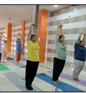
ਲੁਧਿਆਣਾ ਵਿੱਚ 725 ਥਾਵਾਂ 'ਤੇ ਯੋਗ ਸੈਸ਼ਨਾਂ ਦਾ ਸ਼ੁਰੂਆਤੀ ਮੁਹਿੰਮ ਦਾ ਹਿੱਸਾ ਵਜੋਂ ਨੌਜਵਾਨਾਂ ਨੂੰ ਸਿਹਤਮੰਦ ਜੀਵਨ ਦੇ ਨਾਲ-ਨਾਲ ਆਪਸੀ ਭਾਈਚਾਰੇ ਅਤੇ ਸਾਕਾਰਾਤਮਕ ਜੀਵਨਸ਼ੈਲੀ ਦਾ ਲਾਭ ਮਿਲ ਰਿਹਾ ਹੈ।

ਲੁਧਿਆਣਾ, 9 ਮਈ - ਕੌਮੀ ਪੱਤ੍ਰਿਕਾ ਬਿਊਰੋ- ਪੰਜਾਬ ਸਰਕਾਰ ਵੱਲੋਂ ਨੌਜਵਾਨਾਂ ਲਈ ਬਣਾਈ ਜਾ ਰਹੀ ਮੁਹਿੰਮ ਦੇ ਤਹਿਤ 'ਸੀਐਮ ਦੀ ਯੋਗਸ਼ਾਲਾ' ਪ੍ਰੋਜੈਕਟ ਲੋਕਾਂ ਲਈ ਵਰਦਾਨ ਸਾਬਤ ਹੋ ਰਿਹਾ ਹੈ। ਜਿਲ੍ਹਾ