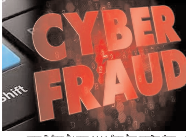
ਵਾਧਾ ਹੋ ਰਿਹਾ ਹੈ। ਸਾਲ 2023 ਵਿੱਚ ਹੋਲਪਲਾਈਨ ਨੰਬਰ 'ਤੇ 96 ਲੱਖ 40 ਹਜ਼ਾਰ ਸ਼ਿਕਾਇਤਾਂ ਨੂੰ ਲੈ ਕੇ ਕਾਲਾਂ ਆਈਆਂ, ਉਦੋਂ ਹੀ 2024 ਵਿੱਚ ਇਹ ਵਧ ਕੇ 2 ਕਰੋੜ 21 ਲੱਖ ਤੱਕ ਪਹੁੰਚ ਗਈ ਅਤੇ 2025 ਵਿੱਚ ਤਾਂ ਇਹ ਅੰਕੜਾ 3 ਕਰੋੜ 24 ਲੱਖ ਤੱਕ ਜਾ ਪਹੁੰਚਿਆ। ਜਦੋਂ ਕਿ 2026 ਦੇ ਪਹਿਲੇ ਮਹੀਨੇ ਵਿੱਚ ਹੀ 25 ਲੱਖ ਦੇ ਕਰੀਬ ਸ਼ਿਕਾਇਤਾਂ ਮਿਲੀਆਂ। ਸਾਲ 2024 ਵਿੱਚ ਇਨ੍ਹਾਂ ਕਾਲਾਂ ਵਿੱਚ ਕਰੀਬ

130 ਫੀਸਦੀ ਦਾ ਵਾਧਾ ਹੋਇਆ, ਬੇਸ਼ੱਕ ਸਾਲ 2025 ਵਿੱਚ 23-24 ਦੇ ਮੁਕਾਬਲੇ ਘੱਟ ਵਾਧਾ ਹੋਇਆ, ਪਰ ਅਧਿਕਾਰੀਆਂ ਦਾ ਮੰਨਣਾ ਹੈ ਕਿ ਵਧ ਰਹੀ ਕਾਲਾਂ ਦੀ ਗਿਣਤੀ ਚਿੰਤਾਜਨਕ ਹੈ। ਹਰ ਰੋਜ਼ ਵਧ ਰਹੀਆਂ ਸ਼ਿਕਾਇਤਾਂ ਡਿਜੀਟਲ ਇੰਡੀਆ ਲਈ ਵੀ ਨੁਕਸਾਨਦਾਇਕ ਹਨ। ਦੇਖਿਆ ਜਾਵੇ ਤਾਂ ਅੰਕੜਿਆਂ ਅਨੁਸਾਰ ਸਾਲ 2023 ਵਿੱਚ ਹਰ ਰੋਜ਼ 26,411 ਕਾਲਾਂ ਅਤੇ ਸਾਲ 2024 ਵਿੱਚ ਇਨ੍ਹਾਂ ਦੀ ਗਿਣਤੀ ਦੁੱਗਣੀ ਹੋ ਗਈ ਅਤੇ ਸਾਲ 2025 ਵਿੱਚ ਇਹ ਸ਼ਿਕਾਇਤਾਂ ਕਾਲਾਂ 2023 ਦੇ ਅੰਕੜੇ ਤੋਂ ਤਿੰਨ ਗੁਣਾ ਪਾਰ ਹੋ ਗਈਆਂ। ਜਦੋਂ ਕਿ ਸਾਲ 2026 ਵਿੱਚ ਹਰ ਰੋਜ਼ ਆਉਣ ਵਾਲੀਆਂ ਕਾਲਾਂ 70 ਹਜ਼ਾਰ ਦੇ ਕਰੀਬ ਪਹੁੰਚ ਗਈਆਂ। ਸਾਈਬਰ ਅਪਰਾਧ ਹੋਲਪਲਾਈਨ ਨੰਬਰ 1930 ਕੇਂਦਰ ਸਰਕਾਰ ਵੱਲੋਂ ਸਾਈਬਰ ਅਪਰਾਧ ਨੂੰ ਰੋਕਣ ਲਈ ਬਣਾਇਆ ਗਿਆ ਹੈ ਅਤੇ ਇਸ ਨੂੰ ਹਰੇਕ ਰਾਜ ਦੇ ਨਾਲ ਜੋੜਿਆ ਗਿਆ ਹੈ। ਅਧਿਕਾਰੀਆਂ ਦਾ ਮੰਨਣਾ ਹੈ ਕਿ ਸਾਈਬਰ ਅਪਰਾਧ ਨੂੰ ਲੈ ਕੇ ਹੋਲਪਲਾਈਨ 'ਤੇ ਵਧ ਰਹੀਆਂ ਸ਼ਿਕਾਇਤਾਂ ਦਾ ਮੁੱਖ ਕਾਰਨ ਹੈ ਕਿ ਲਗਾਤਾਰ ਸਾਈਬਰ ਅਪਰਾਧਾਂ ਵਿੱਚ ਵਾਧਾ ਹੋ ਰਿਹਾ ਹੈ। ਦੂਜੇ ਪਾਸੇ ਸਰਕਾਰ ਵੱਲੋਂ ਲੋਕਾਂ ਨੂੰ ਇਨ੍ਹਾਂ ਅਪਰਾਧਾਂ ਤੋਂ ਬਚਣ ਲਈ ਜਾਗਰੂਕ ਕੀਤਾ ਜਾ ਰਿਹਾ ਹੈ। ਲੋਕਾਂ ਨੂੰ ਜਾਗਰੂਕ ਕੀਤਾ ਗਿਆ ਹੈ ਕਿ ਜਿਵੇਂ ਹੀ ਕੋਈ ਸਾਈਬਰ ਅਪਰਾਧ ਹੁੰਦਾ ਹੈ ਤਾਂ ਤੁਰੰਤ ਇਸ ਦੀ ਸੂਚਨਾ 1930 'ਤੇ ਦਿੱਤੀ ਜਾਵੇ, ਜਿਸ ਨਾਲ ਬੈਕਿੰਗ ਫਰਾਡ ਜਾਂ ਆਨਲਾਈਨ ਚੋਟੀ ਵਾਲੇ ਨੁਕਸਾਨਾਂ ਨੂੰ ਬਚਿਆ ਜਾ ਸਕਦਾ ਹੈ।