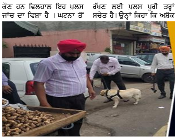
ਕੌਣ ਹਨ ਫਿਰਲਾਲ ਇਹ ਪੁਲਸ ਜਾਂਚ ਦਾ ਵਿਸ਼ਾ ਹੈ। ਘਟਨਾ ਤੋਂ ਰੱਖਣ ਲਈ ਪੁਲਸ ਪੂਰੀ ਤਰ੍ਹਾਂ ਸਚੇਤ ਹੈ। ਉਨ੍ਹਾਂ ਕਿਹਾ ਕਿ ਅੰਕਿਕ ਚਿਪ ਸੈਂਟਰ ਦੇ ਬਾਹਰ ਮਿਲੇ ਗੁਨੇਡ ਮਾਮਲੇ ਦੀ ਗਹਿਰਾਈ ਨਾਲ ਜਾਂਚ ਕੀਤੀ ਜਾ ਰਹੀ ਹੈ ਅਤੇ ਸਾਰੇ ਸੰਬੰਧਿਤ ਪੱਖਾਂ ਨੂੰ ਖੋਲ੍ਹਿਆ ਜਾ ਰਿਹਾ ਹੈ। ਉਨ੍ਹਾਂ ਦੁਕਾਨਦਾਰਾਂ ਨੂੰ ਅਪੀਲ ਕੀਤੀ ਕਿ ਉਹ ਆਪਣਾ ਸਮਾਨ ਦੁਕਾਨਾਂ ਦੇ ਅੰਦਰ ਹੀ ਰੱਖਣ ਅਤੇ ਬਾਜ਼ਾਰਾਂ ਵਿੱਚ

ਮਾਹੌਲ ਬਣ ਗਿਆ ਸੀ। ਘਟਨਾ ਦੀ ਜਾਣਕਾਰੀ ਮਿਲਦੇ ਹੀ ਪੁਲਸ ਪੁਸ਼ਾਸਨ ਤੁਰੰਤ ਮੌਕੇ 'ਤੇ ਪਹੁੰਚਿਆ ਅਤੇ ਪੁਰੇ ਇਲਾਕੇ ਨੂੰ ਚਾਰਾਂ ਪਾਸਿਆਂ ਤੋਂ ਸੀਲ ਕਰ ਦਿੱਤਾ ਗਿਆ। ਸੁਰੱਖਿਆ ਦੇ ਮੰਦੋਨਜ਼ਰ ਪੁਲਸ ਵੱਲੋਂ ਬਾਜ਼ਾਰ ਨੂੰ ਬੰਦ ਕਰਵਾਇਆ ਗਿਆ ਅਤੇ ਬੰਬ ਨਿਰੋਧਕ ਦਸਤਾ ਨੂੰ ਮੌਕੇ 'ਤੇ ਸੌਂਦਿਆ ਗਿਆ। ਟੀਮ ਨੇ ਦੋਵੇਂ ਗੁਨੇਡਾਂ ਨੂੰ ਆਪਣੇ ਕਬਜ਼ੇ ਵਿੱਚ ਲੈ ਕੇ ਸੁਰੱਖਿਅਤ ਢੰਗ ਨਾਲ ਹਟਾ ਦਿੱਤਾ। ਫਿਰ ਪੁਲਸ ਵੱਲੋਂ ਮਾਮਲੇ ਦੀ ਹਰ ਪੱਖ ਤੋਂ ਜਾਂਚ ਕੀਤੀ ਜਾ ਰਹੀ ਹੈ ਅਤੇ ਇਹ ਪਤਾ ਲਗਾਉਣ ਦੀ ਕੋਸ਼ਿਸ਼ ਕੀਤੀ ਜਾ ਰਹੀ ਹੈ ਕਿ ਇਹ ਗੁਨੇਡ ਉਥੇ ਸੁੱਟੇ ਕਿਨੇ। ਇਸ ਮਾਮਲੇ 'ਚ ਪੁਲਸ ਦੇ ਹੱਥ ਸੀਸੀਟੀਵੀ ਵੀ ਲੱਗੀ ਹੈ, ਜਿਸ ਨਾਲ ਖੁਦਸ਼ਾ ਜਤਾਇਆ ਜਾ ਰਿਹਾ ਹੈ ਕਿ ਮੋਟਰਸਾਈਕਲ ਸਵਾਰ 2 ਨੌਜਵਾਨ ਉਕਤ ਗੁਨੇਡ ਦੁਕਾਨ ਦੇ ਬਾਹਰ ਸੁੱਟ ਗਏ। ਇਹ ਨੌਜਵਾਨ