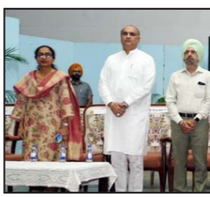
ਪਟਿਆਲਾ, 4 ਅਪ੍ਰੈਲ - ਸ਼੍ਰੀ ਗੁਰੂ ਰਵਿਦਾਸ ਜੀ ਦੇ 650 ਸਾਲ ਪ੍ਰਕਾਸ਼ ਪੁਰਬ ਨੂੰ ਵੱਡੀ ਪੱਧਰ 'ਤੇ ਮਨਾਉਣ ਲਈ ਪੰਜਾਬ ਸਰਕਾਰ ਵੱਲੋਂ ਮੁੱਖ ਮੰਤਰੀ ਭਗਵੰਤ ਸਿੰਘ ਮਾਨ ਦੀ ਅਗਵਾਈ ਹੇਠ ਉਲੀਕੇ ਪ੍ਰੋਗਰਾਮਾਂ ਦੀ ਲੜੀ ਤਹਿਤ ਅੱਜ ਸ਼੍ਰੀ ਗੁਰੂ ਰਵਿਦਾਸ ਜੀ ਦੀ ਬਾਣੀ ਅਤੇ ਸਮਾਜਿਕ ਸਮਾਨਤਾ ਦੇ ਦਿੱਤੇ ਸੰਕਲਪ ਉੱਤੇ ਸ਼੍ਰੀ ਗੁਰੂ ਰਵਿਦਾਸ ਜੀ ਦੇ ਅਗਵਾਈ ਹੇਠ ਵਿਚਾਰ ਚਰਚਾ ਕਰਨ ਦੀ ਸ਼ੁਰੂਆਤ ਪੰਜਾਬੀ ਯੂਨੀਵਰਸਿਟੀ ਪਟਿਆਲਾ ਤੋਂ ਕੀਤੀ ਗਈ।

ਪਟਿਆਲਾ, 4 ਅਪ੍ਰੈਲ - ਸ਼੍ਰੀ ਗੁਰੂ ਰਵਿਦਾਸ ਜੀ ਦੇ 650 ਸਾਲ ਪ੍ਰਕਾਸ਼ ਪੁਰਬ ਨੂੰ ਵੱਡੀ ਪੱਧਰ 'ਤੇ ਮਨਾਉਣ ਲਈ ਪੰਜਾਬ ਸਰਕਾਰ ਵੱਲੋਂ ਮੁੱਖ ਮੰਤਰੀ ਭਗਵੰਤ ਸਿੰਘ ਮਾਨ ਦੀ ਅਗਵਾਈ ਹੇਠ ਉਲੀਕੇ ਪ੍ਰੋਗਰਾਮਾਂ ਦੀ ਲੜੀ ਤਹਿਤ ਅੱਜ ਸ਼੍ਰੀ ਗੁਰੂ ਰਵਿਦਾਸ ਜੀ ਦੀ ਬਾਣੀ ਅਤੇ ਸਮਾਜਿਕ ਸਮਾਨਤਾ ਦੇ ਦਿੱਤੇ ਸੰਕਲਪ ਉੱਤੇ ਸ਼੍ਰੀ ਗੁਰੂ ਰਵਿਦਾਸ ਜੀ ਦੇ ਅਗਵਾਈ ਹੇਠ ਵਿਚਾਰ ਚਰਚਾ ਕਰਨ ਦੀ ਸ਼ੁਰੂਆਤ ਪੰਜਾਬੀ ਯੂਨੀਵਰਸਿਟੀ ਪਟਿਆਲਾ ਤੋਂ ਕੀਤੀ ਗਈ। ਇਸ ਮੌਕੇ ਮੁੱਖ ਮਹਿਮਾਨ ਵਜੋਂ ਸ਼ਿਰਕਤ ਕਰਦਿਆਂ ਦਿੱਲੀ ਦੇ ਸਾਬਕਾ ਉਪ ਮੁੱਖ ਮੰਤਰੀ ਤੇ ਆਮ ਆਦਮੀ ਪਾਰਟੀ ਦੇ ਪੰਜਾਬ ਮਾਮਲਿਆਂ ਦੇ ਇੰਚਾਰਜ ਸ਼੍ਰੀ ਮਨੀਸ਼ ਸਿਸੋਦੀਆ ਨੇ ਦੱਸਿਆ ਕਿ ਸ਼੍ਰੀ ਗੁਰੂ ਰਵਿਦਾਸ ਜੀ ਦੇ ਅਗਵਾਈ ਹੇਠ ਵਿਚਾਰ ਚਰਚਾ ਕਰਨ ਦੀ ਸ਼ੁਰੂਆਤ ਪੰਜਾਬੀ ਯੂਨੀਵਰਸਿਟੀ ਪਟਿਆਲਾ ਤੋਂ ਕੀਤੀ ਗਈ। ਇਸ ਮੌਕੇ ਮੁੱਖ ਮਹਿਮਾਨ ਵਜੋਂ ਸ਼ਿਰਕਤ ਕਰਦਿਆਂ ਦਿੱਲੀ ਦੇ ਸਾਬਕਾ ਉਪ ਮੁੱਖ ਮੰਤਰੀ ਤੇ ਆਮ ਆਦਮੀ ਪਾਰਟੀ ਦੇ ਪੰਜਾਬ ਮਾਮਲਿਆਂ ਦੇ ਇੰਚਾਰਜ ਸ਼੍ਰੀ ਮਨੀਸ਼ ਸਿਸੋਦੀਆ ਨੇ ਦੱਸਿਆ ਕਿ ਸ਼੍ਰੀ ਗੁਰੂ ਰਵਿਦਾਸ ਜੀ ਦੇ ਅਗਵਾਈ ਹੇਠ ਵਿਚਾਰ ਚਰਚਾ ਕਰਨ ਦੀ ਸ਼ੁਰੂਆਤ ਪੰਜਾਬੀ ਯੂਨੀਵਰਸਿਟੀ ਪਟਿਆਲਾ ਤੋਂ ਕੀਤੀ ਗਈ। ਇਸ ਮੌਕੇ ਮੁੱਖ ਮਹਿਮਾਨ ਵਜੋਂ ਸ਼ਿਰਕਤ ਕਰਦਿਆਂ ਦਿੱਲੀ ਦੇ ਸਾਬਕਾ ਉਪ ਮੁੱਖ ਮੰਤਰੀ ਤੇ ਆਮ ਆਦਮੀ ਪਾਰਟੀ ਦੇ ਪੰਜਾਬ ਮਾਮਲਿਆਂ ਦੇ ਇੰਚਾਰਜ ਸ਼੍ਰੀ ਮਨੀਸ਼ ਸਿਸੋਦੀਆ ਨੇ ਦੱਸਿਆ ਕਿ ਸ਼੍ਰੀ ਗੁਰੂ ਰਵਿਦਾਸ ਜੀ ਦੇ ਅਗਵਾਈ ਹੇਠ ਵਿਚਾਰ ਚਰਚਾ ਕਰਨ ਦੀ ਸ਼ੁਰੂਆਤ ਪੰਜਾਬੀ ਯੂਨੀਵਰਸਿਟੀ ਪਟਿਆਲਾ ਤੋਂ ਕੀਤੀ ਗਈ।