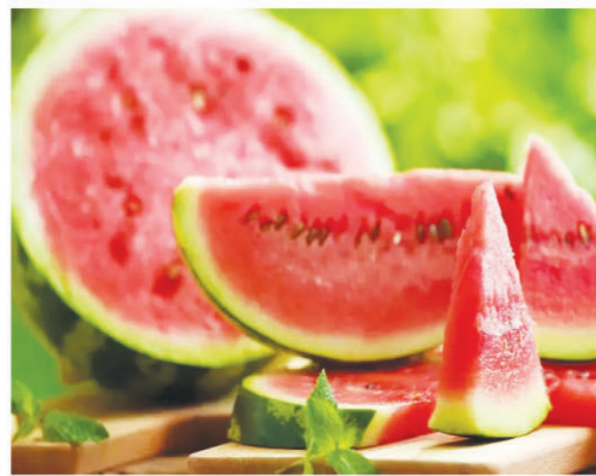
ਕਿਉਂਕਿ ਇਸ 'ਚ ਕੋਲੀਨ ਪਾਇਆ ਜਾਂਦਾ ਹੈ। ਇਸ ਨੂੰ ਖਾਣ ਨਾਲ ਮੋਟਾਪਾ ਘੱਟ ਹੁੰਦਾ ਹੈ। ਪੂਰੀ ਨੀਂਦ ਮਿਲਦੀ ਹੈ ਅਤੇ ਯਾਦਦਾਸ਼ਤ ਤੇਜ਼ ਹੁੰਦੀ ਹੈ। ਚਮੜੀ ਅਤੇ ਵਾਲਾਂ ਲਈ ਲਾਭਦੇਂਦ