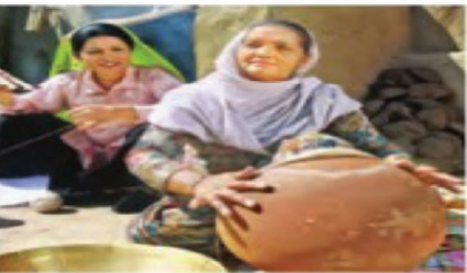
ਦੀਆਂ ਕਹਾਣੀਆਂ ਸੁਣਾਉਣ ਲੱਗਦੀ ਤਾਂ ਅੱਧੀ-ਅੱਧੀ ਰਾਤ ਤਕ ਕਹਾਣੀਆਂ ਸੁਣਾਈ ਜਾਂਦੀ। ਸਵੇਰੇ ਚਾਰ ਵਜੇ ਉੱਠਣਾ ਗੁਰੂ ਘਰ ਮੱਥਾ ਟੇਕਣਾ ਤੇ ਫਿਰ

ਵਿਚ ਇਨ੍ਹਾਂ ਦੀ ਪੂਰੀ ਚਲਦੀ ਹੁੰਦੀ ਸੀ। ਘਰ ਦਾ ਕੋਈ ਵੀ ਮੈਂਬਰ ਉਸ ਦੀ ਸਲਾਹ ਤੋਂ ਬਿਨਾਂ ਕੋਈ ਕੰਮ ਨਹੀਂ ਸੀ ਕਰਦਾ। ਵਿਆਹ ਦਾ ਕੱਪੜਾ ਖਰੀਦਣਾ ਹੋਵੇ, ਸੌਂਸ ਦਾ ਕਿਰਾ ਜਿਹਾ ਸੁਟ, ਸਹੁਰੇ ਦਾ ਕਿਰਾ ਜਿਹਾ ਕੱਬਲ ਸਭ ਕੁਝ ਉਸ ਦੀ ਸਲਾਹ ਨਾਲ ਹੋਣਾ। ਕਿਸੇ ਦੇ ਮੁੰਡਾ ਜੰਮ ਪਏ ਖੁਸਰਿਆ ਨੂੰ ਕਿਨ੍ਹੇ ਪੰਜੇ ਦੇਣੇ, ਚੌਕੇ ਤੋਂ ਕੀ ਕੁਝ ਕਰਨਾ, ਛੋਟੀਆਂ-ਛੋਟੀਆਂ ਗੱਲਾਂ ਵੀ ਉਸ ਤੋਂ ਪੁੱਛੀਆਂ ਜਾਂਦੀਆਂ ਸਨ। ਰਾਤ ਦੇ ਅੱਠ ਵਜੇ ਦੇ ਤਾਂ ਗਲੀ ਦੇ ਸਾਰੇ ਬੱਚੇ ਬੇਬੇ ਦੇ ਦੁਆਲੇ ਹੋ ਜਾਂਦੇ। ਕਹਾਣੀ ਸੁਣਾ ਤੇ ਬੇਬੇ ਬਹਿ ਜਾਂਦੀ। ਫਿਰ ਰਾਜੇ ਰਾਣੀਆਂ