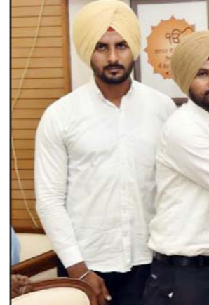
ਚੀਮਾ ਨੇ ਪੰਜਾਬ ਸਟੇਟ ਪਾਵਰ ਕਾਰਪੋਰੇਸ਼ਨ ਲਿਮਿਟਿਡ (ਪੀ.ਐਸ.ਪੀ. ਸੀ.ਐੱਲ.) ਅਤੇ ਪੰਜਾਬ ਸਟੇਟ ਟ੍ਰਾਂਸਮਿਸ਼ਨ ਕਾਰਪੋਰੇਸ਼ਨ ਲਿਮਿਟਿਡ (ਪੀ.ਐਸ.ਟੀ.ਸੀ.ਐੱਲ.) ਨੂੰ ਵੀ ਨਿਰਦੇਸ਼ ਦਿੱਤੇ ਕਿ ਪਾਵਰਕੌਮ ਐਂਡ ਟ੍ਰਾਂਸਕੋ ਨੇਕਾ ਮੁਲਾਜ਼ਮ ਯੂਨੀਅਨ ਦੀਆਂ ਮੰਗਾਂ ਦੇ ਹੱਲ ਲਈ ਇੱਕ ਨੌਜ ਨੀਤੀ ਬਣਾਈ ਜਾਵੇ। ਆਸ਼ਾ ਵਰਕਰ ਐਂਡ ਟ੍ਰਾਂਸਕੋ ਨੇਕਾ ਮੁਲਾਜ਼ਮ ਯੂਨੀਅਨ ਸਮੇਤ ਵੱਖ-ਵੱਖ ਮੁਲਾਜ਼ਮ ਜਥੇਬੰਦੀਆਂ ਦੇ ਵਕਲਾ ਨਾਲ ਚਰਚਾ ਕਰਦਿਆਂ, ਵਿੱਤ ਮੰਤਰੀ ਹਰਪਾਲ ਸਿੰਘ

ਚੰਡੀਗੜ੍ਹ, 24 ਅਪ੍ਰੈਲ - ਕੌਮੀ ਪੱਤਰਕਾਰ ਬਿਊਰੋ - ਪੰਜਾਬ ਦੇ ਜ਼ਮੀਨੀ ਪੱਧਰ 'ਤੇ ਕੰਮ ਕਰ ਰਹੇ ਜ਼ਰੂਰੀ ਸਿਹਤ ਸੰਭਾਲ ਕਾਰਮੀਆਂ ਦੀ ਭਲਾਈ ਲਈ ਇੱਕ ਅਹਿਮ ਕਦਮ ਚੁੱਕਦਿਆਂ, ਮੁਲਾਜ਼ਮਾਂ ਦੇ ਮਸਲਿਆਂ ਨੂੰ ਹੱਲ ਕਰਨ ਲਈ ਬਣਾਈ ਗਈ ਕੋਵਿਡ ਸਬ-ਕਮੇਟੀ ਦੇ ਚੇਅਰਮੈਨ ਅਤੇ ਵਿੱਤ ਮੰਤਰੀ ਪੰਜਾਬ ਸਰਕਾਰ ਸਿੰਘ ਚੀਮਾ ਨੇ ਅੱਜ ਇੱਕ ਸਿਹਤ ਅਤੇ ਪਰਿਵਾਰ ਭਲਾਈ ਵਿਭਾਗ ਨੂੰ ਨਿਰਦੇਸ਼ ਦਿੱਤਾ ਕਿ ਉਹ ਆਸ਼ਾ ਵਰਕਰਾਂ ਅਤੇ ਫੈਸਲੀਟੇਟਰਾਂ ਨੂੰ ਦਿੱਤੇ ਜਾਂਦੇ ਮਾਣ ਭੱਤਿਆਂ (ਇਨਸੈਂਟਿਵ) ਵਿੱਚ ਜ਼ਰੂਰੀ ਵਾਧੇ ਦੀ ਵਕਾਲਤ ਕਰਦੇ ਹੋਏ ਕੇਂਦਰ ਸਰਕਾਰ ਨੂੰ ਅਧਿਕਾਰਤ ਤੌਰ 'ਤੇ ਪੱਤਰ ਲਿਖਣ। ਵਿੱਤ ਮੰਤਰੀ ਨੇ ਜ਼ੋਰ ਦੇ ਕੇ ਕਿਹਾ ਕਿ ਕੇਂਦਰ ਸਰਕਾਰ ਨੂੰ ਮੌਜੂਦਾ ਸਕੀਮ ਤਹਿਤ ਇਨ੍ਹਾਂ ਭੁਗਤਾਨ ਨੂੰ ਵਧਾਉਣ ਲਈ ਅਪੀਲ ਕੀਤੀ ਜਾਣੀ ਚਾਹੀਦੀ ਹੈ, ਜੋ ਕਿ ਕੇਂਦਰ ਅਤੇ ਸੂਬੇ ਦਰਮਿਆਨ 60:40 ਦੇ ਵਿੱਤੀ ਅਨੁਪਾਤ 'ਤੇ ਕੰਮ ਕਰਦੀ ਹੈ। ਆਸ਼ਾ ਵਰਕਰ ਐਂਡ ਫੈਸਲੀਟੇਟਰਜ਼ ਸਾਂਝਾ ਮੌਰਚਾ, ਪਾਵਰਕੌਮ ਐਂਡ ਟ੍ਰਾਂਸਕੋ ਨੇਕਾ ਮੁਲਾਜ਼ਮ ਯੂਨੀਅਨ ਅਤੇ ਪੰਜਾਬ ਪੁਲਿਸ ਕੌਰਨਾ ਆਸ਼ਾ ਵਰਕਰ ਐਂਡ ਟ੍ਰਾਂਸਕੋ ਨੇਕਾ ਮੁਲਾਜ਼ਮ ਯੂਨੀਅਨ ਸਮੇਤ ਵੱਖ-ਵੱਖ ਮੁਲਾਜ਼ਮ ਜਥੇਬੰਦੀਆਂ ਦੇ ਵਕਲਾ ਨਾਲ ਮੀਟਿੰਗਾਂ ਦੀ ਪ੍ਰਧਾਨਗੀ ਕਰਦਿਆਂ ਵਿੱਤ ਮੰਤਰੀ