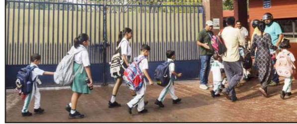
ਲੁਧਿਆਣਾ ਦੇ ਸਪਰਿੰਗ ਡੌਲ ਸੀਨੀਅਰ ਸੈਕੰਡਰੀ ਸਕੂਲ ਸ਼ੇਰਪੁਰ ਤੋਂ ਡੀਏਵੀ ਸਕੂਲ ਬੀਆਰਐਸ ਨਗਰ ਤੋਂ ਡੀਏਵੀ ਸਕੂਲ ਚੌਥੀ ਵਾਰ ਸੱਤਾ 'ਤੇ ਕਾਬਜ਼ ਹੋਣ ਦੀ ਕੋਸ਼ਿਸ਼ ਵਿੱਚ ਹਨ, ਉਥੇ ਹੀ ਭਾਜਪਾ ਇਸ ਵਾਰ ਵੱਡਾ ਉਲਟਫੇਰ ਕਰਨ ਲਈ ਪੂਰੀ ਵਾਹ ਲਗ ਰਹੀ ਹੈ। ਸੂਬੇ ਭਰ ਵਿੱਚ ਕੇਂਦਰੀ ਨੀਮ ਫੋਜੀ ਬਲਾਂ ਦੀਆਂ ਰਿਕਾਰਡ 2,450 ਕੰਪਨੀਆਂ ਤਾਇਨਾਤ ਕੀਤੀਆਂ ਗਈਆਂ ਹਨ, ਜਿਨ੍ਹਾਂ ਵਿੱਚ ਲਗਭਗ ਢਾਈ ਲੱਖ ਜਵਾਨ ਲਈ ਪੂਰੀ ਤਰ੍ਹਾਂ ਭਖਿਆ ਹੋਇਆ ਹੈ।