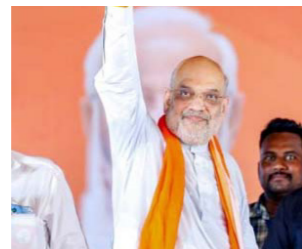
ਘੁਸਪੈਠੀ ਨੂੰ ਸੂਬੇ ਦੀ ਆਰਥਿਕਤਾ ਅਤੇ ਸੁਰੱਖਿਆ ਲਈ ਖ਼ਤਰਾ ਦੱਸਦਿਆਂ ਗ੍ਰਹਿ ਮੰਤਰੀ ਨੇ ਕਿਹਾ ਕਿ ਘੁਸਪੈਠੀਆਂ ਬੰਗਾਲ ਦੇ ਨੌਜਵਾਨਾਂ ਦੀਆਂ ਨੌਕਰੀਆਂ ਅਤੇ ਗਰੀਬਾਂ ਦਾ ਰਾਸ਼ਨ ਖੋਹ ਰਹੇ ਹਨ। ਉਨ੍ਹਾਂ ਦੱਸ ਲਾਇਆ ਕਿ ਇਹ ਅਨਸਰ ਦੇਸ਼ ਦੀ ਸੁਰੱਖਿਆ ਨੂੰ ਵੀ ਖੋਹ ਲਾ ਰਹੇ ਹਨ।

ਬਾਲਾਗੜ੍ਹ (ਪੱਛਮੀ ਬੰਗਾਲ), 24 ਅਪ੍ਰੈਲ - ਕੌਮੀ ਪੱਤਰਕਾਰ ਬਿਊਰੋ - ਕੇਂਦਰੀ ਗ੍ਰਹਿ ਮੰਤਰੀ ਅਮਿਤ ਸ਼ਾਹ ਨੇ ਵੀਰਵਾਰ ਨੂੰ ਪੱਛਮੀ ਬੰਗਾਲ ਦੇ ਹੁਗਲੀ ਜ਼ਿਲ੍ਹੇ ਅਧੀਨ ਪੈਂਦੇ ਬਾਲਾਗੜ੍ਹ ਵਿਖੇ ਇੱਕ ਚੋਣ ਰੋਲੀ ਨੂੰ ਸੰਬੰਧਤ ਕਰਦਿਆਂ ਐਲਾਨ ਕੀਤਾ ਕਿ ਜੇਕਰ ਭਾਜਪਾ ਸੱਤਾ ਵਿੱਚ ਆਉਂਦੀ ਹੈ, ਤਾਂ ਸੂਬੇ ਵਿੱਚ 'ਇੱਕ ਵੀ ਘੁਸਪੈਠੀ' ਨੂੰ ਦਾਖ਼ਲ ਨਹੀਂ ਹੋਣ ਦਿੱਤਾ ਜਾਵੇਗਾ। ਉਨ੍ਹਾਂ ਕਿਹਾ ਕਿ ਬੰਗਾਲ ਵਿੱਚ ਮੌਜੂਦਾ ਗੈਰ-ਕਾਨੂੰਨੀ ਪ੍ਰਵਾਸੀਆਂ ਨੂੰ ਚੁਣ-ਚੁਣ ਕੇ ਬਾਹਰ ਕੱਢਿਆ ਜਾਵੇਗਾ। ਪਹਿਲੇ ਪੜਾਅ ਦੀ ਵੋਟਿੰਗ ਦੌਰਾਨ ਰੋਲੀ ਕਰਦਿਆਂ ਅਮਿਤ ਸ਼ਾਹ ਨੇ ਦਾਅਵਾ ਕੀਤਾ ਕਿ ਭਾਜਪਾ ਸੂਬੇ ਵਿੱਚ ਪੂਰਨ ਬਹੁਮਤ ਨਾਲ ਸਰਕਾਰ