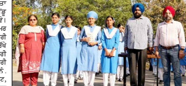
ਪਟਿਆਲਾ, 24 ਅਪ੍ਰੈਲ - ਕੌਮੀ ਪਤ੍ਰਿਕਾ ਬਿਊਰੋ-

ਪੰਜਾਬ ਸਕੂਲ ਸਿੱਖਿਆ ਬੋਰਡ ਵੱਲੋਂ ਐਲਾਨ ਮਾਰਚ 2025-26 ਲਈ ਪੰਜਵੀਂ ਅਤੇ ਅੱਠਵੀਂ ਜਮਾਤ ਦੇ ਨਤੀਜੇ ਵਿੱਚ ਸੀਨੀਅਰ ਸੈਕੰਡਰੀ