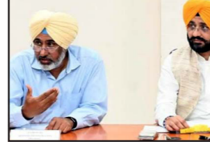
ਵੱਲੋਂ ਦਿੱਤੇ ਜਾਂਦੇ ਲਾਭ ਪ੍ਰਾਪਤ ਕਰਨ ਦੇ ਯੋਗ ਹਨ। ਉਨ੍ਹਾਂ ਅੱਗੇ ਕਿਹਾ ਕਿ ਇਹ ਪਹਿਲਕਦਮੀਆਂ ਸਿਰਫ, ਸਿੱਖਿਆ ਅਤੇ ਸਮਾਜਿਕ ਸੁਰੱਖਿਆ ਸਮੇਤ ਜੀਵਨ ਦੇ ਵੱਖ-ਵੱਖ ਪਹਿਲੂਆਂ ਵਿੱਚ ਕਾਰਮੀਆਂ ਅਤੇ ਉਨ੍ਹਾਂ ਦੇ ਪਰਿਵਾਰਾਂ ਦੀ ਸਹਾਇਤਾ ਕਰਨ ਲਈ ਚਲਾਈ ਗਈਆਂ ਹਨ। ਬੋਰਡ ਵੱਲੋਂ ਚਲਾਈ ਗਈਆਂ ਸਕੀਮਾਂ ਵਿੱਚ ਡਾਕਟਰੀ ਇਲਾਜ ਅਤੇ ਜਨਰਲ ਸਰਜਰੀਆਂ ਲਈ ਵਿੱਤੀ ਸਹਾਇਤਾ, ਐਕਸ-ਗ੍ਰੇਫੀਆ ਗ੍ਰਾਂਟ, ਐਂਟੀਮ ਸੰਸਕਾਰ ਦੇ ਖਰਚੇ, ਐਲ.ਟੀ.ਸੀ., ਜਣੇਪਾ ਲਾਭ ਅਤੇ ਮਾਨਸਿਕ ਸਹਾਇਤਾ ਅਪਗ੍ਰਾਂਟ ਵਾਲੇ ਕਾਰਮੀਆਂ ਲਈ ਸਹਾਇਤਾ ਸ਼ਾਮਲ ਹੈ। ਇਸ ਤੋਂ ਇਲਾਵਾ ਕਾਮੇ ਹੋਰਨਾਂ ਸਕੀਮਾਂ ਦਾ ਲਾਭ ਵੀ ਲੈ ਸਕਦੇ ਹਨ, ਜਿਨ੍ਹਾਂ ਵਿੱਚ ਸ਼ਰਨ ਸਕੀਮ, ਐਨਕਾਂ ਲਗਾਉਣ ਲਈ ਸਹਾਇਤਾ, ਦੋਵਾਂ ਦੀ ਦੇਖਭਾਲ ਅਤੇ ਸੁਣਨ-ਯੋਗਤਾ ਲਈ ਸਹਾਇਤਾ ਦੇ ਨਾਲ-ਨਾਲ ਸਿੱਖਿਆ ਅਤੇ ਅਪਗ੍ਰਾਂਟ ਮੁਆਵਜ਼ੇ ਲਈ ਵੀ ਵੀਡੀਓ ਸਕੀਮਾਂ ਸ਼ਾਮਲ ਹਨ। ਮੰਤਰੀ ਨੇ ਸਰਕਾਰ ਦੀ ਵਚਨਬੱਧਤਾ ਨੂੰ ਦਰਸਾਉਂਦਿਆਂ ਕਿਹਾ ਕਿ ਹਰੇਕ