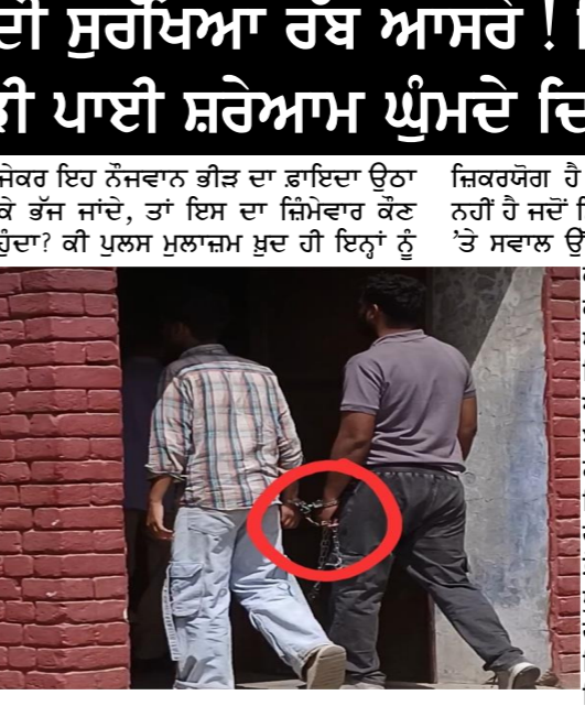
ਭੱਜਣ ਦਾ ਮੌਕਾ ਦੇ ਰਹੇ ਹਨ ਜਾਂ ਫਿਰ ਡਿਊਟੀ ਪੁਲੀ ਇਹ ਘੋਰ ਲਾਪਰਵਾਹੀ ਹੈ? ਇਹ ਹੁਣ ਇੱਕ ਗੰਭੀਰ ਜਾਂਚ ਦਾ ਵਿਸ਼ਾ ਬਣ ਗਿਆ ਹੈ।

ਕੌਮੀ ਪਤ੍ਰਿਕਾ ਲੁਧਿਆਣਾ 22 ਅਪ੍ਰੈਲ। ਸਿਵਲ ਹਸਪਤਾਲ ਤੋਂ ਸੁਰੱਖਿਆ ਵਿਵਸਥਾ ਦੀ ਪੋਲ ਖੋਲ੍ਹਦੀ ਇੱਕ ਅਜਿਹੀ ਤਸਵੀਰ ਸਾਹਮਣੇ ਆਈ ਹੈ, ਜਿਸ ਨੂੰ ਦੇਖ ਕੇ ਹਰ ਕੋਈ ਚੰਗਾ ਹੈ। ਹਸਪਤਾਲ ਕੋਪਲੈਕਸ ਵਿਚ ਦੋ ਨੌਜਵਾਨਾਂ ਨੂੰ ਸ਼ਰੇਆਮ ਹੱਥਕੜੀ ਪਹਿਨੇ ਹੋਏ ਇਕੱਠੇ ਘੁੰਮਦੇ ਦਿਖਾਏ ਗਿਆ। ਹੈਰਾਨੀ ਦੀ ਗੱਲ ਇਹ ਰਹੀ ਕਿ ਇਨ੍ਹਾਂ ਨੌਜਵਾਨਾਂ ਦੇ ਨਾਲ ਇੱਕ ਵੀ ਪੁਲਸ ਮੁਲਾਜ਼ਮ ਨਜ਼ਰ ਨਹੀਂ ਆਇਆ। ਬਿਨਾਂ ਕਿਸੇ ਸੁਰੱਖਿਆ ਘੋਰੇ ਦੇ ਹੱਥਕੜੀ ਲੋਕਾਂ ਨੇ ਨੌਜਵਾਨਾਂ ਦਾ ਇਸ ਤਰ੍ਹਾਂ ਖੁੱਲ੍ਹਾ ਘੁੰਮਣਾ ਪੁਲਸ ਪ੍ਰਸ਼ਾਸਨ ਦੀ ਵੱਡੀ ਲਾਪਰਵਾਹੀ ਵੱਲ ਇਸ਼ਾਰਾ ਕਰ ਰਿਹਾ ਹੈ। ਹਸਪਤਾਲ ਵਿਚ ਮੌਜੂਦ ਲੋਕ ਉਸ ਵਕਤ ਹੋਰਨ ਰਹਿ ਗਏ ਜਦੋਂ ਉਨ੍ਹਾਂ ਨੇ ਇਨ੍ਹਾਂ ਹਵਾਲੀਆਂ ਨੂੰ ਬਿਨਾਂ ਕਿਸੇ ਪਹਿਰੇ ਦੇ ਇੱਧਰ-ਉੱਧਰ ਟਹਿਲਦੇ ਦਿਖਾਏ। ਸਵਾਲ ਇਹ ਉੱਠ ਰਿਹਾ ਹੈ ਕਿ ਆਖ਼ਰ ਕਿੰਨ੍ਹਾਂ ਲਾਪਰਵਾਹ ਪੁਲਸ ਮੁਲਾਜ਼ਮਾਂ ਨੇ ਇਨ੍ਹਾਂ ਮੁਲਜ਼ਮਾਂ ਨੂੰ ਇਸ ਤਰ੍ਹਾਂ ਲਾਵਾਜਿਸ ਛੱਡ ਦਿੱਤਾ? ਜੇਕਰ ਇਹ ਨੌਜਵਾਨ ਭੀੜ ਦਾ ਫਾਇਦਾ ਉਠਾ ਕੇ ਭੱਜ ਜਾਂਦੇ, ਤਾਂ ਇਸ ਦਾ ਜ਼ਿੰਮੇਵਾਰ ਕੌਣ ਹੋਵੇਗਾ? ਕੀ ਪੁਲਸ ਮੁਲਾਜ਼ਮ ਖੁਦ ਹੀ ਇਨ੍ਹਾਂ ਨੂੰ ਜ਼ਿਕਰਯੋਗ ਹੈ ਕਿ ਇਹ ਕੋਈ ਪਹਿਲੀ ਵਾਰ ਨਹੀਂ ਹੈ ਜਦੋਂ ਸਿਵਲ ਹਸਪਤਾਲ ਦੀ ਸੁਰੱਖਿਆ 'ਤੇ ਸਵਾਲ ਉੱਠੇ ਹੋਣ। ਇਸ ਤੋਂ ਪਹਿਲਾਂ ਵੀ ਕਈ ਵਾਰ ਹਵਾਲੀਆ ਅਤੇ ਕੋਈ ਪੁਲਸ ਦੀਆਂ ਅੱਖਾਂ 'ਚ ਘੱਟਾ ਪਾ ਕੇ ਇੱਥੋਂ ਫਰਾਰ ਹੋਣ ਵਿਚ ਕਾਮਯਾਬ ਰਹੇ ਹਨ। ਅਜਿਹੀਆਂ ਘਟਨਾਵਾਂ ਦੇ ਬਾਵਜੂਦ ਪੁਲਸ ਪ੍ਰਸ਼ਾਸਨ ਸਬਕ ਲੈਣ ਨੂੰ ਤਿਆਰ ਨਹੀਂ ਦਿਖ ਰਿਹਾ। ਸ਼ਰੇਆਮ ਘੁੰਮਦੇ ਇਨ੍ਹਾਂ ਹੱਥਕੜੀ ਲੋਕਾਂ ਨੌਜਵਾਨਾਂ ਦੀ ਛੁੱਟੇ ਹੁਣੇ ਸੋਲਾ ਮੀਡੀਆ 'ਤੇ ਪੁਲਿਸ ਦੀ ਕਾਰਜਪ੍ਰਣਾਲੀ ਅਤੇ ਹਸਪਤਾਲ ਦੀ ਸੁਰੱਖਿਆ ਵਿਵਸਥਾ 'ਤੇ ਵੱਡੇ ਸਵਾਲੀਆ ਨਿਸ਼ਾਨ ਖੜ੍ਹੇ ਕਰ ਰਹੀ ਹੈ। ਹੁਣ ਦਖਣਾ ਇਹ ਹੋਵੇਗਾ ਕਿ ਇਸ ਲਾਪਰਵਾਹੀ ਲਈ ਜ਼ਿੰਮੇਵਾਰ ਪੁਲਸ ਮੁਲਾਜ਼ਮਾਂ 'ਤੇ ਉੱਚ ਅਧਿਕਾਰੀ ਕੀ ਕਾਰਵਾਈ ਕਰਦੇ ਹਨ।