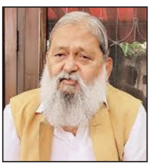
ਚੰਡੀਗੜ੍ਹ, 21 ਅਪ੍ਰੈਲ - ਕੌਮੀ ਪਤ੍ਰਿਕਾ ਬਿਊਰੋ- ਹਰਿਆਣਾ ਦੇ ਉਰਜਾ, ਟਾਂਸਪੋਰਟ ਅਤੇ ਕਿਰਤ ਮੰਤਰੀ ਸ਼੍ਰੀ ਅਨਿਲ ਵਿੱਜ ਨੇ ਕਿਹਾ ਕਿ ਅੰਬਾਲਾ ਕੈਂਟ ਵਿੱਚ ਬਣੇ ਡੋਮੇਸਟਿਕ ਏਅਰਪੋਰਟ ਦਾ ਉਦਘਾਟਨ ਜਲਦੀ ਹੀ ਕੀਤਾ ਜਾਵੇਗਾ।

ਚੰਡੀਗੜ੍ਹ, 21 ਅਪ੍ਰੈਲ - ਕੌਮੀ ਪਤ੍ਰਿਕਾ ਬਿਊਰੋ- ਹਰਿਆਣਾ ਦੇ ਉਰਜਾ, ਟਾਂਸਪੋਰਟ ਅਤੇ ਕਿਰਤ ਮੰਤਰੀ ਸ਼੍ਰੀ ਅਨਿਲ ਵਿੱਜ ਨੇ ਕਿਹਾ ਕਿ ਅੰਬਾਲਾ ਕੈਂਟ ਵਿੱਚ ਬਣੇ ਡੋਮੇਸਟਿਕ ਏਅਰਪੋਰਟ ਦਾ ਉਦਘਾਟਨ ਜਲਦੀ ਹੀ ਕੀਤਾ ਜਾਵੇਗਾ। ਇਸ ਸਬੰਧੀ ਅੱਜ ਹਰਿਆਣਾ ਸਿਵਲ ਏਵੀਏਸ਼ਨ ਵਿਭਾਗ ਦੇ ਅਧਿਕਾਰੀਆਂ ਨਾਲ ਆਯੋਜਿਤ ਮੀਟਿੰਗ ਵਿੱਚ ਏਅਰਪੋਰਟ ਦੇ ਬਾਰੇ ਗੰਭੀਰ ਚਰਚਾ ਕੀਤੀ ਗਈ। ਇਸ ਮੀਟਿੰਗ ਵਿੱਚ ਏਅਰਪੋਰਟ ਦੇ ਡਿਜ਼ਾਈਨ, ਡਿਵੈਲਪਮੈਂਟ ਅਤੇ ਉਦਘਾਟਨ ਦੇ ਸਬੰਧ ਵਿੱਚ ਵੀ ਨਿਰਦੇਸ਼ ਦਿੱਤੇ ਗਏ।