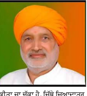
ਚੰਡੀਗੜ੍ਹ, 21 ਅਪ੍ਰੈਲ - ਕੌਮੀ ਪਤ੍ਰਿਕਾ ਬਿਊਰੋ- ਹਰਿਆਣਾ ਸਰਕਾਰ ਕਿਸਾਨਾਂ ਨੂੰ ਬਿਹਤਰ ਸਹੂਲਤਾਂ ਮੁਹੱਈਆ ਕਰਵਾਉਣ ਲਈ ਪੂਰੀ ਤਰ੍ਹਾਂ ਵਚਨਬੱਧ ਹੈ ਅਤੇ ਸੀਜ਼ਨ ਸ਼ੁਰੂ ਹੋਣ ਤੋਂ ਪਹਿਲਾਂ ਸਾਰੀਆਂ ਲੋੜੀਂਦੀਆਂ ਤਿਆਰੀਆਂ ਯਕੀਨੀ ਬਣਾਈਆਂ ਜਾ ਰਹੀਆਂ ਹਨ।

ਦਰਜ ਕਰਕੇ ਅਗਲੀ ਪ੍ਰਕਿਰਿਆ ਪੂਰੀ ਕੀਤੀ ਜਾ ਰਹੀ ਹੈ, ਤਾਂ ਜੋ ਕਿਸਾਨ ਨੂੰ ਕਿਸੇ ਕਿਸਮ ਦੀ ਪਰੇਸ਼ਾਨੀ ਨਾ ਹੋਵੇ। ਉਨ੍ਹਾਂ ਕਿਹਾ ਕਿ ਨਵੀਂ ਨਾਲ ਸਬੰਧਤ ਸਮੱਸਿਆਵਾਂ 'ਤੇ ਵੀ ਕੇਂਦਰ ਸਰਕਾਰ ਵੱਲੋਂ ਦਿੱਤੀ ਗਈ ਛੋਟ ਨਾਲ ਕਿਸਾਨਾਂ ਨੂੰ ਰਾਹਤ ਮਿਲੇਗੀ।