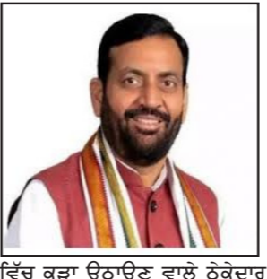
ਚੰਡੀਗੜ੍ਹ, 21 ਅਪ੍ਰੈਲ - ਕੌਮੀ ਪਤ੍ਰਿਕਾ ਬਿਊਰੋ- ਹਰਿਆਣਾ ਦੇ ਮੁੱਖ ਮੰਤਰੀ ਸ਼੍ਰੀ ਨਾਇਬ ਸਿੰਘ ਸੈਣੀ ਨੇ ਦੱਸਿਆ ਕਿ ਸੂਬੇ ਦੇ ਸਾਰੇ ਨਗਰ ਨਿਗਮ ਸੰਸਥਾਨਾਂ ਵਿੱਚ ਆਉਣ ਵਾਲੀ ਇੱਕ ਮਈ, 2026 ਤੋਂ ਦੋ ਹਫ਼ਤੇ ਲਈ ਸਪੈਸ਼ਲ ਸਵੱਛਤਾ ਮੁਹਿੰਮ ਚਲਾਈ ਜਾਵੇਗੀ।

ਚੰਡੀਗੜ੍ਹ, 21 ਅਪ੍ਰੈਲ - ਕੌਮੀ ਪਤ੍ਰਿਕਾ ਬਿਊਰੋ- ਹਰਿਆਣਾ ਦੇ ਮੁੱਖ ਮੰਤਰੀ ਸ਼੍ਰੀ ਨਾਇਬ ਸਿੰਘ ਸੈਣੀ ਨੇ ਦੱਸਿਆ ਕਿ ਸੂਬੇ ਦੇ ਸਾਰੇ ਨਗਰ ਨਿਗਮ ਸੰਸਥਾਨਾਂ ਵਿੱਚ ਆਉਣ ਵਾਲੀ ਇੱਕ ਮਈ, 2026 ਤੋਂ ਦੋ ਹਫ਼ਤੇ ਲਈ ਸਪੈਸ਼ਲ ਸਵੱਛਤਾ ਮੁਹਿੰਮ ਚਲਾਈ ਜਾਵੇਗੀ, ਇਸ ਮੁਹਿੰਮ ਤੋਂ ਇਲਾਵਾ ਸਾਲਭਰ ਚੱਲਣ ਵਾਲੇ ਸਵੱਛਤਾ ਮੁਹਿੰਮ ਵਿੱਚ ਵਾਰਡ ਸਮਿਤੀ ਦੇ ਮੈਂਬਰਾਂ ਦੀ ਅਹਿਮ ਭੂਮਿਕਾ ਰਹੇਗੀ।