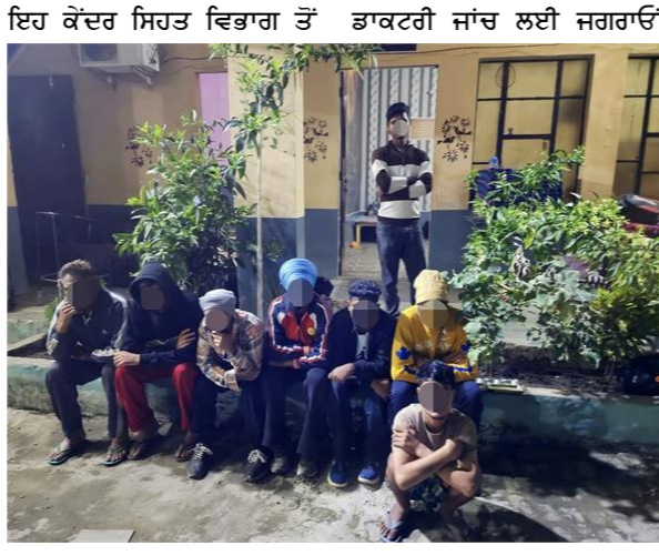
ਇਹ ਕੇਂਦਰ ਸਿਹਤ ਵਿਭਾਗ ਤੋਂ ਡਾਕਟਰੀ ਜਾਂਚ ਲਈ ਜਗਰਾਓਂ

ਸਰਕਾਰੀ ਹਸਪਤਾਲਾਂ ਵਿਚ ਭਰਤੀ ਕਰਵਾਇਆ ਗਿਆ ਹੈ। ਪੁਲਸ ਨੇ ਕੇਂਦਰ ਦੇ ਪ੍ਰਬੰਧਕਾਂ ਖ਼ਲਾਫ਼ ਕਾਨੂੰਨੀ ਸ਼ਿਕੰਜਾ ਕੱਸਣਾ ਸ਼ੁਰੂ ਕਰ ਦਿੱਤਾ ਹੈ। ਇਹ ਵੱਡੀ ਕਾਰਵਾਈ ਦੇ ਸੀ.ਪੀ. ਸਾਉਥ ਅਤੇ ਲੁਧਿਆਣਾ ਕ੍ਰਾਈਮ ਬ੍ਰਾਂਚ ਦੀ ਨਿਗਰਾਨੀ ਹੇਠ ਥਾਣਾ ਡੇਰਲੋਂ ਦੀ ਪੁਲਸ ਅਤੇ ਸਿਹਤ ਵਿਭਾਗ ਦੀ ਵਿਸ਼ੇਸ਼ ਟੀਮ ਵੱਲੋਂ ਅੰਜਾਮ ਦਿੱਤੀ ਗਈ। ਡਾਪੋਮਾਰੀ ਦੌਰਾਨ ਟੀਮ ਵਿਚ ਐੱਸ.ਐੱਮ.ਓ., ਮੈਡੀਕਲ ਅਫ਼ਸਰ ਅਤੇ ਡਰੱਗ ਇੰਸਪੈਕਟਰ ਵੀ ਮੌਜੂਦ ਸਨ, ਜਿਨ੍ਹਾਂ ਨੇ ਤਕਨੀਕੀ ਅਤੇ ਡਾਕਟਰੀ ਪਹਿਲੂਆਂ ਦੀ ਜਾਂਚ ਕੀਤੀ। ਜਾਂਚ ਵਿਚ ਇਹ ਖ਼ੁਲਾਸਾ ਹੋਇਆ ਕਿ