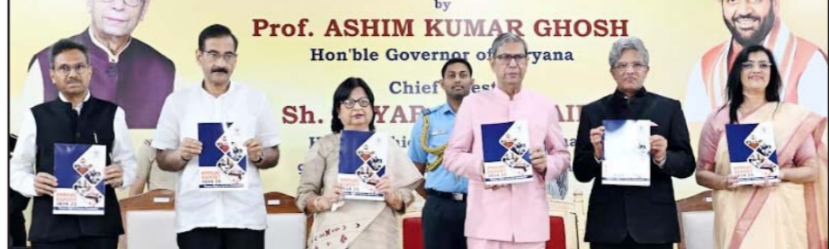
ਚੰਡੀਗੜ੍ਹ, 13 ਅਪ੍ਰੈਲ - ਕੌਮੀ ਪੱਤਰਕਾ ਬਿਊਰੋ-