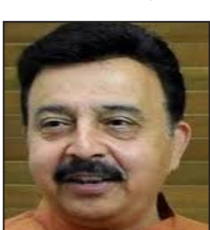
ਚੰਡੀਗੜ੍ਹ, 13 ਅਪ੍ਰੈਲ - ਕੌਮੀ ਪੱਤਰਕਾ ਬਿਊਰੋ-

ਉਨ੍ਹਾਂ ਨੇ ਜਾਣਕਾਰੀ ਦਿੱਤੀ ਕਿ ਸਾਲ 2022-23 ਵਿੱਚ ਨੌਵੀਂ, ਆਰਮੀ ਅਤੇ ਹਵਾਈ ਸੇਨਾ ਲਈ ਰਾਸ਼ਟਰੀ ਪੱਧਰ 'ਤੇ 26,649 ਅਗਨੀਵੀਰਾਂ ਦੀ ਭਰਤੀ ਦਾ ਟੀਚਾ ਨਿਰਧਾਰਿਤ ਕੀਤਾ ਗਿਆ ਸੀ ਜਿਸ ਵਿੱਚ ਸਾਲ 2022-23 ਵਿੱਚ ਹਰਿਆਣਾ ਤੋਂ 1830 ਅਤੇ 2023-24 ਵਿੱਚ 2215 ਅਗਨੀਵੀਰਾਂ ਦੀ ਭਰਤੀ ਹੋਈ ਸੀ। ਕੇਂਦਰ ਸਰਕਾਰ ਦੀ ਰੱਖਿਆ ਸੁਧਾਰਾਂ ਨੂੰ ਕੀਤੀ ਗਈ ਵਿਸ਼ੇਸ਼