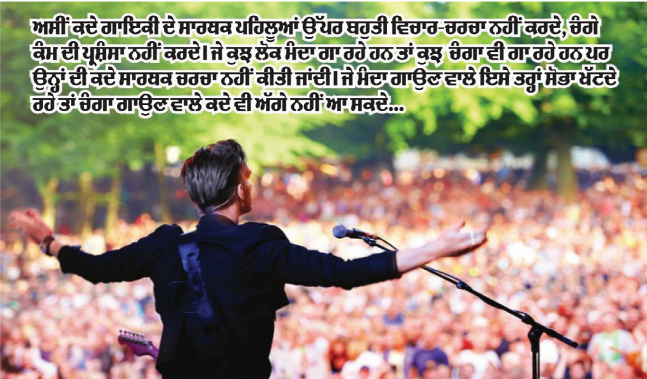
ਅਸੀਂ ਕਦੇ ਗਾਇਕੀ ਦੇ ਸਾਰਥਕ ਪਹਿਲੂਆਂ ਉੱਪਰ ਬਹੁਤੀ ਵਿਚਾਰ-ਚਰਚਾ ਨਹੀਂ ਕਰਦੇ, ਚੰਗੇ ਕੰਮ ਦੀ ਪ੍ਰਸ਼ੰਸਾ ਨਹੀਂ ਕਰਦੇ। ਜੇ ਕੁਝ ਲੋਕ ਮੰਦਾ ਗਾ ਰਹੇ ਹਨ ਤਾਂ ਕੁਝ ਚੰਗਾ ਵੀ ਗਾ ਰਹੇ ਹਨ ਪਰ ਉਨ੍ਹਾਂ ਦੀ ਕਦੇ ਸਾਰਥਕ ਚਰਚਾ ਨਹੀਂ ਕੀਤੀ ਜਾਂਦੀ। ਜੇ ਮੰਦਾ ਗਾਉਣ ਵਾਲੇ ਇਸੇ ਤਰ੍ਹਾਂ ਸੋਭਾ ਖੱਟਦੇ ਹੋ ਤਾਂ ਚੰਗਾ ਗਾਉਣ ਵਾਲੇ ਕਦੇ ਵੀ ਅੱਗੇ ਨਹੀਂ ਆ ਸਕਦੇ...

ਸਕੂਲ-ਕਾਲਾਂ ਵਿਚ ਵੀ ਅੱਜ ਕੱਲ੍ਹ ਪੜ੍ਹਾਉਣ ਦੇ ਨਵੇਂ ਤਰੀਕੇ ਇਸਤੇਮਾਲ ਕੀਤੇ ਜਾ ਰਹੇ ਹਨ। ਨਿੱਕੇ ਬੱਚਿਆਂ ਨੂੰ ਪੜ੍ਹਾਉਣ ਲਈ ਕਿਤਾਬਾਂ ਦੇ ਨਾਲ-ਨਾਲ