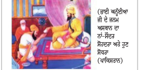
(ਭਾਈ ਘਨੂੰਈਆ ਜੀ ਦੇ ਜਨਮ ਅਸਥਾਨ ਦਾ ਨਾਂ-ਸੋਦਰ ਸੋਦਰਾ ਅਤੇ ਹੁਣ ਸੋਧੜਾ (ਪਾਕਿਸਤਾਨ))

ਨਰਿੰਦ ਨਾਨਕ ਦੀ ਭਾਈ ਘਨੂੰਈਆ ਦੀ ਨਈਆ ਦਾ, ਭੂਗਰ ਪੰਥ ਲੰਮੇਰਾ, ਪੰਥ ਫੱਟਣ ਨੂੰ ਗੁਰਾ ਵਿਖਾਇਆ, ਨਨੂੰਏਂ ਭਗਤ ਦਾ ਭਰਾ। ਪੁੱਛਣਾ ਪਿਆ ਫਕੀਰ ਸਾਈ ਦਾ, ਗੀਰ ਗੋਬਿੰਦ ਮਿਲਸੀ ਗੋਬਿੰਦ ਦੇ ਦਰ ਕਰਕੇ ਹੋਸੀ, ਏਸ ਜਨਮ ਵਿਚ ਭੇਰਾ। ਗੋਬਿੰਦ ਦੇ ਰਾਹਾਂ ਨੂੰ ਤਪਦਾ, ਗੋਬਿੰਦ ਦਾ ਦਰ ਚਾਹੁੰਦਾ, ਐ ਨਨੂੰਆਂ ਸੁਣ, ਸੁਣਾਵੇ, ਗੋਬਿੰਦ ਦਾ ਸਿਰਨਾਵਾ, ਛਾਵਾ, ਛਾਵਿਆ ਮਾਇਆ ਜਾਪਣ, ਨਿਰਫਲ ਮਹਿਲ ਨਾ ਲੱਭੇ, ਨਿਰਫਲ ਮਹਿਲ ਜਨਾਇ ਜਿੱਥੇ, ਮਨ ਦੀ ਭੇਦ ਚੜ੍ਹਾਵਾ। ਵੀ ਜਗਤੀ ਗੋਬਿੰਦ ਮਿਲਣ ਦੀ, ਹੀ ਸੁਖੀਤੀ ਦੀਆਂ ਹਾਰਵਾਂ ਹਰ ਨਿਕਾਵਾਂ ਪਾਵਾਂ ਮੈਂ ਵੀ, ਗੋਬਿੰਦ ਦੀਆਂ ਨਿਗਾਹਵਾਂ ਨਜ਼ਰ ਫੜ ਗੋਬਿੰਦ ਦੇ ਲੱਭੇ, ਮੈਂ ਵੀ ਕਿਹਰੇ ਪਹੁੰਚਾ ਪਿਤਾ ਗੋਬਿੰਦ ਦੀ ਗੋਦੀ ਬਹਿ ਕੇ, ਗਲ ਵਿਚ ਪਾਵਾ ਬਹਾਵਾਂ ਅੱਖੀਆਂ ਵਿਚੋਂ ਨਹਿਰ ਨਿਕਲਕੇ, ਸੁਗ ਸਾਗਰ ਨੂੰ ਚਾਹੁੰਦਾ ਐਂਗ ਗੱਲਾਂ 'ਤੇ ਸੁੱਕ ਜਾਵਾਂ, ਰਾਹ ਪਹਿਣਾ ਤਪਦਾਵੇ, ਬਸਰਾ ਦਾ ਵਿਚ ਡਿੱਗ ਨਾ ਜਾਵੇ, ਕੱਚਾ ਤਨ ਦਾ ਕੋਠਾ ਤਾਂ ਇਹ ਵਿਛੜੀ ਕੁੰਜ ਬੋਠੀ, ਤਪਦ ਤੇ ਤਪਦਾਵੇ।