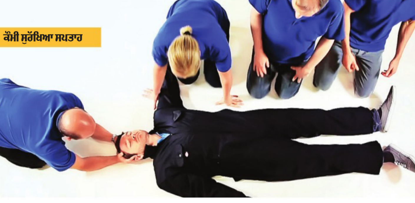
ਕੌਮੀ ਸੁਰੱਖਿਆ ਸਪਤਾ