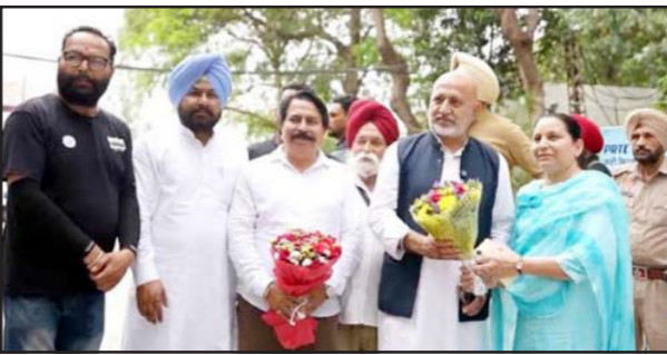
ਪਟਿਆਲਾ ਵਿਖੇ ਪੀ.ਆਰ.ਟੀ.ਸੀ. ਦੇ ਮੁੱਖ ਦਫਤਰ ਵਿੱਚ ਲਗਾਏ ਗਏ ਦੋ-ਰੋਜ਼ਾ ਸਿਹਤ ਕੈਂਪ ਰਾਹੀਂ ਪੰਜਾਬ ਦੇ ਟ੍ਰਾਂਸਪੋਰਟ ਮੁਲਾਜ਼ਮਾਂ ਨੂੰ ਸਿੱਧੇ ਤੌਰ 'ਤੇ ਮੁੱਖ ਮੰਤਰੀ ਸਿਹਤ ਯੋਜਨਾ ਦੇ ਦਾਇਰੇ ਵਿੱਚ ਲਿਆਂਦਾ ਗਿਆ ਹੈ। ਭਗਵੰਤ ਮਾਨ ਸਰਕਾਰ ਨੇ ਸੂਬੇ ਦੇ ਸਭ ਤੋਂ ਵੱਧ ਗਤੀਸ਼ੀਲ ਅਤੇ ਸਿਹਤ ਸਹੂਲਤਾਂ ਤੋਂ ਵਾਂਝੇ ਰਹਿਣ ਵਾਲੇ ਇਸ ਕਾਮਾ ਵਰਗ ਲਈ ਸਿਹਤ ਸੰਭਾਲ ਪਹੁੰਚ ਵਿੱਚ ਲੰਬੇ ਸਮੇਂ ਤੋਂ ਚੱਲੀ ਆ ਰਹੀ ਯੋਜਨਾ ਨੂੰ ਪੂਰਾ ਕਰਨ ਲਈ ਇਹ ਕਦਮ ਚੁੱਕਿਆ ਹੈ। ਖੰਬ ਡਾਕਟਰਾਂ, ਆਟੋ-ਰਿਕਸ਼ਾ ਚਾਲਕਾਂ, ਟੈਕਸੀ ਮੁਲਾਜ਼ਮਾਂ ਅਤੇ ਉਨ੍ਹਾਂ ਦੇ ਪਰਿਵਾਰਾਂ ਨੂੰ ਮੌਕੇ 'ਤੇ ਹੀ ਰਜਿਸਟਰ (ਐਨਕੋਰ) ਕੀਤਾ ਗਿਆ, ਜਿਸ ਨਾਲ ਇਹ ਯਕੀਨੀ ਬਣਾਇਆ ਗਿਆ ਕਿ ਪੰਜਾਬ ਦੀ ਹਰ ਡਰਾਈਵਰ ਰੱਖਣ ਵਾਲੇ ਇਹ ਲੋਕ ਹੁਣ ਸਮੇਂ ਸਿਰ ਅਤੇ ਸਸਤੀਆਂ ਸਿਹਤ ਸਹੂਲਤਾਂ ਪ੍ਰਾਪਤ ਕਰਨ ਵਿੱਚ ਪਿੱਛੇ ਨਾ ਰਹਿਣਗੇ।