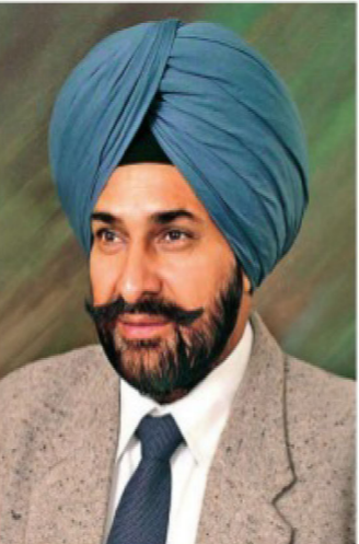
ਦਿੱਲੀਆਂ ਹਨ ਅਤੇ ਮਨੁੱਖਤਾ ਦੀ ਕਤਲਗਾਹ ਬਣ ਜਾਂਦੀਆਂ ਹਨ। ਇਨ੍ਹਾਂ ਪਿਠਾਂ ਵਿਚ ਉਹ ਧਰਮ ਅਤੇ ਧੜੇ ਵੀ ਸ਼ਾਮਿਲ ਹਨ, ਜਿਹੜੇ ਬੇਦੀਆਂ ਸਮਾਜਿਕ ਕਦਰਾਂ-ਕੀਮਤਾਂ ਨੂੰ ਹੋਰ ਪੱਕਿਆਂ ਕਰਦੇ ਹੋਏ ਅਜੇਹੇ ਤਰਕਮਾਂ ਸਾਹਮਣੇ ਚੁੱਕੇ ਅਤੇ ਬੇਲੋ ਚੁੱਕੇ ਹਨ।

ਮੇਰੇ ਸਾਹਮਣੇ ਹੈ ਪੀਆ ਦੀ ਬੇਬੇਬਾਨੀ ਨੂੰ ਜ਼ਬਾਨ ਦਿੰਦੀ-ਗੁਰਭਜਨ ਗਿੱਲ ਦੀ ਕਵਿਤਾ 'ਲੋਹੀ'। ਇਹ ਕਵਿਤਾ ਮਰਦ ਮਾਨਸਿਕਤਾ ਦੀਆਂ ਉਨ੍ਹਾਂ ਬੇਬੇਬਾਨੀ ਪਰਤਾਂ ਨੂੰ ਬੇਹੱਦ ਬਰੀਕੀ ਅਤੇ ਬੇਬਾਕੀ ਨਾਲ ਬੇਪਰਦਾ ਕਰਦੀ ਹੈ। ਜਿਹੜੀਆਂ ਸਾਡੇ ਅੰਦਰ ਇਸ ਤਰ੍ਹਾਂ ਘਰ ਕਰ ਚੁੱਕੀਆਂ ਹਨ, ਕਿ ਸਾਨੂੰ ਜਗ੍ਹਾ ਸੋਚ ਤੋਂ ਆਜ਼ਾਦ ਨਹੀਂ ਹੋਣ ਦਿੰਦੀਆਂ। ਇਸੇ ਸੋਚ ਕਰਕੇ ਇੱਕੱਕੀ ਸਦੀ ਤਕ ਪਹੁੰਚ ਕੇ ਵੀ, ਇਸਤਰੀ ਦਿਵਸ ਦੀਆਂ ਲੰਮੀਆਂ ਲੜੀਆਂ ਮਨਾ ਕੇ ਵੀ ਨਵੀਂ ਸੋਚ ਦਾ ਫੰਡਾ ਪਿਟ ਕੇ ਵੀ ਸਾਡਾ ਸਮਾਜ ਮਾਦਾ-ਭਰੂਣਾ ਹੱਤਿਆ ਤੇ ਛੁਟਕਾਰਾ ਨਹੀਂ ਪਾ ਸਕਿਆ।