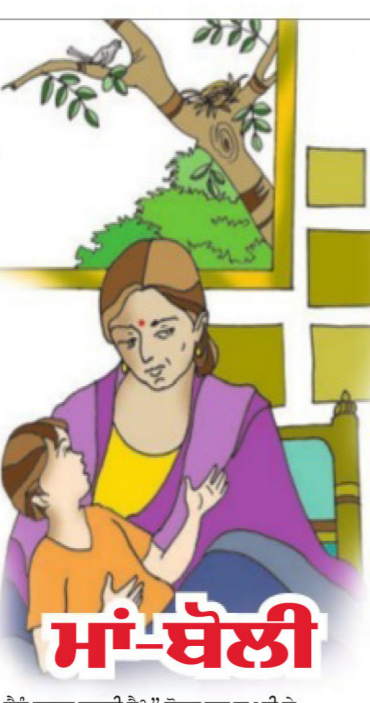
ਮਾਂ-ਬੋਲੀ ਤੇਨੂੰ ਗਵਾਹ ਲਗਦੀ ਹੈ? ਦੋਸਤ ਹੁਣ ਚੁਪ ਸੀ ਤੇ ਸ਼ਰਮ ਨਾਲ ਉਸ ਦੀਆਂ ਅੱਖਾਂ ਝੁਕੀਆਂ ਹੋਈਆਂ ਸਨ। ਮੈਂ ਅੱਗੇ ਗੱਲ ਤੋਰੀ ਤੇ ਕਿਹਾ 'ਯਾਰ ਬੱਚੇ ਨੂੰ ਹਰ ਬੋਲੀਆਂ ਸਿਖਾਉਣਾ ਵਧੀਆ ਗੱਲ ਹੈ ਪਰ ਮਾਂ ਬੋਲੀ ਬੋਲਣੀ ਤੇ ਇਸ ਦੀ ਇੱਜ਼ਤ ਕਰਨੀ ਨਾ ਛੱਡੋ, ਜਿਸ ਤਰ੍ਹਾਂ ਮਾਂ ਦੀ ਥਾਂ ਕੋਈ ਚਾਚੀ, ਤਾਈ ਨਹੀਂ ਲੈ ਸਕਦੀ, ਉਸ ਤਰ੍ਹਾਂ ਮਾਂ ਬੋਲੀ ਦੀ ਥਾਂ ਵੀ ਕੋਈ ਹੋਰ ਬੋਲੀ ਨਹੀਂ ਲੈ ਸਕਦੀ।'

ਇਕ ਮਿੱਤਰ ਦੇ ਘਰ ਬੈਠਾ ਸੀ। ਉਸ ਦਾ ਚਾਰ ਪੰਜ ਸਾਲ ਦਾ ਬੱਚਾ ਕਮਰੇ 'ਚ ਬਾਹਰ ਆਇਆ ਤੇ ਮੈਂ 'ਚੋਂ ਬੇ ਚਿੰਤਾ ਨਾਲ ਕੱਲ ਝੁਕਾ ਕੇ ਉਸ ਦਾ ਨਾਮ, ਸਕੂਲ ਤੇ ਹੋਰ ਦੋ ਤਿੰਨ ਗੱਲਾਂ ਪੁੱਛੀਆਂ। ਲਗਭਗ ਹਰ ਗੱਲ ਦਾ ਜਵਾਬ ਉਸ ਬੱਚੇ ਨੇ ਹਿੰਦੀ ਜਾਂ ਬੰਗੁ ਬਹੁਤ ਅੰਗਰੇਜ਼ੀ ਵਿਚ ਦਿੱਤਾ। ਮੈਂ ਮਿੱਤਰ ਨੂੰ ਪੁੱਛਿਆ, 'ਯਾਰ ਇਹ ਸਾਰੀ ਗੱਲ ਹਿੰਦੀ ਜਾਂ ਅੰਗਰੇਜ਼ੀ ਵਿਚ ਹੀ ਕਰਦਾ, ਪੰਜਾਬੀ ਕਿਉਂ ਨਹੀਂ ਬੋਲਦਾ?' ਮਿੱਤਰ ਬੋਲਿਆ, 'ਯਾਰ ਪੰਜਾਬੀ ਬੋਲਦਾ ਤੇ ਜਵਾਬ ਐਂਟੇ ਜਾਹਲ-ਗਵਾਹ ਜਿਹਾ ਲਗਦਾ, ਹਿੰਦੀ ਮਿੱਠੀ ਜਿਹੀ ਬੋਲੀ ਹੈ ਤੇ ਜਦੋਂ ਬੋਲਦਾ ਤੇ ਬੱਚਾ ਸੋਹਣਾ ਲਗਦਾ।'