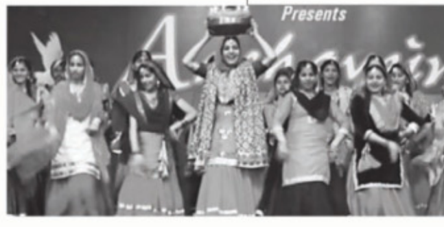
ਚੱਕ ਲਿਆ ਬਜ਼ਾਰ ਵਿੱਚੋਂ ਖੀਰਾ ਹਰਖਾ ਨਾਲ ਮੈਂ ਭਰਗੀ ਮੇਰਾ ਸਿਰ ਨਾ ਪਲਸਿਆ ਵੀਰਾ ਹਰਖਾ ਨਾਲ ਮੈਂ ਭਰਗੀ... ਕੋਈ ਭੈਣ ਨਹੀਂ ਚਾਹੁੰਦੀ ਕਿ ਉਹਦਾ ਭਰਾ ਉਹਦੇ ਨਾਲੋਂ ਨਾ ਤੜ ਲੋਏ : ਆਉਂਦੀ ਕੁੜੀਏ ਜਾਂਦੀ ਕੁੜੀਏ ਇੱਛਾਈ ਖੀਰ ਵਿਚ ਭੋਈ ਟੁੱਟ ਕੇ ਨਾ ਬਹਿਜੀ ਵੀਰਨਾ ਭੈਣਾਂ ਵਰਗਾ ਸਾਕ ਨਾ ਕੋਈ

ਭੈਣਾਂ ਨਾਲੋਂ ਭਾਈ ਮੁਹੱਬਤ ਤੋਂ ਤੜ ਗਏ... ਪੰਜਾਬ ਵਿਚ ਚੱਲੀਆਂ ਸਮਾਜ ਸੁਧਾਰ ਲਹਿਰਾਂ-ਅਕਾਲੀ ਲਹਿਰ, ਸਿੱਖ ਸਭਾ ਲਹਿਰ, ਆਜ਼ਾਦੀ ਲਹਿਰ ਅਤੇ ਸੰਸਾਰ ਜੰਗ ਦੇ ਪ੍ਰਭਾਵ ਨੂੰ ਵੀ ਪੰਜਾਬ ਦੀ ਔਰਤਾਂ ਦੀ ਚੇਤਨਾ ਨੇ ਕਬੂਲਿਆ ਹੈ। ਇਨ੍ਹਾਂ ਲਹਿਰਾਂ ਦਾ ਗੀਤਾਂ ਵਿਚ ਸ਼ਿਕਾਰ, ਇਨ੍ਹਾਂ ਗੀਤਾਂ ਦੀ ਇਤਿਹਾਸਕ ਤੇ ਸਮਾਜਿਕ ਮਹੱਤਤਾ ਨੂੰ ਮੁਹਤੀਮਾਨ ਕਰਦਾ ਹੈ। ਦੀਵਾਨ ਵਿਚ ਬੈਠੇ ਸਿੱਖ ਸਭੀਏ ਭਰਾ ਦੀ ਵਾਸ਼ਨਾ ਉਸ ਨੂੰ ਫੁੱਲਾਂ ਸਮਾਨ ਜਾਪਦੀ ਹੈ : ਆਉਂਦੀ ਕੁੜੀਏ ਜਾਂਦੀ ਕੁੜੀਏ ਵਿਚ ਨਾ ਹੁੰਕੇ ਵਾਲਾ ਆਵੇ ਸਭਾ ਦੇ ਵਿਚ ਰੰਗ ਵੀਰ ਦਾ ਸਾਨੂੰ ਵਾਸ਼ਨਾ ਫੁੱਲਾਂ ਦੀ ਆਵੇ ਸਭਾ ਦੇ ਵਿਚ ਰੰਗ ਵੀਰ ਦਾ ਆਚਾਰੀ ਲਹਿਰ ਖਾਰੇ ਵੀ ਪੰਜਾਬ ਦੀ ਮੁਟਿਆਰ ਚੇਤਨ ਹੈ : ਆਉਂਦੀ ਕੁੜੀਏ ਜਾਂਦੀ ਕੁੜੀਏ ਸਿਰ 'ਤੇ ਟੋਕਰਾ ਨਰਗੀਆਂ ਦਾ ਕਿੱਚੇ ਰੱਖਾਂ ਵੇ ਕਿੱਚੇ ਰੱਖਾਂ ਵੇ ਰਾਜ ਫਰੰਗੀਆਂ ਦਾ ਕਿੱਚੇ ਰੱਖਾਂ ਵੇ... ਸਮਾਜਿਕ ਅਤੇ ਰਾਜਸੀ ਚੇਤਨਾ ਵਾਲੇ ਗੀਤਾਂ ਤੋਂ ਇਲਾਵਾ ਮੇਲਣਾਂ ਹਾਸ-ਨੱਠੇ ਦਾ