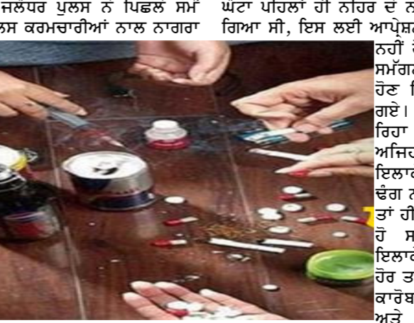
ਦੇ ਆਲੇ-ਦੁਆਲੇ ਵਸੇ ਸ਼ਿਵ ਨਗਰ, ਗੁਰੂ ਨਾਨਕ ਨਗਰ ਅਤੇ ਵਿਚ ਸ਼ਹਿਰ ਮੁਹਿੰਮ ਚਲਾਈ ਸੀ ਅਤੇ ਘਰ-ਘਰ ਜਾ ਕੇ ਤਲਾਸ਼ੀ ਲਈ ਸੀ। ਕਿਉਂਕਿ ਇਸ ਅਪਰਾਧ ਨੂੰ ਪਹਿਲਾਂ ਨੇ ਪਹਿਲਾਂ ਹੀ ਦੋਸ਼ ਚਿੰਤਾ ਗਿਆ ਸੀ ਅਤੇ ਇਸ ਦੇ ਲਈ ਪੁਲਸ ਫੌਜ ਨੂੰ ਇਕ

ਜਲਪਰ 6 ਮਾਰਚ। ਸੈਂਟਰਲ ਵਿਧਾਨ ਸਭਾ ਹਲਕੇ ਤਹਿਤ ਆਉਂਦੇ ਪ੍ਰਦੇਸ਼ੀ ਲੋਕਾਂ ਦੇ ਗੜ੍ਹ ਭਾਵ ਕਾਜ਼ੀ ਮੰਡੀ ਹਲਕੇ ਨੂੰ ਸ਼ਹਿਰ ਵਿਚ ਹਰ ਤਰ੍ਹਾਂ ਦੇ ਨਸ਼ਿਆਂ ਲਈ ਜਾਣਿਆ ਜਾਂਦਾ ਰਿਹਾ ਹੈ ਪਰ ਹੁਣ ਵੈਸਟ ਵਿਧਾਨ ਸਭਾ ਹਲਕੇ ਦੇ ਕਈ ਇਲਾਕੇ ਅਜਿਹੇ ਉੱਠ ਰਹੇ ਹਨ, ਜੋ ਨਸ਼ਿਆਂ ਦਾ ਗੜ੍ਹ ਬਣ ਚੁੱਕੇ ਹਨ। ਇਨ੍ਹਾਂ ਵਿਚ ਵੱਧੇਰੇ ਕੈਂਪ ਅਤੇ ਬਸਤੀਆਂ ਦਾ ਇਲਾਕੇ ਤਾਂ ਖੇਰ ਆਉਂਦਾ ਹੀ ਹੈ ਪਰ ਨਾਗਰਾ ਪਿੰਡ ਦੇ ਆਲੇ-ਦੁਆਲੇ ਸਥਿਤ ਮੁਹੱਲਾ ਸ਼ਿਵ ਨਗਰ, ਗੁਰੂ ਨਾਨਕ ਨਗਰ ਅਜਿਹੇ ਇਲਾਕੇ ਹਨ, ਜਿਥੇ ਦਰਜਨਾਂ ਲੋਕ ਨਾ ਸਿਰਫ ਨਸ਼ੇ ਦੀ ਸਪਲਾਈ ਵਿਚ ਲੱਗੇ ਹਨ, ਸਗੋਂ ਸੈਂਕੜੇ ਨੌਜਵਾਨ ਅਜਿਹੇ ਹਨ, ਜੋ ਨਸ਼ਿਆਂ ਦਾ ਸੇਵਨ ਕਰ ਕੇ ਆਪਣੀ ਜ਼ਿੰਦਗੀ ਨਾਲ ਖਿਲਵਾਤ ਕਰ ਰਹੇ ਹਨ। ਇਹੀ ਕਾਰਨ ਹੈ ਕਿ ਇਨ੍ਹਾਂ ਇਲਾਕਿਆਂ ਵਿਚ ਅਪਰਾਧਿਕ ਘਟਨਾਵਾਂ ਵਿਚ ਵੀ ਵਾਧਾ ਹੋ ਰਿਹਾ ਹੈ। ਜਲਪਰ ਪੁਲਸ ਦੀ ਗੱਲ ਕਰੀਏ ਤਾਂ ਵੱਧੇਰੇ ਵੱਡੇ ਅਧਿਕਾਰੀਆਂ ਨੂੰ ਇਹ ਜਾਣਕਾਰੀ ਹੈ ਕਿ ਗੁਲਾਬ ਦੇਵੀ ਹਸਪਤਾਲ ਰੋਡ 'ਤੇ ਕਾਲਾ ਸੰਘਾਂ ਡਾਕੋਂ ਦੀ ਪੁਲੀ ਦੇ ਪਾਹ ਅਤੇ ਆਪਣੇ ਦੁਆਲੇ ਦਾ ਇਲਾਕਾ ਨਸ਼ਿਆਂ ਦੇ ਗੜ੍ਹ ਦੇ ਪੁਲ ਵਿਚ ਵਿਕਸਿਤ ਹੋ ਰਿਹਾ ਹੈ। ਅਜਿਹੀਆਂ ਸੂਚਨਾਵਾਂ ਦੇ