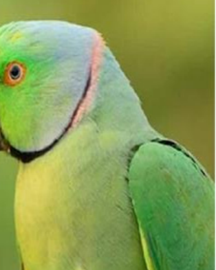
ਮਾਰਹ ਹੋ ਗਏ ਹਨ ਕਿ ਜਿਵੇਂ ਹੀ ਕਿਸਾਨ ਆਪਣੀਆਂ ਅੱਖਾਂ

ਸਾਹਮਣਾ ਕਰਨਾ ਪੈ ਰਿਹਾ ਹੈ। ਇਹ ਤੋਤੇ ਇੰਨੇ ਚਲਕਾ ਹਨ ਅਤੇ ਅਫੀਮ ਚੋਰੀ ਕਰਨ 'ਚ ਇੰਨੇ ਚਲਕਾ ਹਨ ਕਿ ਸਵੇਰ ਤੋਂ ਸ਼ਾਮ ਤੱਕ ਅਫੀਮ 'ਤੇ ਘੱਲਦੇ ਰਹਿੰਦੇ ਹਨ। ਮੌਕਾ ਮਿਲਦੇ ਹੀ, ਉਹ ਬਹੁਤ ਫੁਰਤੀ ਨਾਲ ਅਫੀਮ ਤੋੜਦੇ ਹਨ, ਇਸ ਨੂੰ ਆਪਣੀਆਂ ਚੁੱਥਾਂ 'ਚ ਫੜਦੇ ਹਨ ਅਤੇ ਉੱਡ ਜਾਂਦੇ ਹਨ ਅਤੇ ਅਫੀਮ ਨੂੰ ਬਹੁਤ ਖੁਸ਼ੀ ਨਾਲ ਖਾਂਦੇ ਹਨ। ਅਫੀਮ ਦੀ ਹਰ ਖੁੱਦ ਅਫੀਮ ਕਿਸਾਨਾਂ ਲਈ ਬਹੁਤ ਕੀਮਤੀ ਹੈ। ਅਜਿਹੀ ਸਥਿਤੀ 'ਚ, ਇਨ੍ਹਾਂ ਅਫੀਮ ਦੇ ਆਦੀ ਤੋਤਿਆਂ ਕਾਰਨ ਕਿਸਾਨਾਂ ਨੂੰ ਭਾਰੀ ਨੁਕਸਾਨ ਦਾ ਸਾਹਮਣਾ ਕਰਨਾ ਪੈ ਰਿਹਾ ਹੈ।