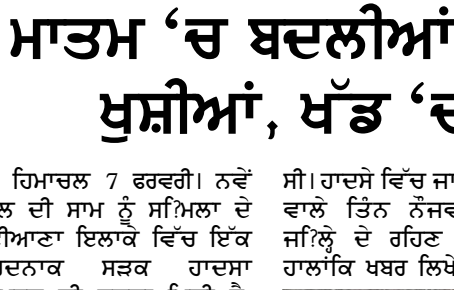
ਉਹਨਾਂ ਦੀ ਪਛਾਣ ਨਹੀਂ ਹੋ ਸਕੀ ਸੀ। ਪੁਲਸ ਨੇ ਉਨ੍ਹਾਂ ਦੇ ਪਰਿਵਾਰ ਵਾਲਿਆਂ ਨੂੰ ਸੂਚਿਤ ਕਰਕੇ ਸਨਾਖਤ ਦੀ ਕਾਰਵਾਈ ਤੇਜ਼ ਕਰ ਦਿੱਤੀ ਹੈ। ਨਵਾਂ ਸਾਲ ਮਨਾਉਣ ਦੇ ਤੇਜ਼ ਰਵਾਜ਼ ਦੌਰਾਨ 'ਤੇ ਦੁੱਖ ਦਾ ਪਹਾੜ ਡਿੱਗ ਪਿਆ। ਹਾਦਸੇ ਦੀ ਖਬਰ ਸੁਣ ਕੇ ਮਿਤ੍ਰਕਾਂ ਦੇ ਰਿਸ਼ਤੇਦਾਰ ਡੁੱਬੇ ਸਦਮੇ ਵਿੱਚ

ਗਿਆਚਲ 7 ਫਰਵਰੀ। ਨਵੇਂ ਸਾਲ ਦੀ ਸਾਮ ਨੂੰ ਸਮਿਲਾ ਦੇ ਮਟੀਆਣਾ ਇਲਾਕੇ ਵਿੱਚ ਇੱਕ ਦਰਦਨਾਕ ਸੜਕ ਹਾਦਸਾ ਵਾਪਰਨ ਦੀ ਸੂਚਨਾ ਮਿਲੀ ਹੈ, ਜਿਸ 'ਚ ਕਿੱਨੋਰ ਦੇ ਤਿੰਨ ਨੌਜਵਾਨਾਂ ਦੀ ਮੌਕੇ 'ਤੇ ਹੀ ਮੌਤ ਹੋ ਗਈ। ਇਹ ਹਾਦਸਾ ਨੌਸਲ ਹਾਈਵੇਅ 'ਤੇ ਮਟੀਆਣਾ ਨੇੜੇ ਪੈਟਰੋਲ ਪੰਪ ਨੇੜੇ ਇਕ ਸਮੇਂ ਵਾਪਰਿਆ, ਜਦੋਂ ਇਕ ਕਾਰ ਡੁੱਬੀ ਖਾਈ 'ਚ ਜਾ ਡਿੱਗੀ। ਹਾਦਸਾ ਗਤ ਕਰੀਬ 11:30 ਵਜੇ ਵਾਪਰਿਆ, ਜਦੋਂ ਕਾਰ ਸਮਿਲਾ ਤੋਂ ਰਾਮਪੁਰ ਵੱਲ ਜਾ ਰਹੀ ਸੀ। ਪੁਲਸ ਸੂਤਰਾਂ ਮੁਤਾਬਕ ਕਾਰ ਬੋਕਾਬੂ ਹੋ ਕੇ ਸੜਕ ਤੋਂ ਫਿਸਲ ਗਈ ਅਤੇ ਡੁੱਬੀ ਖਾਈ 'ਚ ਜਾ ਡਿੱਗੀ। ਹਾਦਸੇ ਤੋਂ ਤੁਰੰਤ ਬਾਅਦ ਮੌਕੇ 'ਤੇ ਹਾਕਾਕਾਰ ਮੌਜੂਦ ਗਏ। ਹਾਦਸੇ ਵਾਲੀ ਥਾਂ 'ਤੇ ਆਸ-ਪਾਸ ਦੇ ਲੋਕ ਅਤੇ ਬਿਅਨ ਪੁਸ਼ਾਨ ਪਹੁੰਚ ਗਿਆ। ਪਰ ਉਦੋਂ ਤੱਕ ਤਿੰਨੋਂ ਨੌਜਵਾਨਾਂ ਦੀ ਮੌਤ ਹੋ ਚੁੱਕੀ ਸੀ। ਹਾਦਸੇ ਵਿੱਚ ਜਾਨ ਗਵਾਉਣ ਵਾਲੇ ਤਿੰਨ ਨੌਜਵਾਨ ਕਿੱਨੋਰ ਜਿਲ੍ਹੇ ਦੇ ਰਹਿਣ ਵਾਲੇ ਹਨ। ਹਾਲਾਂਕਿ ਖਬਰ ਲਿਖੇ ਜਾਣ ਤੱਕ ਵਾਪਸ ਰਾਮਪੁਰ ਜਾ ਰਹੇ ਸਨ।