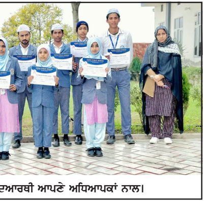
ਜੇਤੂ ਵਿਦਿਆਰਥੀ ਆਪਣੇ ਅਧਿਆਪਕਾਂ ਨਾਲ।

ਮਲੇਰਕੋਟਲਾ, 7 ਫਰਵਰੀ - ਕੌਮੀ ਪਤ੍ਰਿਕਾ ਬਿਊਰੋ - ਆਬਾਨ ਪਬਲਿਕ ਸਕੂਲ ਵਿੱਚ ਵਿਦਿਆਰਥੀਆਂ ਦੇ ਲੇਖ ਮੁਕਾਬਲੇ ਕਰਵਾਏ ਗਏ। ਇਨ੍ਹਾਂ ਮੁਕਾਬਲਿਆਂ ਵਿੱਚ ਤੀਜੀ ਜਮਾਤ ਤੋਂ ਲੈ ਕੇ ਬਾਰਵੀਂ ਜਮਾਤ ਤੱਕ ਦੇ ਵਿਦਿਆਰਥੀਆਂ ਨੇ ਭਾਗ ਲਿਆ। ਮੁਕਾਬਲਿਆਂ ਵਿੱਚ ਵਿਦਿਆਰਥੀਆਂ ਨੂੰ ਵੱਖ-ਵੱਖ ਵਿਸ਼ਿਆਂ 'ਤੇ ਲੇਖ ਲਿਖਣ ਨੂੰ ਕਿਹਾ ਗਿਆ। ਹਰੇਕ