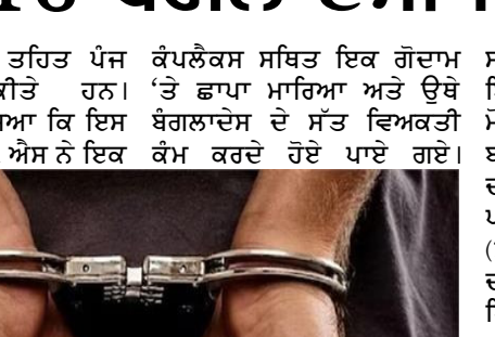
ਉਨ੍ਹਾਂ ਦੱਸਿਆ ਕਿ ਪੁਲਸ ਨੇ ਇਨ੍ਹਾਂ ਕੋਲੋਂ 35 ਹਜ਼ਾਰ ਰੁਪਏ ਦੇ ਮੋਬਾਈਲ ਫੋਨ ਅਤੇ ਹੋਰ ਸਾਮਾਨ ਬਰਾਮਦ ਕੀਤਾ ਹੈ। ਅਧਿਕਾਰੀ ਨੇ ਦੱਸਿਆ ਕਿ ਵਿਦੇਸ਼ੀ ਐਕਟ, ਪਾਸਪੋਰਟ ਐਕਟ ਅਤੇ ਪਾਸਪੋਰਟ (ਭਾਰਤ ਵਿਚ ਦਾਖਲਾ) ਐਕਟ ਦੀਆਂ ਧਾਰਾਵਾਂ ਤਹਿਤ ਉਸ ਦੇ ਖਿਲਾਫ ਦਰਜ ਕੀਤੀ ਗਈ ਹੈ।

ਕੰਪਲੈਕਸ ਸਥਿਤ ਇਕ ਗੋਦਾਮ ਅਧਿਕਾਰੀ ਨੇ ਦੱਸਿਆ ਅਤੇ ਉਥੇ ਬੰਗਲਾਦੇਸ ਦੇ ਸੱਤ ਵਿਅਕਤੀ ਦੱਸਿਆ ਕਿ ਵਿਦੇਸ਼ੀ ਐਕਟ, ਪਾਸਪੋਰਟ ਐਕਟ ਅਤੇ ਪਾਸਪੋਰਟ (ਭਾਰਤ ਵਿਚ ਦਾਖਲਾ) ਐਕਟ ਦੀਆਂ ਧਾਰਾਵਾਂ ਤਹਿਤ ਉਸ ਦੇ ਖਿਲਾਫ ਦਰਜ ਕੀਤੀ ਗਈ ਹੈ।