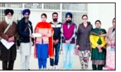
ਮਲੇਰਕੋਟਲਾ, 7 ਫਰਵਰੀ - ਕੌਮੀ ਪਤ੍ਰਿਕਾ ਬਿਊਰੋ - ਪੰਜਾਬ ਯੂਨੀਵਰਸਿਟੀ ਕੋਸਟੀਚੂਐਂਟ ਕਾਲਜ ਸਿੰਘਾਂਵਾਲਾ ਵਿੱਚ ਸ਼੍ਰੋਮਣੀ ਗੁਰਦੁਆਰਾ ਪ੍ਰਬੰਧਕ ਕਮੇਟੀ (ਪਹਮ ਪ੍ਰਚਾਰ ਕਮੇਟੀ) ਸ੍ਰੀ ਅੰਮ੍ਰਿਤਸਰ ਸਾਹਿਬ ਵਲੋਂ ਵਿਦਿਆਰਥੀਆਂ ਦਾ ਧਾਰਮਿਕ ਪ੍ਰੀਖਿਆ ਦਾ ਇਮਤਿਹਾਨ ਸਿੱਖ ਇਤਿਹਾਸ ਅਤੇ ਗ੍ਰਿਹ ਮਹਿਯਾਦਾ ਦਾ ਪੇਪਰ ਲਿਆ ਗਿਆ।

ਕੋਚਿੰਗ ਢਾਂਚੇ ਨੂੰ ਹੋਰ ਪੇਸ਼ੇਵਰ ਬਣਾਉਣ ਲਈ, ਅਸੀਂ ਪੂਰੇ ਭਾਰਤ ਵਿੱਚ 1000 ਤੋਂ ਵੱਧ ਖੇਲੋ ਇੰਡੀਆ ਸੇਂਟਰਾਂ (ਕੋਆਈਐਸ) ਵਿੱਚ ਸਾਬਕਾ ਚੈਂਪੀਅਨ ਐਥਲੀਟਾਂ (ਪੀਐਚਐ) ਨੂੰ ਮਾਰਗਦਰਸ਼ਕ