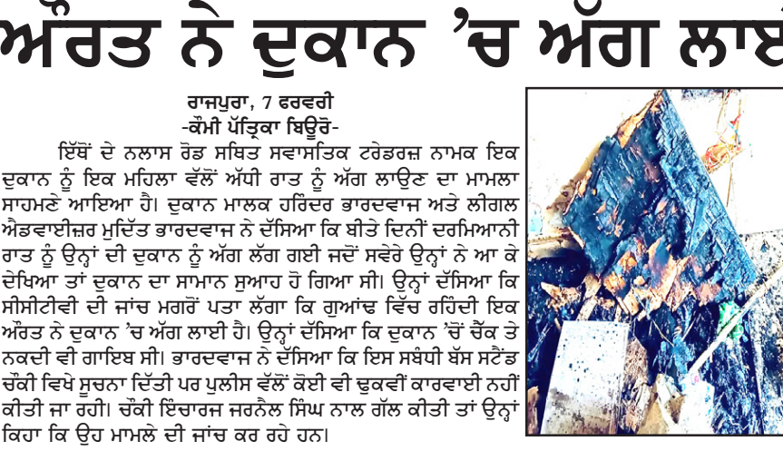
ਰਾਜਪੁਰਾ, 7 ਫਰਵਰੀ - ਕੌਮੀ ਪਤ੍ਰਿਕਾ ਬਿਊਰੋ -