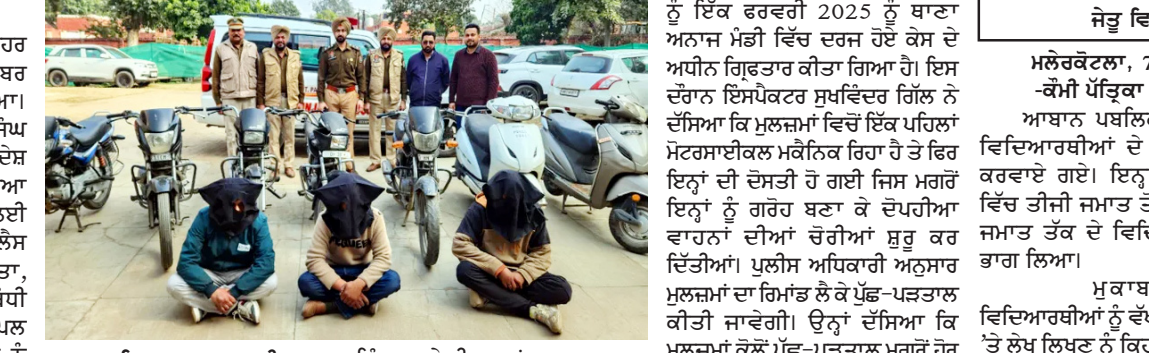
ਪਿੰਡ ਭਟੋੜੀ ਕਲਾਂ ਥਾਣਾ ਸਦਰ ਪਟਿਆਲਾ ਦੇ ਨਾਮ ਸ਼ਾਮਲ ਹਨ। ਉਨ੍ਹਾਂ