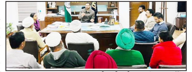
ਲੁਧਿਆਣਾ, 4 ਫਰਵਰੀ - ਕੌਮੀ ਪਤ੍ਰਿਕਾ ਬਿਊਰੋ-

ਨਾਮਧਾਰੀ ਸੰਪਰਦਾ ਦੇ ਬਾਨੀ ਅਤੇ ਆਧੁਨਿਕ ਆਚਾਰੀ ਲਹਿਰ ਦੇ ਮੌਢੀ ਸਤਿਗੁਰੂ ਰਾਮ ਸਿੰਘ ਜੀ ਦੇ 209ਵੇਂ ਪ੍ਰਕਾਸ਼ ਪੁਰਬ ਨੂੰ ਮਨਾਉਣ ਲਈ ਪੰਜਾਬ ਸਰਕਾਰ ਵੱਲੋਂ 2 ਫਰਵਰੀ ਨੂੰ ਸ਼੍ਰੀ ਭੋਲੀ ਸਾਹਿਬ ਵਿਖੇ ਰਾਜ ਪੱਧਰੀ ਸਮਾਗਮ ਕਰਵਾਇਆ ਜਾ ਰਿਹਾ ਹੈ।