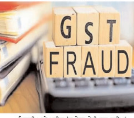
ਵਿਕਰੀ ਅਤੇ ਖਰੀਦ 'ਚ ਹੋਰ-ਫੇਰੀ ਕਰ ਰਹੀਆਂ ਹਨ। ਜਦੋਂ ਹੋਰ ਜਾਂਚ ਕੀਤੀ ਗਈ ਤਾਂ ਪਤਾ ਲੱਗਾ

ਵਿਭਾਗ ਦੇ ਅਧਿਕਾਰੀਆਂ ਨੇ ਦੱਸਿਆ ਕਿ ਜਦੋਂ ਵਿਭਾਗ ਵੱਲੋਂ ਫਰਮਾਂ ਦੇ ਰਿਕਾਰਡ ਦੀ ਜਾਂਚ ਕੀਤੀ ਗਈ ਤਾਂ ਉਨ੍ਹਾਂ ਨੂੰ ਪਤਾ ਲੱਗਾ ਕਿ ਉਕਤ ਫਰਮਾਂ