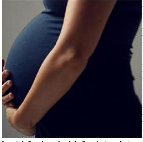
ਕਿ ਪਤੀ ਨੇ ਔਰਤ ਨੂੰ ਤਾਅਨੇ ਮਾਰੇ ਕਿ ਉਹ ਕੋਈ ਵੀ ਉਸ ਨਾਲ ਵਿਆਹ ਨਹੀਂ ਕਰਨਾ ਚਾਹੁੰਦਾ ਸੀ, ਕਿਉਂਕਿ ਉਹ ਕਿਸੇ ਹੋਰ ਔਰਤ ਨਾਲ ਪਿਆਰ ਕਰਦਾ

ਇੱਕ ਪਟੀਸ਼ਨ ਦਾਇਰ ਕਰਕੇ ਗਰਭਪਾਤ ਦੀ ਇਜਾਜ਼ਤ ਮੰਗੀ ਸੀ। ਪਟੀਸ਼ਨ ਵਿੱਚ ਕਿਹਾ ਗਿਆ ਹੈ ਸੀ। ਔਰਤ ਨੇ ਦੋਸ਼ ਲਗਾਇਆ ਕਿ ਉਸਦੇ ਪਤੀ ਨੇ ਤਾਂ ਇਹ ਵੀ ਦਾਅਵਾ ਕੀਤਾ ਸੀ ਕਿ ਜੇ ਬੱਚਾ ਪੈਦਾ ਹੋਣ ਵਾਲਾ ਹੈ, ਉਹ ਉਸਦਾ ਨਹੀਂ ਹੈ ਅਤੇ ਉਹ ਇਸਨੂੰ ਸਵੀਕਾਰ ਨਹੀਂ ਕਰੇਗਾ। ਇਸ ਜੋੜੇ ਦਾ ਵਿਆਹ ਮਈ 2023 ਵਿੱਚ ਹੋਇਆ ਸੀ। ਇਸ ਤੋਂ ਬਾਅਦ ਔਰਤ ਨੇ ਪੁਣੇ ਦੀ ਇੱਕ ਮੈਜਿਸਟ੍ਰੇਟ ਅਦਾਲਤ ਵਿੱਚ ਘਰੇਲੂ ਹਿੰਸਾ ਦੀ ਸ਼ਿਕਾਇਤ ਦਰਜ ਕਰਵਾਈ ਸੀ। ਹਾਈ ਕੋਰਟ ਦੇ ਸਾਹਮਣੇ ਦਾਇਰ ਕੀਤੇ ਗਏ ਜਵਾਬੀ ਹਲਕਾਨਾਮੇ ਵਿੱਚ ਪਤੀ ਨੇ ਪਟੀਸ਼ਨ ਵਿੱਚ ਲਗਾਏ ਗਏ ਦੋਸ਼ਾਂ ਤੋਂ ਇਨਕਾਰ ਕੀਤਾ ਹੈ। ਉਹਨਾਂ ਨੇ ਦਾਅਵਾ ਕੀਤਾ ਕਿ ਉਹਨਾਂ ਨੇ ਅਤੇ ਉਸਦੇ ਮਾਪਿਆਂ ਨੇ ਕਈ ਵਾਰ ਝਗੜੇ ਨੂੰ ਸੁਲਝਾਉਣ ਲਈ ਕੋਸ਼ਿਸ਼ ਕੀਤੀ ਪਰ ਉਸਦੀ ਪਤਨੀ ਨੇ ਕੋਈ ਜਵਾਬ ਨਹੀਂ ਦਿੱਤਾ। ਜੱਜਾਂ ਨੇ ਸੋਮਵਾਰ ਨੂੰ ਆਦਮੀ ਅਤੇ ਔਰਤ ਨਾਲ ਗੱਲਬਾਤ ਕੀਤੀ ਅਤੇ ਪਾਇਆ ਕਿ ਦੋਵਾਂ ਵਿੱਚ ਇੱਕ ਦੂਜੇ ਨੂੰ ਸਮਝਣ ਅਤੇ ਆਪਣੀਆਂ ਸਮੱਸਿਆਵਾਂ ਹੱਲ ਕਰਨ ਲਈ ਕਾਫੀ ਪਰਿਪੱਕਤਾ ਸੀ। ਹਾਈ ਕੋਰਟ ਨੇ ਆਪਣੇ ਹੁਕਮ ਵਿੱਚ ਕਿਹਾ, "ਪਤਨੀ ਨੇ ਕਿਹਾ ਹੈ ਕਿ ਜੇਕਰ ਉਸਦਾ ਪਤੀ ਬੱਚੇ ਦੀ ਚੰਗੀ ਦੇਖਭਾਲ ਕਰਨ ਅਤੇ ਉਸਦੇ ਨਾਲ ਸਹੀ