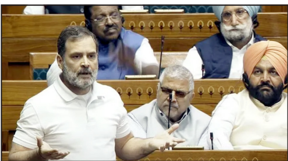
ਨਵੀਂ ਦਿੱਲੀ, 4 ਫਰਵਰੀ - ਕੌਮੀ ਪਤ੍ਰਿਕਾ ਬਿਊਰੋ- ਪ੍ਰਧਾਨ ਮੰਤਰੀ ਮੋਦੀ ਨੇ ਕੋਸ਼ਿਸ਼ ਕੀਤੀ, ਸੰਕਲਪ ਵਜੋਂ 'ਮੇਕ ਇਨ ਇੰਡੀਆ' ਚੰਗਾ ਵਿਚਾਰ ਸੀ, ਪਰ ਮੋਦੀ ਅਸਫਲ ਰਹੇ

ਪ੍ਰਧਾਨ ਮੰਤਰੀ ਮੋਦੀ ਨੇ ਕੋਸ਼ਿਸ਼ ਕੀਤੀ, ਸੰਕਲਪ ਵਜੋਂ 'ਮੇਕ ਇਨ ਇੰਡੀਆ' ਚੰਗਾ ਵਿਚਾਰ ਸੀ, ਪਰ ਮੋਦੀ ਅਸਫਲ ਰਹੇ