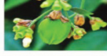
ਵਿਚ ਦੂਸਰੇ ਰੁੱਖਾਂ ਦੇ ਮੁਕਾਬਲੇ ਆਦਰਸ਼ਗਤ ਸਥਾਨ ਬਣਾਉਂਦਾ ਹੈ।