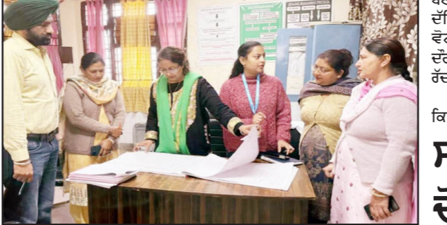
ਤਰਨ ਤਾਰਨ, 24 ਫਰਵਰੀ - ਕੌਮੀ ਪਤ੍ਰਿਕਾ ਬਿਊਰੋ-