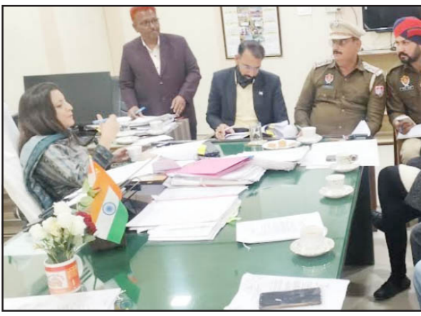
ਫ਼ਾਜ਼ਿਲਕਾ, 24 ਫਰਵਰੀ - ਕੌਮੀ ਪਤ੍ਰਿਕਾ ਬਿਊਰੋ-