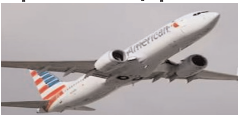
ਬੋਇੰਗ 787 ਡਰਾਗੋਨੈੱਜ ਨੇ ਸ਼ਨੀਵਾਰ ਰਾਤ ਸਵਾ 8 ਵਜੇ ਜੈਅੰਫੋਕੋ ਤੋਂ ਉਡਾਣ ਭਰੀ ਸੀ। ਧਮਕੀ ਦੇ ਸਮੇਂ ਜਹਾਜ਼ ਕੋਸਪੀਅਨ ਸਮੁੰਦਰ ਦੇ ਉੱਪਰ ਸੀ, ਪਰ ਚਾਲਕ ਦਲ ਨੇ ਅਲਰਟ ਜਾਰੀ ਕਰਦੇ ਹੋਏ ਜਹਾਜ਼ ਨੂੰ ਅਗਲੇਰੀ ਜਾਂਚ ਕੀਤੀ ਜਾ ਰਹੀ ਹੈ।

ਜਹਾਜ਼ ਨੂੰ ਇਟਲੀ ਦੇ ਰੋਮ ਵੱਲ ਮੋੜ ਦਿੱਤਾ ਗਿਆ। ਤੁਰੰਤ ਯੂਰਪ ਵੱਲ ਮੋੜ ਦਿੱਤਾ। ਜਹਾਜ਼ ਨੂੰ ਹਾਈ ਤਿੱਜਿੰਦਰ ਕੌਰ ਬੱਬਰ ਨੈਸ਼ਨਲ ਡੈਸਕ 24 ਫਰਵਰੀ। ਅਮਰੀਕੀ ਏਅਰਲਾਈਨਜ਼ ਦੀ ਫਲਾਈਟ ਏਏ-292, ਜੋ ਕਿ ਨਿਊਯਾਰਕ ਤੋਂ ਨਵੀਂ ਦਿੱਲੀ ਜਾ ਰਹੀ ਸੀ, ਨੂੰ ਸੁਰੱਖਿਆ ਖ਼ਤਰ ਕਾਰਨ ਰੋਮ (ਇਟਲੀ) ਵੱਲ ਮੋੜ ਦਿੱਤਾ ਗਿਆ ਹੈ। ਬੰਬ ਦੀ ਧਮਕੀ ਵਾਲੀ ਈਮੇਲ ਮਿਲਣ ਤੋਂ ਬਾਅਦ ਫਲਾਈਟ ਨੂੰ ਰੋਮ ਦੇ ਫਿਊਲਿਸ਼ੀਨੋ ਹਵਾਈ ਅੱਡੇ ਵੱਲ ਮੋੜ ਦਿੱਤਾ ਗਿਆ ਸੀ। ਸੁਤਰਾਂ ਮੁਤਾਬਕ ਨਿਊਯਾਰਕ ਤੋਂ ਉਡਾਣ ਭਰਨ ਤੋਂ ਬਾਅਦ ਚਾਲਕ ਦਲ ਦੇ ਮੈਂਬਰਾਂ ਨੂੰ ਸੰਭਾਵਿਤ ਵਿਸਫੋਟ ਯੰਤਰ ਦੀ ਸੂਚਨਾ ਮਿਲੀ ਸੀ। ਇਸ ਤੋਂ ਬਾਅਦ ਫਲਾਈਟ ਨੂੰ ਰੋਮ, ਇਟਲੀ ਵੱਲ ਮੋੜ ਦਿੱਤਾ ਗਿਆ। ਜਾਣਕਾਰੀ ਮੁਤਾਬਕ, ਅਮਰੀਕੀ ਏਅਰਲਾਈਨਜ਼ ਦਾ ਜਹਾਜ਼ ਰੋਮ ਵਿੱਚ ਸ਼ਾਮ 5.30 ਵਜੇ ਸਫਲਤਾ ਪੂਰਵਕ ਉਤਰਨ 'ਤੇ ਸਾਰਿਆਂ ਨੂੰ ਸੁੱਖ ਦਾ ਸਾਹ ਲਿਆ। ਅਮਰੀਕੀ ਏਅਰਲਾਈਨਜ਼ ਨਿਊਯਾਰਕ ਜ਼ੈਅੰਫੋਕੋ-ਦਿੱਲੀ ਨਾਨ-ਸਟਾਪ (ਏਏ-292) ਉਡਾਣ ਔਰਤਵਾਦ ਨੂੰ ਭਾਰਤ ਦੀ ਰਾਜਧਾਨੀ ਵੱਲ ਆ ਰਹੀ ਸੀ। ਇਸ ਦੌਰਾਨ ਸਮੁੱਚੇ ਵਿਚਾਲੇ ਜਹਾਜ਼ ਨੂੰ ਬੰਬ ਨਾਲ ਉਡਾਉਣ ਦੀ ਧਮਕੀ ਦਿੱਤੀ ਗਈ। ਕੁ ਮੈਂਬਰਾਂ ਨੂੰ ਕਿਹਾ ਗਿਆ ਕਿ ਜਹਾਜ਼ ਵਿੱਚ ਬੰਬ ਹੈ। ਇਸ ਤੋਂ ਬਾਅਦ ਅਲਰਟ ਵਿਚਾਲੇ ਰੋਮ ਦੇ ਲਿਓਨਾਰਦੋ ਦਾ ਵਿੰਚੀ-ਫੁਆਮਿਨਿਓ ਏਅਰਗੇਟ 'ਤੇ ਔਰਤਵਾਦ ਸ਼ਾਮ 5.30 ਵਜੇ ਸਮੇਂ ਜਹਾਜ਼ ਕੋਸਪੀਅਨ ਸਮੁੰਦਰ ਦੇ ਉੱਪਰ ਸੀ, ਪਰ ਚਾਲਕ ਦਲ ਨੇ ਅਲਰਟ ਜਾਰੀ ਕਰਦੇ ਹੋਏ ਜਹਾਜ਼ ਨੂੰ ਅਗਲੇਰੀ ਜਾਂਚ ਕੀਤੀ ਜਾ ਰਹੀ ਹੈ।