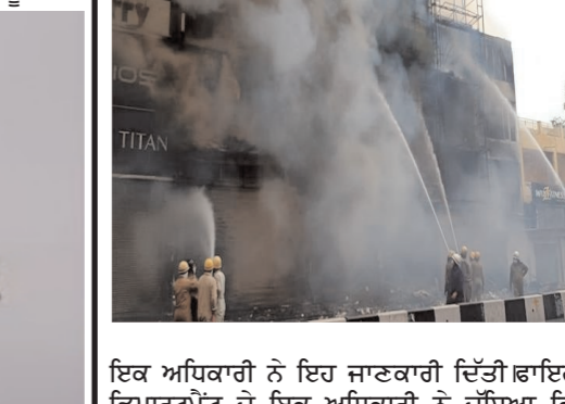
ਇਕ ਅਧਿਕਾਰੀ ਨੇ ਇਹ ਜਾਣਕਾਰੀ ਦਿੱਤੀ ਫਾਇਰ ਡਿਪਾਰਟਮੈਂਟ ਦੇ ਇਕ ਅਧਿਕਾਰੀ ਨੇ ਦੱਸਿਆ ਕਿ ਸਾਨੂੰ ਲਾਜਪਤ ਨਗਰ ਦੇ ਇਕ ਰੈਸਟੋਰੈਂਟ 'ਚ ਅੱਗ ਲੱਗਣ ਦੀ ਸੂਚਨਾ ਮਿਲੀ। ਅਸੀਂ ਫਾਇਰ ਬ੍ਰਿਗਡ ਦੀਆਂ ਚਾਰ ਗੱਡੀਆਂ ਨੂੰ ਮੌਕੇ 'ਤੇ ਭੇਜਿਆ। ਉਨ੍ਹਾਂ ਦੱਸਿਆ ਕਿ ਅੱਗ 'ਤੇ ਪੂਰੀ ਤਰ੍ਹਾਂ ਕਾਬੂ ਪਾ ਲਿਆ ਗਿਆ। ਇਸ ਘਟਨਾ ਦੀ ਵਿਸਥਾਰਪੂਰਵਕ ਜਾਂਚ ਲਈ ਪੁਲਸ ਨੂੰ ਸੂਚਨਾ ਦੇ ਦਿੱਤੀ ਗਈ ਹੈ।

ਨਵੀਂ ਦਿੱਲੀ 24 ਫਰਵਰੀ। ਦੱਖਣੀ-ਪੂਰਬੀ ਦਿੱਲੀ ਦੇ ਲਾਜਪਤ ਨਗਰ ਇਲਾਕੇ 'ਚ ਸੋਮਵਾਰ ਨੂੰ ਇਕ ਰੈਸਟੋਰੈਂਟ 'ਚ ਅੱਗ ਲੱਗ ਗਈ, ਹਾਲਾਂਕਿ ਇਸ 'ਚ ਕੋਈ ਜ਼ਖਮੀ ਨਹੀਂ ਹੋਇਆ ਹੈ। ਫਾਇਰ ਵਿਭਾਗ ਦੇ ਇਕ ਅਧਿਕਾਰੀ ਨੇ ਇਹ ਜਾਣਕਾਰੀ ਦਿੱਤੀ ਫਾਇਰ ਡਿਪਾਰਟਮੈਂਟ ਦੇ ਇਕ ਅਧਿਕਾਰੀ ਨੇ ਦੱਸਿਆ ਕਿ ਸਾਨੂੰ ਲਾਜਪਤ ਨਗਰ ਦੇ ਇਕ ਰੈਸਟੋਰੈਂਟ 'ਚ ਅੱਗ ਲੱਗਣ ਦੀ ਸੂਚਨਾ ਮਿਲੀ। ਅਸੀਂ ਫਾਇਰ ਬ੍ਰਿਗਡ ਦੀਆਂ ਚਾਰ ਗੱਡੀਆਂ ਨੂੰ ਮੌਕੇ 'ਤੇ ਭੇਜਿਆ। ਉਨ੍ਹਾਂ ਦੱਸਿਆ ਕਿ ਅੱਗ 'ਤੇ ਪੂਰੀ ਤਰ੍ਹਾਂ ਕਾਬੂ ਪਾ ਲਿਆ ਗਿਆ। ਇਸ ਘਟਨਾ ਦੀ ਵਿਸਥਾਰਪੂਰਵਕ ਜਾਂਚ ਲਈ ਪੁਲਸ ਨੂੰ ਸੂਚਨਾ ਦੇ ਦਿੱਤੀ ਗਈ ਹੈ।