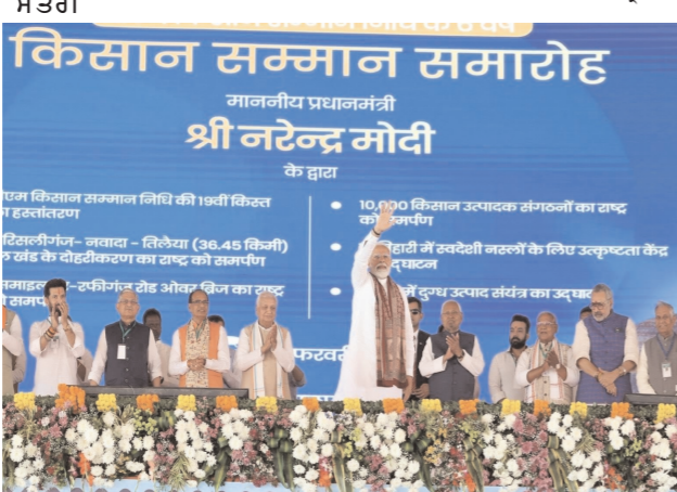
ਪ੍ਰਧਾਨ ਮੰਤਰੀ ਨਰਿੰਦਰ ਮੋਦੀ ਨੇ ਅਸਮ ਵਿੱਚ ਸ਼੍ਰੀ ਨਰੇਂਦਰ ਮੋਦੀ ਕੇਂਦਰ ਦਾ ਉਦਘਾਟਨ ਕਰਦੇ ਹੋਏ ਸ਼ਾਨਦਾਰ ਸਵਾਗਤ ਕੀਤਾ।

ਬਿਹਾਰ ਪਹੁੰਚੇ, ਜਿੱਥੇ ਉਨ੍ਹਾਂ ਨੇ ਪ੍ਰਧਾਨ ਮੰਤਰੀ ਕਿਸਾਨ ਯੋਜਨਾ ਦੇ ਤਹਿਤ ਦੇਸ਼ ਭਰ ਦੇ ਨਿਰਭਰ ਬਣਨ ਦਾ ਰਾਹ ਵੀ ਪੱਧਰਾ ਕਰੇਗੀ। ਪ੍ਰਧਾਨ ਮੰਤਰੀ ਨੇ ਬਿਹਾਰ ਦੇ ਕਿਸਾਨਾਂ ਦੀ ਸਖ਼ਤ ਮਿਹਨਤ ਅਤੇ ਯੋਗਦਾਨ ਦੀ ਸ਼ਲਾਘਾ ਕੀਤੀ ਅਤੇ ਉਨ੍ਹਾਂ ਨੂੰ ਆਪਣੀ ਸਰਕਾਰ ਵੱਲੋਂ ਸਹਾਇਤਾ ਦਾ ਭਰੋਸਾ ਦਿੱਤਾ। ਅੰਤ ਵਿੱਚ, ਪ੍ਰਧਾਨ ਮੰਤਰੀ ਅਸਮ ਪਹੁੰਚੇ, ਜਿੱਥੇ ਉਨ੍ਹਾਂ ਦਾ ਸ਼ਾਨਦਾਰ ਸਵਾਗਤ ਕੀਤਾ ਗਿਆ। ਅਸਮ ਵਿੱਚ, ਪ੍ਰਧਾਨ ਮੰਤਰੀ ਨੂੰ 9000 ਕਲਾਕਾਰਾਂ ਦੁਆਰਾ ਪੇਂਟ ਕੀਤੇ ਗਏ ਬੁੱਝੇ ਇੱਕ ਬਿਨੈਦਨੀ ਨਾਚ ਨੂੰ ਦੇਖਣ ਦਾ ਸਨਮਾਨ ਪ੍ਰਾਪਤ ਹੋਇਆ। ਇਸ ਨਾਚ ਪ੍ਰਦਰਸ਼ਨ ਨੇ ਅਸਮ ਦੀ ਅਮੀਰ ਸੱਭਿਆਚਾਰਕ ਵਿਰਾਸਤ ਨੂੰ ਪ੍ਰਦਰਸ਼ਿਤ ਕੀਤਾ ਅਤੇ ਰਾਜ ਦੀ ਕਲਾ ਅਤੇ ਸੱਭਿਆਚਾਰ ਨੂੰ ਉਤਸ਼ਾਹਿਤ ਕੀਤਾ। ਇਸ ਤਰ੍ਹਾਂ, ਪ੍ਰਧਾਨ ਮੰਤਰੀ ਨਰਿੰਦਰ ਮੋਦੀ ਨੇ ਇੱਕ ਦਿਨ ਵਿੱਚ ਤਿੰਨ ਰਾਜਾਂ ਵਿੱਚ ਕਿਸਾਨਾਂ ਦੇ ਖਾਤਿਆਂ ਵਿੱਚ ਸਿੱਧੇ ਲਾਭ ਭੇਜੇ। ਇਹ ਪਹਿਲ ਨਾ ਸਿਰਫ਼ ਕਿਸਾਨਾਂ ਨੂੰ ਆਰਥਿਕ ਵਿਰਾਸਤ ਨੂੰ ਉਤਸ਼ਾਹਿਤ ਕਰਨ ਵੱਲ ਸਹਾਇਤਾ ਪ੍ਰਦਾਨ ਕਰੇਗੀ ਸਗੋਂ ਉਨ੍ਹਾਂ ਨੂੰ ਸਵੈ-ਮਹੱਤਵਪੂਰਨ ਕਰਮ ਚੁੱਕੇ।