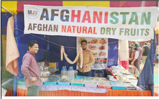
ਸਰਸ ਮੇਲੇ 'ਚ ਸ਼ੀਸ਼ ਮਹਿਲ ਵਿਖੇ ਅਫਗਾਨਿਸਤਾਨ, ਮਿਸਰ, ਤੁਰਕੀ ਅਤੇ ਥਾਈਲੈਂਡ ਦੀਆਂ ਸਟਾਲਾਂ ਦੀਆਂ ਵੱਖ-ਵੱਖ ਤਸਵੀਰਾਂ।

ਪਟਿਆਲਾ, 24 ਫਰਵਰੀ -ਅਮਰਜੀਤ ਸਿੰਘ ਲਾਂਬਾ-ਕੌਮੀ ਪੱਤ੍ਰਿਕਾ ਖਿਉਰੋ- ਪਟਿਆਲਾ ਜ਼ਿਲ੍ਹਾ ਪ੍ਰਸ਼ਾਸਨ ਵੱਲੋਂ ਪਟਿਆਲਾ ਹੋਰੀਟੇਨ ਮੇਲੇ ਤਹਿਤ ਇੱਥੇ ਸ਼ੀਸ਼ ਮਹਿਲ ਵਿਖੇ ਲਗਾਇਆ ਗਿਆ ਸਰਸ (ਦਿਹਾਤੀ ਕਾਰੀਗਰਾਂ ਦੀਆਂ ਵਸਤੂਆਂ ਦੀ ਵਿਕਰੀ) ਮੇਲਾ ਅੱਜ ਪੂਰੇ ਜੋਬਨ 'ਤੇ ਹੈ ਅਤੇ ਇਹ ਲੋਕਾਂ ਲਈ ਵੱਡੇ ਪੱਧਰ 'ਤੇ ਖਿੱਚ ਦਾ ਕੇਂਦਰ ਬਣਿਆ ਹੋਇਆ ਹੈ।