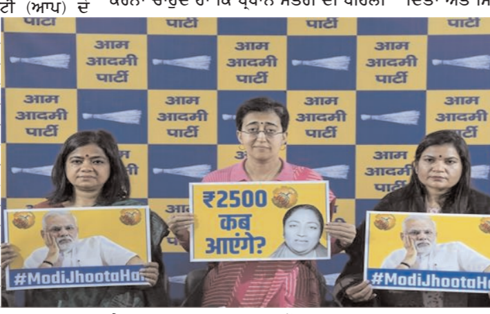
ਕੋਬਿਨਦ ਮੀਟਿੰਗ ਤੋਂ ਬਾਅਦ ਔਰਤਾਂ ਨੂੰ 2,500 ਰੁਪਏ ਦਿੱਤੇ ਜਾਣਗੇ, ਪ੍ਰਧਾਨ ਮੰਤਰੀ ਦਾ ਵਾਅਦਾ

ਵਿੱਚ ਉਨ੍ਹਾਂ ਦੇ ਦਫ਼ਤਰ ਦੇ ਬਾਹਰ ਹਾਂ। ਅਸੀਂ ਉਨ੍ਹਾਂ ਨਾਲ ਪ੍ਰਧਾਨ ਮੰਤਰੀ ਮੋਦੀ ਦੇ ਵਾਅਦੇ ਬਾਰੇ ਗੱਲ ਕਰਨਾ ਚਾਹੁੰਦੇ ਹਾਂ ਕਿ ਪ੍ਰਧਾਨ ਮੰਤਰੀ ਦੀ ਪਹਿਲੀ ਝੂਠਾ ਸਾਬਤ ਹੋਇਆ ਹੈ। ਆਤਿਸ਼ੀ ਨੇ ਅੱਗੇ ਕਿਹਾ ਕਿ ਮੁੱਖ ਮੰਤਰੀ ਨੇ ਉਨ੍ਹਾਂ ਨੂੰ ਕੋਈ ਭਰੋਸਾ ਨਹੀਂ ਦਿੱਤਾ ਅਤੇ ਸਿਰਫ ਇਹ ਕਿਹਾ ਕਿ ਉਹ 8 ਮਾਰਚ ਤੱਕ ਆਪਣਾ ਵਾਅਦਾ ਪੂਰਾ ਕਰਨ ਦੀ ਪੂਰੀ ਕੋਸ਼ਿਸ਼ ਕਰ ਰਹੇ ਹਨ। ਇਹ ਪ੍ਰਦਰਸ਼ਨ ਸੋਮਵਾਰ ਨੂੰ ਨਵੀਂ ਬਣੀ ਦਿੱਲੀ ਵਿਧਾਨ ਸਭਾ ਦੇ ਪਹਿਲੇ ਸੈਸ਼ਨ ਦੀ ਸ਼ੁਰੂਆਤ ਦੌਰਾਨ ਹੋਇਆ। ਭਾਜਪਾ 27 ਸਾਲਾਂ ਦੇ ਵਕਫ਼ੇ ਤੋਂ ਬਾਅਦ ਦਿੱਲੀ 'ਚ ਸੱਤਾ 'ਚ ਵਾਪਸ ਆਈ ਹੈ। ਭਾਜਪਾ ਨੇ 5 ਫਰਵਰੀ ਨੂੰ ਹੋਈਆਂ ਵਿਧਾਨ ਸਭਾ ਚੋਣਾਂ 'ਚ 70 'ਚੋਂ 48 ਸੀਟਾਂ ਜਿੱਤ ਕੇ ਦਿੱਲੀ 'ਚ ਆਮ ਆਦਮੀ ਪਾਰਟੀ (ਆਪ) ਦੇ ਦਹਾਕੇ ਲੰਬੇ ਸ਼ਾਸਨ ਦਾ ਅੰਤ ਕਰ ਦਿੱਤਾ। ਵਿਰੋਧੀ ਪਾਰਟੀ 'ਆਪ' ਦੇ ਦਫ਼ਤਰ 'ਚ 22 ਵਿਧਾਇਕ ਹਨ।