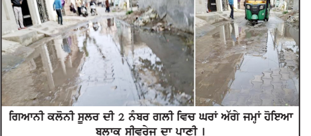
ਗਿਆਨ ਕਲੋਨੀ ਸੁਲਰ ਦੀ 2 ਨੰਬਰ ਗਲੀ ਵਿੱਚ ਘਰਾਂ ਅੱਗੇ ਜਮ੍ਹਾਂ ਹੋਇਆ ਬਲਾਕ ਸੀਵਰੇਜ ਦਾ ਪਾਣੀ।

ਪਟਿਆਲਾ, 3 ਫਰਵਰੀ - ਕੌਮੀ ਪੱਤ੍ਰਿਕਾ ਬਿਊਰੋ- ਪਿੰਡ ਸੁਲਰ ਵਿੱਚ ਪੈਂਦੀ ਗਿਆਨ ਕਲੋਨੀ ਦੀ 2 ਨੰਬਰ ਗਲੀ ਵਿੱਚ ਸੀਵਰੇਜ਼ ਬਲਾਕ ਹੋਣ ਕਾਰਨ ਸੀਵਰੇਜ਼ ਦਾ ਗੰਦਾ ਪਾਣੀ ਘਰਾਂ ਅੱਗੇ ਜਮ੍ਹਾਂ ਹੋ ਗਿਆ ਹੈ। ਹਾਲਾਤ ਇਹ ਹਨ ਇਕ-ਦੋ ਥਾਈਂ ਗੰਦਾ ਪਾਣੀ ਖੜ੍ਹਾ ਹੋ ਰਿਹਾ ਹੈ, ਜਿਸ ਕਾਰਨ ਆਸੇ ਪਾਸੇ ਦੇ ਘਰਾਂ ਵਿੱਚ ਤਾਂ ਬਲਕਿ ਆਉਂਦੀ ਤਾਂ ਹੀ ਹੈ, ਬਲਕਿ ਬਿਮਾਰੀਆਂ ਫੈਲਣ ਦਾ ਵੀ ਖਦਸ਼ਾ ਹੈ।