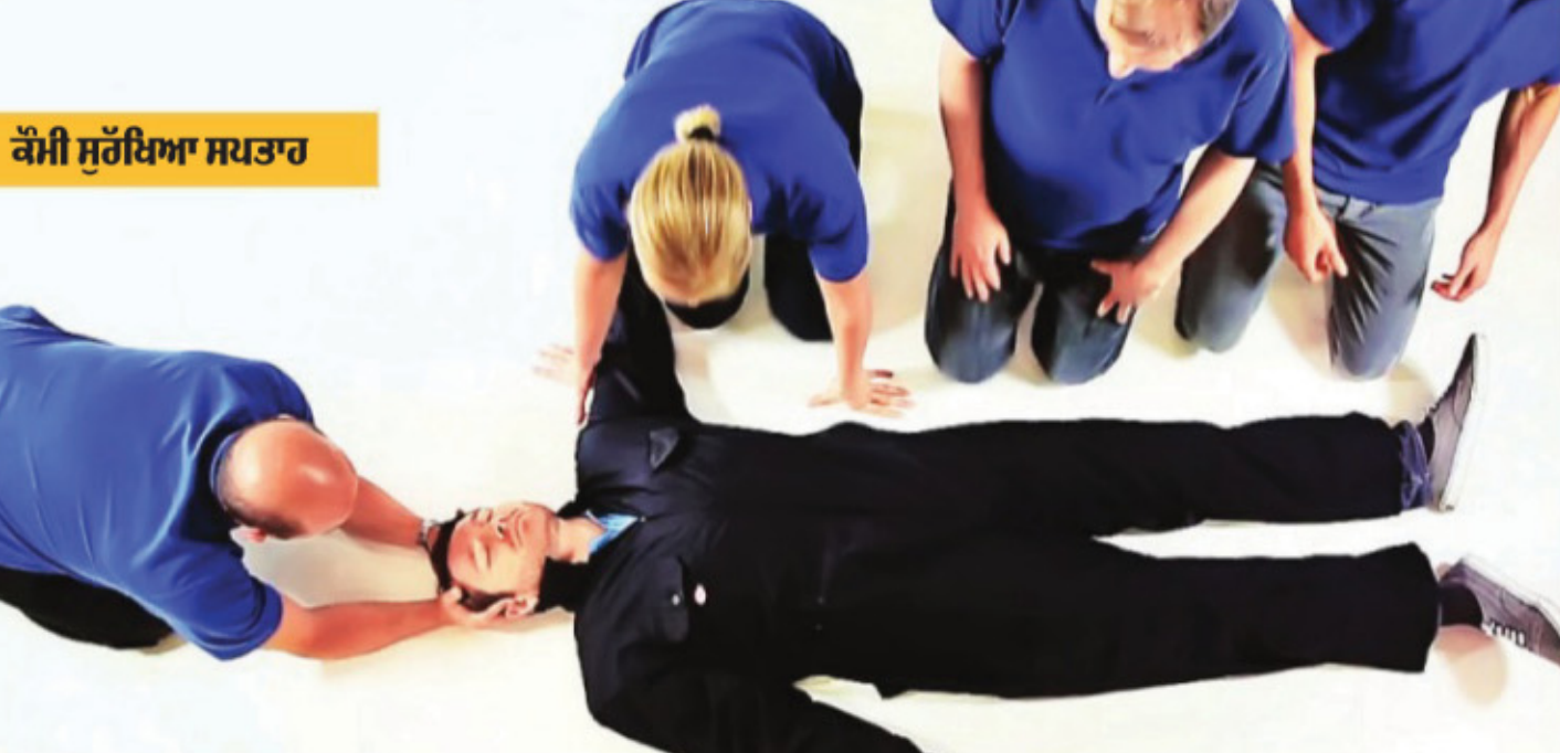
ਕੌਮੀ ਸੁਰੱਖਿਆ ਸਭਾਤਰ