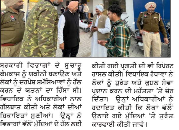
ਸਰਕਾਰੀ ਵਿਭਾਗਾਂ ਦੇ ਸੁਚਾਰੂ ਕੰਮਕਾਜ ਨੂੰ ਯਕੀਨੀ ਬਣਾਉਣ ਅਤੇ ਲੋਕਾਂ ਨੂੰ ਦਰਪੇਸ਼ ਸਮੀਖਿਆਵਾਂ ਨੂੰ ਕਰਨ ਦੇ ਯਤਨਾਂ ਦਾ ਹਿੱਸਾ ਸੀ। ਵਿਧਾਇਕ ਨੇ ਅਧਿਕਾਰੀਆਂ ਨਾਲ ਗੱਲਬਾਤ ਕੀਤੀ ਅਤੇ ਲੋਕਾਂ ਦੀਆਂ ਸ਼ਿਕਾਇਤਾਂ ਸੁਣੀਆਂ। ਉਨ੍ਹਾਂ ਵਿਭਾਗਾਂ ਵੱਲੋਂ ਮੁੱਦਿਆਂ ਦੇ ਹੱਲ ਲਈ