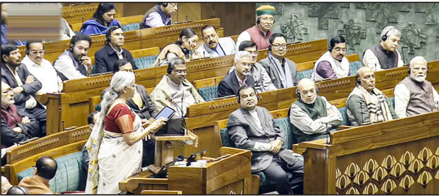
ਕੇਂਦਰੀ ਬਜਟ ਦੇ ਅਹਿਮ ਨੁਕਤੇ

ਕੇਂਦਰੀ ਕਰੈਡਿਟ ਵੱਲੋਂ ਬਜਟ ਨੂੰ ਮਨਜ਼ੂਰੀ ਪ੍ਰਧਾਨ ਮੰਤਰੀ ਨਰਿੰਦਰ ਮੋਦੀ ਦੀ ਅਗਵਾਈ ਵਾਲੀ ਕੇਂਦਰੀ ਕੋਥਿਨਟ ਨੇ ਵਿੱਤੀ ਸਾਲ 2025-26 ਲਈ ਆਮ ਬਜਟ ਨੂੰ ਮਨਜ਼ੂਰੀ ਦੇ ਦਿੱਤੀ ਹੈ। ਮੋਦੀ ਸਰਕਾਰ ਦੇ ਤਿੰਨ ਕਾਰਜਕਾਲ ਦਾ ਇਹ ਦੂਜਾ ਬਜਟ ਹੈ। ਕੋਥਿਨਟ ਮੀਟਿੰਗ ਮਗਰੋਂ ਮੋਦੀ ਨੇ ਕਿਹਾ ਕਿ ਇਹ ਆਮ ਲੋਕਾਂ