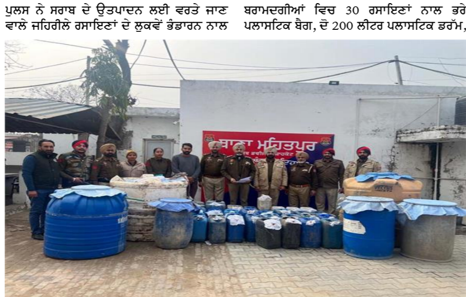
ਸਬੰਧਤ ਇੱਕ ਵੱਡੇ ਪੱਧਰ 'ਤੇ ਕਾਰਵਾਈ ਦਾ ਪਰਦਾਫਾਸ਼ ਕੀਤਾ। ਫਰਸ਼ ਦੇ ਹੇਠਾਂ ਲੁਕੇ ਹੋਏ 1000 ਲੀਟਰ ਪਲਾਸਟਿਕ ਟੈਂਕ ਮਿਲੇ, ਜਿਨ੍ਹਾਂ ਦਾ ਪਤਾ ਇੱਕ ਭੂਮੀਗਤ ਪੰਪ ਸਿਸਟਮ ਨਾਲ ਬਿਜਲੀ ਦੀਆਂ ਤਾਰਾਂ ਦੀ ਪਾਲਣਾ ਕਰਕੇ ਲਗਾਇਆ ਗਿਆ। ਵਾਧੂ