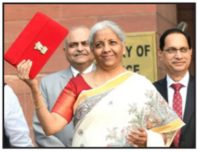
ਨਵੀਂ ਦਿੱਲੀ, 2 ਫਰਵਰੀ - ਕੌਮੀ ਪੱਤ੍ਰਿਕਾ ਬਿਊਰੋ -

ਕਿਸਾਨ ਕਰੈਡਿਟ ਕਾਰਡ ਦੀ ਲਿਮਟ 5 ਲੱਖ ਤੱਕ ਵਧਾਈ, MSME ਲਈ ਕਰਜ਼ਾ ਗਾਰੰਟੀ ਕਵਰ 'ਚ ਵਧਾ, ਬਜਟ ਤੋਂ ਪਹਿਲਾਂ ਲੋਕ ਸਭਾ 'ਚ ਹੰਗਾਮਾ, ਵਿਰੋਧੀ ਧਿਰ ਦੇ ਕੁਝ ਮੈਂਬਰਾਂ ਵੱਲੋਂ ਸਦਨ 'ਚੋਂ ਵਾਕਆਉਟ