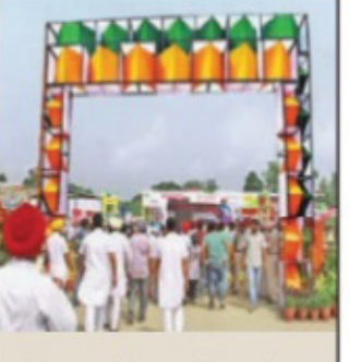
ਕਿਸਾਨ ਮੇਲਿਆਂ ਦੀ ਰੂਪਰੇਖਾ ਪੀਏਯੂ ਲੁਧਿਆਣਾ - 23-24 ਮਾਰਚ। ਗੁਰਦਾਸਪੁਰ - 14 ਮਾਰਚ। ਰੋਹੀ (ਪਟਿਆਲਾ) - 19 ਮਾਰਚ। ਬਠਿੰਡਾ - 27 ਮਾਰਚ।

ਘਟ ਰਿਹਾ ਹੈ। ਖੇਤੀ ਗਿਆਨ ਦੀ ਖੋਜੇੜੀ ਵਰਤੋਂ ਨਾਲ, ਜਿਥੇ ਵਾਤਾਵਰਨ ਪ੍ਰਦੂਸ਼ਿਤ ਹੋ ਰਿਹਾ ਹੈ, ਉਥੇ ਖੇਤੀ ਖਰਚੇ ਵੀ ਵਧ ਰਹੇ ਹਨ। ਪੀਏਯੂ ਵੱਲੋਂ ਲਗਾਏ ਜਾਂਦੇ ਮੇਲੇ 'ਚ ਵਿਗਿਆਨੀ ਵੱਲੋਂ ਪਾਣੀ, ਖਾਦਾਂ ਤੇ ਹੋਰ ਗਿਆਨ ਦੀ ਸਹੀ ਵਰਤੋਂ ਸਬੰਧੀ ਤਕਨੀਕੀ ਨੁਕਤਿਆਂ ਬਾਰੇ ਕਿਸਾਨਾਂ ਨੂੰ ਜਾਣਕਾਰੀ ਦਿੱਤੀ ਜਾਂਦੀ ਹੈ। ਪੇਂਡੂ ਸ਼ਾਮਲੀਆਂ ਨੂੰ ਵੱਖ-ਵੱਖ ਵਿਭਾਗਾਂ ਸਬੰਧੀ ਜਾਣਕਾਰੀ ਦੇਣ ਲਈ ਸਟਾਲ ਲਾਏ ਜਾਂਦੇ ਹਨ, ਜਿਨ੍ਹਾਂ 'ਚ ਕੰਪੋਜ਼ਿਟ ਦੀ ਕਟਾਈ, ਮਿਸ਼ਰਣ-ਕਣਕਾਈ, ਕੰਪੋਜ਼ਿਟ ਦੀ ਰੰਗਾਈ, ਫੈਬਰਿਕ ਪੇਂਟਿੰਗ, ਆਚਾਰ, ਚਟਣੀਆਂ, ਸਰੂਐਸ਼, ਜੈਮ ਬਣਾਉਣਾ, ਪੌਸ਼ਟਿਕ ਭੋਜਨ, ਤੇ ਪੁਰਾਣੀਆਂ ਚੀਜ਼ਾਂ ਤੋਂ ਵਰਤੋਂਯੋਗ ਸਮਾਨ ਬਣਾਉਣ ਤੇ ਇਲਾਵਾ ਪਰਿਵਾਰਿਕ ਸਿਹਤ ਬਾਰੇ ਜਾਣਕਾਰੀ ਦਿੱਤੀ ਜਾਂਦੀ ਹੈ।