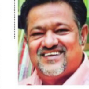
ਪੰਜਾਬ ਦੀ ਨੌਜਵਾਨ ਪੀੜ੍ਹੀ ਸਿਰਫ ਨਸ਼ਿਆਂ ਦਾ ਹੀ ਨਹੀਂ ਗੈਰਸਟਰ ਦੀ ਦਹਿਸ਼ਤ ਦਾ ਸੰਤਾਪ ਵੀ ਹੰਚਾਰਾ ਰਹੀ ਹੈ। ਘਰਾਂ ਦੇ ਬੁਝ ਰਹੇ ਚਿਰਾਗਾਂ ਦੇ ਦਰਦ ਨੂੰ ਬਿਆਨਦੀ ਹੈ ਇਹ ਕਹਾਣੀ...

ਦੋਵਾਂ ਡੈਟਾ ਐਨੀ ਅਤੇ ਮਾਰਗੇਟ ਨੇ 1934 ਵਿਚ ਐਮਸਟਰਡਮ ਦੇ ਸਕੂਲ ਵਿਚ ਦਾਖਲਾ ਲਿਆ। ਐਨੀ ਨੇ ਰੁਝਾਨ ਲਿਆ ਦ ਪ੍ਰਭੂ ਅਤੇ ਲਿਖਣ