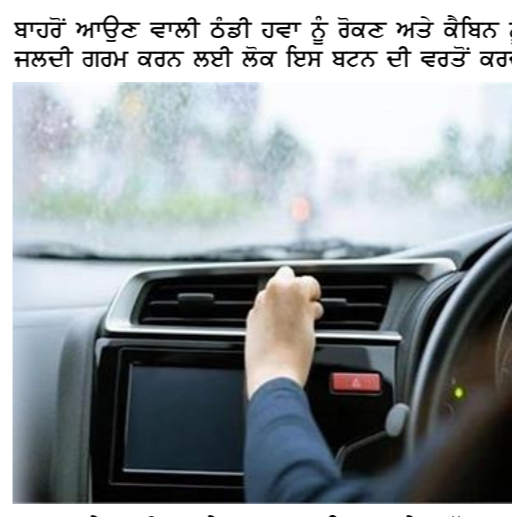
ਹਨ ਪਰ ਜੇਕਰ ਗੈਸਰਕਲੇਸ਼ਨ ਬਟਨ ਜਾਣਿਆ ਦੇਰ ਤੱਕ ਆਨ ਰਹਿੰਦਾ ਹੈ ਤਾਂ ਇਹ ਸਮੱਸਿਆ ਪੈਦਾ ਕਰ ਸਕਦਾ ਹੈ। ਜੇਕਰ ਏਅਰ ਰੀਸਰਕਲੇਸ਼ਨ ਬਟਨ ਨੂੰ ਲੱਭੇ ਸਮੇਂ ਤੱਕ ਚਾਲੂ ਰੱਖਿਆ ਜਾਂਦਾ ਹੈ ਤਾਂ ਬਾਹਰ ਦੀ ਤਾਜ਼ੀ ਹਵਾ ਕਾਰ ਦੇ ਕੈਬਿਨ ਵਿੱਚ

ਗੈਜੇਟ ਡੈਸਕ 3 ਜਨਵਰੀ। ਇਸ ਸਮੇਂ ਦੇਰ 'ਚ ਕੜਾਕੇ ਦੀ ਠੰਡ ਹੈ, ਜਿਸ ਕਾਰਨ ਲੋਕਾਂ ਨੂੰ ਕਈ ਤਰ੍ਹਾਂ ਦੀਆਂ ਪਰੇਸ਼ਾਨੀਆਂ ਦਾ ਸਾਹਮਣਾ ਕਰਨਾ ਪੈ ਰਿਹਾ ਹੈ। ਠੰਡ ਤੋਂ ਬਚਣ ਲਈ ਲੋਕ ਕਈ ਤਰ੍ਹਾਂ ਦੇ ਉਪਾਅ ਕਰ ਰਹੇ ਹਨ ਅਤੇ ਜਿਨ੍ਹਾਂ ਕੋਲ ਕਾਰ ਹੈ ਉਹ ਕਾਰ ਹੀਟਰ ਦੀ ਵਰਤੋਂ ਕਰ ਰਹੇ ਹਨ ਪਰ ਕੀ ਤੁਸੀਂ ਜਾਣਦੇ ਹੋ ਕਿ ਕਾਰ ਵਿੱਚ ਹੀਟਰ ਦੀ ਵਰਤੋਂ ਕਰਨ ਨਾਲ ਤੁਹਾਡੀ ਸਿਹਤ 'ਤੇ ਮਾੜਾ ਅਸਰ ਪੈ ਸਕਦਾ ਹੈ। ਦਰਅਸਲ, ਇੱਕ ਛੋਟੀ ਜਿਹੀ ਗਲਤੀ ਤੁਹਾਡੀ ਕਾਰ ਨੂੰ ਗੈਸ ਚੈਂਬਰ ਵਿੱਚ ਬਦਲ ਸਕਦੀ ਹੈ। ਆਓ ਜਾਣਦੇ ਹਾਂ ਕਿ ਕਾਰ 'ਚ ਹੀਟਰ ਚਲਾਉਂਦੇ ਸਮੇਂ ਕਿਹੜੀਆਂ ਗਲਤੀਆਂ ਵਰਤਣੀਆਂ ਚਾਹੀਦੀਆਂ ਹਨ। ਤੁਹਾਡੀ ਕਾਰ ਦੇ ਪੈਨਲ 'ਤੇ ਇੱਕ ਬਟਨ ਹੈ ਜਿਸ ਨੂੰ "ਏਅਰ ਰੀਸਰਕਲੇਸ਼ਨ ਬਟਨ" ਕਿਹਾ ਜਾਂਦਾ ਹੈ। ਇਸ ਬਟਨ ਨੂੰ ਚਾਲੂ ਕਰਨ ਨਾਲ ਵਾਹਨ ਦੇ ਕੈਬਿਨ ਵਿੱਚ ਹਵਾ ਅੰਦਰ ਘੁੰਮਦੀ ਰਹਿੰਦੀ ਹੈ ਅਤੇ ਬਾਹਰ ਦੀ ਹਵਾ ਅੰਦਰ ਖਿੱਚਣ ਦਾ ਕੰਮ ਘੱਟ ਜਾਂਦਾ ਹੈ। ਇਹ ਆਮ ਤੌਰ 'ਤੇ ਬਾਹਰੋਂ ਠੰਡੀ ਹਵਾ ਦੀ ਬਜਾਏ, ਅੰਦਰੋਂ ਗਰਮ ਹਵਾ ਨਾਲ ਕੈਬਿਨ ਨੂੰ ਗਰਮ ਰੱਖਣ ਲਈ ਜਲਵਾਯੂ ਨਿਯੰਤਰਣ ਪਣਾਲੀ ਨੂੰ ਸੋਧਣ ਲਈ ਵਰਤਿਆ ਜਾਂਦਾ ਹੈ। ਗਲਤੀ ਗਰਮੀਆਂ ਦੇ ਮੌਸਮ 'ਚ ਇਹ ਬਟਨ ਬਹੁਤ ਫਾਇਦੇਮੰਦ ਹੁੰਦਾ ਹੈ ਪਰ ਸਰਦੀਆਂ 'ਚ ਇਸ ਦੀ ਜਾਣਿਆ ਵਰਤੋਂ ਕਰਨਾ ਤੁਹਾਡੀ ਸਿਹਤ ਲਈ ਹਾਨੀਕਾਰਕ ਹੋ ਸਕਦਾ ਹੈ। ਖਾਸ ਕਰਕੇ ਜਦੋਂ ਤੁਸੀਂ ਕਾਰ ਹੀਟਰ ਦੀ ਵਰਤੋਂ ਕਰ ਰਹੇ ਹੋਵੋ।