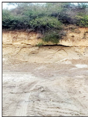
ਗੜ੍ਹਸ਼ੰਕਰ, 4 ਜਨਵਰੀ - ਕੌਮੀ ਪਤ੍ਰਿਕਾ ਬਿਊਰੋ-

ਬੀਤ ਇਲਾਕੇ ਦੇ ਪਿੰਡ ਪੰਡੋਰੀ-ਭਡਿਆਰ ਵਿਚ ਪਿਛਲੇ ਕਰੀਬ ਤਿੰਨ ਹਫ਼ਤਿਆਂ ਤੋਂ ਲਗਾਤਾਰ ਨਾਜਾਇਜ਼ ਮਾਈਨਿੰਗ ਕੀਤੀ ਜਾ ਰਹੀ ਹੈ। ਮੌਕੇ 'ਤੇ ਜਾ ਕੇ ਇਕੱਤਰ ਜਾਣਕਾਰੀ ਮੁਤਾਬਕ ਪੰਡੋਰੀ ਤੋਂ ਬਾਹਰ ਵਾਰ ਪਿੰਡ ਤੋਂ ਲਹਿੰਦੇ ਪਾਸੇ ਮਹਿੰਦਰਾਵਾੜੀ ਨੂੰ ਜਾ ਰਹੀ ਸੜਕ 'ਤੇ ਸਾਈਂ ਬਾਬਾ ਮੰਦਰ ਦੇ ਨੇੜੇ ਮੋਨ ਸੜਕ ਤੋਂ ਕਰੀਬ 150 ਫੁੱਟ ਦੂਰੀ ਤੇ ਲਹਿੰਦੇ ਪਾਸੇ ਸ਼ਾਸ਼ਾਨ ਘਾਟ ਦੇ ਪਿਛਲੇ ਪਾਸੇ (ਜੰਗਲ ਨਾਲ) ਵੱਡੇ-ਵੱਡੇ ਪਹਾੜਾਂ ਨੂੰ ਜੇ. ਸੀ. ਬੀ. ਮਸ਼ੀਨ ਨਾਲ ਪੁੱਟ ਕੇ ਪਹਾੜੀ ਹੋਟੇਂ ਚਿੱਟੀ ਹੋਣ ਕੱਢ ਕੇ ਸਪਲਾਈ ਕੀਤੀ ਜਾਂਦੀ ਹੈ। ਮੌਕੇ 'ਤੇ ਕੱਟੀਆਂ ਹੋਈਆਂ ਪਹਾੜੀਆਂ ਦੂਰ ਤੋਂ ਦਿਖਾਈ ਦਿੰਦੀਆਂ ਹਨ ਅਤੇ