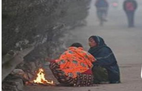
ਘੱਟ ਦਰਜ ਕੀਤੀ ਗਈ। ਪਟਿਆਲਾ ਵਿੱਚ ਵਿਜੀਬਲਿਟੀ 2.50 ਮੀਟਰ ਤੇ ਲੁਧਿਆਣਾ ਵਿੱਚ 500 ਮੀਟਰ ਸੀ। ਵਿਜੀਬਲਿਟੀ ਘੱਟ ਕਾਰਨ ਲੋਕਾਂ ਨੂੰ ਵਾਹਨ ਚਲਾਉਣ ਸਮੇਂ ਪ੍ਰੇਸ਼ਾਨੀ ਦਾ ਸਾਹਮਣਾ ਕਰਨਾ ਪੈ ਰਿਹਾ ਹੈ। ਪਠਾਨਕੋਟ ਸ਼ਹਿਰ ਵਿੱਚ ਵੇਲੇ ਸਭ ਤੋਂ ਠੰਡਾ ਰਿਹਾ ਹੈ, ਜਿੱਥੇ ਵੱਧ ਤੋਂ ਵੱਧ ਤਾਪਮਾਨ 11 ਡਿਗਰੀ ਸੈਲਸੀਅਸ ਅਤੇ ਘੱਟ ਤੋਂ ਘੱਟ ਤਾਪਮਾਨ 6 ਡਿਗਰੀ ਸੈਲਸੀਅਸ ਦਰਜ ਕੀਤਾ ਗਿਆ। ਇਸੇ ਤਰ੍ਹਾਂ ਚੰਡੀਗੜ੍ਹ 'ਚ ਵੱਧ ਤੋਂ ਵੱਧ ਤਾਪਮਾਨ 11.3 ਡਿਗਰੀ ਸੈਲਸੀਅਸ, ਅੰਮ੍ਰਿਤਸਰ 'ਚ 12.6, ਲੁਧਿਆਣਾ 'ਚ 13.8, ਪਟਿਆਲਾ 'ਚ 13, ਗੁਰਦਾਸਪੁਰ 'ਚ 17.5, ਫਰੀਦਕੋਟ 'ਚ 11.6, ਬਠਿੰਡਾ 'ਚ 14.4, ਬਰਨਾਲਾ 'ਚ 12.8, ਡਿਗਰੀ ਸੈਲਸੀਅਸ 'ਚ 12.7, ਵਿਰੋਜਪੁਰ 'ਚ 11.3 ਅਤੇ ਮੋਗਾ 'ਚ 11.2 ਡਿਗਰੀ ਸੈਲਸੀਅਸ ਦਰਜ ਕੀਤਾ ਗਿਆ ਹੈ। ਇਹ ਆਮ ਨਾਲ 4 ਤੋਂ 8 ਡਿਗਰੀ ਸੈਲਸੀਅਸ ਘੱਟ ਹੈ। ਇਸੇ ਤਰ੍ਹਾਂ ਹਰਿਆਣਾ ਦੇ ਅੰਬਾਲਾ ਵਿੱਚ ਵੱਧ ਤੋਂ ਵੱਧ ਤਾਪਮਾਨ 12 ਡਿਗਰੀ ਸੈਲਸੀਅਸ, ਹਿਸਾਰ ਵਿੱਚ 14.5 ਡਿਗਰੀ, ਕਰਨਾਲ ਵਿੱਚ 13.2 ਡਿਗਰੀ, ਰੋਹਤਕ ਵਿੱਚ 12.7 ਡਿਗਰੀ ਅਤੇ ਗੁਰਗਾਮ ਵਿੱਚ 13 ਡਿਗਰੀ ਸੈਲਸੀਅਸ ਦਰਜ ਕੀਤਾ ਗਿਆ। ਮੌਸਮ ਵਿਭਾਗ ਮੁਤਾਬਕ ਆਉਂਦੇ ਦਿਨਾਂ ਵਿੱਚ ਠੰਡ ਹੋਰ ਜ਼ੋਰ ਫੜ ਸਕਦੀ ਹੈ।

ਚੰਡੀਗੜ੍ਹ 3 ਜਨਵਰੀ। ਪੰਜਾਬ ਅਤੇ ਹਰਿਆਣਾ ਸੂਬੇ ਉੱਤਰੀ ਭਾਰਤ ਵਿੱਚ ਸੰਘਣੀ ਝੋਂਦ ਤੋਂ ਸੀਤ ਲਹਿਰ ਦਾ ਕਹਿਰ ਜਾਰੀ ਹੈ। ਅੱਜ ਪੰਜਾਬ ਦੇ ਇੱਕ ਦਰਜਨ ਦੇ ਕਰੀਬ ਸ਼ਹਿਰਾਂ ਵਿੱਚ ਸੰਘਣੀ ਝੋਂਦ ਕਾਰਨ ਵਿਜੀਬਲਿਟੀ ਘੱਟ ਗਈ ਹੈ। ਸੂਬੇ ਵਿੱਚ ਤਾਪਮਾਨ 8.5 ਡਿਗਰੀ ਸੈਲਸੀਅਸ ਤੱਕ ਆ ਗਿਆ ਹੈ। ਮੌਸਮ ਵਿਗਿਆਨੀਆਂ ਨੇ 2 ਜਨਵਰੀ ਨੂੰ ਸੂਬੇ ਵਿੱਚ ਸੰਘਣੀ ਝੋਂਦ ਤੋਂ ਨੰਡਾ ਪੈਣ ਸਬੰਧੀ 'ਯੈਲੋ ਅਲਰਟ' ਜਾਰੀ ਕੀਤਾ ਹੈ। ਮੌਸਮ ਵਿਭਾਗ ਅਨੁਸਾਰ ਅੱਜ ਪੰਜਾਬ ਦੀ ਰਾਜਧਾਨੀ ਚੰਡੀਗੜ੍ਹ, ਅੰਮ੍ਰਿਤਸਰ ਤੇ ਹੋਰ ਕਈ ਸ਼ਹਿਰਾਂ ਵਿੱਚ ਸੰਘਣੀ ਝੋਂਦ ਪੈਣ ਕਾਰਨ ਵਿਜੀਬਲਿਟੀ 50 ਮੀਟਰ ਤੋਂ ਵੀ