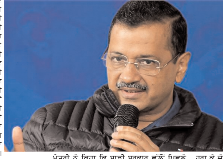
ਮੰਤਰੀ ਨੇ ਕਿਹਾ ਕਿ ਸਾਡੀ ਸਰਕਾਰ ਵੱਲੋਂ ਪਿਛਲੇ 10 ਸਾਲਾਂ ਵਿੱਚ ਕੀਤੇ ਕੰਮਾਂ ਦੀ ਗਿਣਤੀ ਕਰਨ ਵਿੱਚ ਦੋ-ਤਿੰਨ ਘੰਟੇ ਤੋਂ ਵੀ ਘੱਟ ਸਮਾਂ ਲੱਗੇਗਾ।

10 ਸਾਲਾਂ ਵਿੱਚ ਕੀਤੇ ਕੰਮਾਂ ਦੀ ਗਿਣਤੀ ਕਰਨ ਵਿੱਚ ਦੋ-ਤਿੰਨ ਘੰਟੇ ਤੋਂ ਵੀ ਘੱਟ ਸਮਾਂ ਲੱਗੇਗਾ। ਦੂਜੇ ਪਾਸੇ ਭਾਜਪਾ ਸਰਕਾਰ ਨੇ ਅਜਿਹਾ ਕੋਈ ਕੰਮ ਨਹੀਂ ਕੀਤਾ, ਜਿਸ ਦਾ ਜ਼ਿਕਰ ਮੋਦੀ ਜੀ ਆਪਣੇ ਭਾਸ਼ਣ ਵਿੱਚ ਕਰ ਸਕਣ। ਜੇਕਰ ਕੰਮ ਕੀਤਾ ਹੁੰਦਾ ਤਾਂ ਦਿੱਲੀ ਵਾਲਿਆਂ ਨੂੰ ਗਾਲ਼ਾਂ ਕੱਢਣ ਦੀ ਲੋੜ ਨਹੀਂ ਸੀ ਪੈਂਦੀ। ਪਾਰਟੀ ਨੂੰ ਦਿੱਲੀ ਦੇ ਲੋਕਾਂ ਨੂੰ ਗਾਲ਼ਾਂ ਕੱਢ ਕੇ ਚੋਣਾਂ ਜਿੱਤਣ ਦੀ ਕੋਸ਼ਿਸ਼ ਨਹੀਂ ਕਰਨੀ ਪੈਂਦੀ। ਇਸ ਤੋਂ ਪਹਿਲਾਂ ਅਸੀਂ ਵਿਚਾਰ ਵਿੱਚ ਇੱਕ ਸਮਾਗਮ ਵਿੱਚ, ਮੋਦੀ ਨੇ 'ਆਪ' ਨੂੰ ਦਿੱਲੀ ਲਈ 'ਆਵਾਜ਼' ਕਰਾ ਦਿੱਤਾ ਅਤੇ ਕਿਹਾ ਕਿ ਇਸ 'ਆਵਾਜ਼' ਨੂੰ ਪਿਛਲੇ 10 ਸਾਲਾਂ ਤੋਂ ਰਾਸ਼ਟਰੀ ਰਾਜਧਾਨੀ ਨੂੰ ਆਪਣੀ ਲਪੇਟ ਵਿੱਚ ਲਿਆ ਰੱਖਿਆ ਹੈ। ਪ੍ਰਧਾਨ ਮੰਤਰੀ ਨੇ ਇਹ ਵੀ ਭਰੋਸਾ ਜਾਹਰ ਕੀਤਾ ਕਿ ਆਉਣ ਵਾਲੀਆਂ ਦਿੱਲੀ ਵਿਧਾਨ ਸਭਾ ਚੋਣਾਂ ਵਿੱਚ ਭਾਜਪਾ 'ਆਪ' ਨੂੰ