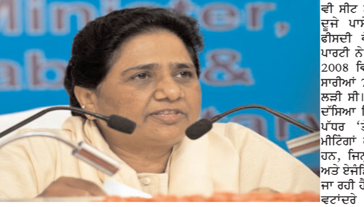
ਬਸਪਾ ਮੁਖੀ ਮਾਇਆਵਤੀ ਕੋਲ ਭੇਜਣਗੇ। ਇਨ੍ਹਾਂ ਸਿਫਾਰਸ਼ਾਂ ਦੇ ਆਧਾਰ 'ਤੇ ਉਮੀਦਵਾਰਾਂ ਦੀ ਚੋਣ ਕੀਤੀ ਜਾਵੇਗੀ।

ਵਿੱਚ ਕੋਆਰਡੀਨੇਟਰ ਨਿਯੁਕਤ ਕੀਤੇ ਗਏ ਹਨ। ਇਹ ਕੋਆਰਡੀਨੇਟਰ ਆਪਣੀਆਂ ਸਿਫਾਰਸ਼ਾਂ ਨੂੰ ਅੰਤਿਮ ਰੂਪ ਦੇ ਕੇ ਬਹਿਨਜੀ ਉਮੀਦਵਾਰਾਂ ਦੀ ਸੂਚੀ 15 ਜਨਵਰੀ ਤੱਕ ਤੈਅ ਹੋਣ ਦੀ ਉਮੀਦ ਹੈ। ਬਸਪਾ ਨੇ 2020 ਦੀਆਂ ਦਿੱਲੀ ਵਿਧਾਨ ਸਭਾ ਚੋਣਾਂ ਵਿੱਚ ਸਾਰੀਆਂ 70 ਸੀਟਾਂ 'ਤੇ ਚੋਣ ਲੜੀ ਸੀ ਪਰ ਇੱਕ ਵੀ ਸੀਟ ਨਹੀਂ ਜਿੱਤ ਸਕੀ ਸੀ। ਦੂਜੇ ਪਾਸੇ ਬਸਪਾ ਨੂੰ 0.71 ਫੀਸਦੀ ਵੋਟਾਂ ਮਿਲੀਆਂ ਸਨ। ਪਾਰਟੀ ਨੇ 2015, 2013 ਅਤੇ 2008 ਵਿੱਚ ਰਾਜਧਾਨੀ ਦੀਆਂ ਸਾਰੀਆਂ 70 ਸੀਟਾਂ 'ਤੇ ਚੋਣ ਲੜੀ ਸੀ। ਬਸਪਾ ਅਧਿਕਾਰੀ ਨੇ ਦੱਸਿਆ ਕਿ ਇਸ ਵੇਲੇ ਜਮੀਨੀ ਪੱਧਰ 'ਤੇ ਛੋਟੀਆਂ-ਛੋਟੀਆਂ ਮੀਟਿੰਗਾਂ ਕੀਤੀਆਂ ਜਾ ਰਹੀਆਂ ਹਨ, ਜਿਨ੍ਹਾਂ 'ਚ ਮੁੱਖ ਮੁੱਦਿਆਂ ਅਤੇ ਏਜੰਡਿਆਂ 'ਤੇ ਚਰਚਾ ਕੀਤੀ ਜਾ ਰਹੀ ਹੈ ਅਤੇ ਇਨ੍ਹਾਂ ਵਿਚਾਰ-ਵਟਾਂਦਰੇ ਦੇ ਆਧਾਰ 'ਤੇ ਉਮੀਦਵਾਰਾਂ ਦੀ ਚੋਣ ਕੀਤੀ ਜਾਵੇਗੀ। ਇਹ ਵੀ ਕਿਹਾ ਕਿ ਚੋਣ ਪ੍ਰਚਾਰ 5 ਜਨਵਰੀ ਤੋਂ ਸ਼ੁਰੂ ਹੋਣ ਦੀ ਸੰਭਾਵਨਾ ਹੈ।