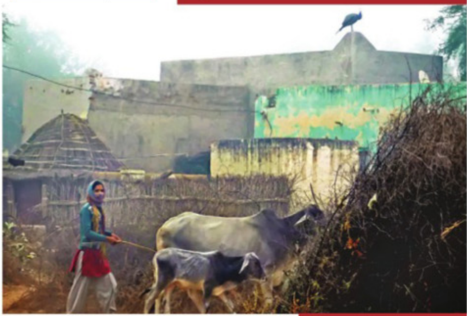
ਤੁਹਾਡੇ ਆਲੇ-ਦੁਆਲੇ ਬਹੁਤ ਕੁਝ ਅਜਿਹਾ ਹੈ, ਜਿਹੜਾ ਤੁਹਾਡੇ ਅੰਦਰ ਦੇ ਕਲਾਕਾਰ ਨੂੰ ਹੜ੍ਹਾ ਦਿੰਦਾ ਹੈ। ਉਸ ਨੂੰ ਕਲਾਤਮਕ ਨਜ਼ਰੀਏ ਤੋਂ ਦੇਖਣ ਅਤੇ ਉਸਨੂੰ ਕੈਮਰੇ ਦੀ ਅੱਖ 'ਚ ਲੱਖਾਉਣ ਦੀ ਕਲਾ ਦਾ ਨਾਂ ਹੀ ਹੈ ਫੋਟੋਗ੍ਰਾਫੀ। ਤੁਸੀਂ ਵੀ ਆਪਣੇ ਸੁਹਜ-ਸਵਾਦ ਦਾ ਨਮੂਨਾ ਕੌਮੀ ਪੱਤ੍ਰਿਕਾ ਦੇ ਪਾਠਕਾਂ ਨਾਲ ਸਾਂਝਾ ਕਰਨ ਲਈ ਆਪਣੀ ਖਿੱਚੀ ਬਿਹਤਰੀਨ ਤਸਵੀਰ ਸਾਨੂੰ ਜਲਦੀ ਆਪਣੇ ਪ੍ਰਭੂ ਸਿਰਨਾਵੇਂ ਸਮਰਪਣ ਕਰੋ।