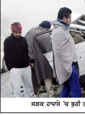
ਸੜਕ ਹਾਦਸੇ 'ਚ ਬੁਰੀ ਤਰ੍ਹਾਂ ਨੁਕਸਾਨੀ ਗਈ ਕਾਰ।

ਪਾਤੜਾਂ, 19 ਜਨਵਰੀ - ਕੌਮੀ ਪਤ੍ਰਿਕਾ ਵਿਖੇ- ਦਿੱਲੀ-ਸੰਗਰੂਰ ਕੌਮੀ ਮਾਰਗ 'ਤੇ ਪਿੰਡ ਦੁਗਲ ਕਲਾਂ ਨੇੜੇ ਦੇਰ ਰਾਤ ਇੱਕ ਵਰਨਾ ਕਾਰ ਡਿਵਾਈਡਰ ਨਾਲ ਟਕਰਾ ਕੇ ਪਲਟ ਗਈ ਜਿਸ ਕਾਰਨ ਇਸ ਵਿੱਚ ਸਵਾਰ 2 ਨੌਜਵਾਨਾਂ ਦੀ ਮੌਤ ਹੋ ਗਈ ਅਤੇ 3 ਹੋਰ ਗੰਭੀਰ ਰੂਪ 'ਚ ਜ਼ਖਮੀ ਹੋਏ ਹਨ। ਸੂਚਨਾ ਮਿਲਣ 'ਤੇ ਸੜਕ ਸੁਰੱਖਿਆ ਫੋਰਸ ਦੇ ਦਸਤੇ ਦੇ ਪਹੁੰਚ ਕੇ ਕਾਰ ਸਵਾਰਾਂ ਦੀ ਮਦਦ ਕੀਤੀ। ਇਸ ਦੌਰਾਨ ਪੁਲੀਸ ਪਾਰਟੀ ਨੇ ਸਥਿਤੀ ਦਾ ਜਾਇਜ਼ਾ ਲੈਣ ਉਪਰੰਤ ਬਣਦੀ ਕਾਰਵਾਈ ਸ਼ੁਰੂ ਕਰ ਦਿੱਤੀ ਹੈ। ਸੜਕ ਸੁਰੱਖਿਆ ਫੋਰਸ ਦੇ ਦਸਤੇ ਨੇ ਦੱਸਿਆ ਹੈ ਕਿ ਰਾਤ ਕਰੀਬ ਡੇਢ ਵਜੇ ਇਹ ਵਿਅਕਤੀ ਦਿਹੜੀ ਤੋਂ ਵਿਆਹ ਦੇਖ ਕੇ ਆ ਰਹੇ ਸਨ। ਜਿਉਂ ਹੀ ਉਨ੍ਹਾਂ ਦੀ ਕਾਰ ਪਿੰਡ ਦੁਗਲ ਕੋਲ ਪਹੁੰਚੀ ਤਾਂ ਬੱਕਾਬੂ ਹੋ ਕੇ ਡਿਵਾਈਡਰ