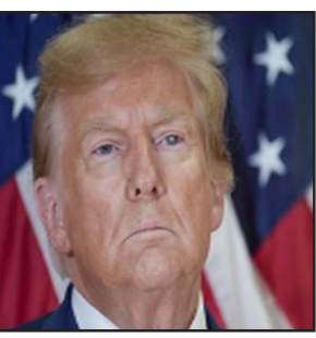
ਸਮਾਗਮ ਵਿੱਚ ਕਿਹਾ ਕਿ ਪ੍ਰਸ਼ਾਸਨ ਵਿੱਚੋਂ ਸ਼ੁਰੂਆਤ ਕਰੇਗਾ। ਉਨ੍ਹਾਂ ਸ਼ਿਕੰਜਾ ਦੇ ਮੇਅਰ ਨੂੰ ਚਿਤਾਵਨੀ ਦਿੱਤੀ ਕਿ ਜੇਕਰ ਉਨ੍ਹਾਂ ਨੇ ਮਦਦ ਨਾ ਕੀਤੀ ਤਾਂ ਜੇਕਰ ਉਨ੍ਹਾਂ ਨੇ ਇਸ ਪ੍ਰਕਿਰਿਆ ਵਿੱਚ