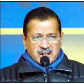
ਵਾਲ ਲੋਕਾਂ ਨੂੰ ਮਿਲਦਾ ਹਾਂ ਜੋ ਕਹਿੰਦੇ ਹਨ ਕਿ ਉਨ੍ਹਾਂ ਨੂੰ ਚੰਗੇ ਸਕੂਲਾਂ ਅਤੇ ਹਸਪਤਾਲਾਂ ਦਾ ਲਾਭ ਮਿਲਦਾ ਹੈ ਪਰ ਮੁਫਤ ਬਿਜਲੀ ਅਤੇ ਪਾਣੀ ਦੀਆਂ ਯੋਜਨਾਵਾਂ ਤੋਂ ਉਹ ਵਾਂਞੇ ਹਨ। ਇਸ ਮੁੱਦੇ ਦੇ ਹੱਲ ਦਾ ਭਰੋਸਾ ਦਿੰਦਿਆਂ ਕੇਜਰੀਵਾਲ ਨੇ ਕਿਹਾ, ਅਸੀਂ ਇਹ ਯਕੀਨੀ ਬਣਾਵਾਂਗੇ ਕਿ ਚੋਣਾਂ ਤੋਂ

ਨਵੀਂ ਦਿੱਲੀ, 19 ਜਨਵਰੀ - ਕੌਮੀ ਪਤ੍ਰਿਕਾ ਵਿਖੇ- ਆਮ ਆਦਮੀ ਪਾਰਟੀ (ਆਪ) ਦੇ ਕੌਮੀ ਕਨਵੀਨਰ ਅਰਵਿੰਦ ਕੇਜਰੀਵਾਲ ਨੇ ਸ਼ਨਿੱਚਰਵਾਰ ਨੂੰ ਆਲਾਨ ਕੀਤਾ ਕਿ ਜੇ ਉਨ੍ਹਾਂ ਦੀ ਪਾਰਟੀ ਦੁਬਾਰਾ ਦਿੱਲੀ ਵਿਚ ਸੱਤਾ 'ਚ ਆਉਂਦੀ ਹੈ ਤਾਂ ਕਿਰਾਏਦਾਰਾਂ ਨੂੰ ਵੀ ਮੁਫਤ ਬਿਜਲੀ ਅਤੇ ਪਾਣੀ ਦਾ ਲਾਭ ਦੇਣ ਲਈ ਫੈਸਲਾ ਕਰਨ ਕਦਮ ਚੁੱਕੇਗੀ। ਉਨ੍ਹਾਂ ਇਹ ਗੱਲ ਇਥੇ ਇਕ ਪ੍ਰੈਸ ਕਾਨਫਰੰਸ ਨੂੰ ਸੰਬੰਧਤ ਕਰਦਿਆਂ ਕਹੀ। ਉਨ੍ਹਾਂ ਇਸ ਮੌਕੇ ਦਿੱਲੀ ਭਰ ਵਿੱਚ ਕਿਰਾਏਦਾਰਾਂ ਵੱਲੋਂ ਉਠਾਈਆਂ ਗਈਆਂ ਚਿੰਤਾਵਾਂ ਨੂੰ ਉਜਾਗਰ ਕੀਤਾ। ਉਨ੍ਹਾਂ ਕਿਹਾ, 'ਮੈਂ ਜਿੱਥੇ ਵੀ ਜਾਵਾਂ ਹਾਂ, ਮੈਂ ਕਿਰਾਏ 'ਤੇ ਰਹਿਣ