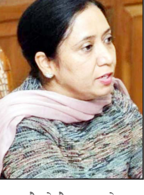
199, ਐਸ.ਏ.ਐਸ. ਨਗਰ ਦੇ 218, ਐਸ.ਬੀ.ਐਸ. ਨਗਰ ਦੇ 166, ਸੰਗਰੂਰ ਦੇ 408 ਅਤੇ ਮਲੋਰਕੋਟਲਾ ਦੇ 70 ਲਾਭਪਾਤਰੀਆਂ ਨੂੰ ਵੀ ਵਿੱਤੀ ਲਾਭ ਦਿੱਤਾ ਗਿਆ ਹੈ। ਡਾ. ਬਲਜੀਤ ਕੌਰ

ਅਸ਼ੀਰਵਾਦ ਸਕੀਮ ਤਹਿਤ 16 ਜ਼ਿਲ੍ਹਿਆਂ ਦੇ 5951 ਲਾਭਪਾਤਰੀਆਂ ਨੂੰ ਮਿਲੇਗਾ ਲਾਭ > ਪੰਜਾਬ ਸਰਕਾਰ ਅਨੁਸੂਚਿਤ ਜਾਤੀਆਂ ਦੀ ਭਲਾਈ ਲਈ ਵਚਨਬੱਧ ਚੰਡੀਗੜ੍ਹ, 19 ਜਨਵਰੀ - ਕੌਮੀ ਪਤ੍ਰਿਕਾ ਵਿਖੇ- ਪੰਜਾਬ ਸਰਕਾਰ ਵੱਲੋਂ ਅਸ਼ੀਰਵਾਦ ਸਕੀਮ ਤਹਿਤ ਚਾਲੂ ਵਿੱਤੀ ਸਾਲ 2024-25 ਦੌਰਾਨ ਅਨੁਸੂਚਿਤ ਜਾਤੀਆਂ ਦੇ 5951 ਲਾਭਪਾਤਰੀਆਂ ਨੂੰ 30.35 ਕਰੋੜ ਰੁਪਏ ਦੀ ਰਾਸ਼ੀ ਜਾਰੀ ਕੀਤੀ ਹੈ। ਇਸ ਸਬੰਧੀ ਹੋਰ ਜਾਣਕਾਰੀ ਦਿੰਦਿਆਂ ਸਮਾਜਿਕ ਨਿਆਂ, ਅਧਿਕਾਰਤਾ ਅਤੇ ਘੱਟ ਗਿਣਤੀ ਮੰਤਰੀ ਡਾ. ਬਲਜੀਤ ਕੌਰ ਨੇ ਦੱਸਿਆ ਕਿ ਅਸ਼ੀਰਵਾਦ ਵਾਰ ਅਨੁਸੂਚਿਤ ਜਾਤੀਆਂ ਸਕੀਮ ਅਧੀਨ ਜਿਲਾ ਬਰਨਾਲਾ, ਬਠਿੰਡਾ, ਫਰੀਦਕੋਟ, ਵਿਰੋਜਪੁਰ, ਸ੍ਰੀ ਫਤਹਿਗੜ੍ਹ ਸਾਹਿਬ, ਫਾਜ਼ਿਲਕਾ, ਹੁਸ਼ਿਆਰਪੁਰ, ਜਲੰਧਰ, ਮਾਨਸਾ, ਸ੍ਰੀ ਮੁਕਤਸਰ ਸਾਹਿਬ, ਪਟਿਆਲਾ, ਰੂਪਨਗਰ, ਐਸ.ਏ.ਐਸ.ਨਗਰ, ਐਸ.ਬੀ.ਐਸ.ਨਗਰ, ਸੰਗਰੂਰ ਅਤੇ