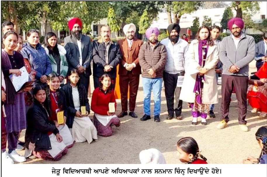
ਜੇਤੂ ਵਿਦਿਆਰਥੀਆਂ ਅਪਣੇ ਅਧਿਆਪਕਾਂ ਨਾਲ ਸਨਮਾਨ ਚਿੰਨ੍ਹ ਦਿਖਾਉਂਦੇ ਹੋਏ।