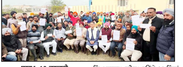
ਸੁਨਾਮ, 19 ਜਨਵਰੀ - ਕੌਮੀ ਪਤ੍ਰਿਕਾ ਵਿਖੇ- ਪੰਜਾਬ ਦੇ ਨਵੀਂ ਤੇ ਨਵਿਆਉਣਯੋਗ ਉਰਜਾ ਸਰੋਤ, ਛਾਪੇ ਦੀ ਤੇ ਲਿਖਣ ਸਮੱਗਰੀ, ਪ੍ਰਸ਼ਾਸਕੀ ਸੁਧਾਰ ਤੇ ਸਿਕਾਇਤ ਨਿਵਾਰਣ ਅਤੇ ਰੋਜ਼ਗਾਰ ਉਤਪਤੀ ਤੇ ਸਿਖਲਾਈ ਮੰਤਰੀ ਸ਼੍ਰੀ ਅਮਨ ਅਰੋੜਾ ਨੇ ਸੁਨਾਮ ਸ਼ਹਿਰ ਵਿਖੇ ਸਥਿਤ ਆਪਣੇ ਦਫ਼ਤਰ ਵਿਖੇ ਵਿਧਾਨ ਸਭਾ ਹਲਕਾ ਸੁਨਾਮ ਉਪ