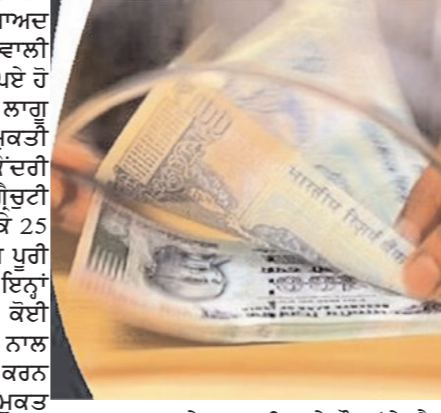
ਕਾਰਨ ਸੇਵਾਮੁਕਤੀ ਅਤੇ ਮੌਤ 'ਤੇ ਗ੍ਰੈਜੂਟੀ ਦੀ ਵੱਧ ਤੋਂ ਵੱਧ ਸੀਮਾ 25 ਫੀਸਦੀ ਵਧਾ ਦਿੱਤੀ ਗਈ ਹੈ। ਗ੍ਰੈਜੂਟੀ ਨੂੰ ਇੱਕ ਕਿਸਮ ਦਾ ਮਾਣ ਭੱਤਾ ਮੰਨਿਆ ਜਾਂਦਾ ਹੈ, ਜੋ ਕਿਸੇ ਕਰਮਚਾਰੀ ਨੂੰ ਸੇਵਾਮੁਕਤੀ ਜਾਂ ਉਸ ਦੀਆਂ ਸੇਵਾਵਾਂ ਦੇ