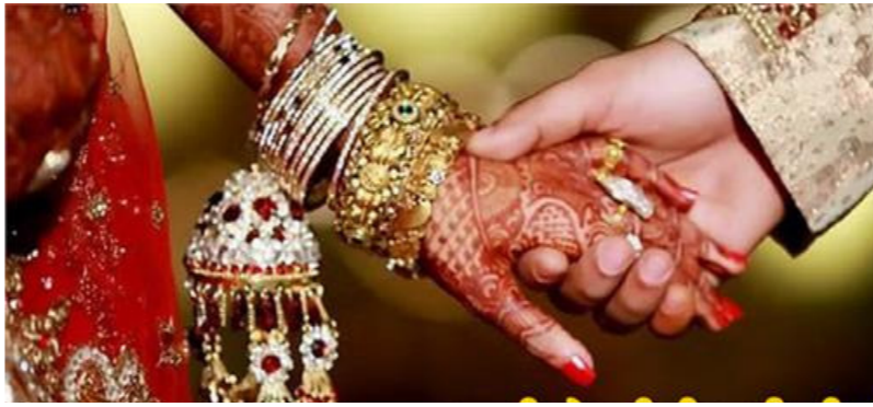
ਸਿਹਤ ਨੀਕ ਨਹੀਂ ਸੀ। ਗੱਲਬਾਤ ਤੋਂ ਬਾਅਦ, ਦੋਵੇਂ ਇਸ ਗੱਲ 'ਤੇ ਸਹਿਮਤ ਹੋਏ ਕਿ ਪਤੀ ਆਪਣੀ ਪਤਨੀ ਦੀ ਸਿਹਤ 'ਚ ਸੁਧਾਰ ਹੁੰਦੇ ਹੀ ਉਸਨੂੰ ਪੀਜਾ ਖੁਆਏਗਾ। ਦੋਵੇਂ ਪਤੀ-ਪਤਨੀ ਖੁਸ਼ੀ-ਖੁਸ਼ੀ ਆਪਣੇ ਘਰ ਵਾਪਸ ਆ ਗਏ। ਇਸ ਦੇ ਨਾਲ ਹੀ, ਕਾਉਂਸਲਿੰਗ ਦੌਰਾਨ ਕੁੱਲ 15

ਵਿਵਾਦਾਂ ਦਾ ਨਿਪਟਾਰਾ ਕੀਤਾ ਗਿਆ। ਕੌਂਸਲਰ ਨੇ ਕਿਹਾ ਕਿ ਅੰਜ ਦੇ ਸਮੇਂ 'ਚ ਛੋਟੀਆਂ-ਛੋਟੀਆਂ ਗੱਲਾਂ 'ਤੇ ਰਿਸਤਿਆਂ 'ਚ