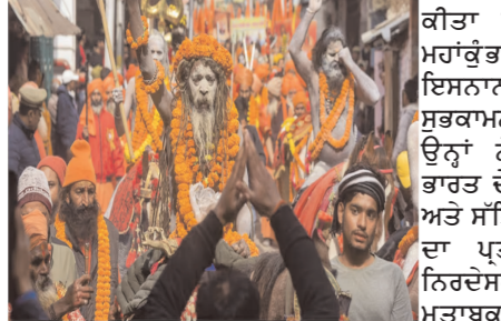
ਮਹਾਂਕੁੰਭ ਮੇਲਾ ਸੋਮਵਾਰ ਨੂੰ ਪੰਜ ਪੂਰਨਿਮਾ ਇਨਸਾਨ ਨਾਲ ਸ਼ੁਰੂ ਹੋਇਆ।