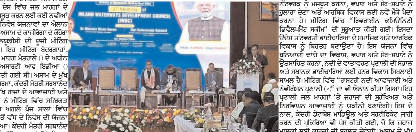
ਰਾਸ਼ਟਰੀ ਜਲ ਮਾਰਗ ਵਿਕਾਸ ਪ੍ਰੀਸਦ (I) ਨੇ ਦੇਸ਼ ਵਿੱਚ ਜਲ ਮਾਰਗਾਂ ਦੇ ਬੁਨਿਆਦੀ ਢਾਂਚੇ ਨੂੰ ਮਜ਼ਬੂਤ ਕਰਨ ਲਈ ਕਈ ਨਵੀਆਂ ਪਹਿਲਕਦਮੀਆਂ ਅਤੇ ਨਿਵੇਸ਼ ਯੋਜਨਾਵਾਂ ਦਾ ਐਲਾਨ ਕੀਤਾ ਹੈ।