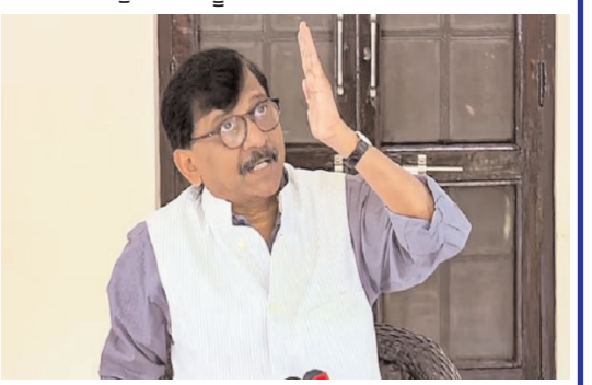
ਸੰਜੇ ਰਾਊਤ ਨੇ ਪ੍ਰਧਾਨ ਮੰਤਰੀ ਨਰਿੰਦਰ ਮੋਦੀ 'ਤੇ ਟਿੱਪਣੀ ਕਰਦੇ ਹੋਏ ਕਿਹਾ ਕਿ ਉਹ (ਮੋਦੀ) ਭਗਵਾਨ ਹਨ।

ਨਾਗਪੁਰ 13 ਜਨਵਰੀ। ਸ਼ਿਵ ਸੈਨਾ (ਉਥਾਨਾ) ਦੇ ਨੇਤਾ ਸੰਜੇ ਰਾਊਤ ਨੇ ਪ੍ਰਧਾਨ ਮੰਤਰੀ ਨਰਿੰਦਰ ਮੋਦੀ 'ਤੇ ਟਿੱਪਣੀ ਕਰਦੇ ਹੋਏ ਕਿਹਾ ਕਿ ਉਹ (ਮੋਦੀ) ਭਗਵਾਨ ਹਨ। ਮੈਂ ਉਨ੍ਹਾਂ ਨੂੰ ਇਨਸਾਨ ਨਹੀਂ ਮੰਨਦਾ। ਭਗਵਾਨ ਤਾਂ ਭਗਵਾਨ ਹਨ। ਜੇਕਰ ਕੋਈ ਖੁਦ ਨੂੰ ਅਵਤਾਰ ਐਲਾਨ ਕਰਦਾ ਹੈ ਤਾਂ ਉਹ ਇਨਸਾਨ ਕਿਵੇਂ ਹੋ ਸਕਦਾ ਹੈ? ਉਹ ਵਿਸ਼ਵ ਦੇ 13ਵੇਂ ਅਵਤਾਰ ਹਨ। ਭਗਵਾਨ