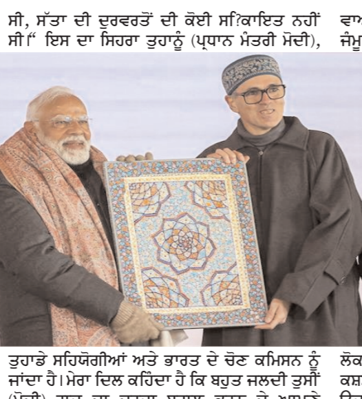
ਮੁੱਖ ਮੰਤਰੀ ਅਬਦੁੱਲਾ ਨੇ ਜੰਮੂ-ਕਸ਼ਮੀਰ 'ਚ ਨਿਰਪੱਖ ਚੋਣਾਂ ਦਾ ਸਿਹਰਾ ਮੋਦੀ ਸਰਕਾਰ, ਚੋਣ ਕਮਿਸ਼ਨ ਨੂੰ ਦਿੱਤਾ।

ਨਵੀਂ ਦਿੱਲੀ 13 ਜਨਵਰੀ। ਜੰਮੂ-ਕਸ਼ਮੀਰ ਦੇ ਮੁੱਖ ਮੰਤਰੀ ਉਮਰ ਅਬਦੁੱਲਾ ਨੇ ਸੋਮਵਾਰ ਨੂੰ ਕਿਹਾ ਕਿ ਉਨ੍ਹਾਂ ਦੇ ਕੇਂਦਰ ਸਾਸ਼ਿਤ ਪ੍ਰਦੇਸ਼ 'ਚ ਪਿਛਲੀਆਂ ਵਿਧਾਨ ਸਭਾ ਚੋਣਾਂ 'ਚ ਕਿਸੇ ਬੇਇਨਸਾਫੀਆਂ ਜਾਂ ਅਧਿਕਾਰਾਂ ਦੀ ਗਲਤ ਵਰਤੋਂ ਦੀ ਕੋਈ ਸੰਕੇਤਿਕ ਨਹੀਂ ਆਈ ਅਤੇ ਇਸ ਦਾ ਸਿਹਰਾ ਪ੍ਰਧਾਨ ਮੰਤਰੀ ਨਰਿੰਦਰ ਮੋਦੀ, ਉਨ੍ਹਾਂ ਦੇ ਸਹਿਯੋਗੀਆਂ ਅਤੇ ਚੋਣ ਕਮਿਸ਼ਨ ਨੂੰ ਜਾਂਦਾ ਹੈ। ਸ਼੍ਰੀ ਅਬਦੁੱਲਾ ਨੇ ਉਮੀਦ ਪ੍ਰਗਟਾਈ ਕਿ ਸ਼੍ਰੀ ਮੋਦੀ ਜਲਦੀ ਹੀ ਜੰਮੂ-ਕਸ਼ਮੀਰ ਨੂੰ ਪੂਰਨ ਰਾਜ ਦਾ ਦਰਜਾ ਦੇਣ ਦੇ ਆਪਣੇ ਵਾਅਦੇ ਨੂੰ ਪੂਰਾ ਕਰਨਗੇ। ਇੱਥੇ ਸੋਮਵਾਰ ਸੁਰੰਗ ਦੇ ਉਦਘਾਟਨ ਸਮਾਰੋਹ ਤੋਂ ਬਾਅਦ ਆਯੋਜਿਤ ਇਕ ਜਨਤਕ ਮੀਟਿੰਗ ਨੂੰ ਸੰਬੰਧ ਕਰਦਿਆਂ ਉਨ੍ਹਾਂ ਕਿਹਾ, "ਜੰਮੂ-ਕਸ਼ਮੀਰ 'ਚ ਚੋਣਾਂ ਹੋਈਆਂ ਸਨ ਅਤੇ ਇਸ 'ਚ ਸਭ ਤੋਂ ਵੱਡੀ ਗੱਲ ਇਹ ਸੀ ਕਿ ਚੋਣਾਂ 'ਚ ਬੇਇਨਸਾਫੀਆਂ ਦੀ ਕੋਈ ਸੰਕੇਤਿਕ ਨਹੀਂ