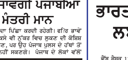
ਮੁੱਖ ਮੰਤਰੀ ਮਾਨ ਸਰਕਾਰ ਦੀ ਇਸ ਪਹਿਲਕਦਮੀ ਨੂੰ ਰੱਜ ਕੇ ਸਲਾਹਿਆ ਜਾ ਰਿਹਾ ਹੈ।

ਜਲੰਧਰ 13 ਜਨਵਰੀ। ਆਮ ਆਦਮੀ ਪਾਰਟੀ ਦੀ ਅਗਵਾਈ ਵਾਲੀ ਪੰਜਾਬ ਸਰਕਾਰ ਵੱਲੋਂ ਪਹਿਲੇ ਦਿਨ ਤੋਂ ਹੀ ਸੁੱਚੇ ਦੇ ਲੋਕਾਂ ਨੂੰ ਸੁਰੱਖਿਅਤ ਮਾਰਗ ਦੇਣ ਲਈ ਉਦੇਸ਼ ਕੀਤੇ ਜਾ ਰਹੇ ਹਨ। ਇਸ ਤਹਿਤ ਵੱਡਾ ਫੈਸਲਾ ਲੈਂਦਿਆਂ ਮਾਨ ਸਰਕਾਰ ਨੇ ਸੁੱਚੇ 'ਚ ਵੱਖ-ਵੱਖ ਥਾਵਾਂ 'ਤੇ ਸੀ. ਸੀ. ਟੀ. ਵੀ. ਕੈਮਰੇ ਲਾਉਣ ਦੀ ਪਹਿਲਕਦਮੀ ਕੀਤੀ ਹੈ। ਸਰਕਾਰ ਵੱਲੋਂ ਇਸ ਕੰਮ ਦੇ ਲਈ 19 ਕਰੋੜ ਰੁਪਏ ਤੋਂ ਵੱਧ ਦੀ ਰਕਮ ਨੂੰ ਮਨਜ਼ੂਰ ਕਰ ਲਈ ਗਈ ਹੈ। ਹੁਣ ਤਕ ਇਸ ਯੋਜਨਾ ਤਹਿਤ ਸਰਹੱਦੀ ਖੇਤਰ ਦੀਆਂ 585 ਥਾਵਾਂ 'ਤੇ 2127 ਕੈਮਰੇ ਲਾਏ ਜਾ ਚੁੱਕੇ ਹਨ। ਇਨ੍ਹਾਂ ਕੈਮਰਿਆਂ ਰਾਹੀਂ ਨਾ ਸਿਰਫ ਕਿਸੇ ਵੱਡੀ ਵਾਰਦਾਦ ਨੂੰ ਟਰੱਕ ਕੀਤਾ ਜਾ ਸਕਦਾ ਹੈ, ਸਗੋਂ ਪੰਜਾਬ ਪੁਲਸ ਦੀ ਬਾਜ ਅੱਖ ਹਰ ਵੇਲੇ ਵੱਖ-ਵੱਖ ਇਲਾਕਿਆਂ ਵਿੱਚ ਰਹੇਗੀ, ਜਿਸ ਨਾਲ ਕੋਈ ਸ਼ੱਕੀ ਗਤੀਵਿਧੀ ਦਿਖਣ 'ਤੇ ਵਿਸ਼ੇਸ਼ ਧਿਆਨ ਦਿੱਤਾ ਜਾ ਰਿਹਾ ਹੈ ਕਿਉਂਕਿ ਸਰਹੱਦੀ ਇਲਾਕਿਆਂ 'ਚੋਂ ਹੀ ਪੰਜਾਬ 'ਚ ਨਸ਼ੇ ਅਤੇ ਹਥਿਆਰਾਂ ਦੀ ਸਪਲਾਈ ਲਈ ਗੁਆਂਢੀ ਮੁਲਕ ਵੱਲੋਂ ਹਮੇਸ਼ਾ ਕੋਸ਼ਿਸ਼ ਕੀਤੀ ਜਾਂਦੀ ਰਹੀ ਹੈ। ਹੁਣ ਇਨ੍ਹਾਂ ਸਰਗਰਮੀਆਂ ਨੂੰ ਠੱਲ੍ਹ ਪਾਉਣ ਲਈ ਹੀ ਇਹ ਵਿਸ਼ੇਸ਼ ਕਦਮ ਚੁੱਕਿਆ ਗਿਆ ਹੈ।