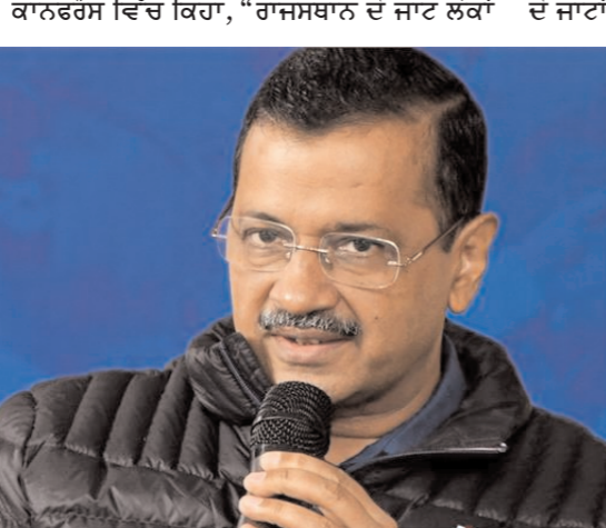
ਨਵੀਂ ਦਿੱਲੀ 13 ਜਨਵਰੀ। ਕੇਜਰੀਵਾਲ ਨੇ ਆਪਣੀ ਰਿਹਾਇਸ਼ 'ਤੇ ਜਾਣ ਨਾ ਤਾਂ ਦੋ ਇੱਕ ਵਫਦ ਨਾਲ ਮੁਲਾਕਾਤ ਕੀਤੀ।

ਨਵੀਂ ਦਿੱਲੀ 13 ਜਨਵਰੀ। ਆਮ ਆਦਮੀ ਪਾਰਟੀ (ਆਪ) ਦੇ ਮੁਖੀ ਅਰਵਿੰਦ ਕੇਜਰੀਵਾਲ ਨੇ ਸੋਮਵਾਰ ਨੂੰ ਭਾਰਤੀ ਜਨਤਾ ਪਾਰਟੀ (ਭਾਜਪਾ) 'ਤੇ ਰਾਖਵੇਂਕਰਨ ਦੇ ਮੁੱਦੇ 'ਤੇ ਦਿੱਲੀ ਦੇ ਜਾਟਾਂ ਨਾਲ 'ਧੋਖਾ' ਕਰਨ ਦਾ ਦੋਸ਼ ਲਗਾਇਆ ਅਤੇ ਪਾਰਟੀ ਨੂੰ ਸਵਾਲ ਕੀਤਾ ਕਿ ਉਨ੍ਹਾਂ ਨੂੰ ਹੋਰ ਪਿਛੜੇ ਵਰਗਾਂ (ਓਬੀਸੀ) ਲਈ ਕੇਂਦਰ ਦੀ ਸੂਚੀ ਵਿੱਚ ਕਦੇ ਸਮਾਨ ਕਰਨਗੇ। 5 ਫਰਵਰੀ ਨੂੰ ਹੋਣ ਵਾਲੀਆਂ ਦਿੱਲੀ ਵਿਧਾਨ ਸਭਾ ਚੋਣਾਂ ਤੋਂ ਪਹਿਲਾਂ ਕੇਜਰੀਵਾਲ ਨੇ ਆਪਣੀ ਰਿਹਾਇਸ਼ 'ਤੇ ਜਾਣ ਨਾ ਤਾਂ ਦੋ ਇੱਕ ਵਫਦ ਨਾਲ ਮੁਲਾਕਾਤ ਕੀਤੀ। ਰਾਸ਼ਟਰੀ ਰਾਜਧਾਨੀ ਦੇ ਕੁਝ ਵਿਧਾਨ ਸਭਾ ਹਲਕਿਆਂ, ਖਾਸ ਕਰਕੇ ਬਾਗਰੀ ਦਿੱਲੀ ਦੇ ਇਲਾਕਿਆਂ ਵਿੱਚ ਇਸ ਭਾਈਚਾਰੇ ਦੇ ਵੋਟਾਂ ਦੀ ਕਾਫੀ ਗਿਣਤੀ ਹੈ। ਕੇਜਰੀਵਾਲ ਨੇ ਕਿਹਾ ਕਿ ਰਾਸ਼ਟਰੀ ਰਾਜਧਾਨੀ ਦੇ ਜਾਟਾਂ ਦੀ ਓਬੀਸੀ ਸੂਚੀ ਵਿੱਚ ਸਮਾਨ ਹਨ ਪਰ ਕੇਂਦਰ ਦੀ ਸੂਚੀ ਵਿੱਚ ਨਹੀਂ। ਸਾਬਕਾ ਮੁੱਖ ਮੰਤਰੀ ਨੇ ਇੱਕ ਪ੍ਰੈਸ ਕਾਨਫਰੰਸ ਵਿੱਚ ਕਿਹਾ, "ਰਾਜਧਾਨੀ ਦੇ ਜਾਟ ਲੋਕਾਂ ਦੇ ਜਾਟਾਂ ਨੂੰ ਨਹੀਂ। ਉਨ੍ਹਾਂ ਕਿਹਾ ਕਿ ਦੇਸ਼ ਦੇ ਦੋ ਵੱਡੇ ਆਗੂਆਂ ਪ੍ਰਧਾਨ ਮੰਤਰੀ ਨਰਿੰਦਰ ਮੋਦੀ ਅਤੇ ਕੇਂਦਰੀ ਗ੍ਰਹਿ ਮੰਤਰੀ ਅਮਿਤ ਸਾਹ ਨੇ ਦਿੱਲੀ ਦੇ ਜਾਟ ਭਾਈਚਾਰੇ ਨਾਲ ਵਾਅਦਾ ਕੀਤਾ ਸੀ ਕਿ ਉਨ੍ਹਾਂ ਨੂੰ ਕੇਂਦਰੀ ਪੱਧਰ 'ਤੇ ਓਬੀਸੀ ਰਾਖਵੇਂਕਰਨ ਦਿੱਤਾ ਜਾਵੇਗਾ ਪਰ ਇਹ ਵਾਅਦਾ ਅਜੇ ਤੱਕ ਪੂਰਾ ਨਹੀਂ ਹੋਇਆ ਹੈ। ਕੇਜਰੀਵਾਲ ਨੇ ਪੁੱਛਿਆ, "ਮੈਂ ਮੋਦੀ, ਸਾਹ ਅਤੇ ਹੋਰ ਭਾਜਪਾ ਨੇਤਾਵਾਂ ਤੋਂ ਪੁੱਛਣਾ ਚਾਹੁੰਦਾ ਹਾਂ ਕਿ ਉਹ ਦਿੱਲੀ ਦੇ ਜਾਟਾਂ ਨੂੰ ਕੇਂਦਰ ਦੀ ਓਬੀਸੀ ਸੂਚੀ ਵਿੱਚ ਕਦੇ ਸਮਾਨ ਕਰਨਗੇ?" "ਆਪ" ਦੇ ਰਾਸ਼ਟਰੀ ਕਨਵੀਨਰ ਨੇ "ਤੇ ਇੱਕ ਪੋਸਟ ਵਿੱਚ ਕਿਹਾ ਕਿ ਉਨ੍ਹਾਂ ਨੂੰ ਮਿਲਣ ਵਾਲੇ ਜਾਟ ਆਗੂਆਂ ਦੇ ਵਫਦ ਨੇ ਪਿਛਲੇ 10 ਸਾਲਾਂ ਤੋਂ ਰਾਖਵੇਂਕਰਨ ਦੇ ਮੁੱਦੇ 'ਤੇ ਭਾਜਪਾ ਵੱਲੋਂ ਉਨ੍ਹਾਂ ਨਾਲ ਕੀਤੇ ਜਾ ਰਹੇ ਧੋਖੇ ਅਤੇ ਬੇਇਨਸਾਫੀ 'ਤੇ ਗੁੱਸਾ ਜ਼ਾਹਰ ਕੀਤਾ। ਕੇਜਰੀਵਾਲ ਨੇ ਕਿਹਾ ਕਿ 'ਆਪ' ਭਾਈਚਾਰੇ ਦੀ ਜਾਇਜ਼ ਮੰਗ ਦਾ ਸਮਰਥਨ ਕਰਦੀ ਹੈ।