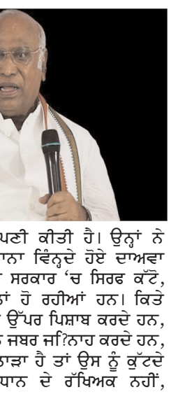
ਬਾਅਦ ਇਹ ਟਿੱਪਣੀ ਕੀਤੀ ਹੈ। ਉਨ੍ਹਾਂ ਨੇ ਭਾਜਪਾ 'ਤੇ ਨਿਸ਼ਾਨਾ ਵਿੰਨ੍ਹਦੇ ਹੋਏ ਦਾਅਵਾ ਕੀਤਾ, "ਇਨ੍ਹਾਂ ਦੀ ਸਰਕਾਰ 'ਚ ਸਿਰਫ ਕੱਟੇ, ਵੱਡੇ ਦੀਆਂ ਗੱਲਾਂ ਹੋ ਰਹੀਆਂ ਹਨ। ਕਿਤੇ ਆਦਿਵਾਸੀਆਂ ਦੇ ਉੱਪਰ ਪਿਸ਼ਾਬ ਕਰਦੇ ਹਨ, ਕਿਤੇ ਔਰਤਾਂ ਨਾਲ ਸਬਰ ਜਿੰਨਾ ਕਰਦੇ ਹਨ, ਕਿਤੇ ਘੱਟੀ 'ਤੇ ਲਾਜ਼ਾ ਹੈ ਤਾਂ ਉਸ ਨੂੰ ਕੁੱਟਦੇ ਹਨ। ਇਹ 'ਤੇ ਲਾਜ਼ਾ ਹੈ ਤਾਂ ਉਸ ਨੂੰ ਕੁੱਟਦੇ ਹਨ। ਸਾਰੀਆਂ ਪਾਰਟੀਆਂ ਦੇ ਰੱਖਿਅਕ ਨਹੀਂ, ਭਕਸ਼ਕ ਹਨ।"

ਚਾਹੀਦੀ ਅਤੇ ਇਸ ਮੰਗ ਨੂੰ ਲੈ ਕੇ 'ਭਾਰਤ ਜੋੜੋ ਯਾਤਰਾ' ਦੀ ਤਰ੍ਹਾਂ ਇਕ ਮੁਹਿੰਮ ਸ਼ੁਰੂ ਕਰਨੀ ਹੋਵੇਗੀ। ਉਨ੍ਹਾਂ ਨੇ ਕਾਂਗਰਸ ਦੇ ਵੱਖ-ਵੱਖ ਸੈੱਲਾਂ ਵੱਲੋਂ ਆਯੋਜਿਤ 'ਸੰਵਿਧਾਨ ਰੱਖਿਅਕ ਮੁਹਿੰਮ' ਪ੍ਰੋਗਰਾਮ 'ਚ ਇਹ ਦਾਅਵਾ ਵੀ ਕੀਤਾ ਕਿ ਪ੍ਰਧਾਨ ਮੰਤਰੀ ਨਰਿੰਦਰ ਮੋਦੀ ਜਾਤੀ ਜਨਗਣਨਾ ਕਰਵਾਉਣ ਤੋਂ ਡਰਦੇ ਹਨ। ਕਾਂਗਰਸ ਪ੍ਰਧਾਨ ਨੇ ਕਿਹਾ, "ਐੱਸ.ਸੀ., ਐੱਸ.ਟੀ., ਓ.ਬੀ.ਸੀ., ਗਰੀਬ ਤਬਕ ਦੇ ਲੋਕ ਆਪਣੀ ਪੂਰੀ ਸ਼ਕਤੀ ਲਗਾ ਕੇ ਵੋਟ ਦੇ ਰਹੇ ਹਨ, ਉਨ੍ਹਾਂ ਦਾ ਵੋਟ ਵਿਜੂਲ ਜਾ ਰਿਹਾ ਹੈ... ਸਾਨੂੰ ਬੈਲਟ ਪੇਪਰ ਰਾਹੀਂ ਵੋਟ ਚਾਹੀਦਾ।" ਉਨ੍ਹਾਂ ਨੇ ਤੰਜ ਕੱਸਦੇ ਹੋਏ ਕਿਹਾ, "ਮੋਦੀ ਜੀ ਦੇ ਘਰ ਜਾਂ ਅਮਿਤ ਸ਼ਾਹ ਦੇ ਘਰ ਮਸ਼ੀਨ ਰੱਖਣ ਦਿਓ, ਅਹਿਮਦਾਬਾਦ ਦੇ ਕਿਸੇ ਗੱਦਮ 'ਚ ਰੱਖਣ ਦਿਓ ਪਰ ਸਾਨੂੰ ਬੈਲਟ ਪੇਪਰ ਚਾਹੀਦਾ।" ਖੜਗੋ ਨੇ ਕਿਹਾ, "ਪਾਰਟੀ ਵੱਲੋਂ ਇਕ ਮੁਹਿੰਮ ਸ਼ੁਰੂ ਕਰਨੀ ਚਾਹੀਦੀ ਹੈ। ਸਾਰੀਆਂ ਪਾਰਟੀਆਂ ਨੂੰ, ਭਕਸ਼ਕ ਹਨ।"