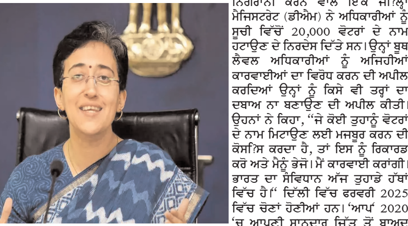
ਕੇਂਦਰ ਸਰਕਾਰ ਦੀ ਸੀਨੀਅਰ 'ਆਪ' ਆਗੂ ਨੇ ਦਿੱਲੀ ਦੇ ਉਪ ਰਾਜਪਾਲ ਕੀਤਾ।