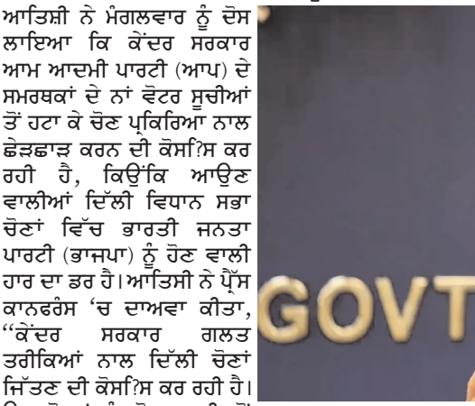
ਮੁੱਖ ਮੰਤਰੀ ਆਤਿਸ਼ੀ ਦਾ ਕੇਂਦਰ ਸਰਕਾਰ 'ਤੇ ਦੋਸ਼

ਵੱਲੋਂ ਤੁਰੰਤ ਕੋਈ ਪ੍ਰਤੀਕਿਰਿਆ ਨਹੀਂ ਆਈ ਹੈ। ਕੇਂਦਰ ਸਰਕਾਰ ਦੀ ਸੀਨੀਅਰ 'ਆਪ' ਆਗੂ ਨੇ ਦਿੱਲੀ ਦੇ ਉਪ ਰਾਜਪਾਲ ਕੀਤਾ। ਆਤਿਸ਼ੀ ਨੇ ਇਹ ਵੀ ਦਾਅਵਾ ਕਿ ਸੱਤ ਵਿਧਾਨ ਸਭਾ ਹਲਕਿਆਂ ਦੀ ਨਿਗਰਾਨੀ ਕਰਨ ਵਾਲੇ ਇੱਕ ਜਲ੍ਹਾ ਮੈਜਿਸਟਰੇਟ (ਡੀਐਮ) ਨੇ ਅਧਿਕਾਰੀਆਂ ਨੂੰ ਸੂਚੀ ਵਿੱਚੋਂ 20,000 ਵੋਟਾਂ ਦੇ ਨਾਮ ਹਟਾਉਣ ਦੇ ਨਿਰਦੇਸ਼ ਦਿੱਤੇ ਸਨ। ਉਨ੍ਹਾਂ ਬੁਝ ਲੱਵਲ ਅਧਿਕਾਰੀਆਂ ਨੂੰ ਅਜਿਹੀਆਂ ਕਾਰਵਾਈਆਂ ਦਾ ਵਿਰੋਧ ਕਰਨ ਦੀ ਅਪੀਲ ਕਰਦਿਆਂ ਉਨ੍ਹਾਂ ਨੂੰ ਕਿਸੇ ਵੀ ਤਰ੍ਹਾਂ ਦਾ ਦਬਾਅ ਨਾ ਬਣਾਉਣ ਦੀ ਅਪੀਲ ਕੀਤੀ। ਉਹਨਾਂ ਨੇ ਕਿਹਾ, "ਜੇ ਕੋਈ ਤਰ੍ਹਾਂ ਵੇਰ ਵੋਟਾਂ ਦੇ ਨਾਮ ਮਿਟਾਉਣ ਲਈ ਮਜਬੂਰ ਕਰਨ ਦੀ ਕੋਸ਼ਿਸ਼ ਕਰਦਾ ਹੈ, ਤਾਂ ਇਸ ਨੂੰ ਰਿਕਾਰਡ ਕਰੋ ਅਤੇ ਮੈਨੂੰ ਭੇਜੋ। ਮੈਂ ਕਾਰਵਾਈ ਕਰਾਂਗੀ। ਭਾਰਤ ਦਾ ਸੰਵਿਧਾਨ ਅੰਜ ਤਰ੍ਹਾਂ ਹੱਥ ਵਿੱਚ ਹੈ।" ਦਿੱਲੀ ਵਿੱਚ ਫਰਵਰੀ 2025 ਵਿੱਚ ਚੋਣਾਂ ਹੋਣੀਆਂ ਹਨ। 'ਆਪ' 2020 'ਚ ਆਪਣੀ ਸਾਨਦਾਰ ਜਿੱਤ ਤੋਂ ਬਾਅਦ ਲਗਾਤਾਰ ਤੀਜੀ ਵਾਰ ਸੱਤਾ 'ਚ ਆਉਣ ਦੀ ਕੋਸ਼ਿਸ਼ ਕਰ ਰਹੀ ਹੈ, ਜਿੱਥੇ ਇਸ ਨੇ 70 'ਚ 62 ਸੀਟਾਂ ਜਿੱਤੀਆਂ ਹਨ।