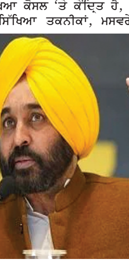
ਪੰਜਾਬ ਸਰਕਾਰ ਵੱਲੋਂ 36 ਪ੍ਰਿੰਸੀਪਲਾਂ ਦਾ ਪਹਿਲਾ ਬੈਚ 5 ਫਰਵਰੀ 2023 ਨੂੰ ਸਿੰਗਾਪੁਰ 'ਚ ਟ੍ਰੇਨਿੰਗ ਲਈ ਭੇਜਿਆ ਗਿਆ ਸੀ।

ਮਾਰਚ 2023 ਨੂੰ ਗਿਆ, ਜਿਸ 'ਚ 30 ਪ੍ਰਿੰਸੀਪਲ ਤੇ ਸਿੱਖਿਆ ਅਧਿਕਾਰੀ ਸ਼ਾਮਲ ਸਨ। ਇਸ ਤੋਂ ਬਾਅਦ 72 ਪ੍ਰਿੰਸੀਪਲਾਂ ਦੇ ਤੀਜੇ ਤੇ ਚੌਥੇ ਬੈਚ ਨੂੰ 24 ਜੁਲਾਈ 2023 ਨੂੰ ਸਿੰਗਾਪੁਰ ਭੇਜਿਆ ਗਿਆ। ਇਸ ਤੋਂ ਬਾਅਦ 23 ਸਤੰਬਰ 2021 ਨੂੰ ਅਧਿਆਪਕਾਂ ਦਾ ਪੰਜਵਾਂ ਤੇ ਛੇਵਾਂ ਬੈਚ ਸਿੰਗਾਪੁਰ ਭੇਜਿਆ ਗਿਆ। ਇਸ ਬੈਚ 'ਚ 72 ਪ੍ਰਿੰਸੀਪਲ ਸ਼ਾਮਲ ਸਨ। ਪ੍ਰਿੰਸੀਪਲਾਂ ਦੇ ਨਾਲ ਮੁੱਖ ਅਧਿਆਪਕਾਂ ਨੂੰ ਵੀ ਟ੍ਰੇਨਿੰਗ ਲਈ ਆਈ. ਐੱਮ. ਅਹਿਮਦਾਬਾਦ ਭੇਜਿਆ ਗਿਆ। 30 ਹੋਰ ਮਾਸਟਰਾਂ ਦਾ ਪਹਿਲਾ ਬੈਚ 31 ਜੁਲਾਈ 2003 ਤੋਂ 4 ਅਗਸਤ 2023 ਤਕ ਟ੍ਰੇਨਿੰਗ ਲਈ ਅਹਿਮਦਾਬਾਦ ਭੇਜਿਆ ਗਿਆ। ਦੂਜਾ ਬੈਚ 28 ਅਗਸਤ 2023 ਤੋਂ ਟ੍ਰੇਨਿੰਗ ਲਈ ਭੇਜਿਆ ਗਿਆ ਸੀ। ਅਜਿਹੇ ਉਪਰਾਲਿਆਂ ਸਦਕਾ ਅਧਿਆਪਕ ਕੌਮਾਂਤਰੀ ਪੱਧਰ ਦੀ ਸਿਖਲਾਈ ਲੈ ਕੇ ਆਉਂਦੇ ਹਨ। ਪੰਜਾਬ ਸਰਕਾਰ ਵੱਲੋਂ 36 ਪ੍ਰਿੰਸੀਪਲਾਂ ਦਾ ਪਹਿਲਾ ਬੈਚ 5 ਫਰਵਰੀ 2023 ਨੂੰ ਸਿੰਗਾਪੁਰ 'ਚ ਟ੍ਰੇਨਿੰਗ ਲਈ ਭੇਜਿਆ ਗਿਆ ਸੀ। ਦੂਜਾ ਬੈਚ 5