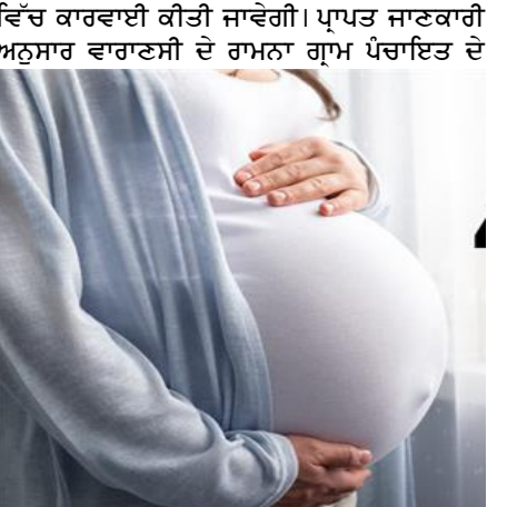
ਮੱਲੂਆ ਪਿੰਡ ਵਿੱਚ ਇਹ ਅਜੀਬ ਮਾਮਲਾ ਸਾਹਮਣੇ ਆਇਆ ਹੈ। ਇੱਥੇ 40 ਲੜਕੀਆਂ ਨੂੰ ਬਾਲ ਵਿਕਾਸ ਮੰਤਰਾਲ ਵੱਲੋਂ ਪੋਸਟ ਯੋਜਨਾ ਤਹਿਤ ਦਿੱਤੀਆਂ ਜਾਣ ਵਾਲੀਆਂ ਸਹੂਲਤਾਂ ਸਬੰਧੀ ਸਨੱਚ ਮਿਲਿਆ। ਇਸ ਸੰਦੇਸ਼ ਵਿੱਚ ਲਿਖਿਆ ਗਿਆ ਸੀ - ਪੋਸਟ ਟਰੈਕਰ