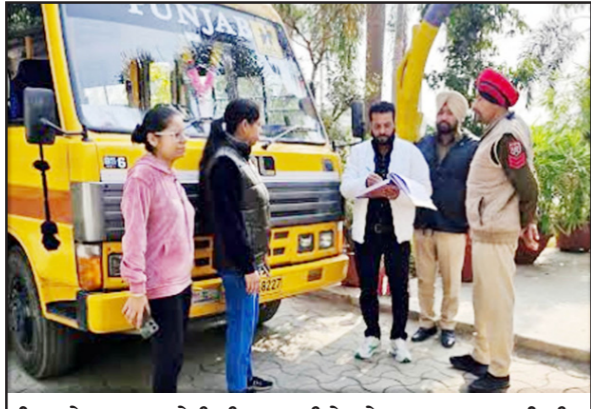
ਜ਼ਿਲ੍ਹਾ ਸੇਕਟਰ ਵਾਹਨ ਕਮੇਟੀ ਦੀ ਅਗਵਾਈ ਹੇਠ ਸੇਕਟਰ ਸਕੂਲ ਵਾਹਨ ਪਾਲਿਸੀ ਤਹਿਤ ਨਿਜੀ ਸਕੂਲਾਂ ਦੇ ਵਾਹਨਾਂ ਦਾ ਨਿਰੀਖਣ ਕਰਦੀ ਹੋਈ ਟੀਮ।