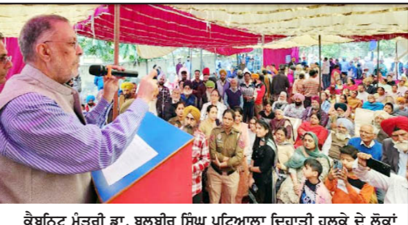
ਕੈਬਨਿਟ ਮੰਤਰੀ ਡਾ. ਬਲਬੀਰ ਸਿੰਘ ਪਟਿਆਲਾ ਦਿਹਾਤੀ ਹਲਕੇ ਦੇ ਲੋਕਾਂ ਦੀਆਂ ਮੁਸ਼ਕਲਾਂ ਸੁਣਦੇ ਹੋਏ।