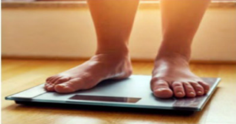
ਅਣਗਹਿਲੀ ਕਰਨ ਨਾਲ ਰੋਜ਼ਾਨਾ ਮੈਟਾਬੋਲਿਜ਼ਮ 'ਚ ਸਰੀਰ 'ਚ ਮੈਟਾਬੋਲਿਜ਼ਮ ਜਾਂ ਮੈਟਾਬੋਲਿਜ਼ਮ

ਇਹੀ ਕਾਰਨ ਹੈ ਕਿ ਹੌਲੀ-ਹੌਲੀ ਸਾਡਾ ਭਾਰ ਵਧਣਾ ਸ਼ੁਰੂ ਹੋ ਜਾਂਦਾ ਹੈ। ਜ਼ਿਆਦਾ ਸੌਣਾ : ਸਰਦੀਆਂ 'ਚ ਦਿਨ ਛੋਟੇ ਅਤੇ ਰਾਤਾਂ ਲੰਬੀਆਂ ਹੁੰਦੀਆਂ ਹਨ, ਜਿਸ ਕਾਰਨ ਅਸੀਂ ਗਰਮੀਆਂ ਦੇ ਮੁਕਾਬਲੇ ਜ਼ਿਆਦਾ ਸਮਾਂ ਸੌਂਦੇ ਹਾਂ। ਸਰੀਰ ਪ੍ਰਤੀ ਇਹ ਜਿਹੀ