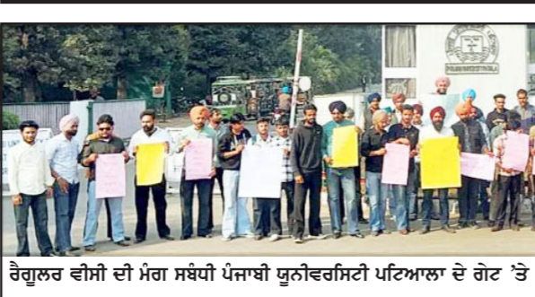
ਰੈਗੂਲਰ ਵੀਸੀ ਦੀ ਮੰਗ ਸਬੰਧੀ ਪੰਜਾਬੀ ਯੂਨੀਵਰਸਿਟੀ ਪਟਿਆਲਾ ਦੇ ਗੇਟ 'ਤੇ ਪ੍ਰਦਰਸ਼ਨ ਕਰਦੇ ਹੋਏ ਸੈਰੀ ਦੇ ਕਾਰਕੁਨ।