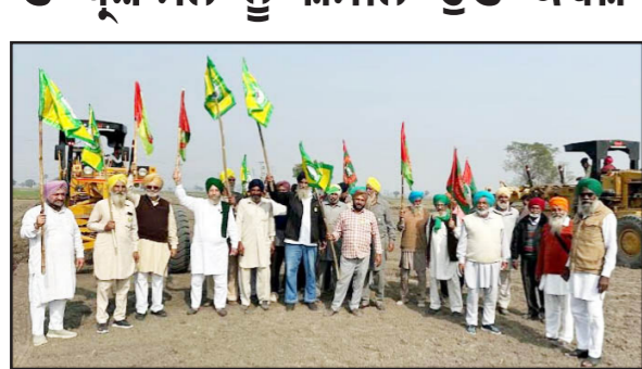
ਪਟਿਆਲਾ, 22 ਨਵੰਬਰ - ਕੌਮੀ ਪਤ੍ਰਿਕਾ ਬਿਊਰੋ-

ਭਾਰਤੀ ਕਿਸਾਨ ਯੂਨੀਅਨ ਕ੍ਰਾਂਤੀਕਾਰੀ ਅਤੇ ਭਾਰਤੀ ਕਿਸਾਨ ਯੂਨੀਅਨ ਏਕਤਾ ਉਗਰਗਾਂ ਤੇ ਸਮੂਹ ਪਿੰਡ ਵਾਸੀਆਂ ਵੱਲੋਂ ਅਧਿਕਾਰੀਆਂ ਤੇ ਪ੍ਰਸ਼ਾਸਨ ਤੇ ਦੋਸ਼ ਲਾਇਆ ਹੈ ਕਿ ਜੇ ਜ਼ਮੀਨ ਕਿਸਾਨਾਂ ਤੋਂ ਖੋਹੀ ਜਾ ਰਹੀ ਹੈ ਉਸ ਦਾ ਬਣਦਾ ਮੁਆਵਜ਼ਾ (ਪੈਂਸ) ਸਰਕਾਰ ਵੱਲੋਂ ਨਹੀਂ ਦਿੱਤੇ ਜਾ ਰਹੇ। ਵੱਖ-ਵੱਖ ਸਬੰਧੀਆਂ ਦੇ ਆਗੂਆਂ ਵੱਲੋਂ