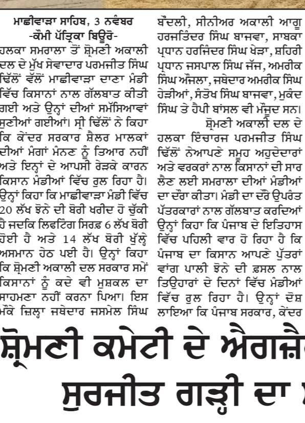
ਮਾਡੀਵਾੜਾ ਸਾਹਿਬ, 3 ਨਵੰਬਰ -ਕੌਮੀ ਪੱਤ੍ਰਕਾ ਬਿਉਰੋ- ਕੇਂਦਰ ਅਤੇ ਸ਼ੈਲਰ ਮਾਲਕਾਂ ਦੇ ਰੇੜਕੇ ਕਾਰਨ ਰੁਲ ਰਹੇ ਨੇ ਕਿਸਾਨ: ਦਿੱਲੋਂ

ਕੇਂਦਰ ਅਤੇ ਸ਼ੈਲਰ ਮਾਲਕਾਂ ਦੇ ਰੇੜਕੇ ਕਾਰਨ ਰੁਲ ਰਹੇ ਨੇ ਕਿਸਾਨ: ਦਿੱਲੋਂ ਮਾਡੀਵਾੜਾ ਸਾਹਿਬ, 3 ਨਵੰਬਰ -ਕੌਮੀ ਪੱਤ੍ਰਕਾ ਬਿਉਰੋ- ਕੇਂਦਰ ਅਤੇ ਸ਼ੈਲਰ ਮਾਲਕਾਂ ਦੇ ਰੇੜਕੇ ਕਾਰਨ ਰੁਲ ਰਹੇ ਨੇ ਕਿਸਾਨ: ਦਿੱਲੋਂ