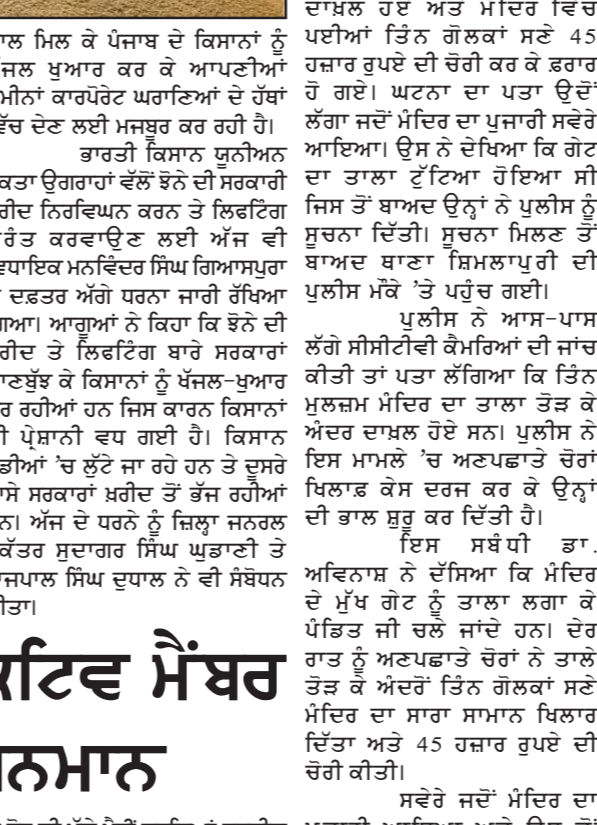
ਲੁਧਿਆਣਾ, 3 ਨਵੰਬਰ -ਕੌਮੀ ਪੱਤ੍ਰਕਾ ਬਿਉਰੋ- ਗੋਲਕਾਂ ਅਤੇ 45 ਹਜ਼ਾਰ ਦੀ ਨਕਦੀ ਚੋਰੀ

ਗੋਲਕਾਂ ਅਤੇ 45 ਹਜ਼ਾਰ ਦੀ ਨਕਦੀ ਚੋਰੀ ਲੁਧਿਆਣਾ, 3 ਨਵੰਬਰ -ਕੌਮੀ ਪੱਤ੍ਰਕਾ ਬਿਉਰੋ- ਗੋਲਕਾਂ ਅਤੇ 45 ਹਜ਼ਾਰ ਦੀ ਨਕਦੀ ਚੋਰੀ