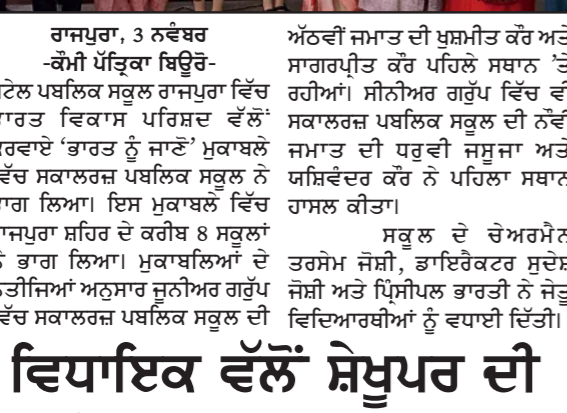
ਰਾਜਪੁਰਾ, 3 ਨਵੰਬਰ -ਕੌਮੀ ਪੱਤ੍ਰਕਾ ਬਿਉਰੋ- ਸਕਾਲਰਸ਼ ਸਕੂਲ ਦੇ ਹੋਣਗਰ ਵਿਦਿਆਰਥੀ ਸਨਮਾਨੇ

ਸਕਾਲਰਸ਼ ਸਕੂਲ ਦੇ ਹੋਣਗਰ ਵਿਦਿਆਰਥੀ ਸਨਮਾਨੇ ਰਾਜਪੁਰਾ, 3 ਨਵੰਬਰ -ਕੌਮੀ ਪੱਤ੍ਰਕਾ ਬਿਉਰੋ- ਸਕਾਲਰਸ਼ ਸਕੂਲ ਦੇ ਹੋਣਗਰ ਵਿਦਿਆਰਥੀ ਸਨਮਾਨੇ