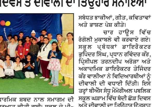
ਲੁਧਿਆਣਾ, 3 ਨਵੰਬਰ -ਕੌਮੀ ਪੱਤ੍ਰਕਾ ਬਿਉਰੋ- ਸਕੂਲਾਂ ਵਿੱਚ ਬੰਦੀ ਫੋੜ ਦਿਵਸ ਤੇ ਦੀਵਾਲੀ ਦਾ ਤਿਉਹਾਰ ਮਨਾਇਆ

ਸਕੂਲਾਂ ਵਿੱਚ ਬੰਦੀ ਫੋੜ ਦਿਵਸ ਤੇ ਦੀਵਾਲੀ ਦਾ ਤਿਉਹਾਰ ਮਨਾਇਆ ਲੁਧਿਆਣਾ, 3 ਨਵੰਬਰ -ਕੌਮੀ ਪੱਤ੍ਰਕਾ ਬਿਉਰੋ- ਸਕੂਲਾਂ ਵਿੱਚ ਬੰਦੀ ਫੋੜ ਦਿਵਸ ਤੇ ਦੀਵਾਲੀ ਦਾ ਤਿਉਹਾਰ ਮਨਾਇਆ