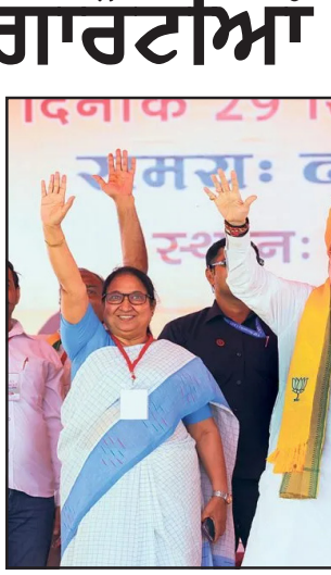
ਨਗੀ ਕਰ ਸਕਦੀ" ਅਤੇ "ਭੜਲ ਇੰਦਣ" ਵਾਲੀ ਸਰਕਾਰ ਹੀ ਹਰਿਆਣਾ ਦਾ ਵਿਕਾਸ ਯਕੀਨੀ ਬਣਾਏਗੀ। ਸ਼ਾਹ ਮੁਤਾਬਕ, "ਮਾਮੀ ਦੇਸ ਦੀ ਸਰਹੱਦ ਨੂੰ ਸੁਰੱਖਿਅਤ ਰੱਖੋ ਅਤੇ ਧਾਰਾ 370 ਨੂੰ ਕੱਢੋ ਤਾਂ ਵੀ ਵਾਪਸ ਨਹੀਂ ਆਉਣ ਦਿੱਤਾ ਜਾਵੇਗਾ।" ਵਕਫ਼ ਬਿੱਲ ਦਾ ਜ਼ਿਕਰ ਕਰਦਿਆਂ ਗੁਰਿ ਮੰਤਰੀ ਨੇ ਰੈਲੀ ਦੌਰਾਨ ਕਿਹਾ, "ਤੁਹਾਨੂੰ ਵਕਫ਼ ਬਿੱਲ ਬਾਰੇ ਮੰਜੂਰਾ ਕਾਨੂੰਨ ਤੋਂ ਸਮੱਸਿਆ ਹੈ। ਅਸੀਂ ਸੋਚਦੇ ਹਾਂ ਕਿ ਕੌਰ ਰੁੱਤ ਸੋਧ 'ਚ ਇਸ ਵਿੱਚ ਸੋਧ ਕਰਾਂਗੇ।" ਚੰਡੀਏੜਾ ਹੈ ਕਿ ਪਿਛਲੇ ਮਹੀਨੇ ਕਈ ਵਿਰੋਧੀ ਆਗੂਆਂ ਨੇ ਦੇਸ਼ ਲਾਇਆ ਸੀ ਕਿ ਭਾਜਪਾ ਦੀ ਅਗਵਾਈ ਵਾਲੀ ਐੱਨਡੀਏ ਸਰਕਾਰ ਦੇ ਵਕਫ਼ ਸੋਧ ਬਿੱਲ ਦਾ ਮਨੋਰਥ ਸਮਾਜ

ਵਿਚ, "ਤੁਹਾਨੂੰ ਵਕਫ਼ ਬਿੱਲ ਬਾਰੇ ਮੰਜੂਰਾ ਕਾਨੂੰਨ ਤੋਂ ਸਮੱਸਿਆ ਹੈ। ਅਸੀਂ ਸੋਚਦੇ ਹਾਂ ਕਿ ਕੌਰ ਰੁੱਤ ਸੋਧ 'ਚ ਇਸ ਵਿੱਚ ਸੋਧ ਕਰਾਂਗੇ।" ਚੰਡੀਏੜਾ ਹੈ ਕਿ ਪਿਛਲੇ ਮਹੀਨੇ ਕਈ ਵਿਰੋਧੀ ਆਗੂਆਂ ਨੇ ਦੇਸ਼ ਲਾਇਆ ਸੀ ਕਿ ਭਾਜਪਾ ਦੀ ਅਗਵਾਈ ਵਾਲੀ ਐੱਨਡੀਏ ਸਰਕਾਰ ਦੇ ਵਕਫ਼ ਸੋਧ ਬਿੱਲ ਦਾ ਮਨੋਰਥ ਸਮਾਜ