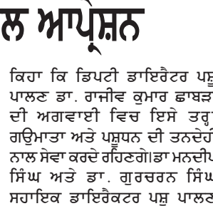
ਵਿੱਚ ਵਧਦੀ ਮੰਗ ਦੇ ਨਾਲ, ਸ਼ੁਰੂਆਤੀ ਰੁਝਾਨ ਆਉਣ ਵਾਲੇ ਤਿਉਹਾਰਾਂ ਦੇ ਸ਼ੀਜ਼ਨ ਦਾ ਸੰਕੇਤ ਦਿੰਦੇ ਹਨ।

ਅੰਮ੍ਰਿਤਸਰ, 3 ਅਕਤੂਬਰ - ਕੌਮੀ ਪੱਤ੍ਰਿਕਾ ਵਿਊਰੋ- ਬਲਿੱਪਕਾਰਟ ਨੇ ਆਪਣੇ ਬਹੁ-ਉੱਡੀਕੇ ਜਾਣ ਵਾਲੇ ਦਾ ਬਿੱਗ ਬਿਲੀਅਨ ਡੇਅਜ਼ (ਟੀਬੀਬੀਡੀ) 2024 ਦੇ 11ਵੇਂ ਐਡੀਸ਼ਨ ਦੀ ਸ਼ੁਰੂਆਤ ਕਰ ਦਿੱਤੀ ਹੈ। ਅਰਲੀ ਸਕੇਸ਼ ਡੇਅ ਆਪਣੇ ਪਹਿਲੇ ਦਿਨ ਕੁੱਲ ਮਿਲਾ ਕੇ 33 ਕਰੋੜ ਤੋਂ ਵੱਧ ਉਤਪਾਦ ਫਿਜ਼ਿਕਲ ਦੇਖਣਾ ਮਿਲੇ ਜੋ ਦੇਸ਼ ਭਰ ਦੇ ਸ਼ਹਿਦਦਾਰਾਂ ਦੇ ਤਿਉਹਾਰੀ ਉਤਸ਼ਾਹ ਨੂੰ ਦਰਸਾਉਂਦਾ ਹੈ। ਮੋਬਾਈਲ, ਫੁੱਡ ਐਂਡ ਨਿਊਟ੍ਰੀਸ਼ਨ ਅਤੇ ਸ਼ਿਗਰ ਸ਼੍ਰੇਣੀ