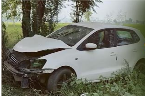
ਬਠਿੰਡਾ 3 ਅਕਤੂਬਰ। ਰਾਮਪੁਰਾ ਫੁਲ ਵਿਚ ਵਾਪਰੇ ਦਰਦਨਾਕ ਹਾਦਸੇ ਵਿਚ ਇਕ ਔਰਤ ਸਣੇ 2 ਲੋਕਾਂ ਦੀ ਮੌਤ ਹੋ ਗਈ ਹੈ। ਇਹ ਦੋਵੇਂ ਮੋਟਰਸਾਈਕਲ 'ਤੇ ਸਵਾਰ ਹੋ ਕੇ ਜਾ ਰਹੇ ਸਨ। ਰਾਹ ਵਿਚ ਇਕ ਤੇਜ਼ ਰਫਤਾਰ ਕਾਰ ਨੇ ਉਨ੍ਹਾਂ ਨੂੰ ਆਪਣੇ ਲਪੇਟ ਵਿਚ ਲੈ ਲਿਆ ਤੇ ਕਈ ਮੀਟਰ ਦੂਰ ਤਕ ਘੜੀਸਦੀ ਲੈ ਗਈ, ਜਿਸ ਵਿਚ ਮੋਟਰ ਸਾਈਕਲ ਸਵਾਰ ਔਰਤ ਤੇ ਵਿਅਕਤੀ ਦੀ ਮੌਤ ਹੋ ਗਈ। ਟੱਕਰ ਮਾਰ ਦ ਦੱਸਿਆ ਜਾ ਰਿਹਾ ਹੈ ਕਿ ਹਾਦਸੇ ਵਿਚ ਮਰਨ ਵਾਲੀ ਔਰਤ ਆਪਣੀ ਗਰਭਵਤੀ ਧੀ ਦਾ ਪਤਾ ਲੈਣ ਜਾ ਰਹੀ ਸੀ, ਪਰ ਰਾਹ ਵਿਚ ਹੀ ਉਸ ਨਾਲ ਇਹ ਹਾਦਸਾ ਵਾਪਰ ਗਿਆ।

ਬਠਿੰਡਾ 3 ਅਕਤੂਬਰ। ਰਾਮਪੁਰਾ ਫੁਲ ਵਿਚ ਵਾਪਰੇ ਦਰਦਨਾਕ ਹਾਦਸੇ ਵਿਚ ਇਕ ਔਰਤ ਸਣੇ 2 ਲੋਕਾਂ ਦੀ ਮੌਤ ਹੋ ਗਈ ਹੈ। ਇਹ ਦੋਵੇਂ ਮੋਟਰਸਾਈਕਲ 'ਤੇ ਸਵਾਰ ਹੋ ਕੇ ਜਾ ਰਹੇ ਸਨ। ਰਾਹ ਵਿਚ ਇਕ ਤੇਜ਼ ਰਫਤਾਰ ਕਾਰ ਨੇ ਉਨ੍ਹਾਂ ਨੂੰ ਆਪਣੇ ਲਪੇਟ ਵਿਚ ਲੈ ਲਿਆ ਤੇ ਕਈ ਮੀਟਰ ਦੂਰ ਤਕ ਘੜੀਸਦੀ ਲੈ ਗਈ, ਜਿਸ ਵਿਚ ਮੋਟਰ ਸਾਈਕਲ ਸਵਾਰ ਔਰਤ ਤੇ ਵਿਅਕਤੀ ਦੀ ਮੌਤ ਹੋ ਗਈ। ਟੱਕਰ ਮਾਰ ਦ ਦੱਸਿਆ ਜਾ ਰਿਹਾ ਹੈ ਕਿ ਹਾਦਸੇ ਵਿਚ ਮਰਨ ਵਾਲੀ ਔਰਤ ਆਪਣੀ ਗਰਭਵਤੀ ਧੀ ਦਾ ਪਤਾ ਲੈਣ ਜਾ ਰਹੀ ਸੀ, ਪਰ ਰਾਹ ਵਿਚ ਹੀ ਉਸ ਨਾਲ ਇਹ ਹਾਦਸਾ ਵਾਪਰ ਗਿਆ। ਜਾਣਕਾਰੀ ਮੁਤਾਬਕ ਰਾਮਪੁਰਾ ਫੁਲ ਵਿਖੇ ਇਕ ਮੋਟਰਸਾਈਕਲ 'ਤੇ ਔਰਤ ਤੇ ਵਿਅਕਤੀ ਜਾ ਰਹੇ ਸਨ। ਭਾਈ ਰੂਪਾ ਰੋਡ 'ਤੇ ਸਾਹਮਣੇ ਤੋਂ ਆ ਰਹੀ ਇਕ ਤੇਜ਼ ਰਫਤਾਰ ਕਾਰ ਨੇ ਉਨ੍ਹਾਂ ਨੂੰ ਆਪਣੀ ਲਪੇਟ ਵਿਚ ਲੈ ਲਿਆ। ਇਸ ਨਾਲ ਮੋਟਰਸਾਈਕਲ ਕਾਰ ਦੇ ਹੇਠਾਂ ਫੱਸ ਗਿਆ ਤੇ ਕਾਰ ਕਈ ਮੀਟਰ ਦੂਰ ਤਕ ਉਸ ਨੂੰ ਘੜੀਸਦੀ ਲੈ ਗਈ। ਇਸ ਹਾਦਸੇ ਵਿਚ ਮੋਟਰਸਾਈਕਲ ਸਵਾਰ ਵਿਅਕਤੀ ਤੇ ਔਰਤ ਦੀ ਦਰਦਨਾਕ ਮੌਤ ਹੋ ਗਈ। ਹਾਦਸੇ ਵਿਚ ਜਿੱਥੇ ਮੋਟਰਸਾਈਕਲ ਦੇ ਪਰਖੇ ਉੱਡ ਗਏ ਉੱਥੇ ਹੀ ਕਾਰ ਦਾ ਅਗਲਾ ਹਿੱਸਾ ਵੀ ਝੁਰੀ ਤਰ੍ਹਾਂ ਨੁਕਸਾਨਿਆ ਗਿਆ ਹੈ। ਕਾਰ ਚਾਲਕ ਵੀ ਗੰਭੀਰ ਰੂਪ ਨਾਲ ਜ਼ਖਮੀ ਹੋ ਗਿਆ ਹੈ। ਘਟਨਾ ਦੀ ਸੂਚਨਾ ਮਿਲਦਿਆਂ ਹੀ ਪੁਲਸ ਪਾਰਟੀ ਤੁਰੰਤ ਮੌਕੇ 'ਤੇ ਪਹੁੰਚੀ ਅਤੇ ਬਚਾਅ ਕਾਰਜ ਅਰੰਭ ਦਿੱਤੇ ਹਨ। ਪੁਲਸ ਵੱਲੋਂ ਮਾਮਲੇ ਦੀ ਜਾਂਚ ਕੀਤੀ ਜਾ ਰਹੀ ਹੈ।