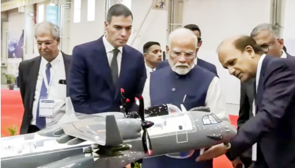
ਏਅਰਬੱਸ ਏਅਰਕ੍ਰਾਫਟ ਅਸੈਂਬਲੀ ਸ਼ੁਰੂ ਕਰਨ ਦੇ ਉਦਘਾਟਨ ਦੌਰਾਨ ਸਪਨ ਦੇ ਪ੍ਰਧਾਨ ਮੰਤਰੀ ਪੰਡਰੇ ਸਾਂਚੇਜ਼ ਨੇ ਪ੍ਰਧਾਨ ਮੰਤਰੀ ਨਰਿੰਦਰ ਮੋਦੀ ਨੂੰ ਸਤਿਕਾਰ ਦਿੱਤਾ।

ਵੱਡੋਰਾ, 29 ਅਕਤੂਬਰ -ਕੌਮੀ ਪੱਤ੍ਰਿਕਾ ਬਿਊਰੋ- ਪ੍ਰਧਾਨ ਮੰਤਰੀ ਨਰਿੰਦਰ ਮੋਦੀ ਨੇ ਟਾਟਾ-ਏਅਰਬੱਸ ਸੀ-295 ਏਅਰਕ੍ਰਾਫਟ ਪਲਾਂਟ ਦੇ ਉਦਘਾਟਨ ਤੋਂ ਬਾਅਦ ਸੋਮਵਾਰ ਨੂੰ ਵੱਡੋਰਾ ਦੇ ਮਸ਼ਹੂਰ ਲਕਸ਼ਮੀ ਵਿਲਾਸ ਪੈਲੇਸ ਦੇ ਦਰਬਾਰ ਹਾਲ ਵਿੱਚ ਸਪਨ ਦੇ ਰਾਸ਼ਟਰਪਤੀ ਪੰਡਰੇ ਸਾਂਚੇਜ਼ ਨਾਲ ਮੁਲਾਕਾਤ ਕੀਤੀ। ਪੰਡਰੇ ਸਾਂਚੇਜ਼ ਨਾਲ ਦੁਵੱਲੀ ਮੁਲਾਕਾਤ ਦੌਰਾਨ ਪ੍ਰਧਾਨ ਮੰਤਰੀ ਨਰਿੰਦਰ ਮੋਦੀ ਨੇ ਉਨ੍ਹਾਂ ਦਾ ਸਵਾਗਤ ਕੀਤਾ। ਸ੍ਰੀ ਮੋਦੀ ਨੇ ਸਾਂਚੇਜ਼ ਨੂੰ ਕਿਹਾ ਕਿ ਮੈਨੂੰ ਬਹੁਤ ਖੁਸ਼ੀ ਹੈ ਕਿ ਮੈਨੂੰ ਦੀਵਾਲੀ ਦੇ ਤਿਉਹਾਰ ਦੌਰਾਨ ਭਾਰਤ ਵਿੱਚ ਤੁਹਾਡਾ ਸੁਆਗਤ ਕਰਨ ਦਾ ਮੌਕਾ ਮਿਲ ਗਿਆ ਹੈ। ਉਨ੍ਹਾਂ ਕਿਹਾ ਕਿ ਦੀਵਾਲੀ ਰੋਜ਼ਨੀ, ਉਤਸ਼ਾਹ, ਏਅਰਬੱਸ ਏਅਰਕ੍ਰਾਫਟ ਅਸੈਂਬਲੀ ਸ਼ੁਰੂ ਕਰਨ ਦੇ ਉਦਘਾਟਨ ਦੌਰਾਨ ਸਪਨ ਦੇ ਪ੍ਰਧਾਨ ਮੰਤਰੀ ਪੰਡਰੇ ਸਾਂਚੇਜ਼ ਨੇ ਪ੍ਰਧਾਨ ਮੰਤਰੀ ਨਰਿੰਦਰ ਮੋਦੀ ਨੂੰ ਸਤਿਕਾਰ ਦਿੱਤਾ।