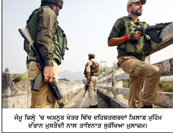
ਜੰਮੂ ਜ਼ਿਲ੍ਹੇ 'ਚ ਅਖ਼ਤੂਰ ਖੇਤਰ ਵਿੱਚ ਦਹਿਸ਼ਤਗਰਦਾਂ ਮਿਲਾਫ਼ ਮੁਹਿੰਮ ਦੌਰਾਨ ਮੁਸ਼ੱਕਤੀ ਨਾਲ ਤਾਇਨਾਤ ਸੁਰੱਖਿਆ ਮੁਲਾਜ਼ਮ।

ਜੰਮੂ, 29 ਅਕਤੂਬਰ -ਕੌਮੀ ਪੱਤ੍ਰਿਕਾ ਬਿਊਰੋ- ਜੰਮੂ-ਕਸ਼ਮੀਰ ਦੇ ਜੰਮੂ ਜ਼ਿਲ੍ਹੇ 'ਚ ਅਖ਼ਤੂਰ ਸੈਕਟਰ ਵਿੱਚ ਸੋਮਵਾਰ ਨੂੰ ਇੱਕ ਫ਼ੌਜੀ ਵਾਹਨ ਉਤੇ ਤਾੜਾ ਲਾ ਕੇ ਹਮਲਾ ਕਰਨ ਦੀ ਕੋਸ਼ਿਸ਼ ਵਿਚ ਸ਼ਾਮਲ ਤਿੰਨ ਦਹਿਸ਼ਤਗਰਦ ਸ਼ਹੀਦ ਕੀਤੇ ਗਏ। ਦੋ ਹੋਰ ਮੁਕਾਬਲੇ ਵਿਚ ਮਾਰੇ ਗਏ ਹਨ। ਇਹ ਜਾਣਕਾਰੀ ਇੱਕ ਸਰਕਾਰੀ ਸੂਤਰਾਂ ਨੇ ਦਿੱਤੀ ਹੈ। ਸੂਤਰਾਂ ਨੇ ਕਿਹਾ, "ਜੰਮੂ ਜ਼ਿਲ੍ਹੇ 'ਚ ਅਖ਼ਤੂਰ ਖੇਤਰ ਦੇ ਬੱਤਲ ਵਿਚ ਇੱਕ ਫ਼ੌਜੀ ਵਾਹਨ ਉਤੇ ਹਮਲਾ ਕਰਨ ਦੀ ਕੋਸ਼ਿਸ਼ ਕਰਨ ਵਾਲੇ ਸਾਰੇ ਤਿੰਨ ਦਹਿਸ਼ਤਗਰਦ ਮਾਰੇ ਗਏ ਹਨ। ਮਾਰੇ ਗਏ ਅੰਤਵਾਦੀਆਂ ਦੀਆਂ ਲਾਸ਼ਾਂ ਘਟਨਾ ਵਾਲੀ ਥਾਂ ਤੋਂ ਬਰਾਮਦ ਕੀਤੀਆਂ ਜਾ ਰਹੀਆਂ ਹਨ ਅਤੇ ਉਨ੍ਹਾਂ ਦੀ ਸਹੀ ਸ਼ਨਾਖ਼ਤ ਦਾ ਪਤਾ ਲਾਸ਼ਾਂ ਮਿਲਣ ਤੋਂ ਬਾਅਦ ਹੀ ਲੱਗ ਸਕੇਗਾ।" ਇਸ ਤੋਂ ਪਹਿਲਾਂ ਅੱਜ ਬੱਤਲ ਇਲਾਕੇ ਵਿਚ ਤਿੰਨ ਦਹਿਸ਼ਤਗਰਦਾਂ ਨੇ ਫ਼ੌਜ ਦੀ ਇੱਕ ਗੱਡੀ ਉਤੇ ਘਾਤ ਲਾ ਕੇ ਹਮਲਾ ਕਰਨ ਦੀ ਕੋਸ਼ਿਸ਼ ਕੀਤੀ, ਜਿਸ ਤੋਂ ਬਾਅਦ ਦੋਵੇਂ ਧਿਰਾਂ ਦਰਮਿਆਨ ਮੁਕਾਬਲਾ ਸ਼ੁਰੂ ਹੋ ਗਿਆ। ਫ਼ੌਜ ਅਤੇ ਪੁਲੀਸ ਸਣੇ ਸੁਰੱਖਿਆ ਦਸਤਿਆਂ ਨੇ ਫ਼ੌਜੀ ਇਲਾਕੇ ਨੂੰ ਚਾਰੇ ਪਾਸਿਉਂ ਘੇਰ ਲਿਆ। ਇਸ