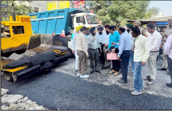
ਲਿਆ ਕੋ ਉਸ ਨੂੰ ਪੀਣਯੋਗ ਬਨਾਉਣ ਲਈ ਪੁੱਜੇਕਰ ਦਾ ਕੰਮ ਜਗੀ ਪੱਧਰ 'ਤੇ ਚੱਲ ਰਿਹਾ ਹੈ। ਇਹ ਪੁੱਜੇਕਰ ਜਲਦੀ ਹੀ ਲੋਕਾਂ ਨੂੰ ਸਮਰਪਿਤ ਹੋ ਜਾਵੇਗਾ। ਇਸ ਪੁੱਜੇਕਰ ਲਈ ਪਾਣੀ ਪਾਉਣ ਵਾਲੇ ਸੜਕ ਐਂਡ ਟੀ ਕੰਪਨੀ ਸੜਕਾਂ ਪੁੱਟੀਆਂ ਸਨ, ਜਿਸ ਨੂੰ ਬਨਾਉਣ ਲਈ ਕੰਮ ਸ਼ੁਰੂ ਹੋ