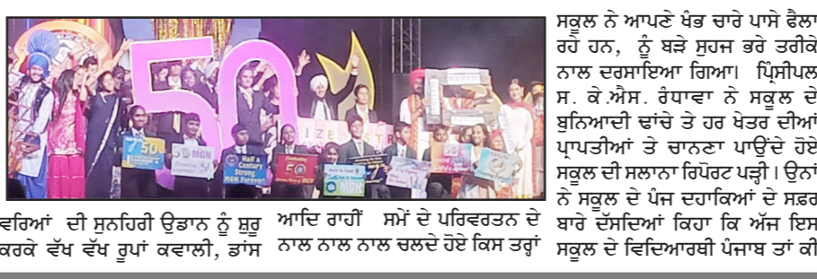
ਵਰਿਮਾਂ ਦੀ ਸਹਿਯੋਗੀ ਉਡਾਨ ਨੂੰ ਸ਼ੁਰੂ ਕਰਕੇ ਵੱਖ ਵੱਖ ਗੁਪਾਂ ਕਵਾਲੀ, ਭਾਂਸ ਆਦਿ ਰਾਹੀਂ ਸਮੇਂ ਦੇ ਪਰਿਵਰਤਨ ਦੇ ਨਾਲ ਨਾਲ ਨਾਲ ਚਲਦੇ ਹੋਏ ਕਿਸ ਤਰ੍ਹਾਂ

ਪੂਰੇ ਭਾਰਤ ਤੇ ਇੱਥੋਂ ਤੱਕ ਕਿ ਦੋਸ਼ਾਂ ਵਿਦੇਸ਼ਾਂ ਵਿੱਚ ਵੀ ਆਪਣਾ ਨਾਂ ਰੋਜ਼ਨ ਕਰ ਰਹੇ ਹਨ। ਇੱਥੇ ਮੁੱਖ ਮਹਿਮਾਨਾਂ ਅਤੇ ਗੈਸਟ ਆਫ ਆਨਰ ਨੇ ਵੱਖ ਵੱਖ ਖੇਤਰਾਂ ਪੜ੍ਹਾਈ, ਖੇਡਾਂ ਆਦਿ ਵਿੱਚ ਮੱਲਾਂ ਮਾਰਨ ਵਾਲੇ ਵਿਦਿਆਰਥੀਆਂ ਨੂੰ ਚਿੰਨ੍ਹਿਤ ਕੀਤਾ ਤੇ ਇਸ ਤਰ੍ਹਾਂ ਅੱਗੇ ਵਧਦੇ ਰਹਿਣ ਦੀ ਪ੍ਰੇਰਨਾ ਦਿੱਤੀ। ਉਨ੍ਹਾਂ ਨੇ ਸਕੂਲ ਨੂੰ ਗੋਲਡਨ ਜੂਬਲੀ ਮਨਾਉਣ ਤੇ ਵਧਾਈ ਦਿੰਦੇ ਹੋਏ ਇਸ ਸਕੂਲ ਵਿੱਚ ਚਿਤਾਏ ਆਪਣੇ ਸਮੇਂ ਦੀਆਂ ਅਭੂੱਲ ਯਾਦਾਂ ਸਾਂਝੀਆਂ ਕਰਦੇ ਹੋਏ ਕਿਹਾ ਕਿ ਇਸ ਸਕੂਲ ਵਿੱਚ ਮੁੱਖ ਮਹਿਮਾਨ ਬਣ ਕੇ ਆਉਣਾ ਉਹਨਾਂ ਲਈ ਬੜੇ ਮਾਨ ਦੀ ਗੱਲ ਹੈ ਅਤੇ ਉਹਨਾਂ ਦੱਸਿਆ ਕਿ ਕਿਸ ਤਰ੍ਹਾਂ ਇਸ ਸਕੂਲ ਵਿਦਿਆਰਥੀਆਂ ਨੂੰ ਹੋਰ ਉੱਚੇ ਸਿੱਖਿਆ ਦੇ ਪੱਧਰ ਤੱਕ ਪਹੁੰਚਾ ਕੇ ਸਾਹਮਣਾ ਕਰਨ ਦੇ ਯੋਗ ਬਣਾਉਂਦੇ ਹੋਏ ਵੱਖ ਵੱਖ ਖੇਤਰਾਂ ਵਿੱਚ ਬੁਲਦੀਆਂ ਤੇ ਪਹੁੰਚਾ ਰਿਹਾ ਹੈ।