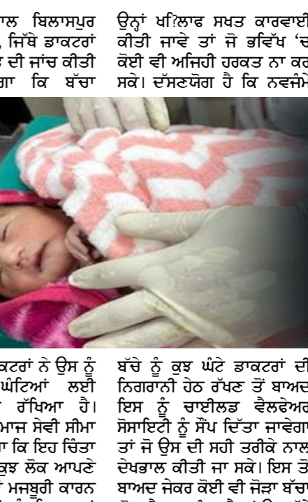
ਉਨ੍ਹਾਂ ਖਿਲਾਫ ਸਖਤ ਕਾਰਵਾਈ ਕੀਤੀ ਜਾਵੇ ਤਾਂ ਜੋ ਭਵਿੱਖ 'ਚ ਕੋਈ ਵੀ ਅਜਿਹੀ ਹਰਕਤ ਨਾ ਕਰ ਸਕੇ। ਦੱਸਣਯੋਗ ਹੈ ਕਿ ਨਵਜੰਮੇ