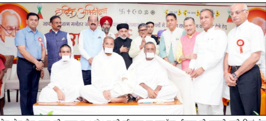
ਐਸ.ਐਸ.ਜੈਨ ਸਭਾ ਦੀ ਸ਼ਲਾਘਾ ਕਰਦਿਆਂ ਰਾਜਪਾਲ ਨੇ ਕਿਹਾ ਕਿ ਇਹ ਇੱਕ ਵਿਲੱਖਣ ਪਹਿਲ ਹੈ, ਜਿਸ ਵਿੱਚ ਵੱਖ-ਵੱਖ ਧਰਮਾਂ, ਪ੍ਰਧਾਨਾਂ ਦੇ ਸੰਤਾਂ-ਮਹਾਂਪੁਰਖਾਂ ਨੇ ਇੱਕ ਮੱਠ 'ਤੇ ਏਕਤਾ ਅਤੇ ਆਪਸੀ ਸਹਿਯੋਗ ਦਾ ਵਫ਼ਾ ਮੁੱਲਾ ਸੰਦੇਸ਼ ਦਿੱਤਾ ਹੈ। ਉਨ੍ਹਾਂ ਕਿਹਾ ਕਿ ਅੱਜ ਦੇ ਇਸ ਸਮਾਗਮ ਤੋਂ ਸਾਨੂੰ ਇਕੱਠੇ ਹੋ ਕੇ ਬਿਹਤਰ ਸਮਾਜ ਦੀ ਸਿਰਜਣਾ ਦੀ ਪ੍ਰੇਰਨਾ ਲੈਣੀ ਚਾਹੀਦੀ ਹੈ। ਦੇਸ਼ ਅਤੇ

ਆਦਰਸ਼ਾਂ ਨੂੰ ਮਜ਼ਬੂਤ ਕਰਨ ਲਈ ਸਰਵ ਪਰਮ ਸੰਗਮ ਦੀ ਮਹੱਤਤਾ ਨੂੰ ਸਮਝਣਾ ਬਹੁਤ ਜ਼ਰੂਰੀ ਹੈ। ਉਨ੍ਹਾਂ ਕਿਹਾ ਕਿ ਇਹ ਇੱਕ ਅਜਿਹਾ ਮੌਕਾ ਹੈ, ਜਿਥੇ ਸਾਰੇ ਧਰਮਾਂ ਦੇ ਲੋਕ ਆਪੋ-ਆਪਣੇ ਵਿਚਾਰ, ਵਿਸ਼ਵਾਸ ਅਤੇ ਆਸਥਾਵਾਂ ਨੂੰ ਨਾਲ ਲੈ ਕੇ ਏਕਤਾ ਅਤੇ ਸਦਭਾਵਨਾ ਨਾਲ ਮਿਲਦੇ ਹਨ। ਜੈਨ ਪਰਮ ਦੀ ਮਹਾਨਤਾ ਦਾ ਜ਼ਿਕਰ ਕਰਦਿਆਂ ਰਾਜਪਾਲ ਨੇ ਕਿਹਾ ਕਿ ਜੈਨ ਪਰਮ ਦੀ ਪੂਰੇ ਵਿਸ਼ਵ ਨੂੰ ਇੱਕ ਮਹਾਨ ਦੇਵਤਾ ਹੈ, ਜਿਸ ਨੇ ਹਮੇਸ਼ਾ ਸ਼ਾਂਤੀ, ਅਹਿੰਸਾ ਅਤੇ ਸਹਿਯੋਗ ਦਾ ਪ੍ਰਚਾਰ-ਪਸਾਰ ਕੀਤਾ। ਉਨ੍ਹਾਂ ਕਿਹਾ ਕਿ ਜੈਨ ਪਰਮ ਮਨੁੱਖ ਦੀ ਭਲਾਈ ਦੇ ਨਾਲ-ਨਾਲ ਧਰਤੀ 'ਤੇ ਮੌਜੂਦ ਹਰ ਪਾਣੀ, ਪੌਦੇ, ਪੰਛੀ ਆਦਿ ਪ੍ਰਤੀ ਅਹਿੰਸਾ, ਪ੍ਰੇਮ ਅਤੇ ਸਨੇਹ ਦੇ ਸੰਦੇਸ਼ ਦਿੰਦਾ ਹੈ। ਵਿਸ਼ੇਸ਼ ਸਮਾਗਮ ਆਯੋਜਿਤ ਕਰਨ ਦੀ ਇਸ ਪਹਿਲਕਦਮੀ ਲਈ