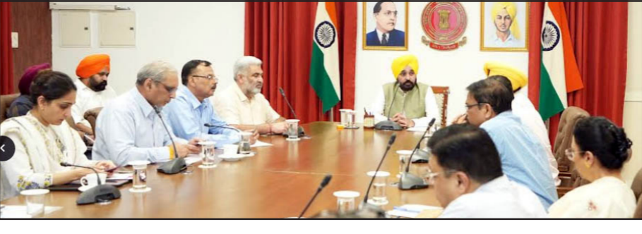
ਚੰਡੀਗੜ੍ਹ, 2 ਅਕਤੂਬਰ -ਕੌਮੀ ਪਤ੍ਰਿਕਾ ਬਿਊਰੋ- ਪੰਜਾਬ ਦੇ ਮੁੱਖ ਮੰਤਰੀ ਭਗਵੰਤ ਸਿੰਘ ਮਾਨ ਨੇ ਅੱਜ ਕਿਹਾ ਕਿ ਸੂਬਾ ਸਰਕਾਰ ਸਾਉਣੀ ਦੇ ਮੰਡੀਕਰਨ ਸੀਜ਼ਨ ਦੌਰਾਨ ਝੋਨੇ ਦੀ ਫ਼ਸਲ ਖਰੀਦਣ ਲਈ ਪੂਰੀ ਤਰ੍ਹਾਂ ਤਿਆਰ ਹੈ।

ਝੋਨੇ ਦੀ ਖਰੀਦ ਲਈ ਪ੍ਰਬੰਧਾਂ ਦਾ ਜਾਇਜ਼ਾ ਲੈਣ ਲਈ ਮੀਟਿੰਗ ਦੀ ਪ੍ਰਧਾਨਗੀ ਕਰਦਿਆਂ ਮੁੱਖ ਮੰਤਰੀ ਨੇ ਕਿਹਾ ਕਿ ਸੂਬਾ ਸਰਕਾਰ ਵੱਲੋਂ ਇਕ ਅਕਤੂਬਰ ਤੋਂ ਸ਼ੁਰੂ ਹੋਣ ਵਾਲੇ ਖਰੀਦ ਸੀਜ਼ਨ ਦੌਰਾਨ ਕਿਸਾਨਾਂ ਵੱਲੋਂ 185 ਲੱਖ ਮੀਟਰਕ ਟਨ ਝੋਨੇ ਮੰਡੀਆਂ ਵਿੱਚ ਲਿਆਂਦੇ ਜਾਣ ਦੀ ਉਮੀਦ ਹੈ। ਉਨ੍ਹਾਂ ਕਿਹਾ ਕਿ ਇਸ ਵਾਰ ਸੂਬੇ ਵਿੱਚ 32 ਲੱਖ ਹੈਕਟੇਅਰ ਰਕਬਾ ਝੋਨੇ ਦੀ ਕਾਸ਼ਤ ਹੋਣ ਹੈ। ਉਨ੍ਹਾਂ ਦੱਸਿਆ ਕਿ ਪੰਜਾਬ ਵਿੱਚ 185 ਲੱਖ ਮੀਟਰਕ ਟਨ ਝੋਨੇ ਦੀ ਖਰੀਦ ਦੀ ਟੀਚਾ ਹੈ। ਭਗਵੰਤ ਸਿੰਘ ਮਾਨ ਨੇ ਕਿਹਾ ਕਿ ਭਾਰਤੀ ਰਿਜ਼ਰਵ ਬੈਂਕ ਵੱਲੋਂ ਸਾਉਣੀ ਮੰਡੀਕਰਨ ਸੀਜ਼ਨ 2024-25 ਲਈ 41,378 ਕਰੋੜ ਰੁਪਏ ਪਹਿਲਾਂ ਹੀ ਜਾਰੀ ਕੀਤੇ ਜਾ ਚੁੱਕੇ ਹਨ। ਮੁੱਖ ਮੰਤਰੀ ਨੇ ਕਿਹਾ ਕਿ ਭਾਰਤ ਸਰਕਾਰ ਨੇ ਇਸ ਸੀਜ਼ਨ ਲਈ 'ਏ'