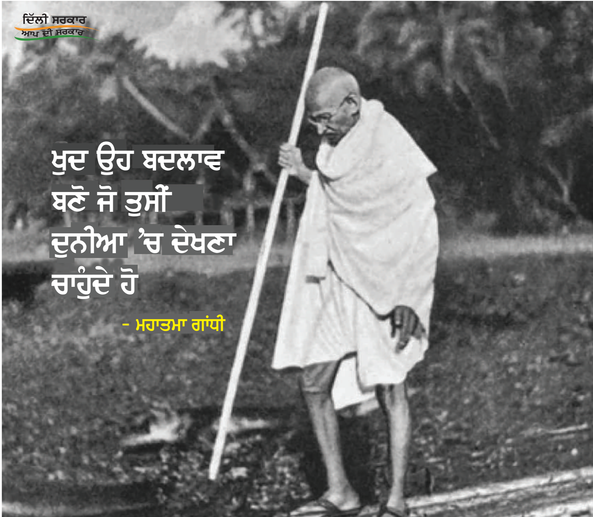
ਦਿੱਲੀ ਸਰਕਾਰ ਆਪ ਦੀ ਸਰਕਾਰ