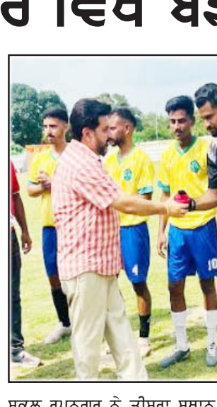
ਸਕੂਲ ਰੂਪਨਗਰ ਨੇ ਤੀਜਾ ਸਥਾਨ ਹਾਸਲ ਕੀਤਾ।

ਖੇਡਾਂ ਵਤਨ ਪੰਜਾਬ ਦੀਆਂ—2024 (ਸੀਜ਼ਨ-3) ਦੇ ਬਲਾਕ ਪੱਟੀ ਮੁਕਾਬਲੇ ਸਥਾਨਕ ਨਹਿਰੂ ਸਟੇਡੀਅਮ ਰੂਪਨਗਰ ਵਿਖੇ ਬੜੀ ਸ਼ਾਨੋਸ਼ੌਕਤ ਨਾਲ ਚਲ ਰਹੇ ਹਨ। ਬਲਾਕ ਪੱਟੀ ਮੁਕਾਬਲੇ ਸ਼ੁਰੂਆਤ ਏਡੀਸੀ ਡਿਵਲਪਮੈਂਟ ਸੋਸਾਇਟੀ ਵੱਲੋਂ ਕੀਤੀ ਗਈ, ਆਇਆ ਮੌਕੇ ਉਨ੍ਹਾਂ ਕਿਹਾ ਕਿ ਇਹ ਖੇਡਾਂ ਨੌਜਵਾਨਾਂ ਨੂੰ ਨਿਸ਼ਚਿਤ ਤੌਰ 'ਤੇ ਦੂਰ ਰੱਖਣ ਤੋਂ ਖਿਡਾਰੀਆਂ ਲਈ ਖੇਡ ਸੱਭਿਆਚਾਰ ਪ੍ਰਦਾ ਕਰਨ ਵਾਸਤੇ ਅਹਿਮ ਭੂਮਿਕਾ ਨਿਭਾਉਣਗੀਆਂ। ਉਨ੍ਹਾਂ ਕਿਹਾ ਕਿ ਆਉਣ ਵਾਲੇ ਸਮੇਂ 'ਚ ਪੰਜਾਬ ਮੁੜ ਕੌਮੀ ਤੇ ਕੌਮਾਂਤਰੀ ਪੱਧਰ 'ਤੇ ਖੇਡਾਂ ਦੇ ਖੇਤਰ ਵਿੱਚ ਚਮਕੇਗਾ।