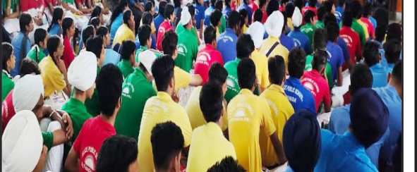
ਧਿਆਨ ਰੱਖਣਾ ਹੈ, ਬਾਰੇ ਵੀ ਸਕੂਲੀ ਵਿਦਿਆਰਥੀਆਂ ਵਿਸਥਾਰਪੂਰਵਕ ਜਾਣਕਾਰੀ ਸਾਂਝੀ ਕੀਤੀ।

ਸਥਾਨਕ ਪੁਲਿਸ ਖਬਰਿਕ ਸਕੂਲ ਵਿਖੇ 9ਵੀਂ ਤੋਂ 12ਵੀਂ ਜਮਾਤ ਤੱਕ ਦੇ ਵਿਦਿਆਰਥੀਆਂ ਲਈ ਕਿਸ਼ੋਰ ਅਵਸਥਾ ਦੇ ਮੱਦੇਨਜ਼ਰ ਵਰਕਸ਼ਾਪ ਦਾ ਆਯੋਜਿਤ ਕੀਤਾ ਗਿਆ। ਇਸ ਮੌਕੇ ਕਿਸ਼ੋਰ ਅਵਸਥਾ ਬਾਰੇ ਵਿਦਿਆਰਥੀਆਂ ਨਾਲ ਵਿਸਥਾਰਪੂਰਵਕ ਜਾਣਕਾਰੀ ਸਾਂਝੀ ਕੀਤੀ ਗਈ।