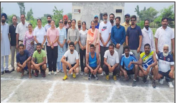
ਸ਼੍ਰੀ ਮੁਕਤਸਰ ਸਾਹਿਬ, 7 ਸਤੰਬਰ -ਕੌਮੀ ਪੱਤ੍ਰਿਕਾ ਬਿਊਰੋ-

ਪੰਜਾਬ ਸਰਕਾਰ, ਖੇਡ ਵਿਭਾਗ ਪੰਜਾਬ ਅਤੇ ਜ਼ਿਲ੍ਹਾ ਪ੍ਰਸ਼ਾਸਨ ਸ਼੍ਰੀ ਮੁਕਤਸਰ ਸਾਹਿਬ ਦੇ ਸਹਿਯੋਗ ਨਾਲ 'ਖੇਡਾਂ ਵਤਨ ਪੰਜਾਬ ਦੀਆਂ' 2024 ਸੀਜ਼ਨ-3 ਤਹਿਤ ਬਲਾਕ ਗਿੱਦੜਬਾਗ ਵਿਖੇ ਬਲਾਕ ਪੱਟੀ ਖੇਡ ਮੁਕਾਬਲੇ ਅੱਜ ਦੂਜੇ ਦਿਨ ਸ਼ਾਨੋਸ਼ੌਕਤ ਨਾਲ ਸਮਾਪਤ ਹੋ ਗਏ ਹਨ, ਇਹ ਜਾਣਕਾਰੀ ਜ਼ਿਲ੍ਹਾ ਖੇਡ ਅਫ਼ਸਰ, ਸ਼੍ਰੀ ਮੁਕਤਸਰ ਸਾਹਿਬ ਸ਼੍ਰੀਮਤੀ ਅਨਿੰਦਰਵੀਰ ਕੌਰ ਨੇ ਦੱਸੀ।