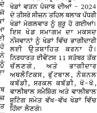
ਲੁਧਿਆਣਾ, 7 ਸਤੰਬਰ - ਕੌਮੀ ਪੱਤ੍ਰਿਕਾ ਬਿਊਰੋ- ਖੇਡਾਂ ਵਤਨ ਪੰਜਾਬ ਦੀਆਂ - 2024 ਦੇ ਤੀਜੇ ਸੀਜ਼ਨ ਤਹਿਤ ਬਲਾਕ ਪੱਧਰੀ ਖੇਡਾਂ ਮੰਗਲਵਾਰ ਨੂੰ ਸ਼ੁਰੂ ਹੋ ਗਈਆਂ। ਇਸ ਖੇਡ ਸਮਾਗਮ ਦਾ ਮਕਸਦ ਨੌਜਵਾਨਾਂ ਨੂੰ ਖੇਡਾਂ ਵਿੱਚ ਭਾਗੀਦਾਰੀ ਲਈ ਉਤਸ਼ਾਹਿਤ ਕਰਨਾ ਹੈ। ਨਿਰਧਾਰਤ ਈਵੈਂਟ 11 ਸਤੰਬਰ ਤੱਕ ਚੱਲਣਗੇ, ਅਤੇ ਭਾਗੀਦਾਰ ਅਥਲੈਟਿਕਸ, ਫੁੱਟਬਾਲ, ਨੈਸ਼ਨਲ ਕਬੱਡੀ, ਸਰਕਲ ਕਬੱਡੀ, ਖੋ-ਖੋ, ਵਾਲੀਬਾਲ ਸਮੇਸ਼ਿਗ ਅਤੇ ਵਾਲੀਬਾਲ ਸੁਟਿੰਗ ਸਮੇਤ ਵੱਖ-ਵੱਖ ਖੇਡਾਂ ਵਿੱਚ ਹਿੱਸਾ ਲੈਣ