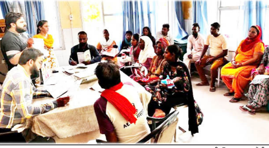
ਸਿਵਲ ਸਰਜਨ ਫਾਜ਼ਿਲਕਾ ਵੱਲੋਂ ਦਸਤ ਹਰੂ ਮੁਹਿੰਮ ਦੀ ਸਿਵਲ ਸਪਤਾਲ ਤੋਂ ਸ਼ੁਰੂਆਤ ਕੀਤੀ ਗਈ।