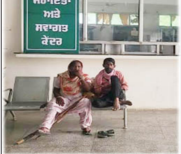
ਮੁੱਖ ਮੰਤਰੀ ਸਹਾਇਤਾ ਅਤੇ ਸਵਾਗਤ ਕੇਂਦਰ ਵਿਖੇ ਮੁੱਖ ਮੰਤਰੀ ਸਹਾਇਤਾ ਅਤੇ ਸਵਾਗਤ ਕੇਂਦਰ ਸਥਾਪਿਤ ਕੀਤਾ ਗਿਆ।