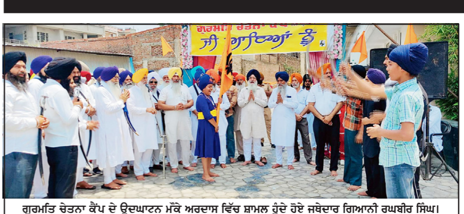
ਗੁਰਮਤਿ ਚੌਤਨਾ ਕੈਂਪ ਦੇ ਉਦਘਾਟਨ ਮੌਕੇ ਅਰਦਾਸ ਵਿੱਚ ਸ਼ਾਮਲ ਹੁੰਦੇ ਹੋਏ ਜਥੇਦਾਰ ਗਿਆਨੀ ਰਘਬੀਰ ਸਿੰਘ।

ਸ੍ਰੀ ਅਨੰਦਪੁਰ ਸਾਹਿਬ, 7 ਜੂਨ - ਕੌਮੀ ਪੱਤ੍ਰਿਕਾ ਬਿਊਰੋ- ਅਕਾਲ ਤਖਤ ਦੇ ਜਥੇਦਾਰ ਗਿਆਨੀ ਰਘਬੀਰ ਸਿੰਘ ਨੇ ਅੱਜ ਇੱਥੇ ਕਿਹਾ ਕਿ ਜੂਨ ਦਾ ਪਹਿਲਾ ਹਫ਼ਤਾ ਸਿੱਖ ਭਾਈਚਾਰੇ ਲਈ ਵਿਸ਼ੇਸ਼ ਮਹੱਤਵ ਰੱਖਦਾ ਹੈ। ਉਨ੍ਹਾਂ ਕਿਹਾ ਕਿ ਭਲਕੇ ਚਾਰ ਜੂਨ ਨੂੰ ਆਉਣ ਵਾਲੇ ਚੋਣ ਨਤੀਜਿਆਂ ਵਿੱਚ ਜੇਤੂ ਉਮੀਦਵਾਰ ਨੂੰ ਸਿੱਖ ਭਾਈਚਾਰੇ ਦੀਆਂ ਇਨ੍ਹਾਂ ਭਾਵਨਾਵਾਂ ਨੂੰ ਧਿਆਨ ਵਿੱਚ ਰੱਖਦਿਆਂ ਜ਼ਬਨ ਨਹੀਂ ਮਨਾਉਣੇ ਚਾਹੀਦੇ। ਉਨ੍ਹਾਂ ਕਿਹਾ ਕਿ 1984 ਵਿੱਚ