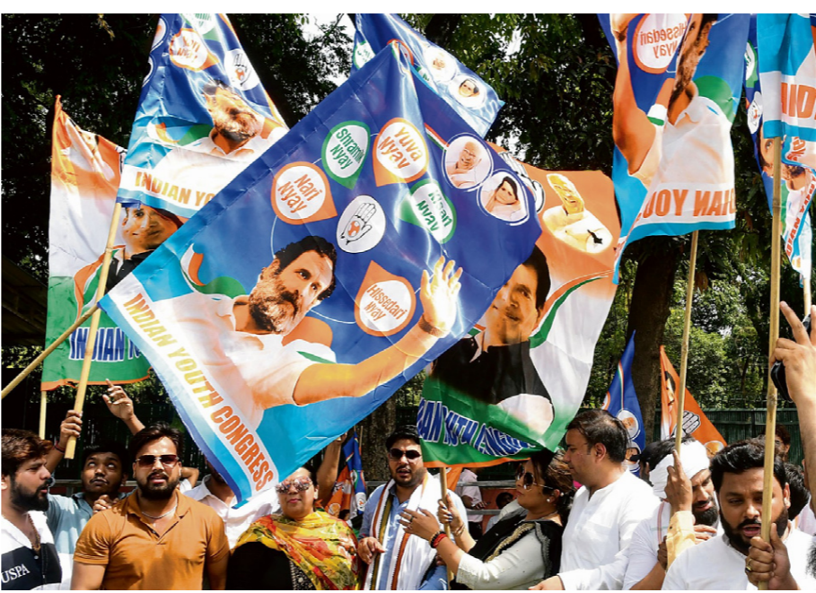
ਪੰਜਾਬ ਵਿੱਚ ਇਨ੍ਹਾਂ ਚੋਣਾਂ ਵਿੱਚ ਕੁਲ ਉਮੀਦਵਾਰਾਂ ਦੀ ਗਿਣਤੀ 329 ਸੀ; 2019 ਵਿੱਚ ਇਹ 266 ਸੀ। ਇਸ ਵਿੱਚ 'ਨੇਤਾ' ਵੀ ਇੱਕ ਉਮੀਦਵਾਰ ਦੇ ਤੌਰ 'ਤੇ ਗਿਣਿਆ ਜਾਂਦਾ ਹੈ। ਪੰਜਾਬ ਦੇ ਇਤਿਹਾਸ ਵਿੱਚ ਇਹ ਪਹਿਲੀ ਵਾਰ ਸੀ ਕਿ ਮੁਕਾਬਲਾ ਚਾਰ ਤੋਂ ਵੱਧ ਧਿਰਾਂ ਵਿਚਕਾਰ ਸੀ ਜਿਨ੍ਹਾਂ ਵਿੱਚ ਸ਼੍ਰੋਮਣੀ ਅਕਾਲੀ ਦਲ, ਭਾਜਪਾ, ਕਾਂਗਰਸ, ਆਮ ਆਦਮੀ ਪਾਰਟੀ, ਬੀਐੱਸਪੀ ਤੇ ਹੋਰ ਪਾਰਟੀਆਂ ਸ਼ਾਮਿਲ ਹਨ। ਇਸ ਤੋਂ ਇਲਾਵਾ ਖੜ੍ਹ ਸਾਹਿਬ ਅਤੇ ਫਰੀਦਕੋਟ ਤੋਂ ਦਾਖ਼ਲ ਉਮੀਦਵਾਰ ਸਨ ਜਿਨ੍ਹਾਂ ਨੂੰ ਗਰਮਿਆਲ ਲੋਕਾਂ ਜਾਂ ਜਥੇਬੰਦੀਆਂ ਦੀ ਹਮਾਇਤ ਪ੍ਰਾਪਤ ਹੈ। ਇਸ ਤਰੀਕੇ ਨਾਲ ਪੰਜਾਬ ਵਿੱਚ ਹੋਣ ਵਾਲੀਆਂ ਚੋਣਾਂ 'ਤੇ ਦੇਸ਼ ਅਤੇ ਦੁਨੀਆ ਭਰ ਦੇ ਲੋਕਾਂ ਦੀ ਨਜ਼ਰ ਰਹੀ। ਇਨ੍ਹਾਂ ਨਤੀਜਿਆਂ ਦਾ ਅਸਰ ਨਾ ਕੇਵਲ ਪੰਜਾਬ ਸਗੋਂ ਦੇਸ਼ ਦੀ ਰਾਜਨੀਤੀ 'ਤੇ ਪਏਗਾ।

ਦੇਸ਼ ਦੀਆਂ 18ਵੀਆਂ ਲੋਕ ਸਭਾ ਚੋਣਾਂ ਸੱਤ ਪੜਾਵਾਂ ਵਿੱਚ 19 ਅਪਰੈਲ ਤੋਂ ਸ਼ੁਰੂ ਹੋ ਕੇ ਪਹਿਲੀ ਜੂਨ ਨੂੰ ਸਮਾਪਤ ਹੋਈਆਂ। ਪੰਜਾਬ ਵਿੱਚ ਵੋਟਾਂ ਸੱਤਵੇਂ ਪੜਾਅ ਦੌਰਾਨ ਪਈਆਂ। ਇਨ੍ਹਾਂ ਚੋਣਾਂ ਵਿੱਚ ਕੇਵਲ 62.80 ਫ਼ੀਸਦੀ ਲੋਕਾਂ ਨੇ ਹਿੱਸਾ ਲਿਆ ਜਿਹੜਾ 2019 ਵਿੱਚ 65.77 ਫ਼ੀਸਦੀ ਅਤੇ 2014 ਵਿੱਚ 70.60 ਫ਼ੀਸਦੀ ਸੀ। ਇਹ ਚੋਣਾਂ ਸਿਵਾਇ ਅਜਨਾਲੇ ਦੇ ਨੇੜੇ ਪਿੰਡ ਵਿੱਚ ਇਕ ਸ਼ਖ਼ਸ ਦੇ ਕਤਲ ਤੋਂ, ਅਜਾ ਤੌਰ 'ਤੇ ਸ਼ਾਂਤੀ ਨਾਲ ਸਮਾਪਤ ਹੋ ਗਈਆਂ। ਮੌਤ ਤੌਰ 'ਤੇ ਇਨ੍ਹਾਂ ਚੋਣਾਂ ਵਿੱਚ ਲੋਕਾਂ ਦਾ ਉਤਸ਼ਾਹ ਕਾਫ਼ੀ ਮੱਠਾ ਰਿਹਾ ਕਿਉਂਕਿ ਰਾਜਨੀਤਕ ਪਾਰਟੀਆਂ ਦਾ ਆਰਾ ਲੋਮ ਸਮੇਂ ਤੋਂ ਲੋਕਾਂ ਦੇ ਚਾਂਚਾਗਤ ਮੁੱਦੇ ਅਣਗੌਲੇ ਕੀਤੇ ਗਏ। ਪੰਜਾਬ ਉਨ੍ਹਾਂ ਰਾਜਾਂ ਵਿੱਚੋਂ ਇੱਕ ਹੈ ਜਿੱਥੇ ਚੋਣਾਂ ਵਿੱਚ ਲੋਕਾਂ ਦੀ ਭਾਗੀਦਾਰੀ ਦੇਸ਼ ਭਰ ਵਿੱਚੋਂ ਔਸ਼ਮਾ ਜ਼ਿ ਆਦਾ ਰਹਿੰਦੀ ਸੀ।