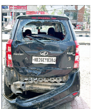
ਜਿਸ ਕਾਰਨ ਉਨ੍ਹਾਂ ਦੀ ਕਾਰ ਦਾ ਪਿਛਲਾ ਸ਼ੀਸ਼ਾ ਅਤੇ ਬੱਚੇ ਟੁੱਟ ਗਿਆ। ਪਰ ਇਸ ਦੌਰਾਨ ਜਾਨੀ ਨੁਕਸਾਨ ਤੋਂ ਬਚਾਅ ਹੋ ਗਿਆ।

ਭੋਰਾ ਬਸੀ, 7 ਜੂਨ - ਕੌਮੀ ਪੱਤ੍ਰਿਕਾ ਬਿਊਰੋ- ਅੰਬਾਲਾ ਚੰਡੀਗੜ੍ਹ ਨੈਸ਼ਨਲ ਹਾਈਵੇਅ ਤੇ ਸਥਿਤ ਸਰਤਾਜ ਹੋਟਲ ਦੇ ਨਜ਼ਦੀਕ ਇੱਕ ਮੋਟਰਸਾਈਕਲ ਸਵਾਰ ਨੇ ਗੱਡੀ ਨੂੰ ਪਿਛੇ ਤੋਂ ਟੱਕਰ ਮਾਰ ਦਿੱਤੀ। ਜਿਸ ਕਾਰਨ ਗੱਡੀ ਦਾ ਸ਼ੀਸ਼ਾ ਅਤੇ ਬੱਚੇ ਟੁੱਟ ਗਿਆ। ਇਸ ਟੱਕਰ ਵਿੱਚ ਮੋਟਰਸਾਈਕਲ ਸਵਾਰ ਜ਼ਖਮੀ ਹੋ ਗਿਆ ਪਰ ਜਾਨੀ ਨੁਕਸਾਨ ਤੋਂ ਬਚਾਅ ਹੋ ਗਿਆ।