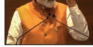
ਨਵੀਂ ਦਿੱਲੀ, 7 ਜੂਨ - ਕੌਮੀ ਪੱਤ੍ਰਿਕਾ ਬਿਊਰੋ- ਅਮਰੀਕਾ 'ਚ IIT ਦੇ ਸਾਬਕਾ ਵਿਦਿਆਰਥੀਆਂ ਦੀ ਇੱਕ ਗੈਰ-ਲਾਭਕਾਰੀ ਸੰਸਥਾ ਦੇ ਮੁਖੀ ਨੇ ਕਿਹਾ ਕਿ ਪ੍ਰਧਾਨ ਮੰਤਰੀ ਨਰੇਂਦਰ ਮੋਦੀ ਆਮ ਆਦਮੀ ਦੀ ਨਜ਼ਰ ਪਛਾਣਦੇ ਹਨ।