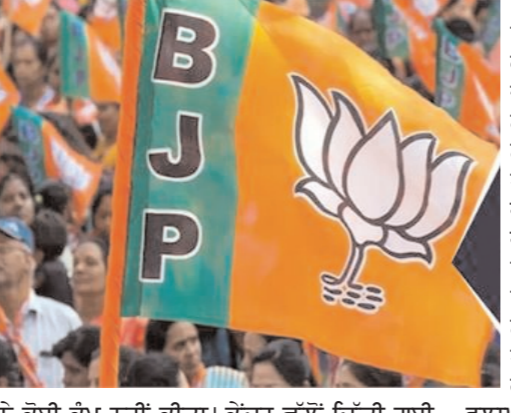
ਨੇ ਕੋਈ ਕੰਮ ਨਹੀਂ ਕੀਤਾ। ਕੇਂਦਰ ਵੱਲੋਂ ਦਿੱਤੀ ਗਈ ਸੁਰੱਖਿਆ ਵਿਵਸਥਾ ਦਾ ਹੀ ਉਹ ਆਨੰਦ ਮਾਣਦੇ ਰਹੇ। ਸੂਤਰਾਂ ਦੇ ਹਵਾਲੇ ਨਾਲ ਇਹ ਖਬਰ ਸਾਹਮਣੇ ਆ ਰਹੀ ਹੈ ਕਿ ਪੰਜਾਬ 'ਚ ਕੇਂਦਰ ਵੱਲੋਂ ਵੱਡੇ ਪੱਧਰ 'ਤੇ ਬਦਲਾਅ ਕਰਨ ਦੀ ਯੋਜਨਾ ਬਣਾਈ ਗਈ ਹੈ, ਜਿਸ ਦੇ ਅਧੀਨ ਸੂਬੇ 'ਚ ਅਹਿਮ ਅਹੁਦਿਆਂ 'ਤੇ ਬੈਠੇ ਕਈ

ਸਾਹਮਣਾ ਕਰਨਾ ਪਿਆ। ਬਾਹਰੋਂ ਜੋ ਆਗੂ ਇੰਪੋਰਟ ਕੀਤੇ ਗਏ, ਉਹ ਵੀ ਸਿਰਫ ਆਪਣੀ ਡਫਲੀ ਹੀ ਵਜਾਉਂਦੇ ਰਹੇ। ਪਾਰਟੀ ਦੀ ਭਲਾਈ ਲਈ ਕਿਸੇ ਆਗੂ ਨੇ ਤਾਵਾਂ ਨੂੰ ਜਿੱਥੇ ਜ਼ਿੰਮੇਵਾਰੀਆਂ ਤੋਂ ਹੱਥ ਧੋਣਾ ਪੈ ਸਕਦਾ ਹੈ, ਉੱਥੇ ਹੀ ਕੁਝ ਨੇਤਾਵਾਂ ਦੀ ਸੁਰੱਖਿਆ ਵਿਵਸਥਾ ਵੀ ਵਾਪਸ ਲਈ ਜਾ ਸਕਦੀ ਹੈ ਕਿਉਂਕਿ ਜਿਸ ਕਾਰਨ ਇਨ੍ਹਾਂ ਨੇਤਾਵਾਂ ਨੂੰ ਜ਼ਿੰਮੇਵਾਰੀਆਂ ਦਿੱਤੀਆਂ ਗਈਆਂ ਸਨ, ਇਹ ਲੋਕ ਉਸ 'ਚ ਕਾਮਯਾਬ ਨਹੀਂ ਹੋਏ। ਜਾਣਕਾਰ ਤਾਂ ਇਹ ਵੀ ਦੱਸ ਰਹੇ ਹਨ ਕਿ ਪਾਰਟੀ ਨੂੰ ਪਹਿਲਾਂ ਹੀ ਪਤਾ ਲੱਗ ਗਿਆ ਸੀ ਕਿ ਪੰਜਾਬ 'ਚ ਹਾਲਤ ਬਿਹਤਰ ਨਹੀਂ ਹਨ, ਇਸ ਲਈ ਪਾਰਟੀ ਪੰਜਾਬ ਨੂੰ ਲੈ ਕੇ ਪਹਿਲਾਂ ਹੀ ਯੋਜਨਾ ਬਣਾ ਚੁੱਕੀ ਹੈ। ਐਕਸਪੈਰੀਮੈਂਟ ਲਈ ਪਾਰਟੀ ਨੇ ਪੰਜਾਬ 'ਚ ਆਪਣੀ ਪੁਰਾਣੀ ਲੀਡਰਸ਼ਿਪ ਅਤੇ ਵਰਕਰ ਨੂੰ ਇਗਨੋਰ ਕਰ ਕੇ ਕਾਂਗਰਸ ਅਤੇ ਪਤਾ ਨਹੀਂ ਕਿਹੜੀਆਂ-ਕਿਹੜੀਆਂ ਪਾਰਟੀਆਂ ਤੋਂ ਆਗੂਆਂ ਨੂੰ ਇੰਪੋਰਟ ਕਰ ਲਿਆ ਸੀ ਪਰ ਜੋ ਸਥਿਤੀ ਅੱਜ ਪਾਰਟੀ ਦੇ ਸਾਹਮਣੇ ਹੈ, ਉਸ ਸਬੰਧੀ ਕਿਤੇ ਵੀ ਦੇ ਰਾਇ ਨਹੀਂ ਕਿ ਭਾਜਪਾ ਦਾ ਇਹ ਐਕਸਪੈਰੀਮੈਂਟ ਫਲਪ੍ਰਸਾਥਿਤ ਹੋਇਆ ਹੈ। ਇਸ ਚੱਕਰ 'ਚ ਪਾਰਟੀ ਨੇ ਆਪਣੇ ਪੁਰਾਣੇ ਵਰਕਰ ਨੂੰ ਵੀ ਅੱਖੋਂ-ਪਰਖੇ ਕਰ ਕਰ ਦਿੱਤਾ, ਜਿਸ ਦੇ ਕਾਰਨ ਪੁਰਾਣਾ ਵਰਕਰ ਘਰ ਬੈਠ ਗਿਆ ਅਤੇ ਉਹ ਜਿਸ ਤਰ੍ਹਾਂ ਦੀ ਲਗਨ ਨਾਲ ਪਹਿਲਾਂ ਕੰਮ ਕਰਦਾ ਸੀ, ਉਸ ਤਰ੍ਹਾਂ ਇਨ੍ਹਾਂ ਚੋਣਾਂ 'ਚ ਕੰਮ ਕਰਦਾ ਨਹੀਂ ਦਿਸਿਆ।