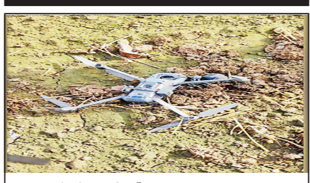
ਪਿੰਡ ਸੰਕਾਤਰਾ ਨੇੜਿਓਂ ਬਰਾਮਦ ਕੀਤਾ ਗਿਆ ਡਰੋਨ।

ਤਰਨ ਤਾਰਨ, 7 ਜੂਨ - ਕੌਮੀ ਪੱਤ੍ਰਿਕਾ ਬਿਊਰੋ- ਸੀਮਾ ਸੁਰੱਖਿਆ ਬਲ (ਬੀਐੱਸਐੱਫ) ਨੇ ਪੰਜਾਬ ਪੁਲੀਸ ਨਾਲ ਸਾਂਝੇ ਆਪ੍ਰੋਜੈਕਟ ਤਹਿਤ ਤਰਨ ਤਾਰਨ ਜ਼ਿਲ੍ਹੇ ਦੇ ਪਿੰਡ ਸੰਕਾਤਰਾ ਨੇੜਿਓਂ ਡਰੋਨ ਬਰਾਮਦ ਕੀਤਾ ਹੈ। ਚੀਨ ਦੇ ਬਣੇ ਇਸ ਡਰੋਨ ਦਾ ਨਾਮ ਡੀਜ਼ੇਲ ਮੋਟਰ 3 ਦੱਸਿਆ ਜਾ ਰਿਹਾ ਹੈ। ਅਧਿਕਾਰਤ ਬਿਆਨ ਅਨੁਸਾਰ ਬੀਐੱਸਐੱਫ ਦੀ ਖੁਫੀਆ ਟੀਮ ਨੇ ਤਰਨ ਤਾਰਨ ਜ਼ਿਲ੍ਹੇ ਦੇ ਸਰਹੱਦੀ ਖੇਤਰ ਵਿੱਚ ਡਰੋਨ ਬਾਰੇ ਜਾਣਕਾਰੀ ਦਿੱਤੀ ਸੀ। ਇਸ ਸੂਚਨਾ 'ਤੇ ਤੁਰੰਤ ਕਾਰਵਾਈ ਕਰਦਿਆਂ ਬੀਐੱਸਐੱਫ ਨੇ ਪੰਜਾਬ ਪੁਲੀਸ ਨਾਲ ਮਿਲ ਕੇ ਤਲਾਸ਼ੀ ਮੁਹਿੰਮ ਚਲਾਈ। ਬਿਆਨ ਅਨੁਸਾਰ, "ਤਲਾਸ਼ੀ ਮੁਹਿੰਮ ਦੌਰਾਨ ਸਰੋਤ 8.20 ਵਜੇ ਜਵਾਨਾਂ ਨੇ ਜ਼ਿਲ੍ਹੇ ਦੇ ਪਿੰਡ ਸੰਕਾਤਰਾ ਨੇੜਿਓਂ ਡਰੋਨ ਬਰਾਮਦ ਕੀਤਾ।"