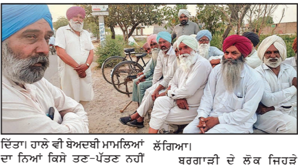
ਦਿੱਤਾ। ਹਾਲੇ ਵੀ ਬੇਅਦਬੀ ਮਾਮਲਿਆਂ ਦਾ ਨਿਆਂ ਕਿਸੇ ਤਣ-ਪੱਤਣ ਨਹੀਂ ਲੱਗਿਆ।

2015 ਨੂੰ ਸ੍ਰੀ ਗੁਰੂ ਗ੍ਰੰਥ ਸਾਹਿਬ ਦੇ ਸਰੂਪ ਚੋਰੀ ਹੋ ਗਈ ਸਨ। ਸ਼੍ਰੋਮਣੀ ਅਕਾਲੀ ਦਲ ਅਤੇ ਭਾਜਪਾ ਗੱਠਜੋੜ ਸਰਕਾਰ ਸਮੇਂ ਬੇਅਦਬੀ ਦੀਆਂ ਘਟਨਾਵਾਂ 'ਚ ਵੀ ਉਹ ਭਾਰਤ ਦਾ ਹੱਥ ਮੰਨਦਾ ਹੈ। ਕੈਨੇਡਾ ਵਲੋਂ ਇਸ ਤਰ੍ਹਾਂ ਦੇ ਦੋਸ਼ਾਂ ਤੋਂ ਬਾਅਦ ਹਾਲੀਆ ਸਮੇਂ 'ਚ ਦੋਹਾਂ ਦੇਸ਼ਾਂ ਦੇ ਰਿਸ਼ਤੇ ਵੀ ਖ਼ਰਾਬ ਹੋਏ ਹਨ। ਕੈਨੇਡਾ ਨੇ ਹਾਲ ਦੇ ਸਮੇਂ 'ਚ ਭਾਰਤ 'ਤੇ ਲਗਾਤਾਰ ਗੰਭੀਰ ਦੋਸ਼ ਲਾਏ ਸਨ, ਖਾਸ ਤੌਰ ਨਾਲ ਹਰਦੀਪ