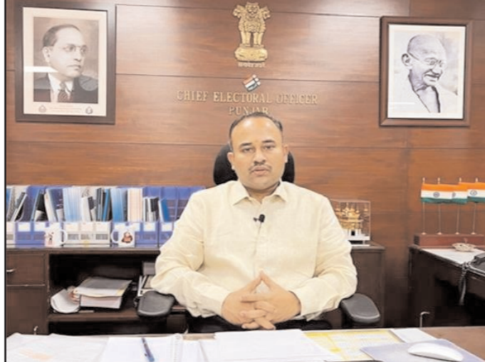
ਉਸਾਰੂ ਤੌਰ 'ਤੇ ਸੁਰੱਖਿਅਤ ਮਾਹੌਲੇ ਯਕੀਨੀ ਬਣਾਉਣ ਲਈ ਪੁਲਿਸ ਕਮਿਸ਼ਨਰਾਂ, ਸੀਨੀਅਰ ਪੁਲਿਸ ਆਫ਼ਿਸਰਾਂ, ਪੰਜਾਬ ਪੁਲਿਸ ਦੇ ਸਮੂਹ ਕਰਮਚਾਰੀਆਂ ਅਤੇ ਕੇਂਦਰੀ ਹਥਿਆਰਬੰਦ ਪੁਲਿਸ