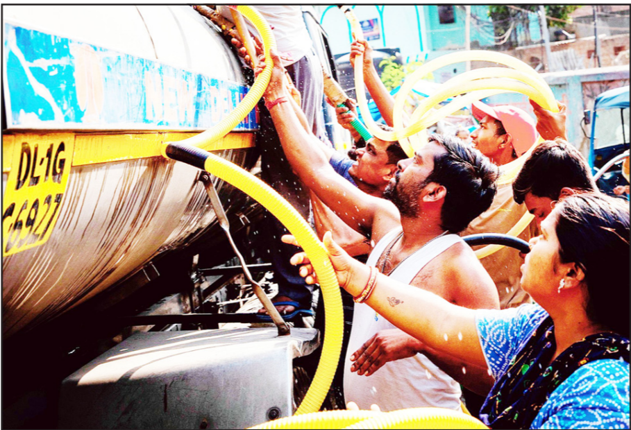
ਆਦਿ ਪੱਤਰਾਂ ਵਿੱਚ ਗਰਮ ਲਹਿਰਾਂ ਦੇ ਦਿਨ 3 ਤੋਂ ਵਧ ਕੇ 8 ਤੋਂ 11 ਤੱਕ ਹੋ ਸਕਦੇ ਹਨ।

ਮੌਸਮ ਵਿਭਾਗ ਨੇ ਮਈ 2024 ਦੀ ਆਪਣੀ ਰਿਪੋਰਟ ਵਿੱਚ ਚਿਤਾਵਨੀ ਪੇਸ਼ ਕੀਤੀ ਹੈ ਕਿ ਹੁਣ ਲੋਕਾਂ ਨੂੰ ਪਹਿਲਾਂ ਨਾਲੋਂ ਵੱਧ ਦਿਨਾਂ ਲਈ ਗਰਮ ਲਹਿਰਾਂ ਦਾ ਸੰਤਾਪ ਝੱਲਣਾ ਪੈ ਸਕਦਾ ਹੈ। ਮਈ ਵਿੱਚ ਆਮ ਤੌਰ ਉੱਤੇ ਉੱਤਰੀ ਸੂਬਿਆਂ ਤਿੰਨ ਦਿਨ ਗਰਮੀ ਦੀ ਲਹਿਰ ਦੀ ਮਾਰ ਝੱਲਦੇ ਸਨ, ਹੁਣ ਉਨ੍ਹਾਂ ਦੀ ਗਿਣਤੀ ਵਧ ਕੇ 5 ਤੋਂ 7 ਦਿਨ ਹੋ ਸਕਦੀ ਹੈ। ਦੱਖਣੀ ਰਾਜਾਂ ਵਿੱਚ ਦੋ ਦਿਨਾਂ ਅਤੇ ਦੱਖਣੀ ਰਾਜਸਥਾਨ, ਪੱਛਮੀ ਮੱਧ ਪ੍ਰਦੇਸ਼, ਵਿਦਰਭ, ਮਹਾਂਨਾਠਾ, ਗੁਜਰਾਤ