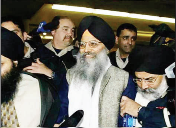
ਨਿੱਜਰ ਦੀ ਹੱਤਿਆ 'ਚ ਕੈਨੇਡਾ ਸਰਕਾਰ ਨੇ ਭਾਰਤ ਸਰਕਾਰ ਦਾ ਹੱਥ ਹੋਣ ਦੀ ਗੱਲ ਕਹੀ ਸੀ ਜਿਸ ਨਾਲ ਦੋਵੇਂ ਦੇਸ਼ਾਂ ਦੇ ਰਿਸ਼ਤੇ 'ਚ ਖਟਾਸ ਪੈਦਾ ਕਰ ਦਿੱਤੀ ਸੀ।

ਨਾਲ ਜੁੜੇ ਕਈ ਲੋਕਾਂ ਨੂੰ ਡਿਊਟੀ ਟੁਟਾਵਾਨ ਪੱਤਰ ਪ੍ਰਾਪਤ ਹੋਏ ਹਨ ਜਿਹੜੇ ਲੋਕਾਂ ਨੂੰ ਉਨ੍ਹਾਂ ਦੀ ਸੁਰੱਖਿਆ ਲਈ ਖਤਰਿਆਂ ਬਾਰੇ ਸੂਚਿਤ ਕਰਦੇ ਹਨ। ਕੈਨੇਡਾ ਪੁਲੀਸ ਵਲੋਂ ਹਾਲ ਹੀ ਦੇ ਦਿਨਾਂ 'ਚ ਬ੍ਰਿਟਿਸ਼ ਕੋਲੰਬੀਆ 'ਚ ਖ਼ਾਲਿਸਤਾਨੀ ਅੰਦੋਲਨ ਨਾਲ ਜੁੜੇ ਕਈ ਲੋਕਾਂ ਨੂੰ ਅਜਿਹੇ ਨੋਟਿਸ ਮਿਲੇ ਹਨ ਜਿਨ੍ਹਾਂ 'ਚ ਉਨ੍ਹਾਂ ਦੀਆਂ ਜਾਨਾਂ ਨੂੰ ਖਤਰਾ ਦੱਸਿਆ ਗਿਆ ਹੈ। ਜੂਨ 2023 'ਚ ਹੋਏ ਪਹਿਲਾਂ ਤੋਂ ਪਹਿਲਾਂ ਨਿੱਜਰ ਨੂੰ ਵੀ ਇੱਕ ਅਜਿਹਾ ਪੱਤਰ ਭੇਜਿਆ ਗਿਆ ਸੀ।