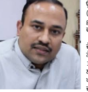
ਸਿਬਿਨ ਸੀ ਨੇ ਦੱਸਿਆ ਕਿ 10 ਮਈ 2024 ਤੋਂ 14 ਮਈ, 2024 ਤੱਕ ਜਨਤਕ ਛੁੱਟੀ ਤੋਂ ਇਲਾਵਾ ਬਾਕੀ ਸਾਰੇ ਨਿਰਧਾਰਤ ਦਿਨਾਂ ਦੌਰਾਨ ਹਲਕਿਆਂ ਦੇ ਡਿਪਟੀ ਕਮਿਸ਼ਨਰਾਂ-ਕਮ-ਰਿਟਰਨਿੰਗ ਅਫਸਰਾਂ ਕੋਲ ਸਵੇਰੇ 11.00 ਵਜੇ ਤੋਂ ਸ਼ਾਮ 3.00 ਵਜੇ ਤੱਕ ਨਾਮਜ਼ਦਗੀ ਪੱਤਰ ਦਾਖਲ ਕੀਤੇ ਜਾ ਸਕਦੇ ਹਨ। ਚੋਣਯੋਗ ਹੈ ਕਿ ਨਾਮਜ਼ਦਗੀ ਪੱਤਰ ਫਾਰਮ 21 ਵਿੱਚ ਭਰੇ ਜਾਣੇ ਹਨ। ਸ਼ਿਕਰਯੋਗ ਹੈ ਕਿ ਖਾਲੀ ਫਾਰਮ ਜ਼ਬਤ ਰਿਟਰਨਿੰਗ ਅਫਸਰ-ਕਮ-ਡਿਪਟੀ ਕਮਿਸ਼ਨਰ ਕੋਲ ਉਪਲਬਧ ਹਨ। ਟਾਈਪ ਕੀਤੇ ਨਾਮਜ਼ਦਗੀ ਪੱਤਰ

ਚੰਡੀਗੜ੍ਹ, 10 ਮਈ - ਕੌਮੀ ਪੱਤ੍ਰਿਕਾ ਬਿਊਰੋ- ਪੰਜਾਬ ਦੇ ਮੁੱਖ ਚੋਣ ਅਧਿਕਾਰੀ ਸਿਬਿਨ ਸੀ ਨੇ ਲੋਕ ਸਭਾ ਚੋਣਾਂ 2024 ਦੇ ਮੌਦੇ ਨਜ਼ਰ ਸੂਬੇ ਲਈ ਚੋਣ ਪ੍ਰੋਗਰਾਮ ਦਾ ਐਲਾਨ ਕਰ ਦਿੱਤਾ ਹੈ। ਵਧੇਰੇ ਜਾਣਕਾਰੀ ਲਈ ਸਿਬਿਨ ਸੀ ਨੇ ਦੱਸਿਆ ਕਿ ਚੋਣਾਂ ਲਈ ਗਜ਼ਟ ਨੋਟੀਫਿਕੇਸ਼ਨ 10 ਮਈ, 2024 ਨੂੰ ਜਾਰੀ ਹੋਵੇਗਾ। ਉਨ੍ਹਾਂ ਦੱਸਿਆ ਕਿ ਨਾਮਜ਼ਦਗੀਆਂ ਭਰਨ ਦੀ ਆਖਰੀ ਮਿਤੀ 14 ਮਈ, 2024 (ਮੰਗਲਵਾਰ) ਹੈ ਅਤੇ ਨਾਮਜ਼ਦਗੀਆਂ ਦੀ ਪੜਤਾਲ 15 ਮਈ (ਬੁੱਧਵਾਰ) ਨੂੰ ਹੋਵੇਗੀ। ਉਨ੍ਹਾਂ ਦੱਸਿਆ ਕਿ ਉਮੀਦਵਾਰ 110 ਮਈ, 2024 (ਸ਼ੁੱਕਰਵਾਰ) ਤੱਕ ਆਪਣੀਆਂ ਨਾਮਜ਼ਦਗੀਆਂ ਵਾਪਸ ਲੈ ਸਕਦੇ ਹਨ। ਉਨ੍ਹਾਂ ਅੱਗੇ ਦੱਸਿਆ ਕਿ ਪੰਜਾਬ ਵਿੱਚ 1 ਜੂਨ, 2024 (ਸ਼ਨੀਵਾਰ) ਨੂੰ ਵੋਟਾਂ ਪੈਣਗੀਆਂ ਅਤੇ ਪੰਜਾਬ ਸਮੇਤ ਦੇਸ਼ ਵਿੱਚ ਪਈਆਂ ਵੋਟਾਂ ਦੀ ਗਿਣਤੀ 4 ਜੂਨ, 2024 (ਮੰਗਲਵਾਰ) ਨੂੰ ਕੀਤੀ ਜਾਵੇਗੀ। ਚੋਣਾਂ ਦੇ ਮੁਕੰਮਲ ਹੋਣ ਦੀ ਆਖਰੀ ਮਿਤੀ 6 ਜੂਨ, 2024 (ਵੀਰਵਾਰ) ਹੈ। ਉਨ੍ਹਾਂ ਦੱਸਿਆ ਕਿ ਵੋਟਾਂ ਪੈਣ ਦਾ ਸਮਾਂ ਸਵੇਰੇ 7 ਵਜੇ ਤੋਂ ਸ਼ਾਮ 6 ਵਜੇ ਤੱਕ ਹੋਵੇਗਾ।