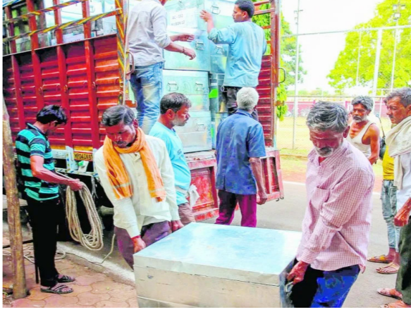
ਪ੍ਰਦੇਸ਼ ਦਾਦਰਾ ਤੇ ਨਗਰ ਹਵੇਲੀ ਅਤੇ ਵੋਟਾਂ ਤੀਜੇ ਗੇੜ ਦੌਰਾਨ 7 ਮਈ ਨੂੰ ਹੀ ਚਲਣ ਦੇ ਦੀਉ (ਦੋ ਸੀਟਾਂ) ਲਈ ਵੀ ਪੈਣਗੀਆਂ। ਕੁਝ ਕਾਰਨਾਂ ਕਰਕੇ

ਮਹਿਲਾਵਾਂ ਸਮੇਤ ਕੁੱਲ 1300 ਉਮੀਦਵਾਰ ਚੋਣ ਮੈਦਾਨ ਵਿੱਚ ਹਨ। ਤੀਜੇ ਗੇੜ ਦੀਆਂ ਵੋਟਾਂ ਦੌਰਾਨ ਕੇਂਦਰੀ ਗੁਰਿ ਮੰਤਰੀ ਅਮਿਤ ਸ਼ਾਹ (ਗਾਂਧੀਨਗਰ), ਜਯੋਤਿਰਾਜਿੰਦਰ ਸਿੰਘ (ਗੁਨਾ), ਮਨਸੂਖ ਮਾਡਵੀਆ (ਪੁੰਚਰ), ਪੁਸ਼ਪਤਮ ਭੁਪਾਲਾ (ਰਾਜਕੋਟ), ਪ੍ਰਹਿਲਾਦ ਜੋਸ਼ੀ (ਧਾਰਵਾੜ), ਅੰਸੂਪੀ ਸਿੰਘ ਬਘੇਲ (ਆਗਰਾ), ਮੱਧ ਪ੍ਰਦੇਸ਼ ਦੇ ਸਾਬਕਾ ਮੁੱਖ ਮੰਤਰੀਆਂ ਸ਼ਿਵਰਾਜ ਸਿੰਘ ਚੰਗਾਨ (ਵਿਦੀਸ਼ਾ) ਤੇ ਦਿਗਵਿਜੇ ਸਿੰਘ (ਰਾਜਗੜ੍ਹ), ਕਰਨਾਟਕ ਦੇ ਮੁੱਖ ਮੰਤਰੀ ਬਸਵਰਾਜ ਬੋਮਈ (ਹਾਵੇਰੀ) ਅਤੇ ਬਦਰੁਦੀਨ ਅਜਮਲ (ਧੁਬਰੀ) ਜਿਹੇ ਵੱਡੇ ਆਗੂਆਂ ਦੀ ਕਿਸਮਤ ਦਾ ਵੀ ਫ਼ੈਸਲਾ ਹੋਵੇਗਾ। ਇਸ ਦੌਰਾਨ ਗੁਜਰਾਤ ਦੀਆਂ 25, ਮਹਾਰਾਸ਼ਟਰ ਦੀਆਂ 11, ਉੱਤਰ ਪ੍ਰਦੇਸ਼ ਦੀਆਂ 10, ਕਰਨਾਟਕ ਦੀਆਂ ਬਾਕੀ ਰਹਿੰਦੀਆਂ 14, ਛੱਤੀਸਗੜ ਦੀਆਂ 7, ਮੱਧ ਪ੍ਰਦੇਸ਼ ਦੀਆਂ 8, ਬਿਹਾਰ ਦੀਆਂ 4, ਅਸਾਮ ਤੇ ਪੱਛਮੀ ਬੰਗਾਲ ਦੀਆਂ 4-4 ਅਤੇ ਗੋਆ ਦੀਆਂ ਦੋ ਸੀਟਾਂ ਲਈ ਵੋਟਾਂ ਪੈਣਗੀਆਂ। ਕੇਂਦਰ ਸ਼ਾਸਿਤ