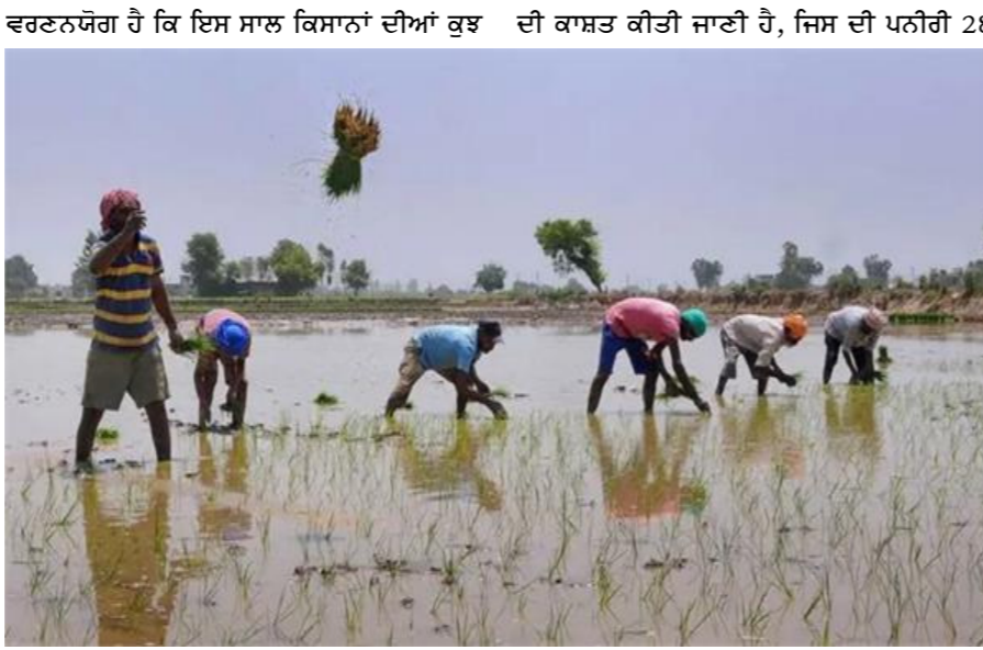
ਵਰਣਨਯੋਗ ਹੈ ਕਿ ਇਸ ਸਾਲ ਕਿਸਾਨਾਂ ਦੀਆਂ ਕੁਝ ਦੀ ਕਾਸ਼ਤ ਕੀਤੀ ਜਾਣੀ ਹੈ, ਜਿਸ ਦੀ ਪਨੀਰੀ 28 ਮਈ ਤੋਂ ਬਾਅਦ ਕਿਸਾਨਾਂ ਵੱਲੋਂ ਕੀਤੀ ਜਾਣੀ ਹੈ। ਕਿਸਾਨਾਂ ਨੂੰ ਬਹੁਤ ਚੰਗੀ ਤਰ੍ਹਾਂ ਸਮਝ ਆ ਗਈ ਹੈ ਕਿ ਦੇਖਾ ਦੇਖੀ ਅਗੇਤਾ ਝੋਨਾ ਲਾਉਣ ਦੀ ਬਿਜਾਏ ਹਰੇਕ

ਗੁਰਦਾਸਪੁਰ 28 ਮਈ। ਪੰਜਾਬ 'ਚ 11 ਅਤੇ 15 ਜੂਨ ਤੋਂ ਝੋਨੇ ਦੀ ਅਧਿਕਾਰਤ ਤੌਰ 'ਤੇ ਲਵਾਈ ਸ਼ੁਰੂ ਹੋ ਜਾਵੇਗੀ ਪਰ ਪੰਜਾਬ ਵਿੱਚ ਏਨੀ ਦਿਨੀਂ ਪੈ ਰਹੀ ਅੱਤ ਦੀ ਗਰਮੀ ਕਾਰਨ ਪੰਜਾਬ ਖੇਤੀਬਾੜੀ ਯੂਨੀਵਰਸਿਟੀ ਨੇ ਸਲਾਹ ਦਿੱਤੀ ਹੈ ਕਿ ਕਿਸਾਨਾਂ ਵੱਲੋਂ ਝੋਨਾ ਜਿਨ੍ਹਾਂ ਵੀ ਲੇਟ ਲਗਾਇਆ ਜਾ ਸਕਦਾ ਹੈ, ਉਨ੍ਹਾਂ ਹੀ ਲੇਟ ਲਗਾਉਣ, ਕਿਉਂਕਿ ਅੱਤ ਦੀ ਗਰਮੀ 'ਚ ਲਗਾਇਆ ਝੋਨਾ ਪੁੱਧ ਦੀ ਤਰ੍ਹਾਂ ਤਪਸ਼ ਨਾਲ ਝੁਲਸ ਜਾਂਦਾ ਹੈ ਅਤੇ ਕਿਸਾਨ ਦਾ ਵਿੱਤੀ ਨੁਕਸਾਨ ਵੀ ਹੁੰਦਾ ਹੈ। ਖੇਤੀਬਾੜੀ ਵਿਭਾਗ ਅਨੁਸਾਰ ਇਸ ਸਮੇਂ ਪੈ ਰਹੀ ਅੱਤ ਦੀ ਗਰਮੀ ਦੇ ਮੱਦੇਨਜ਼ਰ ਪੰਜਾਬ 'ਚ ਝੋਨੇ ਦੀ ਫਸਲ ਵਿੱਚ ਪਾਣੀ ਦੀ ਸੰਕੋਚਵੀਂ ਵਰਤੋਂ ਕੀਤੀ ਜਾਣੀ ਚਾਹੀਦੀ ਹੈ। ਹੋ ਸਕੇ ਤਾਂ ਮੌਨਸੂਨ ਦੀ ਪਹਿਲੀ ਵਰਖਾ ਨਾਲ ਹਵਾ ਵਿੱਚ ਨਮੀ ਵੱਧ ਅਤੇ ਤਾਪਮਾਨ ਘੱਟ ਹੋਣ 'ਤੇ ਹੀ ਝੋਨੇ ਦੀ ਲਵਾਈ ਸ਼ੁਰੂ ਕੀਤੀ ਜਾਵੇ। 2009 ਵਿੱਚ ਅਗੇਤੋਂ ਝੋਨੇ ਦੀ ਲਵਾਈ 'ਤੇ ਲੱਗੀ ਰੋਕ ਕਾਰਨ ਸ਼ੁਰੂ 'ਚ ਕੁਝ ਮੁਸ਼ਕਲਾਂ ਦਾ ਸਾਹਮਣਾ ਤਾਂ ਕਰਨਾ ਪਿਆ ਪਰ ਪੰਜਾਬ ਨੂੰ ਇਸ ਦਾ ਵੱਡੀ ਪੱਧਰ 'ਤੇ ਫਾਇਦਾ ਹੋਇਆ ਹੈ। ਇਸ ਨਾਲ ਜਿੱਥੇ ਜ਼ਮੀਨ ਹੇਠਲੇ ਪਾਣੀ ਦੇ ਹੇਠਾਂ ਜਾਣ ਦੀ ਰਫਤਾਰ ਘੱਟ ਕਰਨ ਵਿੱਚ ਮਦਦ ਮਿਲੀ, ਉੱਥੇ ਕੀੜੇ ਮਕੋੜਿਆਂ ਖਾਸ ਕਰ ਕੇ ਤਣੇ ਦੇ ਗੁੜ੍ਹੇ ਦਾ ਹਮਲਾ ਘੱਟ ਘੱਟ ਕਰਨ ਵਿੱਚ ਮਦਦ ਮਿਲੀ ਹੈ।