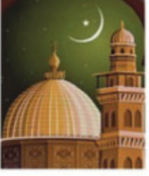
ਗੁਰੂ ਮਹੀਨਿਆਂ ਵਿਚ ਕੀਤੀ ਇਬਾਦਤ ਤੋਂ ਰੰਗੀ ਹੈ। ਇਸ ਦੇ ਰੋਜ਼ਿਆਂ ਨੂੰ ਰੋਜ਼ੇ ਤੇ ਤੁਹਾਡੇ 'ਤੇ ਫਰਜ਼ ਕੀਤਾ ਹੈ ਅਤੇ ਤਾਵ ਤੇ ਗੋਸ਼ਿਆਂ ਤਾਵ ਤਰਾਬੀ ਦੀ ਨਮਾਜ਼ ਨੂੰ ਤੁਹਾਡੇ ਲਈ ਸਵਾਬ (ਪੁੰਨ) ਦੀ ਚੀਜ਼ ਬਣਾਇਆ ਹੈ। ਕੋਈ ਵੀ ਮਨੁੱਖ ਜੋ ਇਸ

ਮਹੀਨੇ ਵਿਚ ਚੰਗਾ ਕੰਮ ਕਰੋਗਾ ਉਸ ਨੂੰ ਫਰਜ਼ ਅਦਾ ਕਰਨ ਦੇ ਬਰਾਬਰ ਸਵਾਬ ਦਿੱਤਾ ਜਾਵੇਗਾ ਤੇ ਜੋ ਫਰਜ਼ ਅਦਾ ਕਰੇਗਾ ਉਸ ਨੂੰ 70 ਫਰਜ਼ ਅਦਾ ਕਰਨ ਦੇ ਬਰਾਬਰ ਸਵਾਬ ਦਿੱਤਾ ਜਾਵੇਗਾ। ਇਹ ਸਭਰ ਦਾ ਮਹੀਨਾ ਹੈ ਤੇ ਮੁਹੰਮਦ (ਸਲ.) ਦੇ ਅਨੁਸਾਰ ਸਭਰ ਦਾ ਬਦਲਾ ਜੰਨਤ (ਸਵਰਗ) ਹੈ। ਇਹ ਗਰੀਬ, ਯਤੀਮਾਂ, ਵਿਧਵਾਵਾਂ ਆਦਿ ਨਾਲ ਲੜਾਈ ਅਤੇ ਹਮਦਰਦੀ ਕਰਨ ਦਾ ਮਹੀਨਾ ਹੈ। ਇਸ ਮਹੀਨੇ ਵਿਚ ਜਿਸ ਵਿਅਕਤੀ ਉਪਰ ਜ਼ਕਾਤ ਫਰਜ਼ ਹੈ ਉਸ ਨੂੰ ਆਪਣੀ ਆਮਦਨ/ਮਾਲ ਵਿੱਚੋਂ 40 ਵਾਂ ਹਿੱਸਾ ਲੋੜਵੰਦਾਂ ਨੂੰ ਦਾਨ ਕਰਨ ਦਾ ਹੁਕਮ ਦਿੱਤਾ ਗਿਆ ਹੈ। ਇਸ ਮਹੀਨੇ ਦੇ ਪਹਿਲੇ ਹਿੱਸੇ ਨੂੰ ਰਹਿਮਤ ਦਾ, ਦੂਜੇ ਹਿੱਸੇ ਨੂੰ ਮਰਗਿਬਤ ਦਾ ਅਤੇ ਤੀਸਰੇ ਹਿੱਸੇ ਨੂੰ ਜਹੰਨਮ/ਨਕਤ ਤੋਂ ਛੁਟਕਾਰੇ ਦਾ ਕਿਹਾ ਗਿਆ ਹੈ। ਇਸ ਮਹੀਨੇ ਵਿਚ ਨੌਕਰਾਂ ਦੇ ਕੰਮ ਨੂੰ ਖੱਟ ਕਰਨ ਦਾ ਹੁਕਮ ਦਿੱਤਾ ਗਿਆ ਹੈ। ਮੁਹੰਮਦ (ਸਲ.) ਨੇ ਕਿਹਾ "ਜੇ ਵਿਅਕਤੀ ਆਪਣੇ ਰੋਜ਼ੇ ਨੂੰ ਸ਼ੁਰੂ ਕਰਨ ਲਈ ਕਿਸੇ ਬੇਬੇਦਾਰ ਦਾ ਰੋਜ਼ਾ ਇਤਤਾਰ ਕਰਵਾਏਗਾ ਅੱਖੂ ਉਸ ਨੂੰ ਵੀ ਰੋਜ਼ਾ ਰੱਖਣ ਵਾਲੇ ਦੇ ਬਰਾਬਰ ਦਾ ਸਵਾਬ ਦੇਵੇਗਾ ਜਦੋਂ ਕਿ ਰੋਜ਼ਾ ਰੱਖਣ ਵਾਲੇ ਦੇ ਸਵਾਬ ਵਿਚ ਕਿਸੇ ਤਰ੍ਹਾਂ ਦੀ ਕੋਈ ਨੀਕੀ ਕੀਤੀ ਜਾਵੇਗੀ।